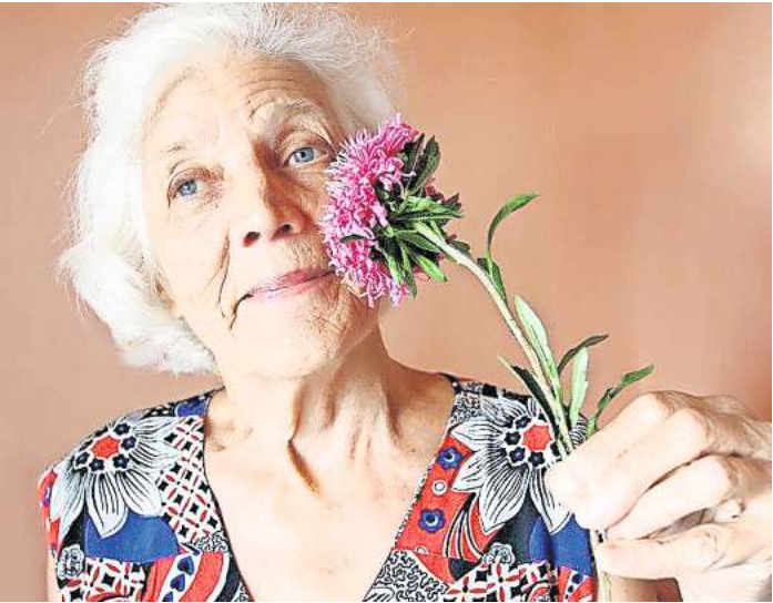
Pflegebedürftige Angehörige kann man nicht einfach unbeaufsichtigt zu Hause lassen. Da bleibt nicht viel Zeit für sich selbst. Pflegebedürftige Angehörige kann man nicht einfach alleine zuhause lassen.

Da kommt jede Unterstützung im Alltag gerade recht. Viele Pflegepersonen würden sich so manches Mal über eine „Kleine Auszeit“ im Pflegealltag freuen und sich die zuverlässige Unterstützung von Dritten wünschen. Aber auch die pflegebedürftigen