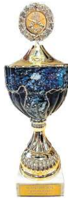
Die Elzer Schützen freuen sich auf das Ausschießen des Familienpokals.

nen. Im Schützenverein erlebt die ganze Familie Spaß und Gemeinschaft, versprechen die Elzer Schützen.