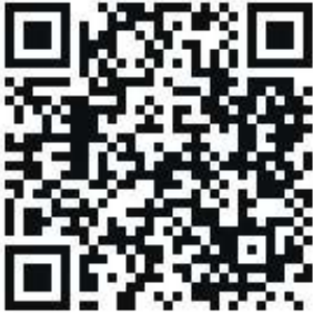
Unter diesem QR-Code kann man sich für die Pilgerwanderung anmelden.

Für die fachlich begleitete Pilgerwanderung wird um Anmeldung über den QR-Code oder telefonisch im Kirchenbüro unter (0 50 71) 17 75 gebeten.