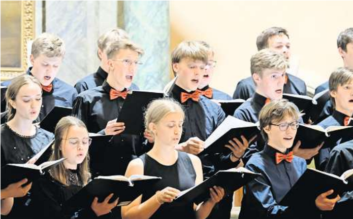
Der Kammerchor des Domgymnasiums Verden singt in der Walsroder Klosterkapelle.