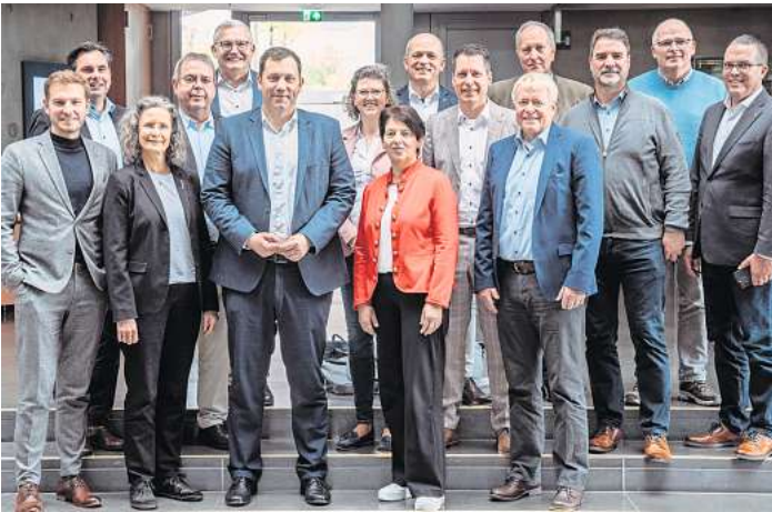
Lars Klingbeil mit seinen Gästen aus dem Wahlkreis.

zungswoche skizzierte, konnten die Kommunalpolitikerinnen und -politiker aus der Heimat beim Abgeordneten alle Themen ansprechen, die sie interessieren. So tauschten sie sich etwa über den Angriffskrieg Russlands auf die Ukraine, die anstehenden US-Wahlen im November, aber auch die Wahlen in den ostdeutschen Bundesländern in diesem Jahr aus. Zur Frage, wie das Verhältnis von Lars Klingbeil zu Olaf Scholz sei, erwiderte Klingbeil, dass er ein vertrauensvolles Verhältnis zum Bundeskanzler habe und dieses sehr schätze. Regionale Themen waren die gesundheitliche Versorgung im Heidekreis und der Ärztemangel, dem entgegengewirkt werden müsse.