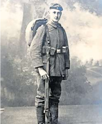
1. Weltkrieg: Gustav Meine von Schmeedts Hof im Mai 1918 in Straßburg.

nen Fotos im zweiten Band der Buchholze Geschichte unterbringen, der auch wieder 550 Seiten umfasst. Viele Informationen hat er auch aus alten Schülerverzeichnissen entnommen, die nach Beendigung seiner Recherchen dem Heimatarchiv Schwarmstedt und dem Schulmuseum Bothmer zugeführt werden sollen.