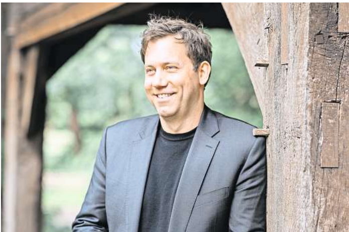
Lars Klingbeil hat gute Nachrichten: Walsrode bekommt eine erkleckliche Summe für die Entsiegelungen von Flächen.