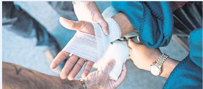
Mit einem einsatzbereiten Verbandskasten kann man helfen, wenn es drauf ankommt.

Es ist besser, vorbereitet zu sein, auch wenn man sich eine solche Situation natürlich nicht wünscht. Doch auch ohne kürzliche Ausbildung gilt es vor allem, ins Handeln zu kommen, zumal jeder zur Ersten Hilfe verpflichtet ist. LPS/LK.