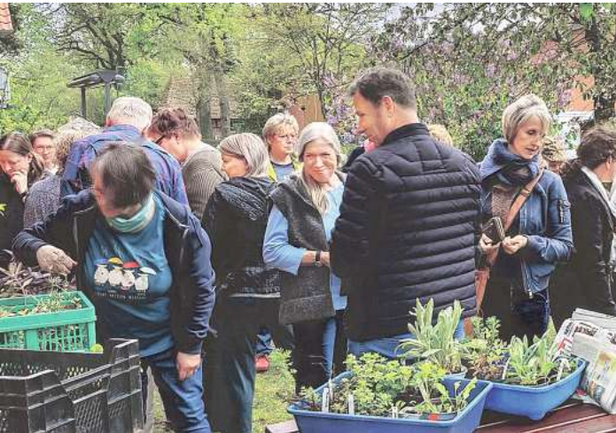
Robustes Pflanzengut aus heimischem Anbau gibt es bei der Pflanzentauschbörse.

mitbringen. Hausgemachte Mar-meladen, Pestos, blumige Salben und süße Sirupe sind als Tauschobjekte ebenso willkommen wie gut erhaltene Gartengeräte. Für diejenigen, die nichts zum Tauschen dabei haben, besteht immer die Möglichkeit, gegen eine kleine Spende für den Garten der Alten Schule zu tauschen. Nach dem Tauschhandel kann sich mit Kaffee, selbst gebackenen Kuchen und anregenden Gartengesprächen gestärkt werden. „Erleben Sie das grüne Tausch-Happening an und in der Alten Schule, Schulstraße 7, in Lindwedel! Es wird blumig, lecker und begleitet von vielen pflanzlichen Plaudereien. Schauen Sie einfach mal rum und suchen sich neue grüne Freunde! Infos auch unter www.beetklub.de “, so die Einladung der Organisatoren.