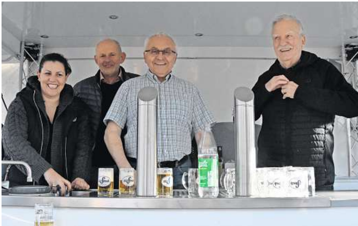
Die Ratsmitglieder übernahmen den Getränkeauschank.