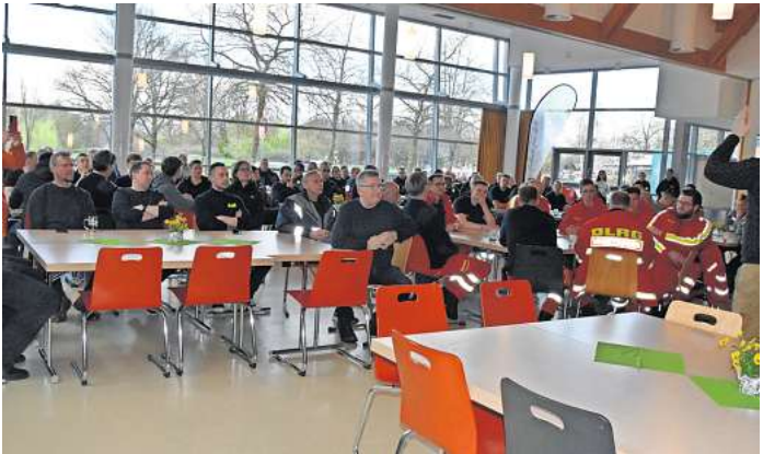
Die Mensa diente als einladender Versammlungsort für die vielen Helfer:innen aus der Samtgemeinde und darüber hinaus.