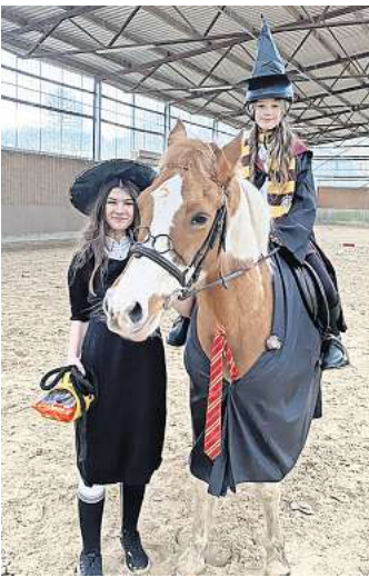
Bunt wurde es beim Vereinstag des RFV Wedemark.

Einen Ausblick auf die kommenden Aktivitäten im Reit- und Fahrverein Wedemark brachte dann die Jahreshauptversammlung kurze Zeit später. So sind für