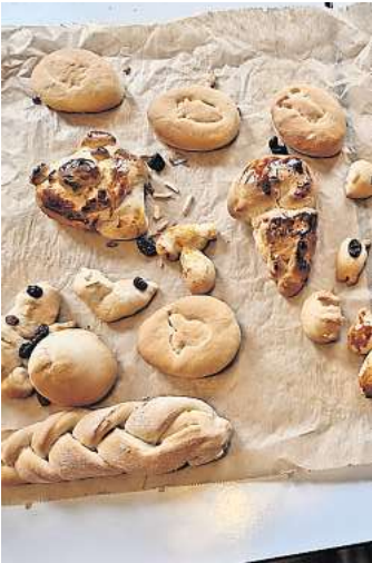
Die kreativen Ergebnisse des Osterbackens beim Vereins Dorfleben können sich sehen lassen.

sucht und dort viele Spiele durchgeführt. Alle hatten Spaß und es war eine gelungene Veranstaltung, die im nächsten Jahr wiederholt werden soll.