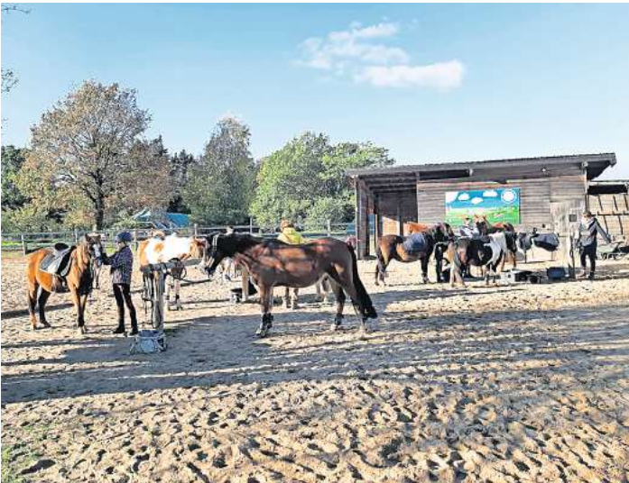
Die Brelinger Ponykinder bieten heute einen Tag des offenen Paddocks an.

Neben regelmäßigen Reitstunden organisieren sie auch Faschingsausritte, Sommerferienbeginnpartys, Reiterspiele, Bastelnachmittage und vieles mehr. Die Eltern unterstützen ihre Kinder dabei, indem sie sich um das organisatorische Drumherum kümmern und auch bei der täglichen Fütterung und Pflege der Ponys mithelfen. „Wir laden alle herzlich ein, am Tag des offenen Paddocks teilzunehmen und unsere Ponys und den Verein näher kennenzulernen.“, so Nehring.