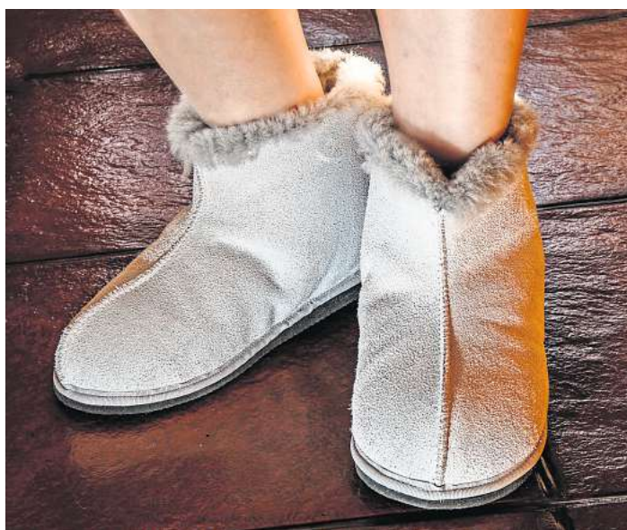
Wärmende Hausschuhe sind für kälteempfindliche Füße optimal.

Kalte Füße sind nicht nur unangenehm, sie können zudem das Erkältungsrisiko erhöhen. Bei niedrigen Temperaturen bemüht sich der Organismus die Kerntemperatur im Gehirn, Brust- und Bauchbereich konstant zu halten, um die lebenswichtige Versorgung der Organe zu gewährleisten. Eine mögliche Folge davon können kalte Füße und Hände sein, weil die Durchblutung zu den Extremitäten verringert wird. Menschen, die im Winter aufgrund der aktuellen Energiekrise und der höheren Verbrauchspreise an den Heizkosten sparen wollen, sollten auf warme Füße achten. Dicke Wollsocken und kuschelige Hausschuhe schenken kälteempfindlichen Füßen Geborgenheit. Allerdings dürfen sie nicht zu eng am Fuß sitzen, da sonst der Wärmeaus-