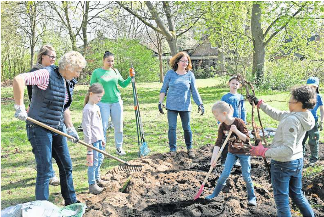
Klein und Groß werkten gemeinsam im Schulgarten der Grundschule.

SCHWARMSTEDT. Die ersten warmen, sonnigen Tage locken in den Garten, mit den letzten Blättern wird der Winter weggefeht und Platz für Frühlingsblumen gemacht, die wieder etwas Farbe ins noch triste Grau bringen. Über Sonne und schon fast sommerliche Temperaturen freuen sich auch die Akteure des Gartentags an der Schwarmstedter Wilhelm-Röpke-Grundschule, die Licht in den Schulgarten im Innenhof brachten. Schon seit 2019 findet der Gartentag in Kooperation von Schule und den Rotariern statt und nachdem die Veranstaltung im letzten Jahr im wahrsten Sinn des Wortes „ins Wasser gefallen“ war, freuen sich diesmal alle um so mehr über das schöne Wetter. Die stellvertretende Schulleiterin Heike Stock hatte wieder im Vorfeld mit dem Rotary Club Schwarmstedt Aller-Leine-Tal abgesprochen, was getan werden soll und Gärtnermeister und Rotarier Marcus Wolter vom Schwarmstedter Garten- und Landschaftsbau hatte sich vor Ort die Gegebenheiten angesehen. Er sorgte nicht nur für sorgfältige Planung sondern stellte auch Maschinen und Geräte zur Verfügung und übernahm am Gartentag die Federführung sowie die Einteilung der zahlreichen HelferInnen, die sich aus Eltern, SchülerInnen und Klassenlehrkräften des zweiten Jahrgangs, Schulleiter Jens Weber, Stellvertreterin Heike Stock, Sonja Krüger als Leiterin der Garten-AG im Ganztags und zahlreichen Rotariern zusammen setzten. Gemeinsam wurden die drei