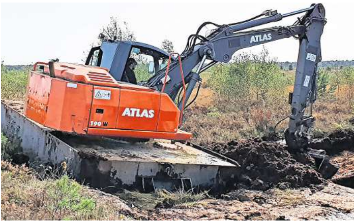
Versinken unmöglich: Mit einem Pontonbagger waren die Baggerarbeiten im Bissendorfer Moor auch auf nassem Standort durchführbar.

Die Baumaßnahmen nördlich von Hannover dienen dem Regenwasserrückhalt. Durch die Verbesserung der Moorwasser-