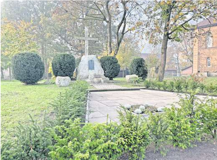
Pünktlich zu ihrem 115. Geburtstag hat die Soldatenkameradschaft letztes Jahr das Kriegerdenkmal an der Brelinger Kirche neu gestaltet.