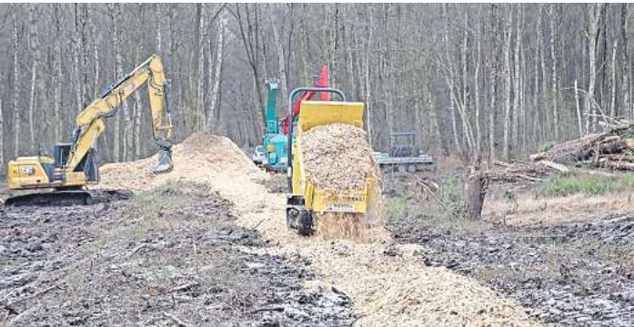
Spaziergänger herzlich willkommen: Auf der Zuwegung zum Südturn im Bissendorfer Moor wurden Hackschnitzel mit einem Dumper aufgebracht.

2024 wieder Gelassenheitstrainings, eine Reiter-Rallye und Lehrgänge geplant. Zudem laufen aktuell schon wieder die Vorbereitungen für die Hellendorfer Turniertage auf Hochtouren: Beim Dressurturnier am 25. und 26. Mai und beim Springturnier vom 31. Mai bis 2. Juni wird in Hellendorf wieder erstklassiger Turniersport mit Prüfungen bis zur schweren Klasse sowie Highlights wie dem Grand Prix Special, Mannschaftsspringen und dem Barrierspringen geboten. Die Vorstandswahlen auf der Jahreshauptversammlung waren in diesem Jahr reine Formsache. Sowohl Klaus Kreutzer, 1. Vorsitzender, und Uwe Boschem, Geschäftsführer, standen beide turnusmäßig zu Wahl und wurden einstimmig wiedergewählt. Außerdem wurden Lena Heise als Sportwart, Sarah Stäcker als Jugend- und Freizeitwart und Tobias Studanski als Anlagenwart gewählt. Katharina Meine und Julia Dehio bilden ein Team für Social Media-Arbeit. So ist der Reit- und Fahrverein Wedemark auch zukünftig bestens für seine Mitglieder aufgestellt.