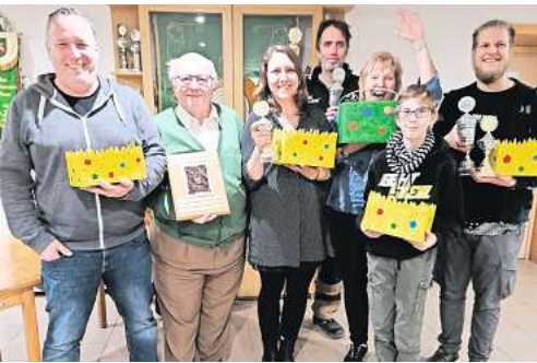
Die glücklichen Gewinner des Osterschießens in Resse.