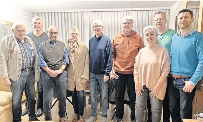
Der neue Vorstand des Bürger- und Verschönerungsvereins Mellendorf.

Der neue Vorstand des Bürger- und Verschönerungsvereins Mellendorf.