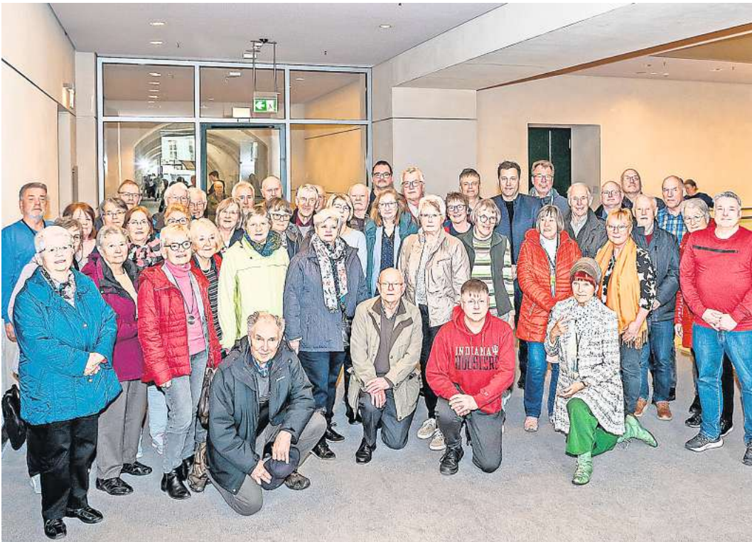
Die Besuchergruppe aus dem Wahlkreis bei Lars Klingbeil in Berlin.

Dieser erläuterte zunächst von seinem Arbeitsalltag als Bundestagsabgeordneter für die heimische Region in Berlin und beschrieb auch, wie eine typische Sitzungswoche der Abgeordneten abläuft. Die Bürgerinnen und Bürger hatten dann die Möglichkeit, Lars Klingbeil Fragen zu stellen oder über politische Themen zu diskutieren. Themen beim Gespräch waren unter an-