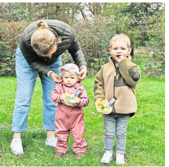
Alles gefunden. Die Kinder hatten ihren Spaß.

LINDWEDEL/HOPE. Petrus sorgte bereits für angenehme Temperaturen, der Saharastaub jedoch für eine betrübte Sonne. Das Interesse der Hoper und Lindwedeler Kinder an der Suche nach Osternestern schmälerte das kein bisschen. Und nach der aufregenden Suche gab es dann sogar noch Kuchen mit Brause, Kaffee und Klönschnack für die findigen Nestsucher und deren Eltern und Großeltern. Die Lindwedeler Sozialdemokraten freuten sich über den Ansturm der kleinen Leute und zeigten sich mit dem Verlauf vollauf zufrieden, so bereitet die Unterstützung des Osterhasen allen eine schöne Freude.