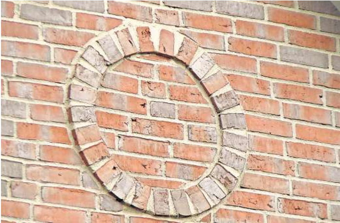
Wer kennt dieses Motiv in Elze?

ELZE. Damit alle in Zukunft mit noch offeneren Augen durch Elze laufen, wird jeden Monat ein Suchbild mit einem Detail eines Hauses oder einer Hofanlage veröffentlicht. Dieses Merkmal ist von der Straße aus zu erkennen, sodass das jeweilige Grundstück nicht betreten werden muss. Das Suchbild hängt auch im Schaukasten des Vereins Dorfbild Elze, Wasserwerkstraße 21/21a. Die richtige Lösung kann bis zum Monatsende per E-Mail an ehtheilmann@dorfbild-elze.de geschickt oder in den Briefkasten von Wasserwerkstraße 21a oder 23 eingeworfen werden. Der Gewinner oder die Gewinnerin wird unter allen EinsenderInnen durch Los bestimmt und bekommt einen kleinen Preis (Naturalien aus Elze). Und hier die Lösung aus dem Monat März: Ein schöner Brauch: Die Erbauer eines Hauses