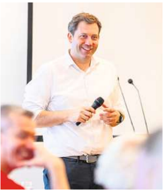
Lars Klingbeil ist demnächst in Hodenhagen im Gespräch.

HODENHAGEN. Um zu hören, welche Themen die Bürgerinnen und Bürger politisch interessieren, veranstaltet der heimische Bundestagsabgeordnete Lars Klingbeil regelmäßige Dialogveranstaltungen im Kreis Rotenburg und Heidekreis. Am 16. April lädt der SPD-Politiker alle interessierten Bürgerinnen und Bürger zum nächsten „Klingbeil im Gespräch“ ein. Ab 18 Uhr möchte Klingbeil in Hodenhagen gemeinsam mit den Bürgerinnen und Bürgern über die aktuelle politische Situation diskutieren, Fragen beantworten und Hinweise aus der Region für die politische Arbeit aufnehmen. „Ich lade alle herzlich zu einem offenen Gespräch ein und einer Diskussionsrunde auf Augenhöhe ein. Ganz gleich ob es ein individuelles Anliegen oder bundespolitische Themen sind, kommt vorbei und lasst uns drüber reden“, richtet sich Lars Klingbeil einladend an alle Bürgerinnen und Bürger aus dem Heidekreis. Wer an der Veranstaltung teilnehmen möchte, wird aus Planungsgründen um eine Anmeldung unter lars.klingbeil@bundestag.de gebeten. Lars Klingbeil freut sich auf den persönlichen Austausch am 16. April ab 18 Uhr im Brinkhaus, Brinkweg 10 in Hodenhagen.