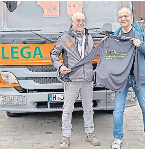
Der SC Wedemark freut sich über das neue Outfit.

Die Vorbereitung auf die Rückrunde in der Kreisliga verlief für die junge Herrenmannschaft des SC Wedemark recht ordentlich. Mit einer guten Trainingsbeteiligung nach der Winterpause und drei absolvierten Testspielen – teilweise auf Kunstrasen – will man das Ziel Klassenerhalt für die laufende Saison angehen.