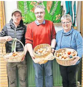
Die stolzen Gewinner des Ostereierschießens beim SV Scherenbostel.