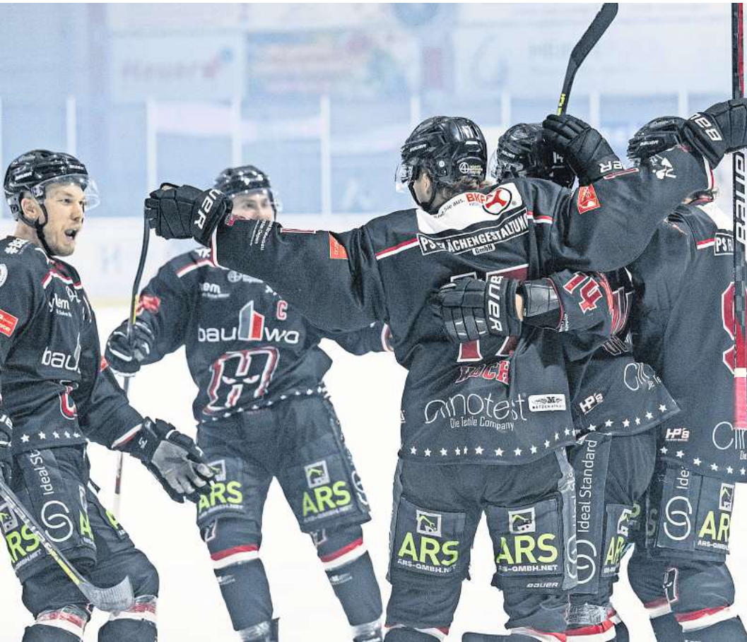
Wollen auch am Sonntag wieder jubeln: die Kufenflitzer der Hannover Scorpions.

Alle Spiele werden auch live auf sprade.tv übertragen.