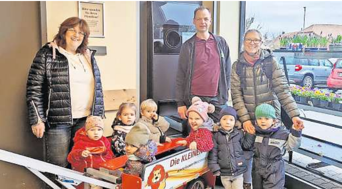
Die Kinder von Löwenherz freuten sich über den Erlös aus der Pfandbonaktion beim Frische-Markt Pagel in Resse.

bei Bedarf möglich. Das Mittagessen wird täglich frisch gekocht. Die Krippe verfügt über ein kindgerechtes Außengelände. Wer Bedarf an einem der wenigen Krippenplätze, die ab August 2024 frei werden, hat und sich einen Platz sichern möchte, kann sich gerne bei den Kleinen Löwen unter Telefon (0 51 31) 90 96 86 oder (0 51 31) 47 96 63 melden. Eine Aussage oder Platzzusage kann unverzüglich erfolgen. Nach Terminvereinbarung ist es möglich sich die Kleine Kindertagesstätte anzuschauen und ein Gespräch mit den Betreuerinnen zu führen. Da es sich bei dem Verein Löwenherz e.V. um einen unabhängigen und eigenständigen Träger handelt, können auch Kinder außerhalb der Gemeinde Wedemark aufgenommen werden. Mehr zum Konzept erfahren Interessierte auch unter www.loewenherz-resse.de .