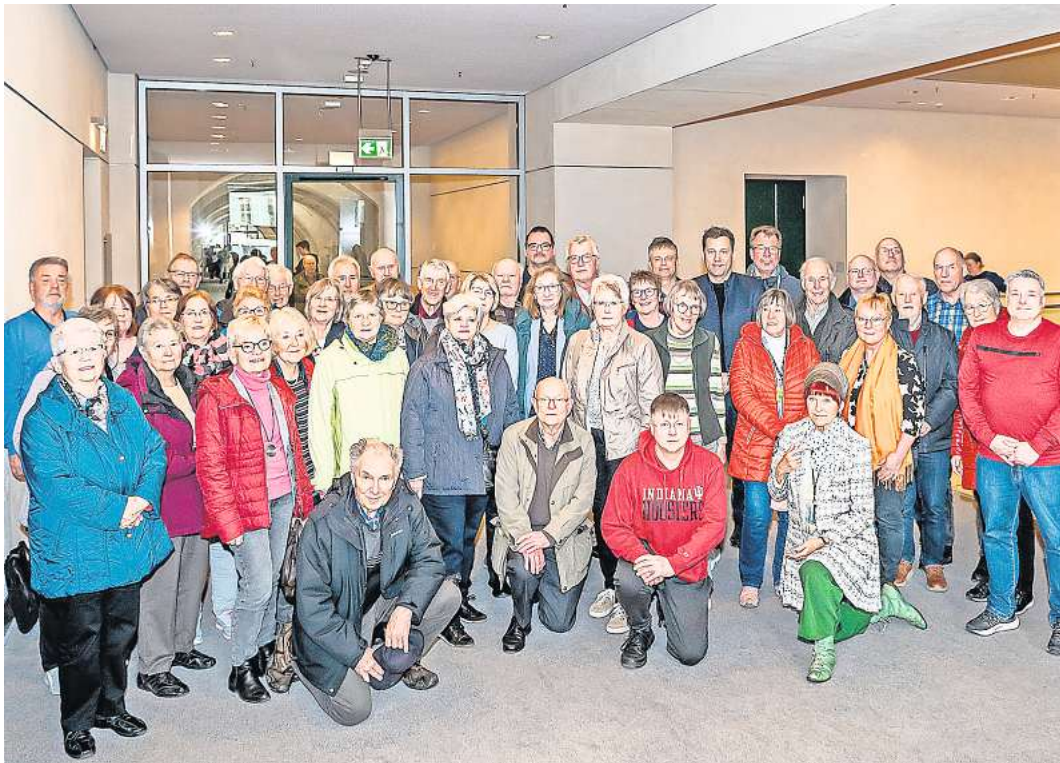
Die Besuchergruppe aus dem Wahlkreis bei Lars Klingbeil in Berlin.

Dieser erläuterte zunächst von seinem Arbeitsalltag als Bundestagsabgeordneter für die heimische Region in Berlin und beschrieb auch, wie eine typische Sitzungswoche der Abgeordneten abläuft. Die Bürgerinnen und Bürger hatten dann die Möglichkeit, Lars Klingbeil Fragen zu stellen oder über politische Themen zu diskutieren. Themen beim Gespräch waren unter an-