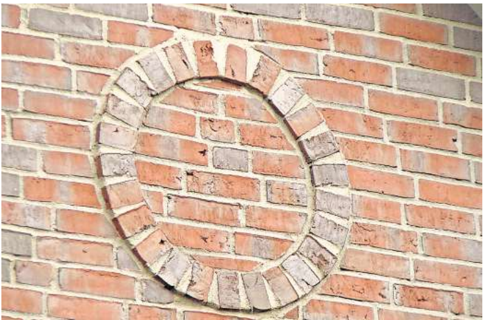
Wer kennt dieses Motiv in Elze?

ELZE. Damit alle in Zukunft mit noch offeneren Augen durch Elze laufen, wird jeden Monat ein Suchbild mit einem Detail eines Hauses oder einer Hofanlage veröffentlicht. Dieses Merkmal ist von der Straße aus zu erkennen, sodass das jeweilige Grundstück nicht betreten werden muss. Das Suchbild hängt auch im Schaukasten des Vereins Dorfbild Elze, Wasserwerkstraße 21/21a. Die richtige Lösung kann bis zum Monatsende per E-Mail an ehtheilmann@dorfbild-elze.de geschickt oder in den Briefkasten von Wasserwerkstraße 21a oder 23 eingeworfen werden. Der Gewinner oder die Gewinnerin wird unter allen EinsenderInnen durch Los bestimmt und bekommt einen kleinen Preis (Naturalien aus Elze). Und hier die Lösung aus dem Monat März: Ein schöner Brauch: Die Erbauer eines Hauses