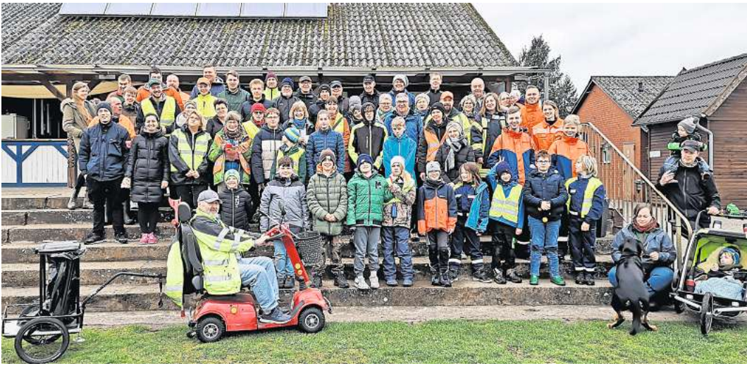
Große Aufräumaktion beim Umwelttag in Buchholz/Aller und Marklendorf.

Die Kinder- und Jugendfeuerwehr sowie die Dorfjugend und etliche Bürger haben diese Aktion unterstützt. GEMEINSCHAFT wurde hier großgeschrieben. Nach getaner Arbeit – viele Hände machen der Arbeit schnell ein Ende – gab es eine kleine Stärkung vom Grill, Getränke sowie Kaffee und Kuchen auf dem Sportplatz. Die Teams bedanken sich in diesem Zusammenhang für die Spende der Brötchen und Grillkohle von EDEKA Wilde.