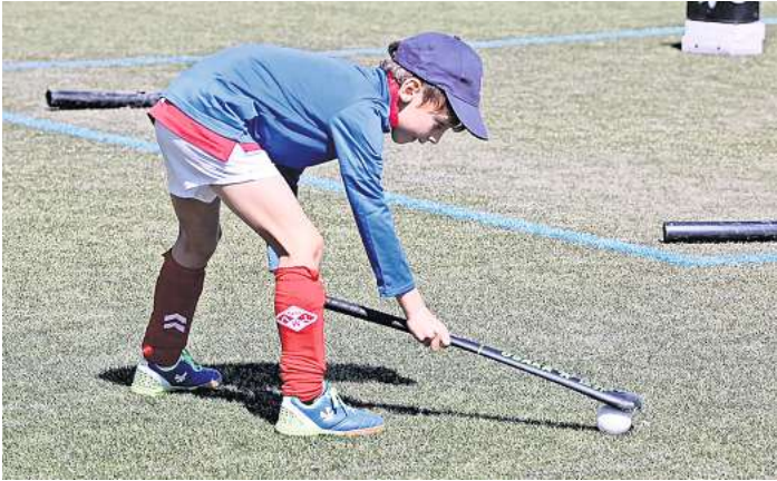
Schnuppertag und Saisoneroöffnung im Hockeysport beim MTV stehen kurz bevor.

Die Veranstaltung bietet allen Mitgliedern, Freunden und Familien die Gelegenheit, sich auf spannende Spiele, gemeinsame Aktivitäten und ein geselliges Beisammensein zu freuen. Ein abwechslungsreiches Programm mit Spielen, Wettkämpfen und einer Vorstellung der Mannschaften verspricht einen gelungenen Auftakt für die kommende Feldsaison. Am darauffolgenden Tag, 14. April, öffnet die Hockeyabteilung des MTV ihre Türen für einen Schnuppertag. Von 10 bis 12.30 Uhr sind alle eingeladen, die den Hockeysport einmal selbst ausprobieren möch-