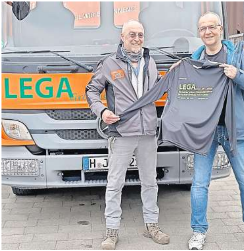
Der SC Wedemark freut sich über das neue Outfit.

Die Vorbereitung auf die Rückrunde in der Kreisliga verlief für die junge Herrenmannschaft des SC Wedemark recht ordentlich. Mit einer guten Trainingsbeteiligung nach der Winterpause und drei absolvierten Testspielen – teilweise auf Kunstrasen – will man das Ziel Klassenerhalt für die laufende Saison angehen.