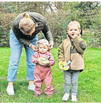
Alles gefunden. Die Kinder hatten ihren Spaß.

LINDWEDEL/HOPE. Petrus sorgte bereits für angenehme Temperaturen, der Saharastaub jedoch für eine betrübte Sonne. Das Interesse der Hoper und Lindwedeler Kinder an der Suche nach Osternestern schmälerte das kein bisschen. Und nach der aufregenden Suche gab es dann sogar noch Kuchen mit Brause, Kaffee und Klönschnack für die findigen Nestsucher und deren Eltern und Großeltern. Die Lindwedeler Sozialdemokraten freuten sich über den Ansturm der kleinen Leute und zeigten sich mit dem Verlauf vollauf zufrieden, so bereitet die Unterstützung des Osterhasen allen eine schöne Freude.