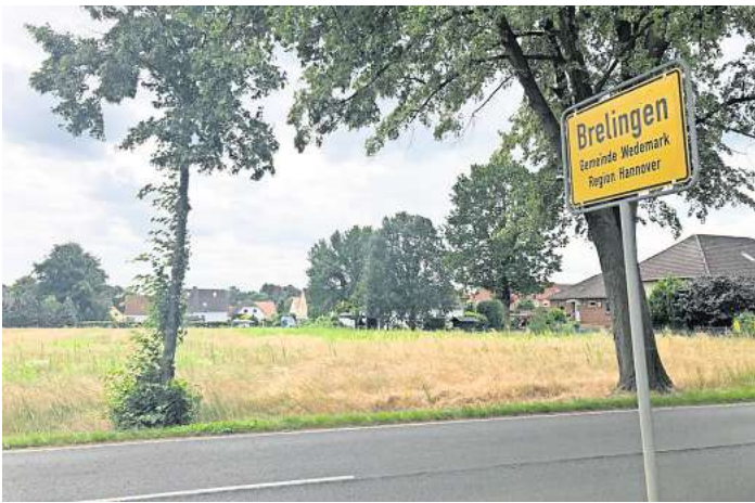
Neubaugebiet Waldrebenweg: Hier soll nun auch ein Spielplatz gebaut werden.

Es geht um eine 0,9 Hektar große Fläche am östlichen Ortsrand, direkt südlich an die L383 angrenzend, die das Dorf mit Mellendorf verbindet. Das geplante Baugebiet schließt direkt an die vorhandene Siedlung im Bereich der Bergstraße an. Über Bergstraße und Waldrebenweg soll es dann auch verkehrstechnisch erschlossen werden. Eine direkte Zufahrt von der L 383 ist aus rechtlichen Gründen nicht möglich und auch nicht erwünscht. Sie wird nur während der Bauphase eingerichtet.