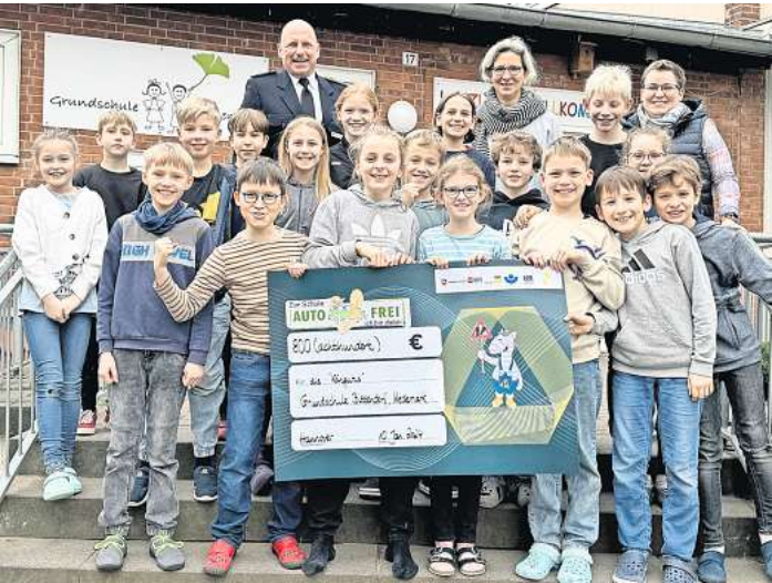
Die Grundschule Bissendorf ist stolz auf die Auszeichnung.

Auch 2024 wird es einen AutoFREIE-Wettbewerb geben: Vom 28. August bis zum 2. Oktober können wieder fleißig Schritte gesammelt und so für ein Mehr an Verkehrssicherheit beigetragen werden.