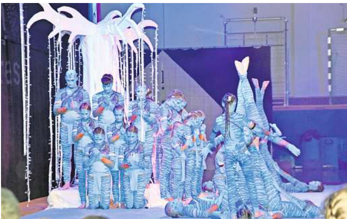
Sieger bei den Fortgeschrittenen: Reverse mit einer tollen Show.

Lediglich das Team „In motion“ des SFN Vechta konnte verletzungsbedingt nur an der Vorrunde teilnehmen. Die anderen zwölf Teams wärmten sich mit ihren Shows am Vormittag auf,