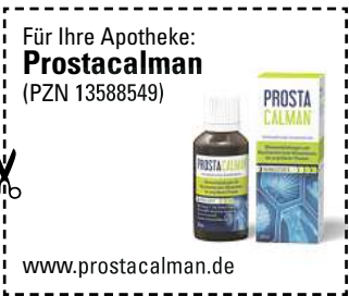
Abbildung Betroffenen nachempfunden PROSTACALMAN. Wirkstoffe: Serenoa repens a, Pareira brava a, Populus tremuloides Dil. D2. Prostacalman wird angewendet entsprechend den homöopathischen Arzneimittelbildern. Dazu gehören: Blasenentzündungen und Beschwerden beim Wasserlassen, bei vergrößerter Prostata. www.prostacalman.de • Zu Risiken und Nebenwirkungen lesen Sie die Packungsbeilage und fragen Sie Ihre Ärztin, Ihren Arzt oder in Ihrer Apotheke. • PharmaSGP GmbH, 82166 Gräfelfing

Häufiger Harndrang, der Urin kommt nur noch tröpfchenweise oder die Blase fühlt sich nicht entleert an? Schuld daran ist oft die Prostata. Dieses sogenannte „Männerorgan“ kann mit zunehmendem Alter wachsen und dadurch die Harnröhre blockieren. Experten haben ein Arzneimittel namens Prostacalman entwickelt, das gleich drei Wirkstoffe in sich vereint: Serenoa repens, Pareira brava und Populus tremuloides. Diese Arzneistoffe sind dafür bekannt, u.a. den nächtlichen Harndrang zu reduzieren, den Urinfluss zu verstärken und den Restharn in der Blase zu verringern. Genial: Prostacalman beeinträchtigt nicht die Sexualfunktion. Das Arzneimittel ist rezeptfrei in jeder Apotheke erhältlich.