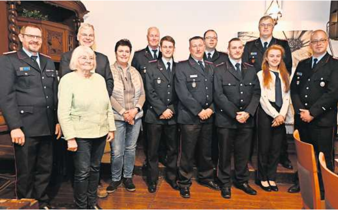
Die Ortsfeuerwehr Engelbostel hatte zur Jahreshauptversammlung geladen.