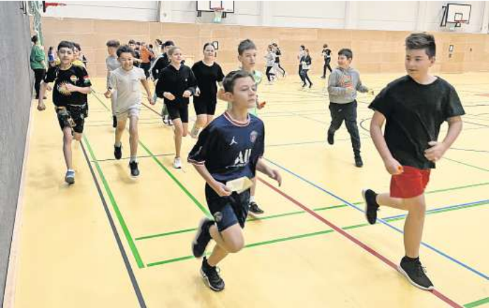
Jeder gab sein Bestes beim UNICEF-Lauf in der Veranstaltungssporthalle.