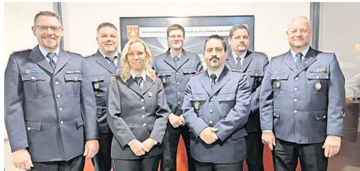
Auch bei der Ortsfeuerwehr in Schulenburg gab es jede Menge Ehrungen und Beförderungen.