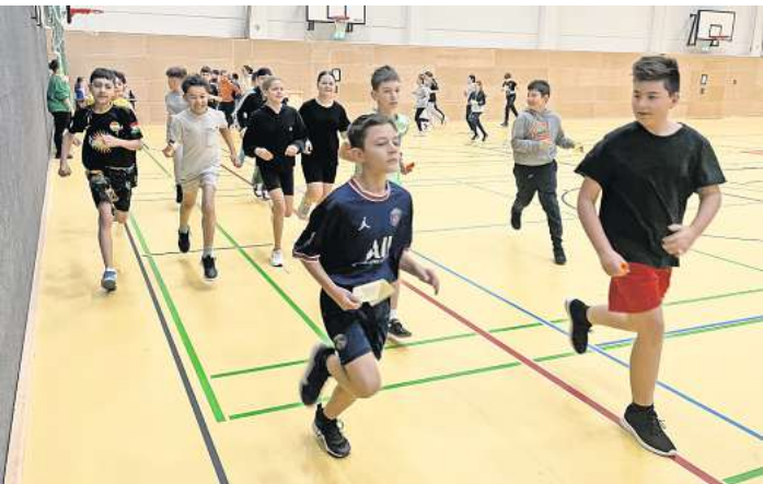
Jeder gab sein Bestes beim UNICEF-Lauf in der Veranstaltungssporthalle.