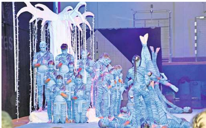
Sieger bei den Fortgeschrittenen: Reverse mit einer tollen Show.

Lediglich das Team „In motion“ des SFN Vechta konnte verletzungsbedingt nur an der Vorrunde teilnehmen. Die anderen zwölf Teams wärmten sich mit ihren Shows am Vormittag auf,