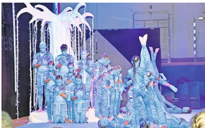
Sieger bei den Fortgeschrittenen: Reverse mit einer tollen Show.

Lediglich das Team „In motion“ des SFN Vechta konnte verletzungsbedingt nur an der Vorrunde teilnehmen. Die anderen zwölf Teams wärmten sich mit ihren Shows am Vormittag auf,