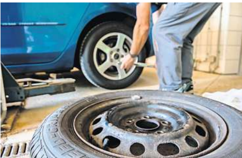
Die Werkstattkosten steigen aufgrund der aktuellen Wirtschaftslage.

Beispielsweise sind bei einer Lichtmaschine oft nur einzelne Teile kaputt. Tauscht man diese aus und nicht das komplette Gehäuse, wird Geld gespart und es steht darüber hinaus im Sinne der Nachhal-