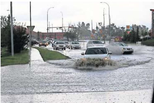
Autos kämpfen sich durch überflutete Straßen – mögliche Schäden durch Hochwasser können Motorschäden, Elektronikprobleme und Rostbildung sein.

Für Fahrzeugbesitzer, die in Regionen leben, die durch Hochwasser oder Unwetter gefährdet sind, ist es ratsam, mit ihrem Versicherungsberater die Versicherungspolice durchzugehen. Gemeinsam wird die Haftungsübernahme bei Wasserschäden am Fahrzeug geprüft und eine Erweiterung der Versicherungsleistungen erwogen. Autofahrende sollten am besten nicht durch Hochwasser fahren, da sie zum einen nicht voraussehen können, wie die tatsächliche Wassertiefe ist, und zum anderen sich die Situation schnell zu einer akuten Gefahrenlage ausweiten kann. LPS/JV