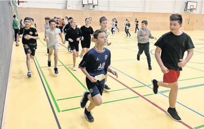
Jeder gab sein Bestes beim UNICEF-Lauf in der Veranstaltungssporthalle.