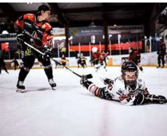
Die Kinder können das Gefühl „Eishockey“ erleben.