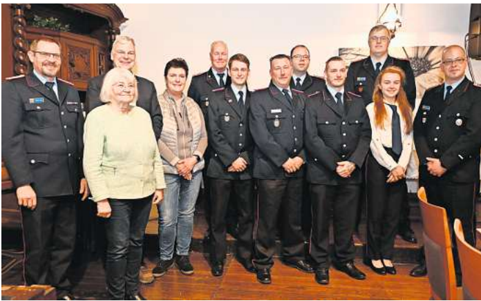
Die Ortsfeuerwehr Engelbostel hatte zur Jahreshauptversammlung geladen.