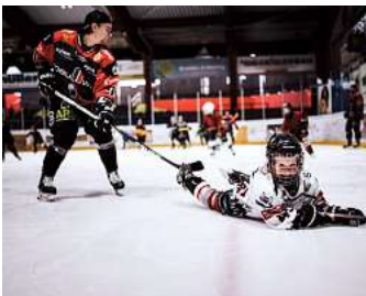
Die Kinder können das Gefühl „Eishockey“ erleben.

MELLENDORF/LANGENHAGEN. Am Sonnabend, 10. Februar, findet im Eisstadion Mellendorf (ARS Arena) zwischen 12.30 und 13.30 Uhr der Kids on Ice Hockey Day statt. Bei diesem Event können alle Kinder im Alter zwischen vier und neun Jahren, die Lust haben, das Gefühl „Eishockey“ erleben, eine Stunde lang mit Trainern und einigen Spielern der Hannover Scorpions Spaß auf dem Eis haben. Viele Hände werden bei den ersten Schritten auf dem Eis unterstützen. Die Teilnahme ist kostenlos! Für die Eltern werden Ansprechpartner vor Ort Fragen rund um das Thema Eishockey, Wedemark Scorpions, Nachwuchsarbeit und Vereinssport beantworten. Bitte Handschuhe, Fahrradhelm und Inline-Schoner mitbringen, wenn vorhanden. Schlittschuhe und Schläger bekommen die Kids. Einige Ausrüstungsteile sind auch da. Kostenlos. Zum Abschluss gibt es Hotdogs und Getränke für alle Teilnehmer. Fragen werden in der Geschäftsstelle der Scorpions unter (05130) 95 94 10 oder unter hannah.mielke@wedemark-scorpions.de beantwortet.