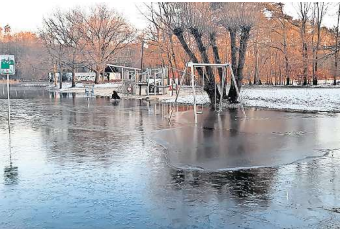
Auch der Waldsee darf trotz der aktuellen Minustemperaturen noch nicht betreten werden.

LANGENHAGEN. Die Eisschichten sind zu dünn, um sie sicher betreten zu können. Darauf weist die Stadtverwaltung angesichts der aktuellen Minustemperaturen hin. Sie sorgen zwar dafür, dass aktuell überschwemmte Bereiche zufrieren. Doch die Eisschichten auf den Wasserflächen etwa bei den Spielplätzen Silbersee und Waldsee oder in den Grünanlagen haben oftmals noch keine Stärke erreicht, die tragfähig ist. Auf den überschwemmten Bereichen an den Seen besteht zudem die Gefahr: Es ist nicht ersichtlich, wo das tiefere Wasser beginnt. Erwachsene werden gebeten, insbesondere Kinder auf bestehende Gefahren aufmerksam zu machen.