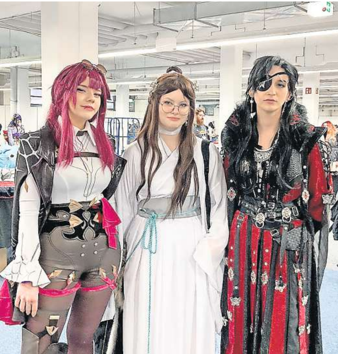
Hannover Comic Manga Retro Convention 2024 in Langenhagen-Godshorn.

Channi ist gemeinsam mit Tony und Noah nach Godshorn gekommen, zur ersten Hannover Comic Manga Retro Convention. Sie sind regelmäßig auf Manga- und Comic-Conventions und schon ziemlich geübt ihm Verkleiden. Ihnen gehe es bei den Conventions vor allem darum,