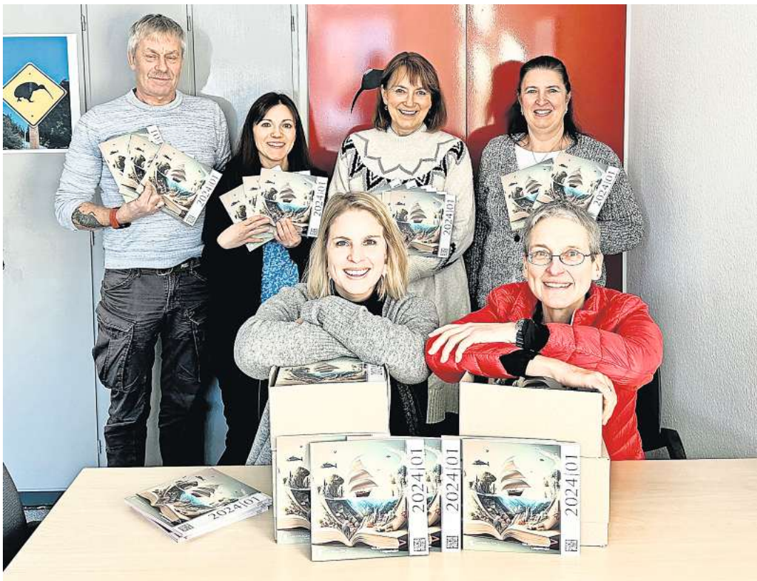
Das VHS-Team freut sich über die vielfältige Angebotspalette.

Die Ausstellung „Caspar David Friedrich“ ist Ziel einer Exkursion nach Hamburg am 2. März. Anlässlich seines 250. Geburtstags präsentiert die Kunsthalle Hamburg über 60 Gemälde und rund 100 Zeichnungen des bedeu-