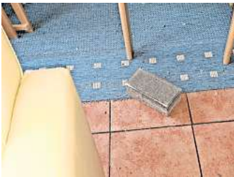
Schweres Wurfgeschoss: Der Pflasterstein liegt im Kirchraum.

LANGENHAGEN (wal). Zwei unbekannte Jugendliche haben mit einem Pflasterstein eine Scheibe im Gebäude des Vereins Ecclesia – Die Familienkirche zerstört. Die Polizei ermittelt wegen einer sogenannten gemein-schädlichen Sachbeschädigung, weil die Räume als Kirchraum genutzt werden.