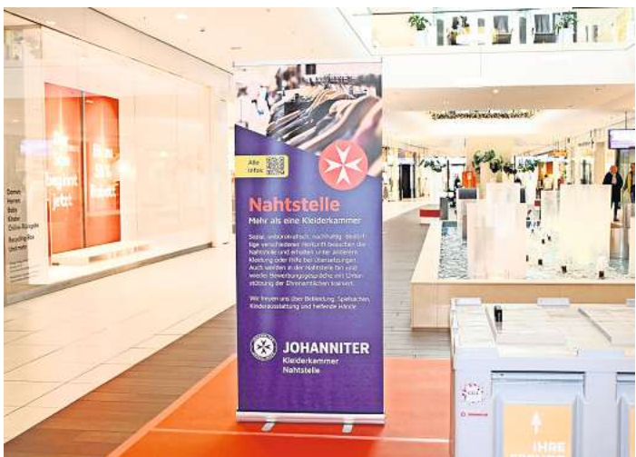
Die Boxen am CCL-Brunnen gehören zur Johanniter-Kleider-Sammlung.

nötigen. Zwei Boxen werden auf der Fläche im Erdgeschoss vor dem Brunnen aufgestellt. Die Kunden können ganz einfach die Winterjacken einwerfen. Altkleider sollten sauber in die Sammlung gegeben werden. Das Centermanagement sammelt die Jacken und übergibt diese dann der Kleiderkammer der Johanniter. Unabhängig davon können Sachspenden weiterhin Geschäft fairKauf im CCL oder direkt in der Kleiderkammer „Nahtstelle“ der Johanniter am Bahnhof Langenhagen Mitte, Brüsseler Straße 1, abgegeben werden. Für Interessierte ist die „Nahtstelle“ dienstags, mittwochs und donnerstags von 10 Uhr bis 12 Uhr und von 16.30 Uhr bis 18.30 Uhr geöffnet.