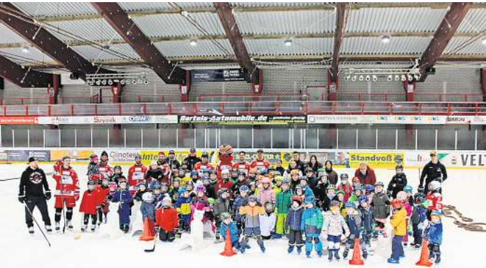
Für Kinder ab vier Jahren besteht die Möglichkeit, Eishockey zu lernen.

MELLENDORF. Im Eisstadion Mellendorf (ARS Arena) findet am Sonnabend, 25. November, der DEL Kids on Ice Hockey Day statt. Bei diesem Event können alle Kinder im Alter zwischen 4 und 9 Jahren, die Lust haben, das Gefühl „Eishockey“ zu erleben, eine Stunde lang mit unseren Trainern und einigen Spielern der Hannover Scorpions Spaß auf dem Eis haben. Viele Hände werden bei den ersten Schritten auf dem Eis unterstützen. Wann? Sonnabend, 25. November, von 12.30 bis 13.30 Uhr Wo? Ice House Mellendorf, Am Freizeitpark 2, 30900 Wedemark. Die Teilnahme ist kostenlos. Für die Eltern werden Ansprechpartner vor Ort Fragen rund um das Thema Eishockey, Wedemark Scorpions Nachwuchsarbeit und Vereinssport beantworten. Bitte Handschuhe, Fahrradhelm und Inline-Schoner mitbringen, wenn vorhanden. Schlittschuhe und Schläger bekommen die Kids von uns. Einige Ausrüstungsteile haben wir auch da. Kostenlos. Zum Abschluss gibt es Hotdogs und Getränke für alle Teilnehmer. Fragen werden in der Geschäftsstelle der Scorpions unter (05130)95 94 10 oder unter hannah.mielke@wedemark-scorpions.de beantwortet.