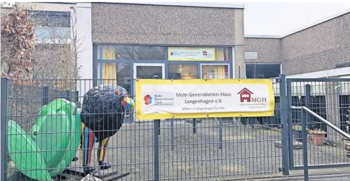
Grund ist ein Wasserschaden: Das Angebot im Mehrgenerationen-haus Langenhagen ist derzeit eingeschränkt.

LANGENHAGEN (WAL). Der Fahrstuhl, der Mobilitätseinge-schränkten Personen den Besuch des Mehrgenerationenhauses (MGH), des Veranstaltungssaals daunstärz und der VHS Langen-hagen an der Konrad-Adenauer-Straße ermöglicht, wird voraus-sichtlich in der zweiten Monats-hälfte wieder in Betrieb gehen können. Das teilte Stadtspreche-rin Juliane Stahl mit. Im Nachgang eines Wasser-schadens hatte die Stadt den erst zwei Jahre zuvor reparierten Fahrstuhl im Mehrgenerationen-haus stilllegen müssen. Eine Fachfirma ist mit der Reparatur beauftragt, die benötigten Er-satzteile sind geordert. Sofern diese zum vereinbarten Termin