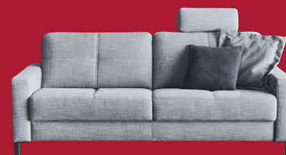
3-SITZER UND 2-SITZER