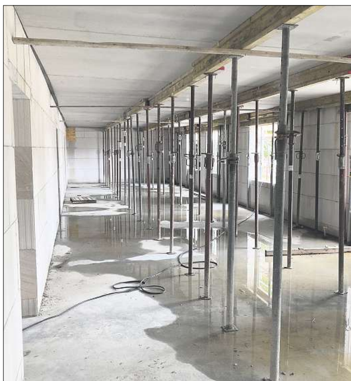
Viel Platz: In der ersten Etage soll Raum sein für Schulungen, den Vereinsvorstand und Dart-Angebote.

Für die Mitglieder ergeben sich neue Möglichkeiten in dem mit einem Fahrstuhl ausgestatteten Gebäude. Außer den neuen Schießständen gibt es im Obergeschoss auch Räume für Schulungen und den Dartsport, zudem erhält der Vorstand ein Büro, und es wird eine zweite Waffenkammer sowie eine Werkstatt für Kleinreparaturen geben. Auch die Musiker des Schützenvereins, das Young Spirit Orchestra, erhalten mehr Übungskapazitäten.