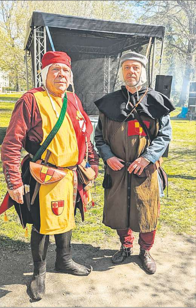
Das Mittelalter hält jetzt in Langenhagen Einzug.

gefertigte Filzwaren, Gewandungen, Seifen und ausgefallene Schmuckstücke an, auch Lederwaren, erlesene Gewürze, Kräuter und Honigprodukte werden angeboten. Kinder freuen sich auf die Kinderrüstkammer und viele Mitmach-Aktionen wie Axtwerfen, Armbrustschießen oder Specksteinschnitzen. Eine Märchen-zählerin verzaubert die kleineren Gäste mit ihren Geschichten. Der Duft von gebratenem Spanferkel liegt in der Luft. Auch Flammkuchen und Baumstriezel werden angeboten. An der Taverne locken Met und leckeres Kirschbier. Die Klänge mittelalterlicher Musik werden das Publikum begeistern und auf eine Reise in vergangene Zeiten führen. Der Wegezoll beträgt sechs Euro am Tag. Kinder bis 14 Jahre haben freien Eintritt. Die jeweiligen Öffnungszeiten: freitags 16 bis 22 Uhr, sonntags 11 bis 18 Uhr.