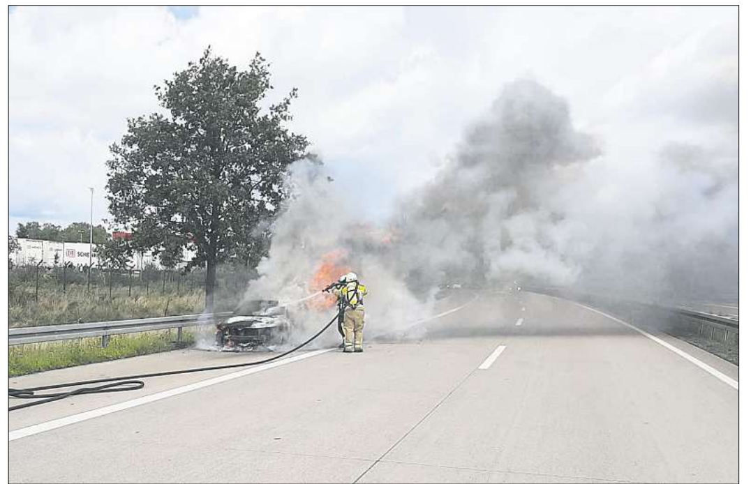
Die Feuerwehr löschte den Wagen mit 2.000 Litern Wasser.

Feuerwehr Kaltenweide mit 18 Kräften im Einsatz