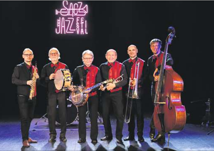
Das Five O'Clock Orchestra ist am 20. August zu Gast in Langenhagen.

sein werden“, erklärt Soltau. Mehr als 5.000 Besucher werden auch dieses Jahr wieder erwartet, und diese kommen nicht nur aus der näheren Umgebung. Die Jazz-Matineen haben sich weit über die Stadtgrenzen hinaus einen Namen gemacht. Wer also ganz entspannt und in netter, familiärer Atmosphäre gute Musik genießen möchte, sollte sich das musikalische Programm genau ansehen und sich seine Wunschtermine dick in den Kalender eintragen. Wie immer ist der Eintritt frei und es wird auch für das leibliche Wohl gesorgt sein. In diesem Jahr starten die Jazz Matineen am 2. Juli mit der MayDay Jazzband aus den Niederlanden. Das Ensemble ist bekannt