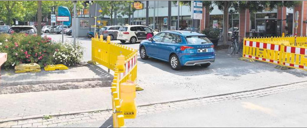
Hier geht es künftig rein und raus: Die Zufahrt der Elisabeth-Arkaden wird auch dauerhaft zur Ausfahrt.

Die Stadtverwaltung will den Seitenraum mit 13 neuen Bäumen aufwerten. Dafür und für breitere Geh- und Radwege werden Parkplätze am Straßenrand wegfallen. Die Zahl reduziert sich von 116 auf 76, also um rund ein Drittel. Ist der Umbau der Walsroder Straße damit abgeschlossen? Nein. Nördlich der Kreuzung Reuterdamm/Am Pferdemarkt stehen die Sanierungen erst noch an, und auch ein kleines Teilstück weiter südlich fehlt noch: der Bereich zwischen Hagenhof und Ehlersstraße. Dessen Ausbau ist für 2025 geplant, die Bauzeit liegt bei etwa acht Monaten. Wo kann man sich über die Bauarbeiten informieren? Für die Straßenbaumaßnahme hat die Stadtverwaltung die Themenseite www.langenhagen.de/walsroder-strasse eingerichtet. Dort können sich Interessierte auch für einen Newsletter anmelden.