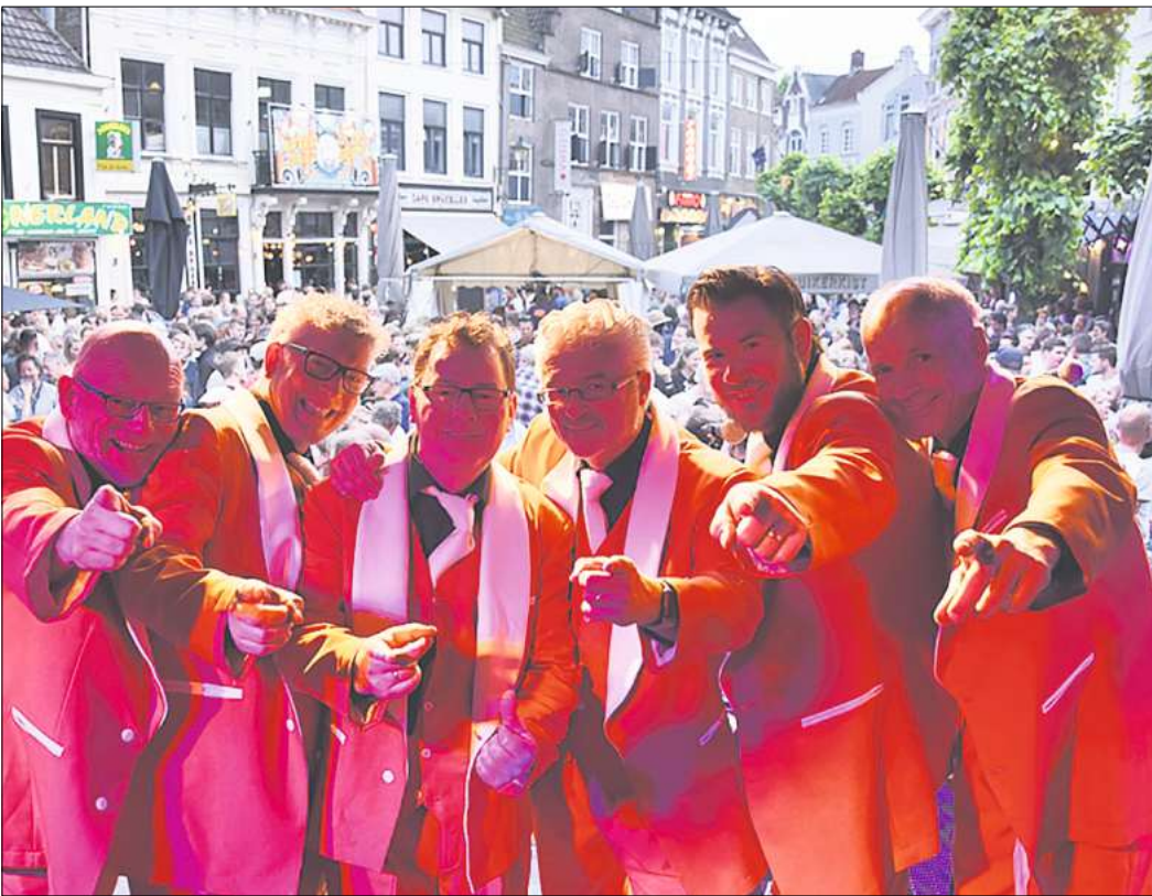
Die Jazz Connection kommt am 16. Juli in den Rathausinnenhof.