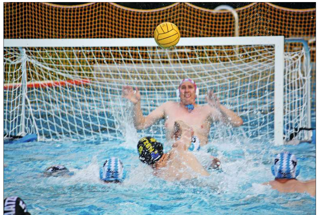
Die Wasserballer überzeugten gegen das favorisierte Team aus Laatzen.

15:9 – überraschender SVL-Sieg gegen Laatzen