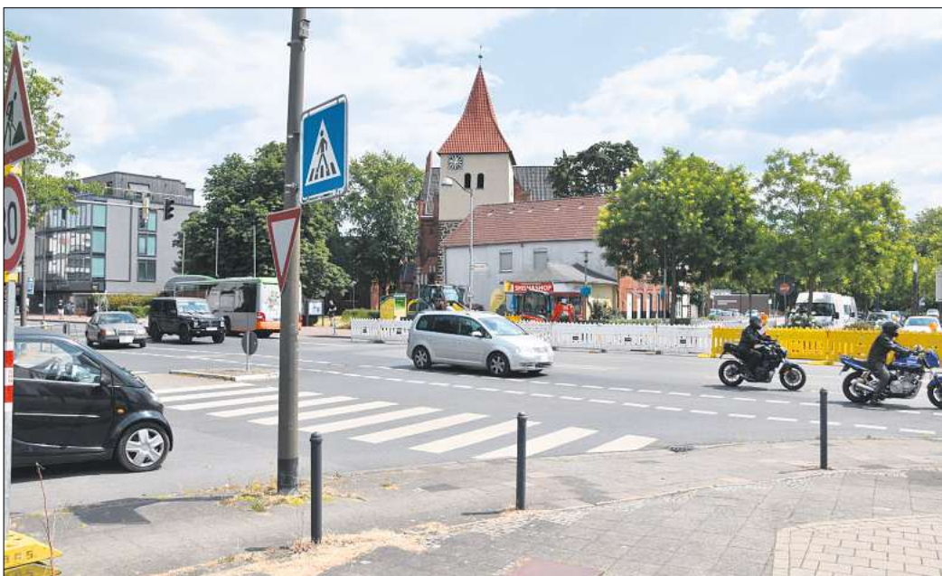
Hier entsteht ein Verkehrskreisel: die Einmündung der Niedersachsenstraße vor der Elisabethkirche.

Was bedeutet das für den Verkehr? Wegen des Umfangs der Arbeiten