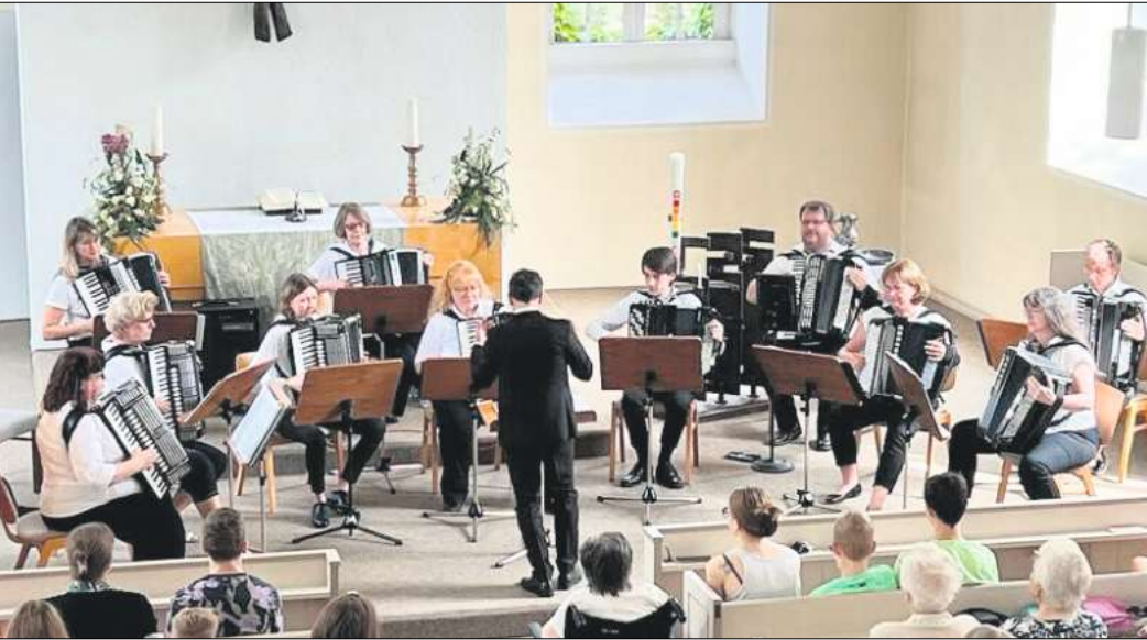
Erst nach zwei Zugaben entließ das Publikum das Orchester.