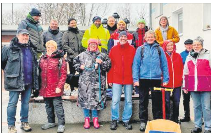
Die Truppe fühlte sich an der Ehre gepackt.

Der Tag klang nach einem leckeren Grünkohllessen, Wurftechnik und Strategiediskussionen während eines Dart-Matches, überaus entspannt und mit der Befriedigung aus, sodass eine neue Jahres-Auftakt-Tradition aus der Taufe gehoben wurde.