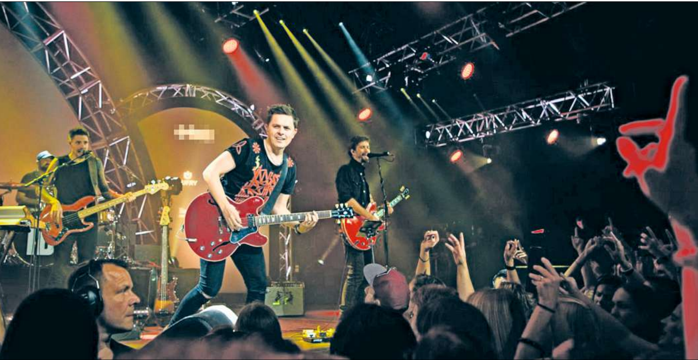
Michael Patrick Kelly tritt auf dem Burgdorfer Schützenplatz auf.

Burgdorf. Auf seiner „B•O•A•T•S Open Air Tour“ macht der irisch-amerikanische Popsänger Michael Patrick Kelly Station in Burgdorf. Sein Auftritt beginnt am Sonnabend, 9. September, um 20 Uhr auf dem Schützenplatz. Es ist sein einziges Open-Air-Konzert in Norddeutschland. Michael Patrick Kelly war als Mitglied der legendären Familienband „Kelly Family“ schon im Teenager-Alter ein Star. Mit 18 Jahren hatte er bereits mehrere Welthits geschrieben, verkaufte mehr als 20 Millionen Alben, spielte Stadiontouren, teilte die Bühne mit Star-Tenor Luciano Pavarotti und trat beim legendären „Michael Jackson & Friends“-Konzert auf. Danach nahm er sich eine Auszeit von sechs Jahren und lebte in Stille als Mönch in einem Kloster in Frankreich, bevor er ins Musikgeschäft zurückkehrte. Sein Album „iD“ von 2017 war 94 Wochen in den deutschen Charts und bekam eine doppelte Platinauszeichnung. Michael Patrick Kelly war bei der TV-Sendung „The Voice of Germany“ und in drei Staffeln der Serie „Sing meinen Song“ zu sehen.