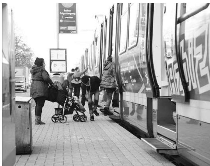
Einstiegsilfe: Mobilitätseingeschränkte Fahrgäste können ab April auch in Langenhagen Unterstützung von Fahrgastbegleitern erhalten.

Im Rahmen des Fahrgastbegleitservices sind Mitarbeiterinnen und Mitarbeiter der Üstra auf der Fahrt in den Regiobus-Linien dabei und unterstützen die Fahrgäste beispielsweise auf deren Weg zur Arbeit, zum Arzttermin und zu ihren Freizeitaktivitäten. Dabei helfen sie den Fahrgästen beim Ein- und Aussteigen sowie bei der Benutzung von Aufzügen, und sie melden Störungen. Das Verkaufen und Kontrollieren von Fahrscheinen machen die Mitarbeiter jedoch nicht. Wenn der Startpunkt oder Zielort im Umkreis von bis zu 500 Metern zur Haltestelle liegt, können sich