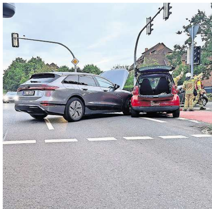
Einen Teil des Kreuzungsbereiches sperrten die Kräfte während des Einsatzes.

Nach rund einer Stunde verließen die Einsatzkräfte die Einsatzstelle.