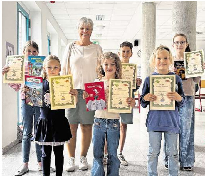
Mit Urkunden gewürdigt: Die beim Lesewettbewerb erfolgreichen Teilnehmer.

Gelesen wurden dabei altersgerechte und spannende Bücher,