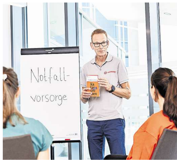
Ein Erste-Hilfe-Trainer der Johanniter erklärt die Grundlagen der Ersten Hilfe.

„Inhaltlich geht es darum, die praktische Fähigkeit der Bevölkerung zur Selbst- und Fremdhilfe in außergewöhnlichen Notlagen zu steigern“, sagt Antje Po-