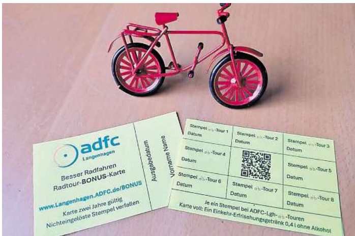
Vom ADFC empfohlen: Regelmäßige Teilnahme an den Veranstaltungen, dokumentiert in der Bonuskarte.

Um noch mehr Menschen zu diesem Mitfahren zu motivieren, gibt der ADFC Langenhagen jetzt eine Bonuskarte aus. Wer an acht geführten Radtouren teilnimmt, erhält als kleine Anerkennung ein Erfrischungsgetränk. „Die eigentliche Belohnung ist allerdings etwas anderes“, sagt Rein-