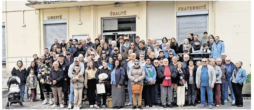
Gruppenbild der deutschen und französischen Teilnehmer vor dem Rathaus in Le Trait.

Höhepunkt des Jubiläumswochenendes war ein festlicher Abend im Zeichen der deutsch-französischen Freundschaft. In geselliger Atmosphäre wurden Erinnerungen ausgetauscht, langjährige Begegnungen gewürdigt und neue Kontakte geknüpft. Zahlreiche Reden unterstrichen die Bedeutung dieser Partnerschaft, die seit sechs Jahr-