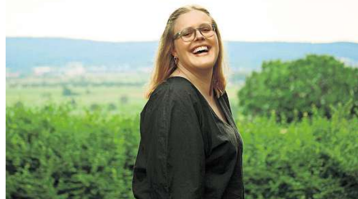
Autorin Nele Schumann.

Besonders wichtig war der Autorin Nele Schumann, nicht nur historische Fakten festzuhalten, sondern die Gefühle, Ängste