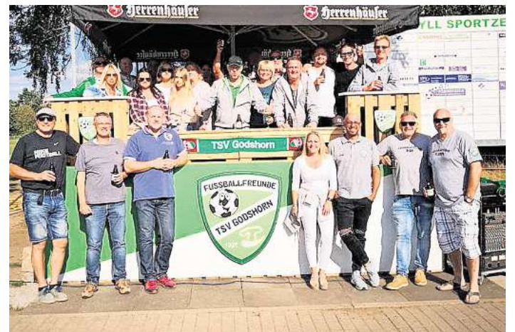
Eine eingeschworene Gemeinschaft, die zusammenhält: die Fußballfreunde des TSV Godshorn.

Kurz gesagt: Die Finanzierung der Jugendarbeit des TSV Godshorn basiert auf zwei Säulen – zum einen den Fußballfreunden, zum anderen dem Förderverein – er existiert schon seit 20 Jahren, kümmert sich zum Beispiel um Themen wie die Miete für Kunstrasenplätze, Renovierung von Duschen, Auswärtfahrten mit dem Vereinsbus oder auch mobile Jugendtore und helfen damit nicht nur der Fußballabteilung, sondern auch dem Gesamtverein. Dem TSV Godshorn greifen die Fußballfreunde auch gern unter die Arme, helfen bei der Fun-Olym-