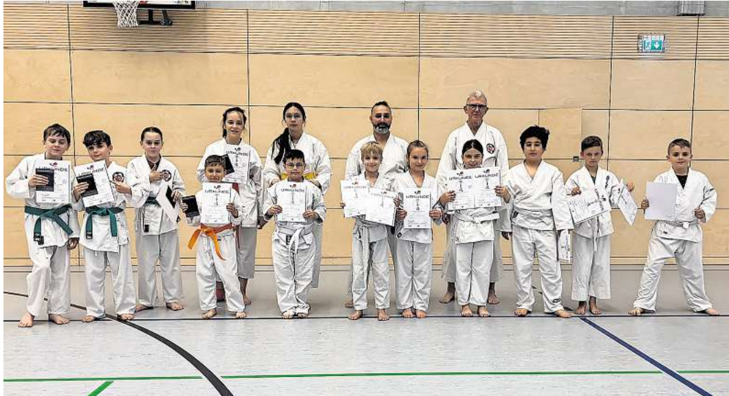
Gelungener Ablauf: Karate-Prüfung beim VfB Langenhagen.