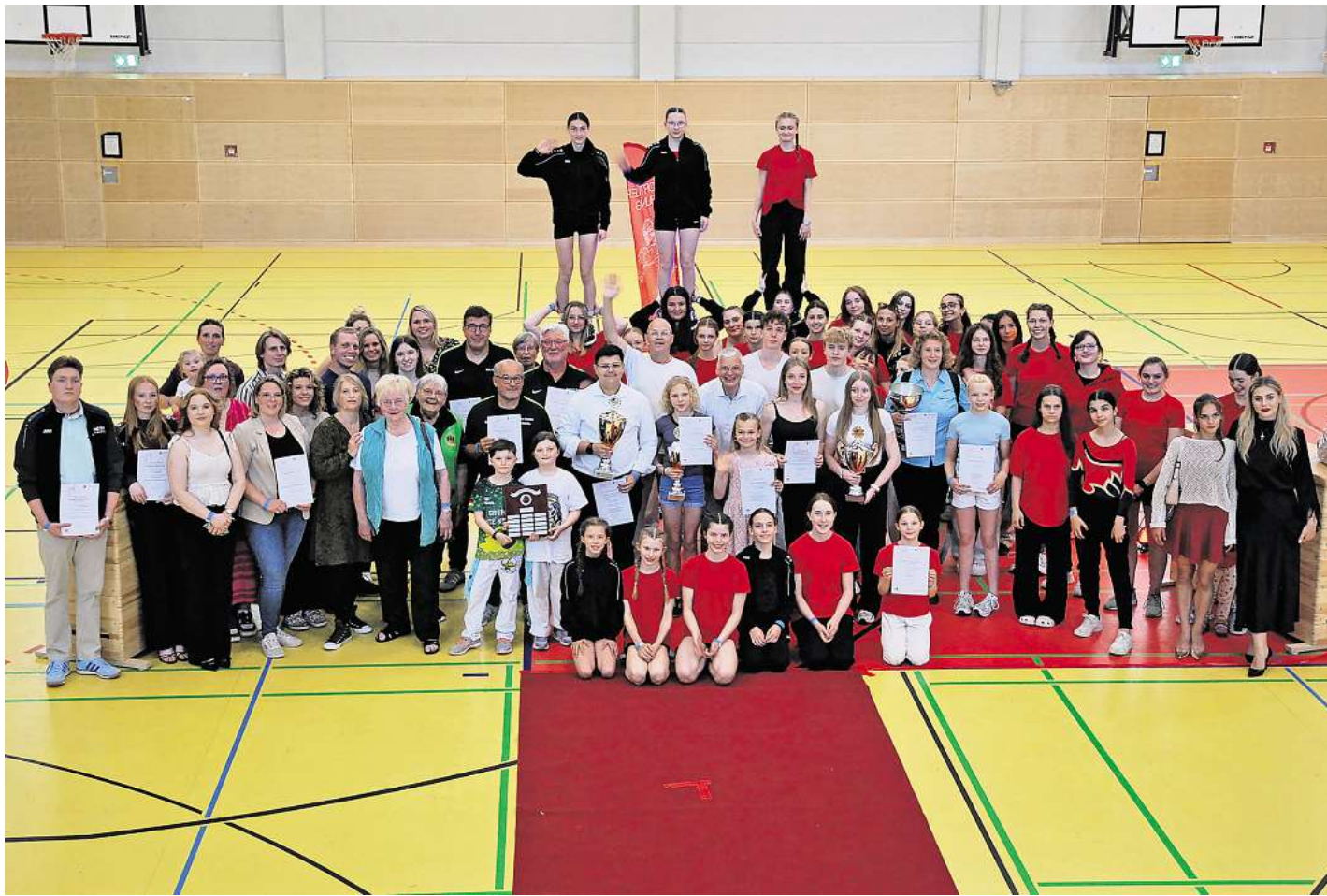
Alle Nominierten: Zwölf Teams und 25 Einzelpersonen standen für die verschiedenen Kategorien zur Auswahl.