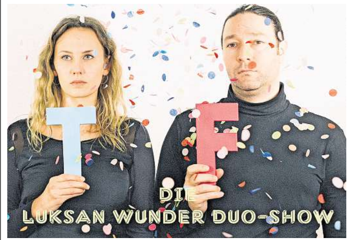
Eine absolute Ausnahmerecheinung in der Comedyszene: das vielfach ausgezeichnete Humorkollektiv Luksan Wunder.

Die Sparkasse Hannover hat in der Region Hannover insgesamt 108 Standorte. 46 davon sind mit Mitarbeiterinnen und Mitarbeitern besetzt.