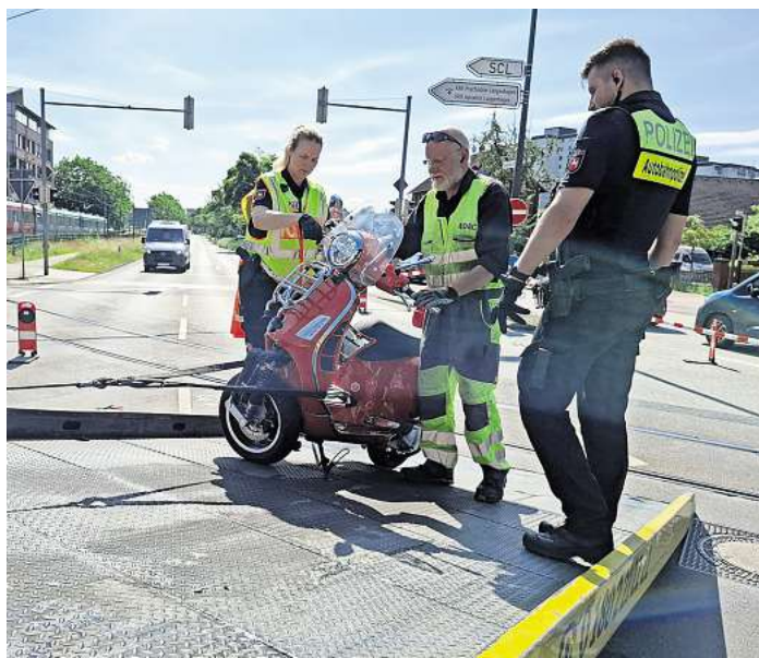
Abgeschleppt: Einsatzkräfte räumen den beschädigten Motorroller von der Straße.

Als der Mercedes-Fahrer als sogenannter Nachzügler wieder anfahren wollte, prallte der Vespa-Fahrer mit seinem Motorroller nach ersten Erkenntnissen gegen den Mercedes. Ob das Auto noch stand oder schon angefahren war, ist noch unklar. Der 39-Jährige stürzte und fiel auf den Boden. Er wurde schwer verletzt. Nach ersten Erkenntnissen erlitt er unter anderem mehrere Knochenbrüche. Der 59-Jährige sowie zwei Kinder (elf und zwölf Jahre), die ebenfalls im Auto saßen, blieben körperlich unverletzt.