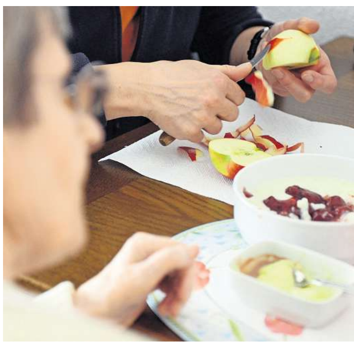
Die Pflegekasse zahlt unter bestimmten Voraussetzungen Rentenbeiträge für ehrenamtlich Pflegenden, wenn sie eine Person mit mindestens Pflegegrad 2 nicht erwerbsmäßig betreuen.

Die etwaigen Rentenbeiträge für Pflegepersonen betragen im Jahr 2026 zwischen 139,04 und 735,63 Euro - je nach erbrachter Leistung und Pflegegrad. Das entspricht laut DRV den Beiträgen, die Versicherte auch mit einem Job mit