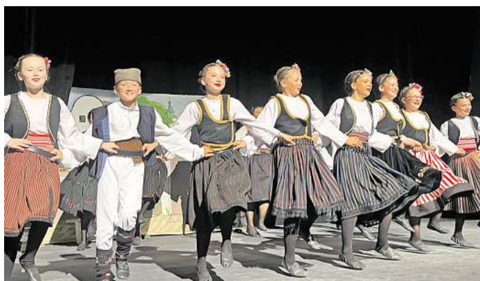
Die Folkloregruppe KUD Šove aus Ravno Selo in der Backa (Serbien) ist zu Gast.

Zu Gast ist die Folkloregruppe KUD Šove aus Ravno Selo in der Bačka (Serbien) – einer Region, in der seit Generationen Menschen verschiedener Kulturen, Sprachen und Religionen zusammenleben. Serben, Ungarn, Slowaken, Kroaten, Russinen und Donauschwaben haben dort gemeinsam eine einzigartige kulturelle Vielfalt geschaffen, die sich bis heute in Musik, Tanz und Traditionen widerspiegelt.