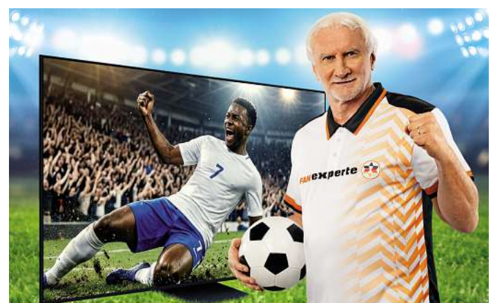
Das Gesicht der Kampagne ist Fußball-Legende Rudi Völler.

pert WM-Versprechen haben Fußballfans jetzt die einmalige Chance, ihr Wohnzimmer zur echten WM-Arena zu machen – und wenn unsre Jungs den Pokal nach Hause holen, gibt es den Fernseher am Ende sogar komplett gratis.“ Mit der Aktion macht expert die Vorfreude auf den großen Fußballsommer noch größer, denn große Spiele verdienen ein großes Bild, atemberaubende Farben, ultrascharfe Details und packenden Sound. Und wer sich jetzt für einen neuen Fernseher entscheidet, bekommt mit etwas Glück den kompletten Kaufpreis zurück. Auf jeden Fall ist ein besonderes WM-Erlebnis zuhause garantiert: Das Zittern vor dem Elfmeter, der Torjubel in letzter Sekunde oder die Gänsehaut während der Hymne. Mit dem richtigen Fernseher wird das Sofa zur Tribüne und jedes Spiel