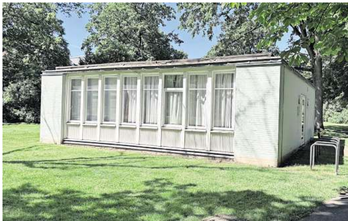
Soll weg: Das ist die Lesehalle im Stadtpark.

Und es ist schon klar, wie es weitergeht: Im Herbst sollen mehr als 30 Blutbuchen am Ende der gleichnamigen Allee gepflanzt werden, wie Birgit Karrasch von der Abteilung Stadtgrün und Friedhöfe mitteilt. Außerdem, so Karrasch, soll der Friedhof in den kommenden Wochen noch Spiegel-Stelen erhalten.