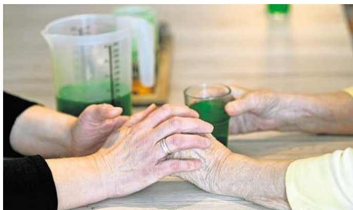
Mit beruhigenden Gesten können Angehörige einen Wutanfall dementer Personen auffangen.