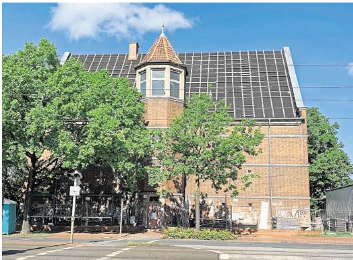
Arbeiten beginnen: Vor dem Hochbunker an der Walsroder Straße steht nun ein Bauzaun um das Gebäude und Arbeiter bauen auch das Gerüst vor der Fassade auf.

LANGENHAGEN (JAR). Der Hochbunker an der Walsroder Straße soll wieder eine Ziegeleindeckung bekommen. Die Arbeiten sollten eigentlich bereits im vergangenen Jahr beginnen. Durch Probleme mit der Ausschreibung und den langen Winter hatte sich das Vorhaben der Bundesanstalt für Immobilienaufgaben allerdings verzögert. Doch nun haben Arbeiter am Mittwoch begonnen, ein Gerüst aufzustellen. Die Sanierung, die Ende 2023 begonnen hatte und später unterbrochen wurde, soll fortgesetzt werden. Bis Ende des Jahres soll sie abgeschlossen sein.