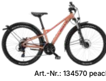
Art.-Nr.: 134570 peach