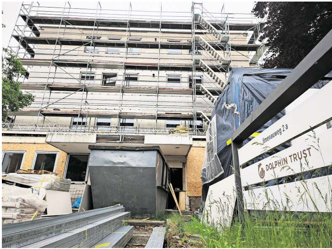
Umbau: Die ehemalige Zentrale der Dolphin Trust bzw. German Property Group wird jetzt ein Boardinghouse.

Auf der Baustelle laufen die Arbeiten auf Hochtouren. Augenscheinlich wird das ehemalige Bürogebäude derzeit aufwendig saniert. Später sollen dort lichtdurchflutete Apartments entstehen. Nach Angaben der Unternehmenswebseite der Taurus Immobilien Group GmbH ist das Boardinghouse zu rund 30 Prozent fertiggestellt. Hinweise auf die Vergangenheit des Standorts sind am Gebäude noch vereinzelt auszumachen. Das frühere Dolphin-Trust-Logo etwa ist unter der Hausnummer und auf dem Briefkasten zu erkennen.