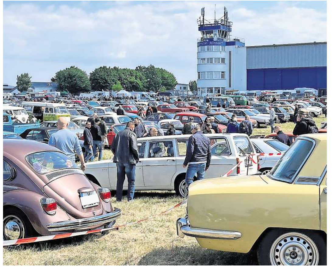
Technorama Hildesheim: ein Paradies für Oldtimer-Fans.

Ein besonderer Publikumsmagnet ist der historische Motorsport. Rund 250 Fahrerinnen und Fahrer gehen auf dem 2,7 Kilometer langen Rundkurs an den Start und zeigen in elf