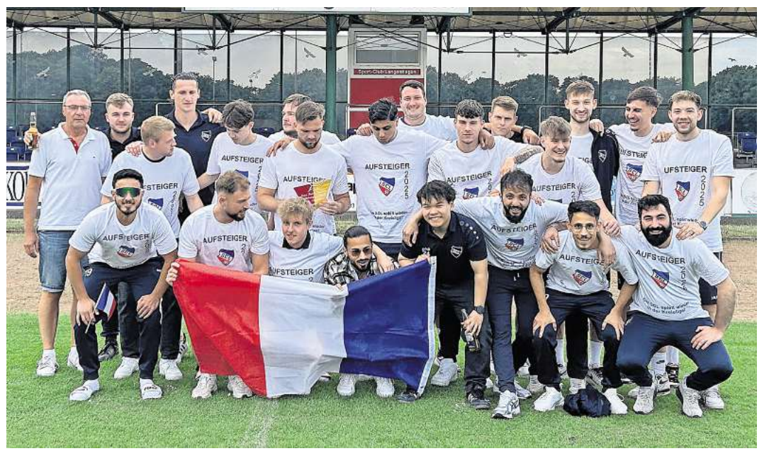
Die erste Herren des SC Langenhagen nach dem Aufstieg in die Kreisliga am Ende der Saison 2024/2025.

Nach einigen Spielerabgängen am Saisonende ist nun ein Neustart für die nächste Saison nötig. Es ist ein Umbruch in der Kreisliga, gegebenenfalls auch in der ersten Kreisklasse mit neuen Spielern und neuem Trainerstab geplant. Perspektivisch wird von Vereinsseite Fußball im „Bezirk“ angestrebt. Gesucht werden ausgebildete Spieler für alle Mannschaftsteile. Es sollen sich alle Fußballer angesprochen fühlen, die an diesem Projekt des traditionsreichen SCL mitmachen möchten. Willkommen ist jeder, der Spaß am Fußballspielen hat und dabei Wert auf Gemeinschaft und Teamgeist legt. Der Verein bietet außergewöhnlich gute äußere Bedingungen mit vier Rasenplätzen, zusätzlichen Trainingsflächen, eigener Sporthalle und einem Clubheim. Gesucht werden also sowohl ein neuer Trainerstab als auch erfahrene, ältere Spieler, vielleicht auch Wiedereinsteiger; genauso aber auch A-Jugendspieler, die erstmalig in den Herrenbereich wechseln und weiterhin Spaß am