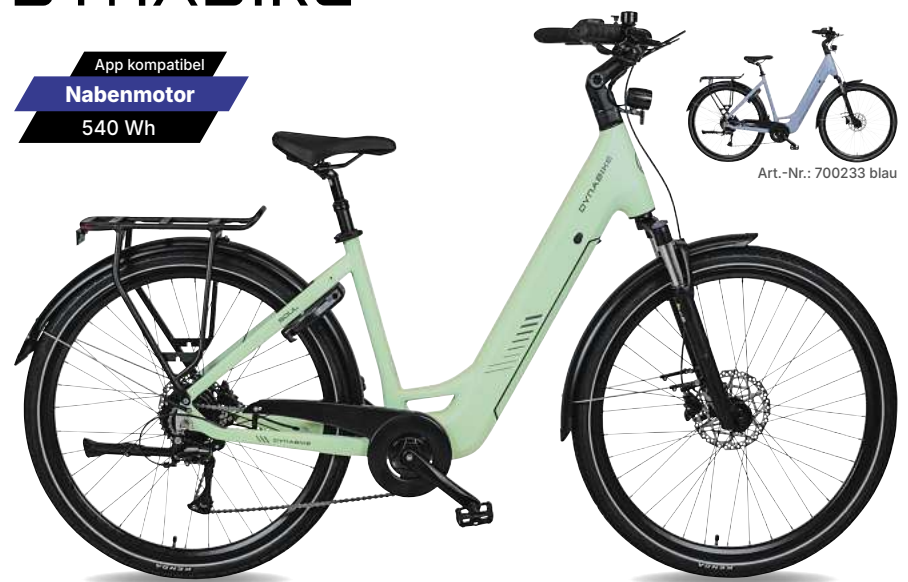
Art.-Nr.: 700233 blau