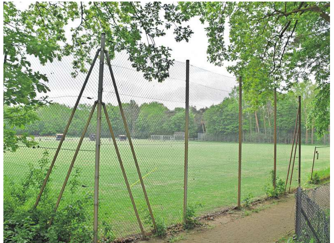
Hier kam es zur Massenschlägerei: Das Gelände des DJK Sparta Langenhagen an der Emil-Berliner-Straße.

Schmeißer betont allerdings, dass der Vorfall nichts mit einer Rivalität oder mit Hass zwischen den beiden Vereinen zu tun hatte