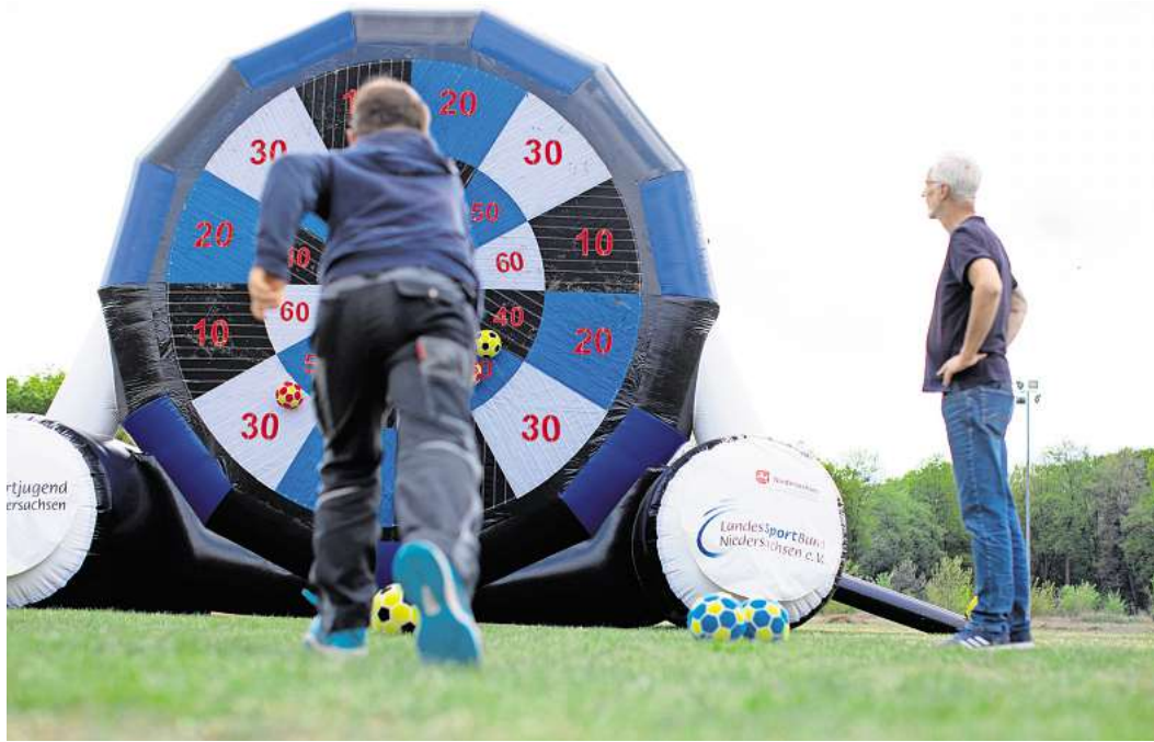
Sportarten auf unterschiedliche Weise ausprobieren: Das ist das Ziel des Inklusiven Sportfestes. Hier müssen Teilnehmende Bälle auf eine Scheibe werfen und möglichst hohe Punktzahlen erreichen.

Auf die Gäste warten zahlreiche Mitmach-Angebote: von Klettern an der Kletterwand