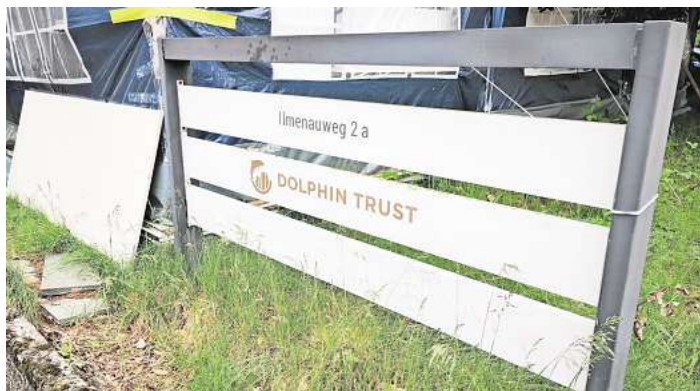
Dolphin Trust: Nur noch ein paar alte Schilder erinnern an den ehemaligen Firmenstandort.

Der 65-Jährige hatte vor Gericht ein umfangreiches Geständnis abgelegt. Im Gegenzug hatte die Staatsanwaltschaft die Anklage auf vier Fälle reduziert. Bis heute ist der Verbleib mehrerer Hundert Millionen Euro ungeklärt.