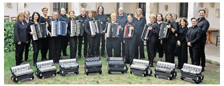
Das 1. Akkordeonorchester gibt ein Gastspiel in Mandelsloh.

Datum: Donnerstag, 4. Juni, 18 bis 21 Uhr im Café Monopol im Haus der Jugend.