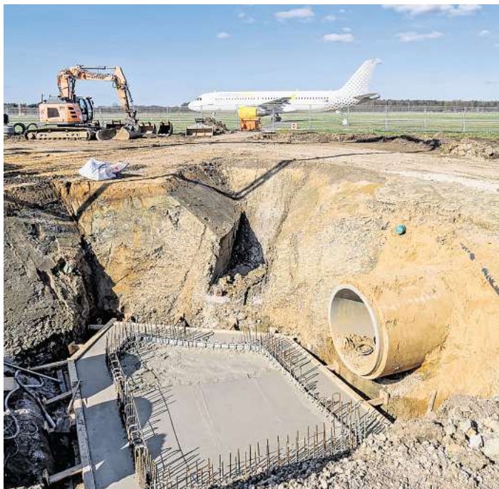
Sanierung der Nordbahn: Hier entsteht gerade ein technisches Betriebs- haus an der Nordbahn.

Um die Auswirkungen auf den Flugverkehr so gering wie möglich zu halten, erfolgte die Sperrung in direkter und sehr enger Abstimmung zwischen den zuständigen Behörden, der Deutschen Flugsicherung und dem Hannover Airport. Sie bestand zudem „ausschließlich für den Zeitpunkt der Sprengung“, nicht während der Vor- und Nachbereitung der Maßnahme. Für sowohl an- als auch abreisende Passagiere war der Flughafen durchgehend geöffnet, so die Sprecherin. Eine Gefahr habe weder für Reisende noch für Anwohner bestanden.