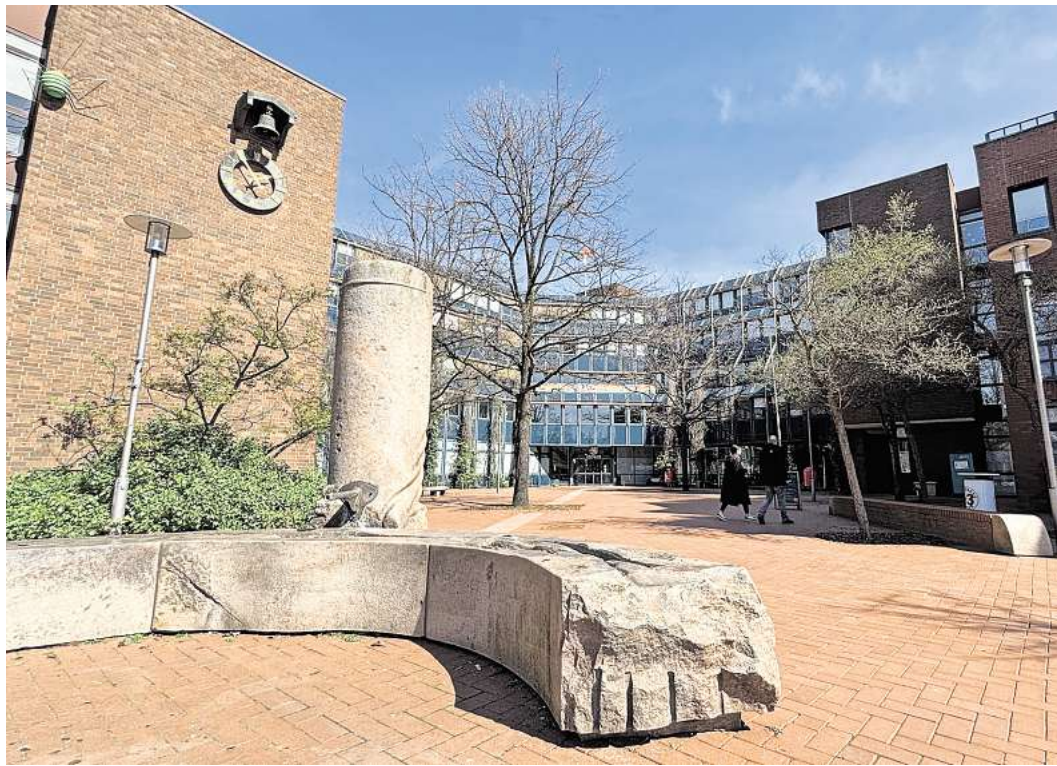
Eigener Herr: Das ist das Rathaus der Stadt Langenhagen.

Förderungen: Allein in den Jahren 2022 bis 2025 förderte die Region Hannover in Langenhagen den kommunalen Klimaschutz mit 65.000 Euro – beispielsweise das Kinderhaus in Kaltenweide mit 25.000 Euro (Photovoltaikanlage und Batteriespeicher). Insgesamt 16 Dach-Solar-Projekte unterstützte die Region von 2023 bis 2025 mit 251.000 Euro. „Außerdem gibt es eine direkte Unterstützung durch regionale Förderrichtlinien, beispielsweise für die Kita in Krähwinkel“, sagt Borschel. Mit dem Projekt „Hola Kita!“ begegnet die Region dem Fachkräftemangel in der Kinderbetreuung. Junge Menschen aus Spanien konnten in die Kitas der Re-