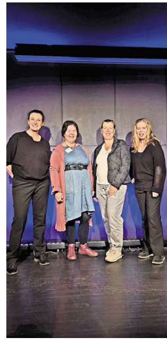
Die „Tabuanten“ überzeugten mit Humor, Feingefühl und Spontanität.

Ende 1985 zog der Verein UJZ vom Bunker dorthin um, löste sich dann aber zum 31. Dezember 2017 auf.