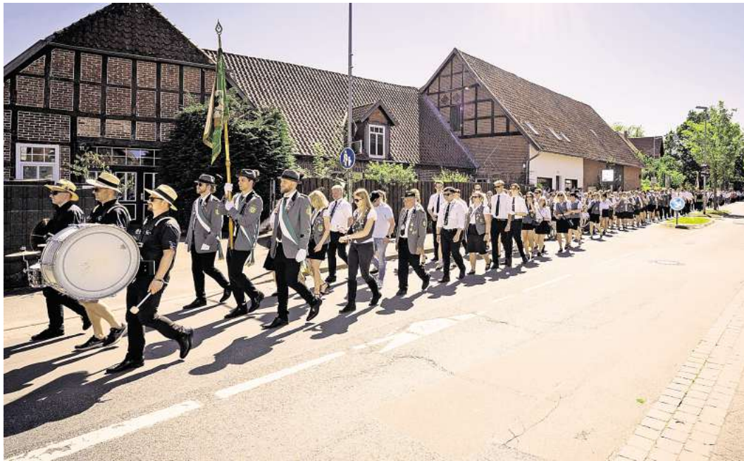
Der Ausmarsch ist fester Bestandteil des Kaltenweider Schützenfestes.

Besondere Vorkommnisse in polizeilicher Hinsicht gab es