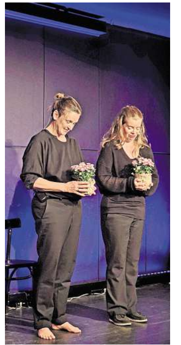
Sie schafften es immer wieder, das Publikum zum Lachen und Nachdenken zu bringen.