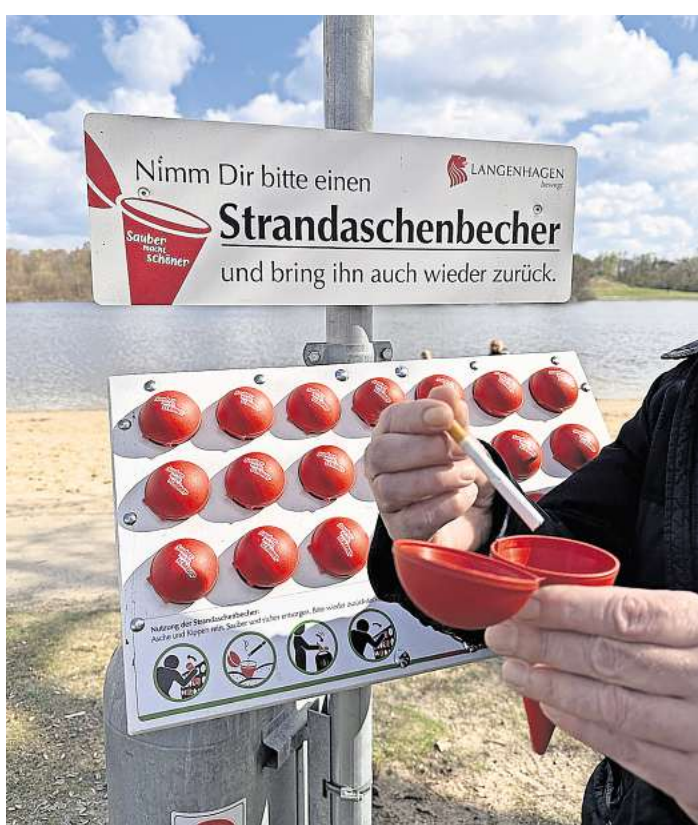
Dank der neuen Leih-Aschenbecher bleiben Strand und Liegewiesen sauber.

Die Stadt hat auf die negative Entwicklung reagiert und ihre Maßnahmen ausgeweitet. Neben einer verbesserten Beschilderung und klaren Hinweisen zur Entsorgung wurde die Präsenz des Ordnungsdienstes deutlich erhöht. Fünf Mitarbeitende sind künftig rund um den See im Einsatz, zwei weitere sollen folgen. Kontrolliert wird auch am Wochenende und außerhalb der üblichen Besuchszeiten. Zuvor waren lediglich zwei Kräfte