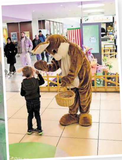
Der Osterhase kommt in das CCL.