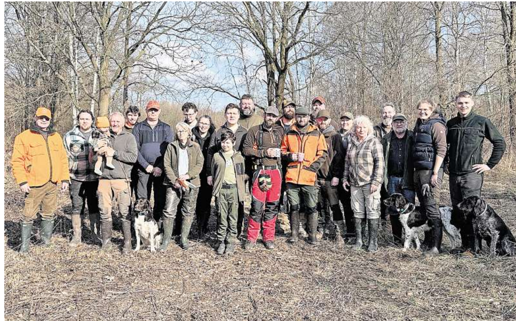
Die Helferinnen und Helfer.

men, um gemeinsam anzupacken und Verantwortung für „ihre“ Flächen zu übernehmen. Der Arbeitseinsatz wurde mit einem gemeinsamen rustikalen Mittagessen im Freien abgerundet, bei dem sich über viele weitere Themen und die kommenden Aktion des Hegerings ausgetauscht wurde.