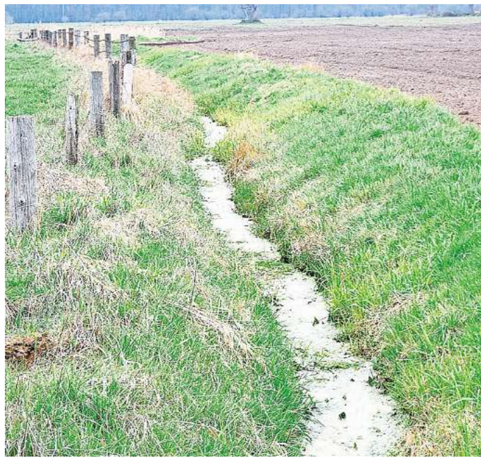
Der schmale Bach führt von Kananöhe in den Forst.

Mäandern in den Forst hinein deutlich, dass wir keinen Graben sondern einen Bach vor uns sehen. Immerhin hat sich ihre Breite schon verdoppelt. Der Weg führt weiter in den Kananhofer Forst, noch immer in Langenhagen. Zwischen den vom Moor kommenden Entwässerungsgräben ist die Auter hier nicht auffällig. Und auch, als sie unter jener Landstraße unterdurchfließt, die Langenhagen von Garbsen trennt und auf Osterwalder Gebiet weiterfließt, bleibt sie unscheinbar. Doch hier mehren sich die Zuläufe und ganz langsam verbreitert sich der kleine Wasserlauf. Der Resser Graben und die Brunnenbeeke entwässern in die Auter, der „Graben am Großen Weg“ kommt dazu. Westlich von Otternhagen fließt die Auter auf Neustädter Gebiet und kommt dem Ort nahe, nachdem sie benannt ist. Die Quellen sind sich nicht einig: Ist Otternhagen nun nach der Auter benannt?