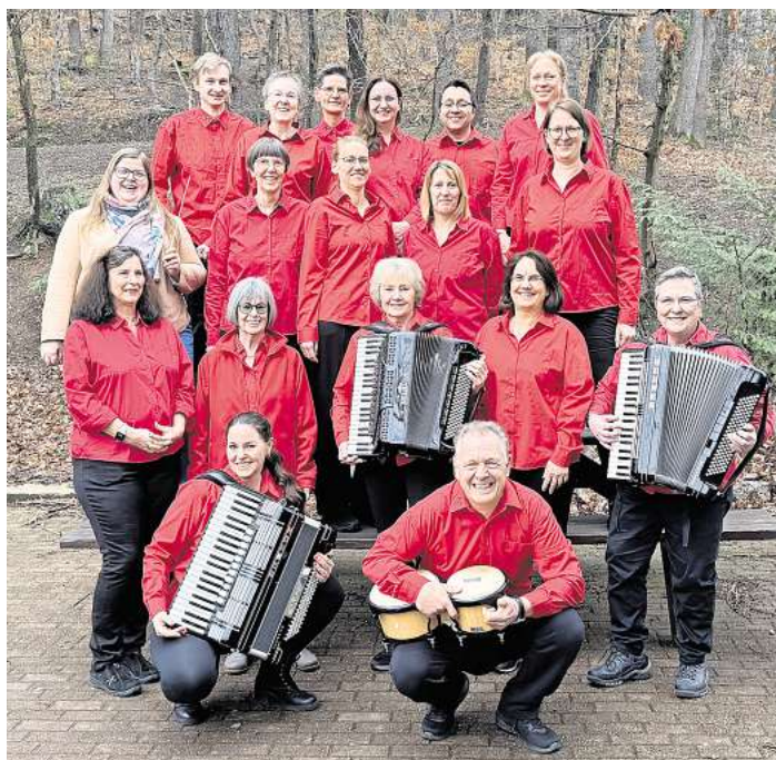
Freude beim Proben hatten die Akkordeonfreunde.