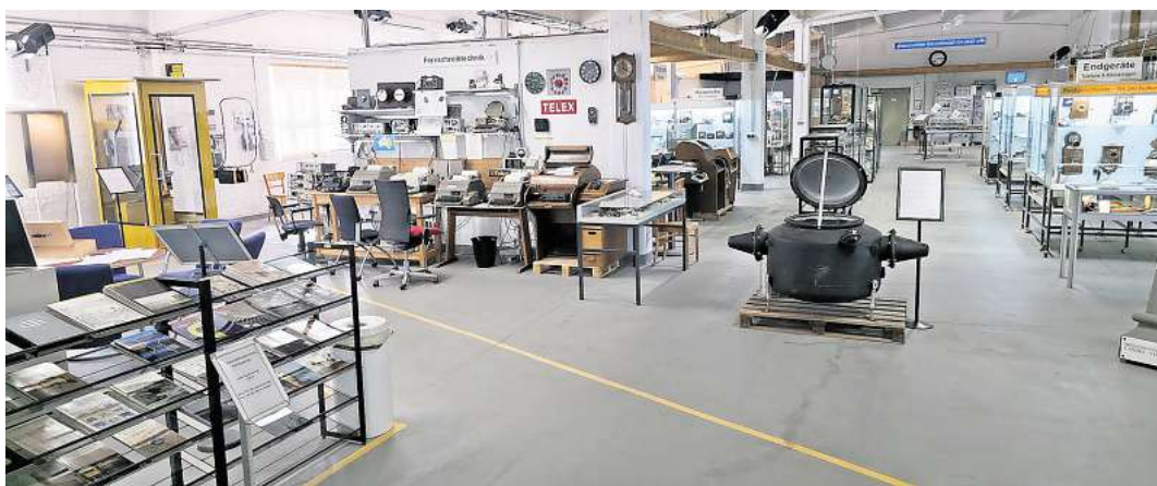
Besonders die Telex-Abteilung mit ihren zahlreichen funktionsfähigen und miteinander verbundenen Fernschreibern erfreut sich großer Beliebtheit.

Das Museum ist bequem mit einer der im 20-Minuten-Takt verkehrenden historischen Straßenbahnen erreichbar – Ausstieg direkt an der Haltestelle „Hohenfels Süd“. Weitere Informationen gibt es unter www.fernmeldecub.de .