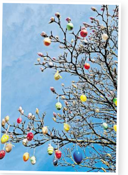
Herrlich-bunt bei Sonnenschein.

Man sollte denken, dass sie nicht die Zielgruppe für verspielten Festtagsspaß sind, doch der Kommentar war eindeutig: „Das sieht ja toll aus“, habe einer der Männer festgestellt. Die Magnolie hat am Sonntag vor Ostern voll geblüht – zum Fest wird diese Blütenpracht wohl schon verfliegen sein. Nicht jedoch die österliche Farbenpracht der bunten Eier, die bleibt, auch wenn die Blüten gefallen sind.