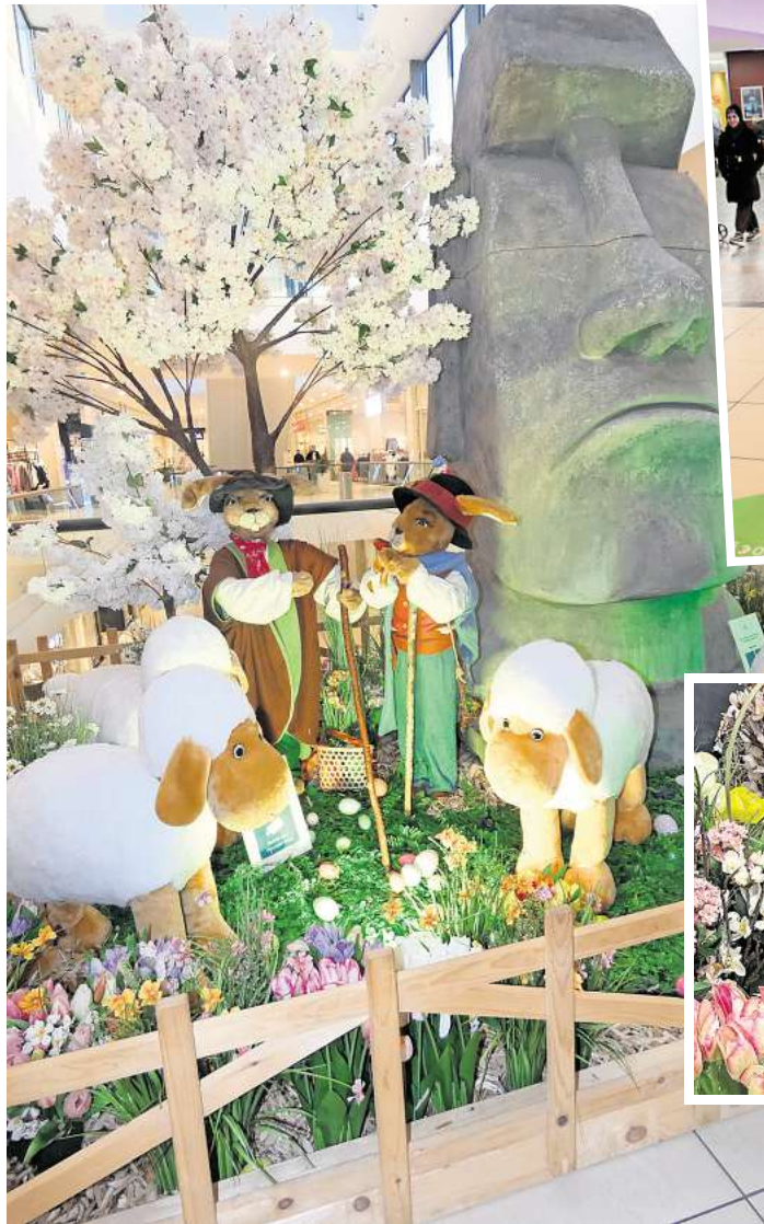
Haben Osterhasen die monumentalen Figuren auf den Osterinseln gebaut? Die Deko im CCL liefert einen Beweis für diese Theorie...

Schaut man die Dekoinseln in Langenhagens Einkaufszentrum an, dann entwickelt sich eine Theorie dazu, wie die geheimnisvollen monumentalen Figuren auf den Osterinseln entstanden sein könnten. Im CCL sind es Häschen, die eine Figur rosa anstreichen. Auf der nächsten Dekoinsel finden wir eine typische Steinfigur, die von einer Hasenschäferin und einem Hasenschäfer samt Tieren bewacht wird. Und überall zu den Füßen der Figuren wimmelt es nur so von bunten Frühlingsblumen und bunten Ostereiern. Diese Deko macht Spaß und auch Erwachsene bleiben gern davor stehen, um immer neue Details zu entdecken. Damit kann man doch am Tag vor Ostern noch einmal wunderbar Ostervorfreude tanken!