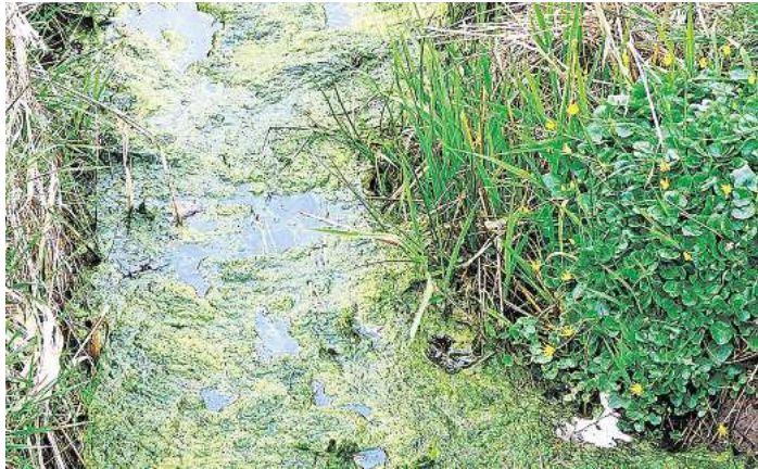
Die Geodaten stimmen: Hier soll eine Quelle sein.

man in der flachen Landschaft erst spät. Wir sind einem Flusslauf gefolgt, der auf wenigen Kilometern anschaulich zeigt, wie aus einem kleinen Rinnsal ein veritabler Fluss wird. Dort, wo er durch verschiedene Zuläufe schon unübersehbar ist, hat er auch Straßennamen geprägt. Den „Auterkamp“ in Otternhagen und den Feldweg „An der Auter“ kurz hinter Scharnhorst. Wir haben auch gesehen, wie der Mensch einst in den Bachlauf eingegriffen hat - und wie er heute versucht, die Natur durch neu angelegte Windungen nachzuahmen. Kehren wir noch einmal zum Ursprung zurück. Hier, wo kein Sprudeln, kein Hinweisschild, die Quelle kennzeichnet, beginnt sie. Auch wenn die Langenhagener nicht viel von ihr wissen - ein paar Dörfer weiter ist der Bach zum Fluss geworden und sogar landschaftsprägend!