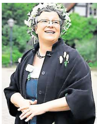
Jungfer Anni in ihrem Kostüm.

Euro pro Person / 2,50 Euro für Kinder ab 6 Jahren. Eine telefonische Anmeldung ist unter: 0175-9636571 bei Anja Hemme erbeten. Treffpunkt ist die Treppe Bürgerhaus, Am Markt 1, 30900 Wedemark