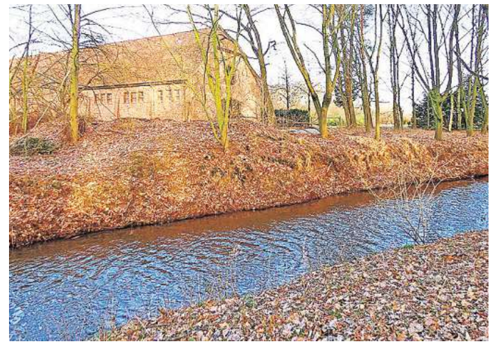
Bei Otternhagen: Das sieht schon ganz anders aus.

den wir wenig munteres Mäandern. Hinter Otternhagen trifft man dann plötzlich auf ein ganz anderes Bild: 2017 hat der Unterhaltungs- und Pflegeverband „Untere Leine“ Windungen geschaffen, die den Bachlauf wieder interessant für Tiere machen, die im und am Wasser leben. Rund 100.000 Euro hat es gekostet und wurde durch Mittel von EU, Bund und Region bezahlt. An dieser Stelle ist ihr Volumen schon kräftig angewachsen, nachdem weitere Gräben hinzugeflossen sind. Außerhalb von Wiechendorf in der Wedemark und südlich von Otternhagen haben sich unterdessen Bäche auf