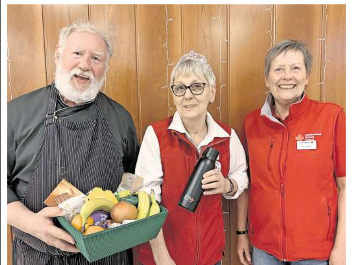
Gratulation zur 100. Blutspende.

platz der Elisabethkirche. Anmeldungen sind per E-Mail unter annemarie.schacherer@nabu-langenhagen.de zu erbeten. Am 19. April bietet die Kräuter- und Erlebnispädagogin Edyta Pawlak-Graßmann eine Kräuterführung im Eichenpark an. Besonderes Augenmerk gilt den essbaren Kräutern, die gerade jetzt im Frühling in unseren Parks zu finden sind. Treffpunkt ist am Wasserturm in Eichenpark, Anmeldungen bitte unter alexandra.pekul@nabu-langenhagen.de bis spätestens 16. April. Beide Veranstaltungen sind kostenfrei, um eine Spende für den Naturschutz wird gebeten.