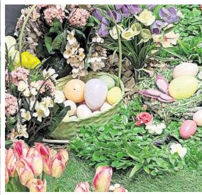
Hübsch bis ins kleinste Detail - die Osterdeko im CCL.