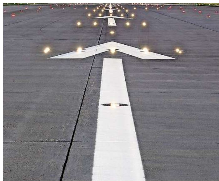
Die Nordbahn ist gesperrt.

Das Bauprogramm der Nordbahnmodernisierung umfasst insgesamt drei Bauphasen an der nördlichen Start- und Landebahn und beinhaltet auch Entwässerungsanlagen, Befeuerungstechnik und Energieversorgung.