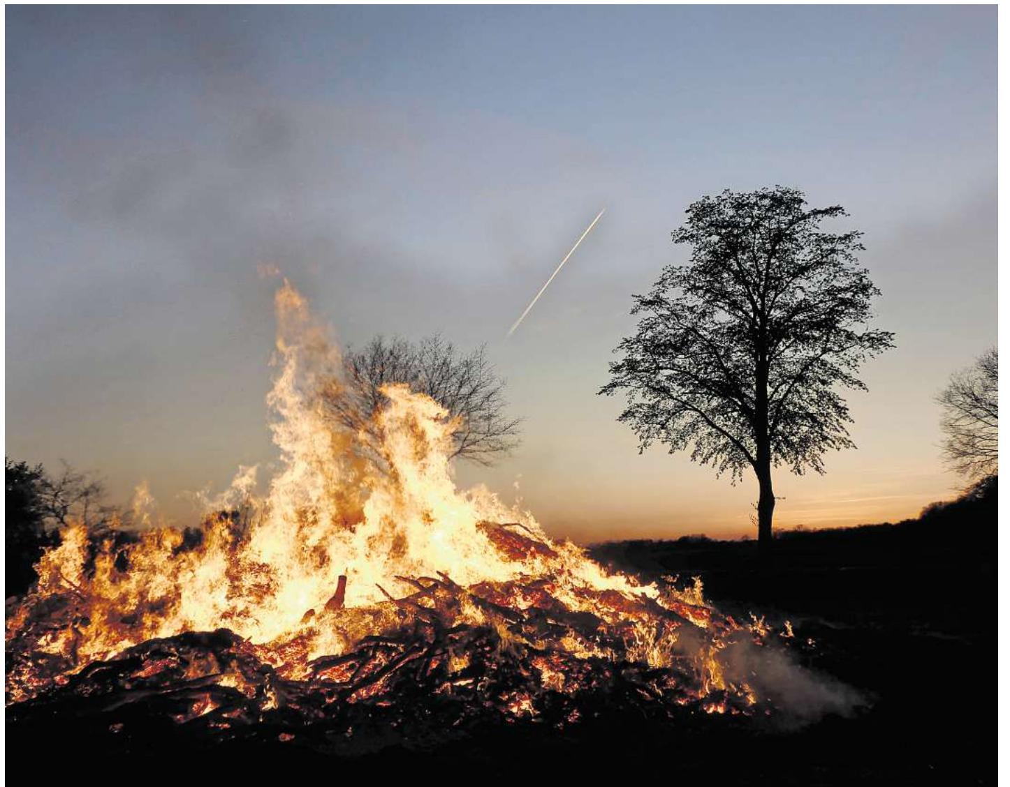
Warmer Feuerschein zu Ostern.