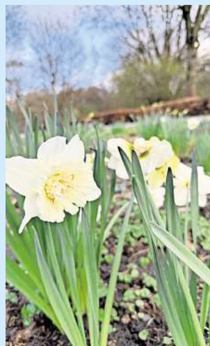
Pünktliche Blüte zu Ostern.

In diesem Jahr passt es: Die meisten Narzissen in den Heestern blühen pünktlich zu Ostern und laden ein zum Spaziergang. Auch die Blausternchen haben ihre Pracht noch nicht verloren. Ob die große Magnolie zu Ostern ebenfalls blüht – das hängt vom Wetter ab. Aber die gelb-weiß leuchtenden Osterglocken-Rabatten zeigen sich im Blütenglanz!