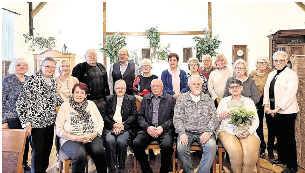
Viele Geehrte konnten Präsente entgegennehmen.