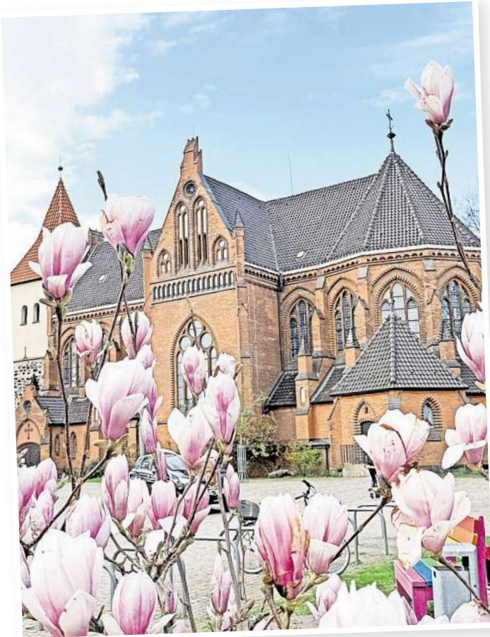
Die Elisabethkirche im Frühlingslicht.

In Langenhagen kann man die Osternacht in der evangelischen Elisabethkirche am Ostersonntag ab