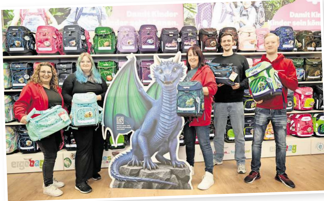
Das Ranzenmaxx-Team freut sich auf den Großen Schulranzentag.

So gibt es zum Beispiel einen neuen Easy-Click-Verschluss an den beliebten Ergobag-Modellen Cubo und Cubo light, der ein einfaches Öffnen und Schließen des Schulranzens ermöglicht. Auch das Sortiment von Step-by-Step wurde erweitert, unter anderem um das Modell „FIT“, das sich mit