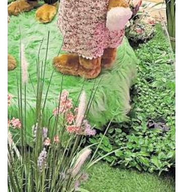
Fröhlich tanzen die Osterhasen im CCL.