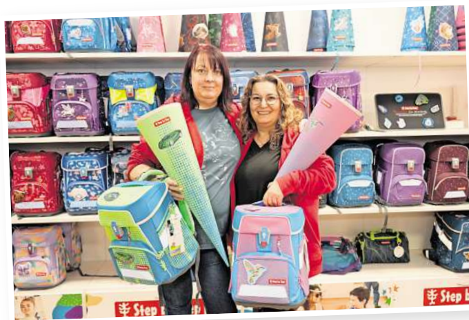
Eine große Auswahl an Schulranzen und Schultüten gibt es unter anderem von Step by Step.