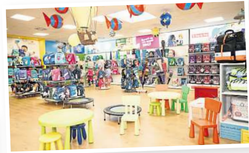
Schulranzen, Rucksäcke und vieles mehr in riesiger Auswahl gibt es beim Ranzenmaxx in Langenhagen.

Ranzenmaxx Langenhagen Walsroder Str. 78 30853 Langenhagen Telefon (05 11) 23 55 55 80 www.ranzenmaxx.de