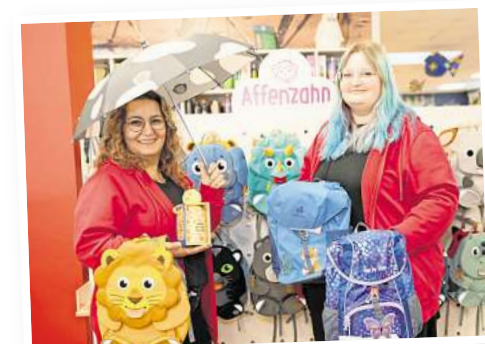
Auch für die ganz Kleinen gibt es viel zu entdecken, unter anderem von Affenzahn.