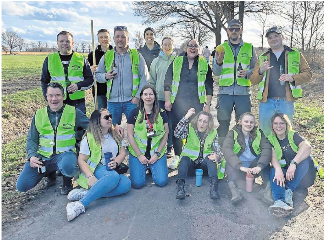
Das Boßel-Event verbindet viele Frauen und Männer aus dem Ort.