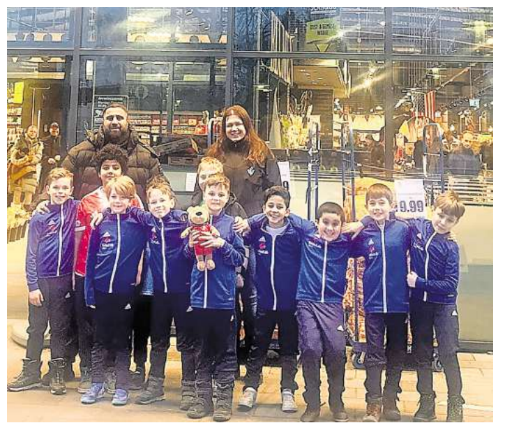
Die F-Jugend des SC Langenhagen sagt Dankeschön.

Möglich macht das eine Pfandbon-Spende von Edeka Cramer an der Walsroder Straße. Insgesamt sind 430 Euro zusammengekommen.