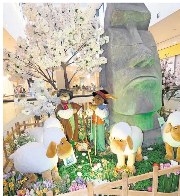
Die großen Steinfiguren der Osterinseln - phantasievoll nachgebaut.