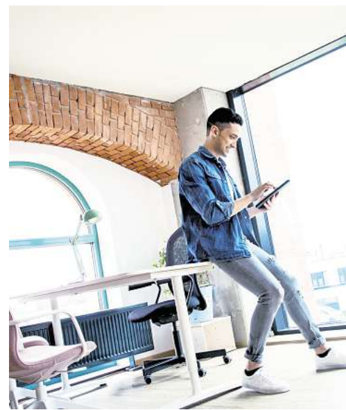
Mit der Reduzierung der Arbeitszeit können zwar Steuervorteile einhergehen, es wirkt sich aber negativ auf die späteren Rentenansprüche aus.

zeit um 25 Prozent auf 30 Stunden reduzieren, sinke auch das Bruttoeinkommen entsprechend auf 2.625 Euro. • Abzüglich Steuern von 234,63 Euro und Sozialabgaben von 555,20 Euro blieben immerhin noch 1835,17 Euro netto übrig. • Obwohl der Bruttolohn also um 25 Prozent sinkt, reduziert sich der Nettolohn um nicht einmal 21 Prozent.