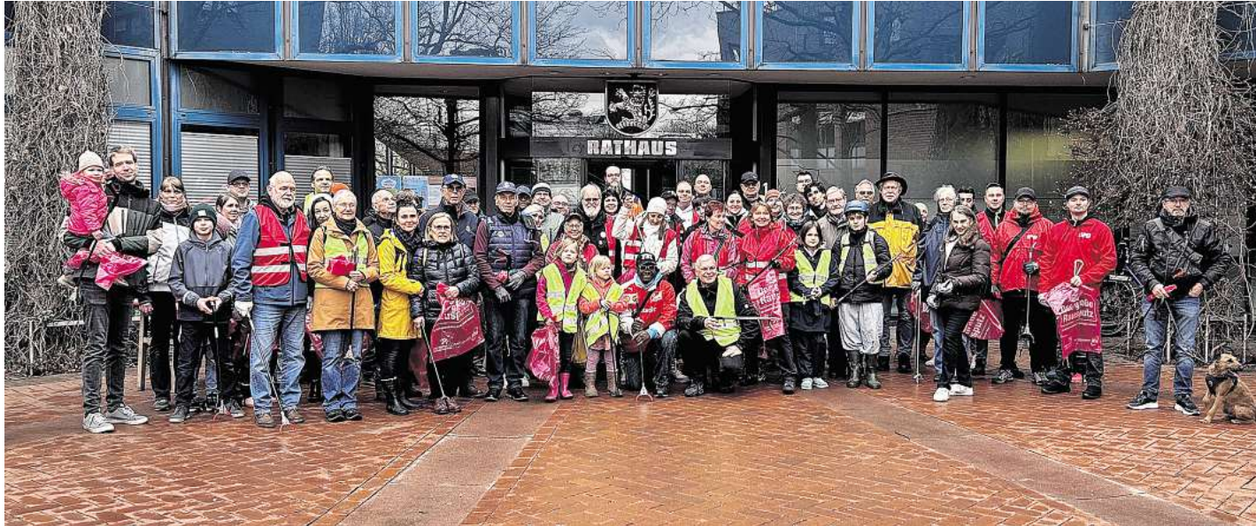
70 fleißige Helferinnen und Helfer hatten sich in der Kernstadt zum Frühjahrsputz getroffen.

Frühjahrsputz in der Langenhagener Kernstadt