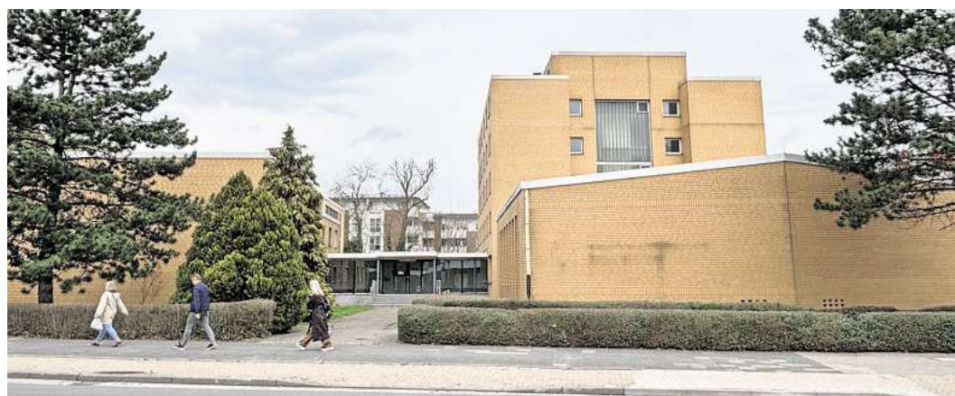
Filetstück mit unbestimmter Zukunft: Es sieht so aus, als würde die Stadt Langenhagen das Gelände der 2023 aufgegebenen Schornsteinfegerschule kaufen.