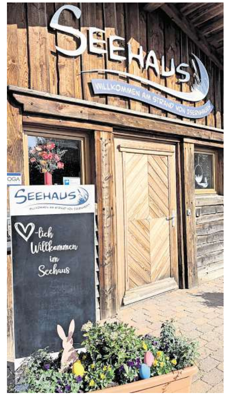
Frühling am See - mit besonderen kulinarischen Attraktionen.

Unter dem Motto „Die Eier sind los“ werden im Biergarten zahlreiche bunte Eier versteckt. Die Aufgabe für die Gäste: alle Eier erblicken und zählen. Wer die richtige Anzahl nennt, hat die Chance auf einen Gutschein für zwei Personen zum Brunch im Seehaus. Das Seehaus Isernhagen freut sich auf Gäste und verspricht einen abwechslungsreichen Start in die Frühlingssaison.