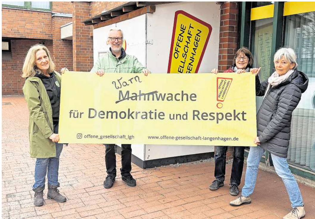
Mahnwachen reichen nicht mehr aus, daher lädt die Offene Gesellschaft Langenhagen zu Warnwachen auf den Marktplatz ein.

„Von wegen schweigende Mehrheit ... Gemeinsam laut für