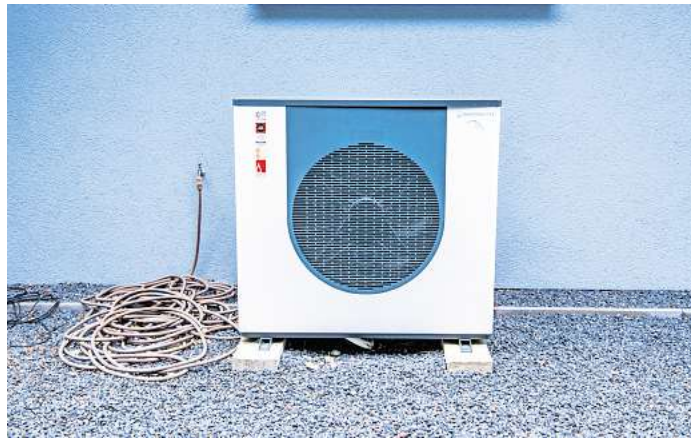
Moderne Wärmepumpen sind leiser als früher: Mit unter 50 Dezibel arbeiten sie so leise wie ein Geschirrspüler.

In Neubauten sind Wärmepumpen laut VZNRW inzwischen Standard und die derzeit am häufigsten eingesetzte Heiztechnologie. Aber auch wer im Altbau wohnt, kann über eine Wärmepumpe als Alternative zur Gas-Heizung nachden-