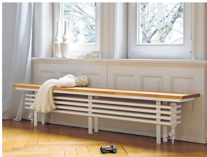
Kuscheliger Platz am Fenster - eine Heizung mit Sitzgelegenheit macht es möglich.

In einem Bestandsbau ist die Lage jedoch etwas anders: «Da ist ein Ortswechsel des Heizkörpers zwar möglich. Meist ist dieser aber aufwendiger, weil dafür oft auch die Heizungsrohre neu verlegt werden müssten», erklärt Kiryk.