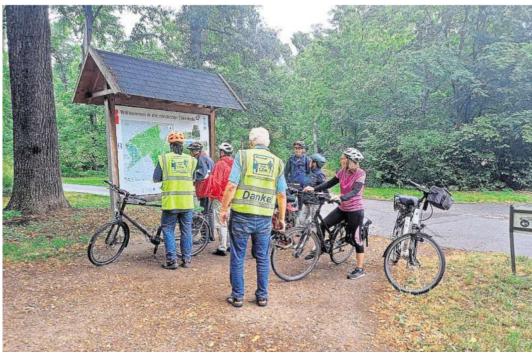
Ein herzliches ADFC-„Danke!“ geht an alle, die bei Radtouren mitmachen UND auch an alle, die im Verkehr Rücksicht aufeinander nehmen.

Neben den Freizeit- und Kulturturen engagiert sich der ADFC Langenhagen auch für bessere Bedingungen für den Radverkehr und eine sichere Mobilität vor Ort. Der ADFC lädt alle Interessierten ein, einfach mitzufahren und mitzumachen und die vielfältigen Aktivitäten kennenzulernen. Alle Termine und Touren stehen, mit laufender Erweiterung und Ergänzung im ADFC-Terminlender: https://www.langenhagen.adfc.de/termine