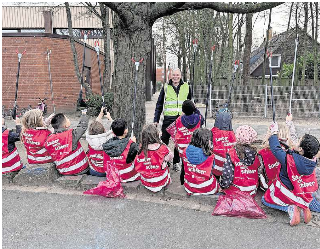
Der Frühjahrsputz ging auch an der Grundschule Godshorn über die Bühne.

Insgesamt kamen in diesem Jahr rund 300 Säcke voll Müll sowie einige Sperrmüllfunde wie ein Bettkasten, Autoreifen oder eine Turnmatte zusammen. Diese Summe wird erstmalig auch in die Gesamt-Müll-Menge des World Cleanup Days zählen, die nach dem Aktionstag im September veröffentlicht wird.