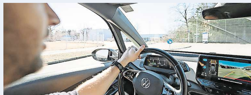
Die Rundumsicht ist besonders bei modernen Fahrzeugen oft eingeschränkt.

Nach Einschätzung des ADAC spielen mehrere Faktoren eine Rolle. Breitere A-Säulen erhöhen häufig die Stabilität der Karosserie und verbessern den Insassenschutz bei Unfällen. Flacher geneigte Frontscheiben sorgen außerdem für bessere Aerodynamik. Gleichzeitig treiben Design-trends die Entwicklung voran: höhere Fensterlinien und große Motorhauben erschweren den Überblick.