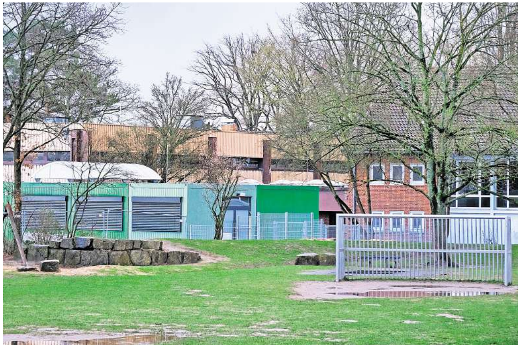
Schwerer Unfall: Beim Spielen auf dem Dach einer Turnhalle an der Grundschule Godshorn stürzte eine 11-Jährige am Donnerstag durch ein Oberlicht. Auf dem Gelände der Schule sind drei Sporthallen durch niedrigere Gebäudeteile verbunden (Kuppeln hinter den grünen Containern).

Wie die Kinder auf das Dach gelangt sind, bleibt zunächst unklar. Auf Anfrage der Redaktion wollten weder die Stadt Langenhagen als Träger noch die Schulleitung die wohl dringlichste Frage beantworten. „Zu möglichen Sicherungsmaßnahmen können wir uns derzeit nicht äußern, da der Sachverhalt Gegenstand laufender Ermittlungen ist“, erklärt Stadtsprecher Ralph Gureck. Aus Sicht der Polizei handelte es sich eindeutig um einen Unfall. „Strafrechtliche Ermittlungen gibt es daher keine“, so Oliver