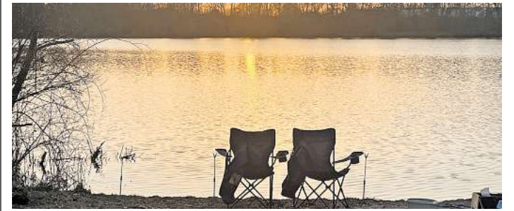
Der Schulenburger Südsee: ein Paradies für Angler.

westen der Flughafenstadt zu sehen. Und die Natur erwacht. Die Gewässerbewirtschaftung übernimmt der Angelverein Schulenburg. Die Fischarten, die im Schulenburger Südsee hauptsächlich vorkommen, sind vorwiegend Aale, Barsche, Hechte, Zander, Schleien und verschiedene Weißfischarten.