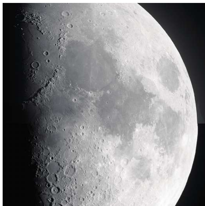
Der Astronomietag am Sonnabend, 28. März, widmet sich dem kosmischen Nachbarn der Erde.

Weitere Informationen unter www.fertighauswelt.de/baufruehling