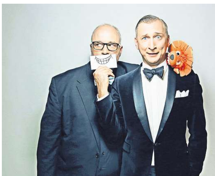
Sorgen für einen charmanten und frechen Bühnenabend: die Salonlöwen.

bisheriges Konzept aus musikalischer Parodie, Wortwitz und satirischen Texten an.