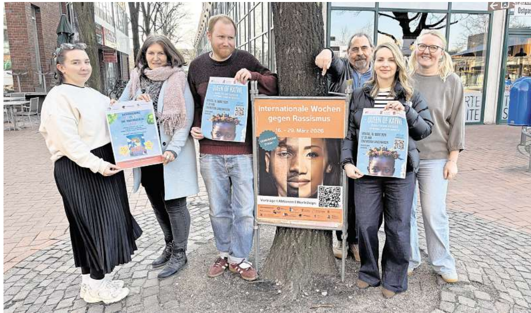
Die Stadt Langenhagen beteiligt sich mit einem umfangreichen Programm.