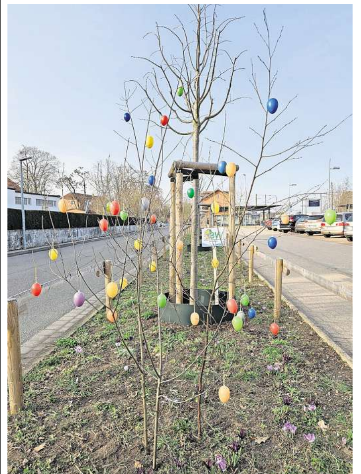
Osterschmuck des BVV.

Allein kleinere Vandalismuschäden kosten schnell vier- oder fünfstelligen Summen. Geld, das an anderer Stelle – etwa für Bildung oder Ausstattung der Schulen – sinnvoller eingesetzt wäre. Es würde bewusst ein örtlich begrenzter Pilotversuch gewählt. Die Verwaltung will prüfen, ob die Technik tatsächlich hilft, Schäden zu vermeiden und Konflikte frühzeitig zu entschärfen. Darüber hinaus wird untersucht, ob ähnliche Systeme künftig auch an anderen sensiblen Orten sinnvoll sein könnten. Dazu zählen etwa weitere Bereiche des Schulcampus oder Standorte im Umfeld von Bahnhöfen.