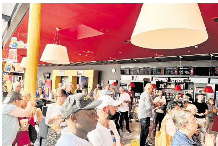
Die Einladung der Ehrenamtlichen ins Cinemotion für Montag, 13. April, steht.

Gemeinsam wollen alle einen bunten Abend verbringen und das Ehrenamt hochleben lassen. Bei einem Glas Sekt wird angestoßen und im Anschluss ge-