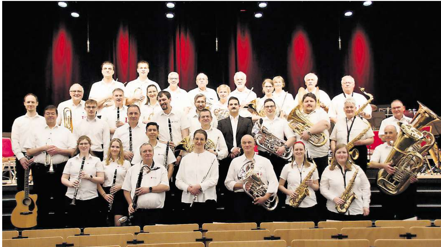
Präsentiert jetzt seine musikalischen Fortschritte: das Blasorchester der Stadt Langenhagen.

Blasorchester der Stadt Langenhagen lädt für Sonntag, 22. März, um 17 Uhr zum Jahreskonzert in den Theatersaal ein