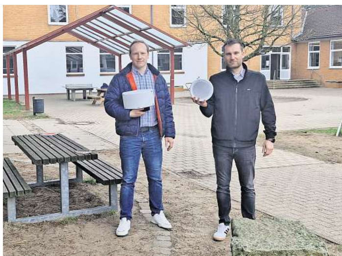
Ein neues Radarsystem an der Realschule im Kampf gegen Vandalismus.

Das System wird nur außerhalb der Öffnungszeiten des Campus W genutzt. „Uns ist wichtig, Sicherheit zu erhöhen und gleichzeitig die Persönlichkeitsrechte