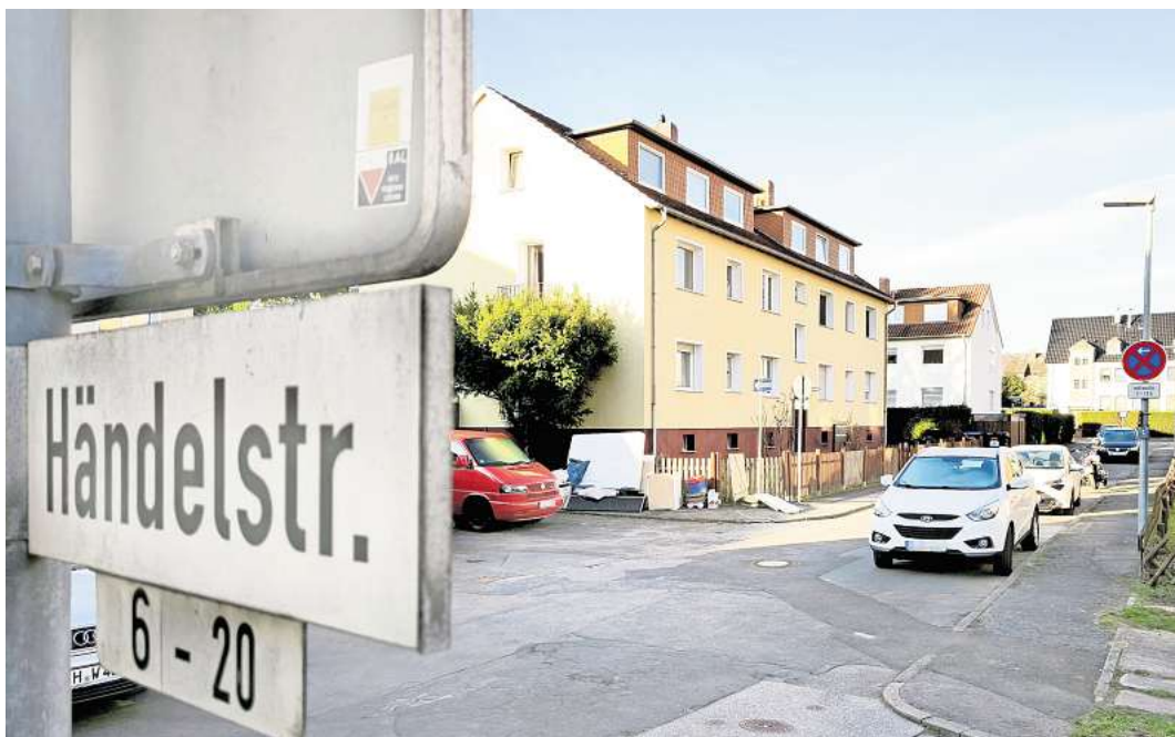
Weniger Parkplätze: Nach der Sanierung des Abschnitts zwischen Bachstraße und Wendehammer stehen fünf Stellplätze weniger als bisher zur Verfügung.

Die Polizei Langenhagen bittet Zeugen, die etwas Verdächtiges beobachtet haben oder Hinweise geben können, sich unter der Telefonnummer (0511) 1094215 zu melden.