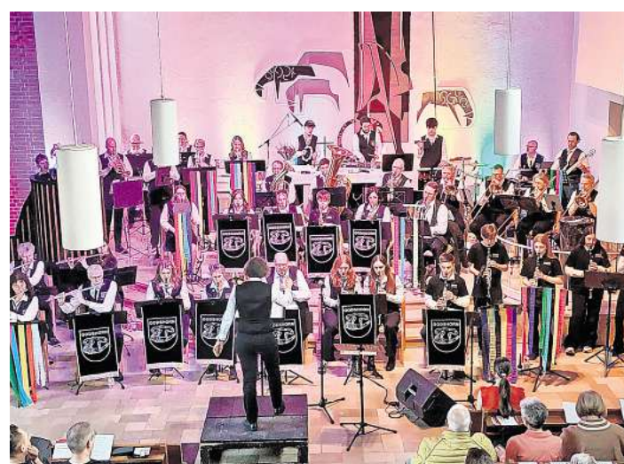
Der Musikverein Godshorn präsentierte sein breitgefächertes Repertoire.

Immer wieder versprühte das Bläserorchester „Gute Laune“, nach dem Motto von Ben Zuckers Song „Was für eine geile Zeit“. Aus dem Genre der Rockmusik wurde der Titel Don't Stop Me Now interpretiert. Mit „Smooth“ von Carlos Santana wurde ein Arrangement eines Musikers aus den Reihen der Freiwilligen Feuerwehr Godshorn