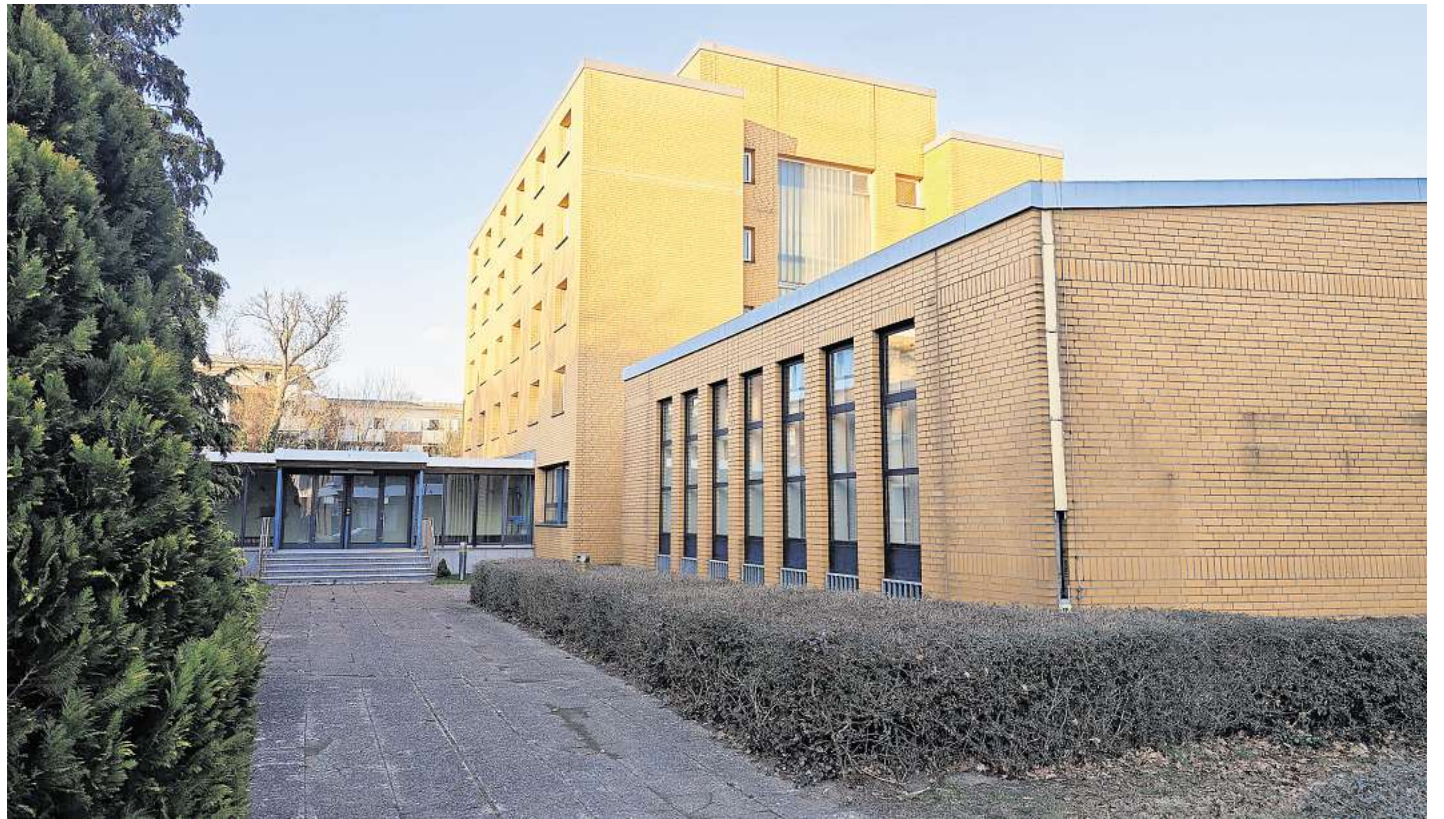
Möchte die Stadt ankaufen: Die ehemalige Schornsteinfegerschule an der Konrad-Adenauer-Straße in Langenhagen.

Das Stadtentwicklungskonzept 2030 (ISEK) weist das Gelände als eine der bedeutendsten innerstädtischen Entwicklungsflächen aus. In Langenhagen gibt es nach wie vor einen hohen Wohn-