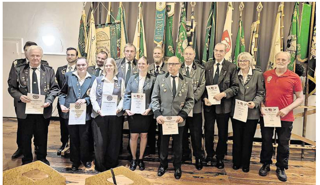
Mit Ehrennadeln ausgezeichnet wurden zahlreiche Schützinnen und Schützen des Kreisverbandes.

Vor dem offiziellen Teil standen zunächst die Ehrungen im Mittelpunkt, auch in diesem Jahr wurden wieder zahlreiche Schützinnen und Schützen für ihr langjähriges und besonderes Engagement mit den unterschiedlichen Ehrennadeln ausgezeichnet, ebenso wurden die Trophäen für sportliche Leistungen verliehen. Den Wanderadler für den Verein, der im vergangenen Geschäftsjahr den größten Zuwachs ver-