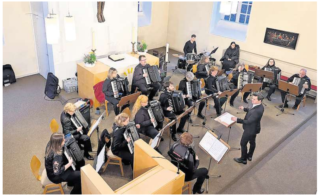
Das Publikum nahm das Programm mit großer Aufmerksamkeit und sichtbarer Begeisterung auf.

Oper, Melodien aus der „West Side Story“, „Out of Africa“ sowie „Can You Feel the Love Tonight“ aus Der König der Löwen – wurden vom Publikum mit großer Aufmerksamkeit und sichtbarer Begeisterung aufgenommen. Zum düster-romantischen Finale erklang ein musikalischer Querschnitt aus dem Musical „Tanz der Vampire“. Spätestens hier hielt es viele Zuhörerinnen und Zuhörer nicht mehr auf den Bänken: Das Publikum erhob sich zum Schluss von den Plätzen und spendete langanhaltenden stehenden Applaus. Erst nach Zugaben konnte das Konzert schließlich beendet werden. Weitere Informationen zum Akkordeon Club Langenhagen 74 e.V. sowie zu kommenden Auftritten finden Interessierte auf den Social-Media-Kanälen des Vereins bei Facebook und Instagram. Ein „Follow“ lohnt sich!