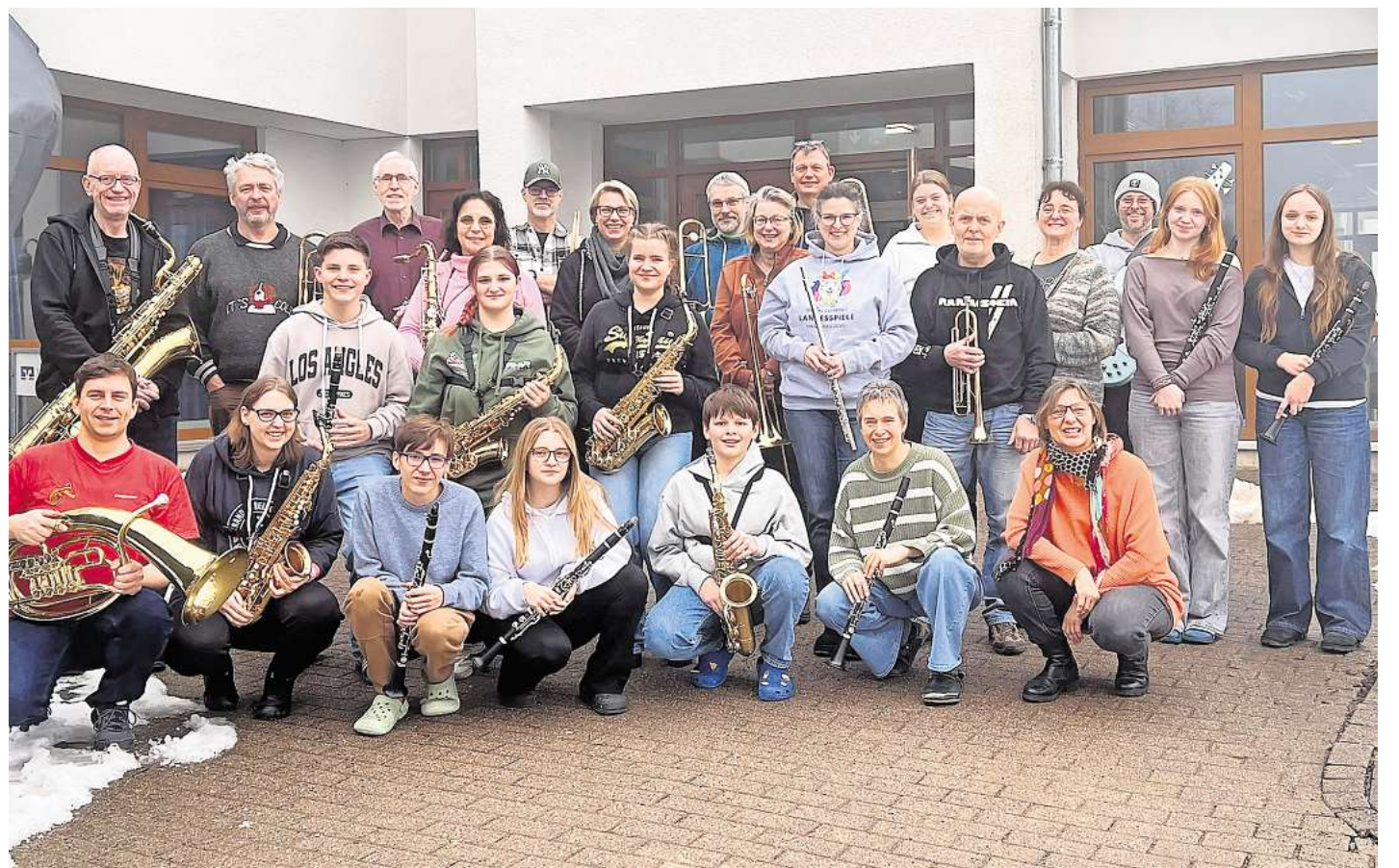
Abschlussfoto von einem gelungenen Probenwochenende in Lauenstein bei Salzhemmendorf am Ith.

wuchsbereich „Go Music“. Sie werden zudem auch selbst einen eigenen Auftritt erhalten. Das Konzert findet am Sonnabend, 7. März, in der Kirche „Zum Guten Hirten“ in Godshorn statt. Beginn ist um 17 Uhr, Einlass ab 16.30 Uhr. Der Eintritt ist frei, Spenden sind willkommen.