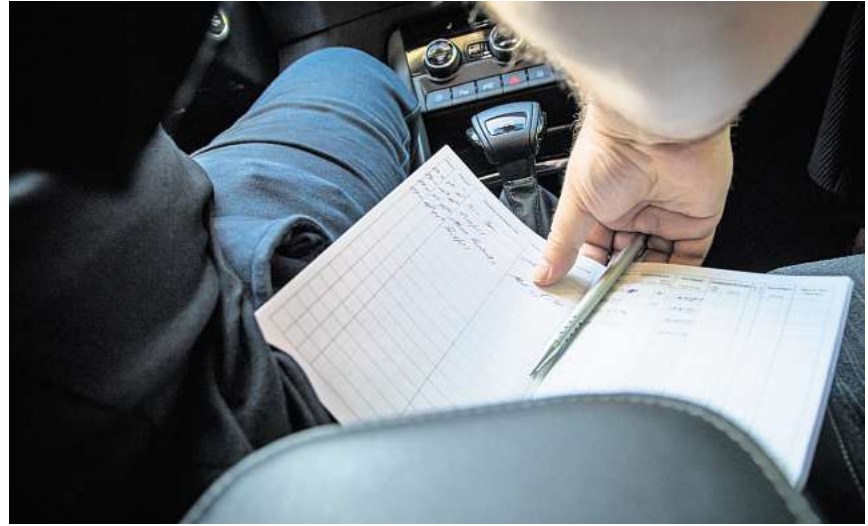
Kann sinnvoll sein, wenn der Dienstwagen nur selten für private Fahrten genutzt wird: das Führen eines Fahrtenbuchs.