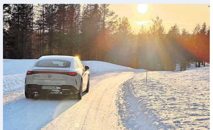
Wenn die Sonne im Winter tief steht, steigt für Autofahrer die Blendgefahr.