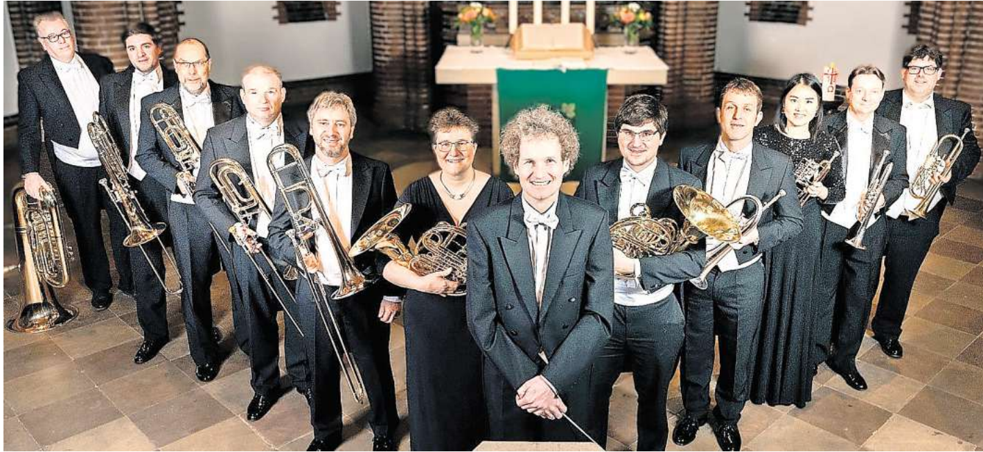
Hannover Brass gastiert am 15. Februar in der Elisabethkirche.

Hannover Brass tritt am Sonntag, 15. Februar, um 17 Uhr in der Elisabethkirche auf