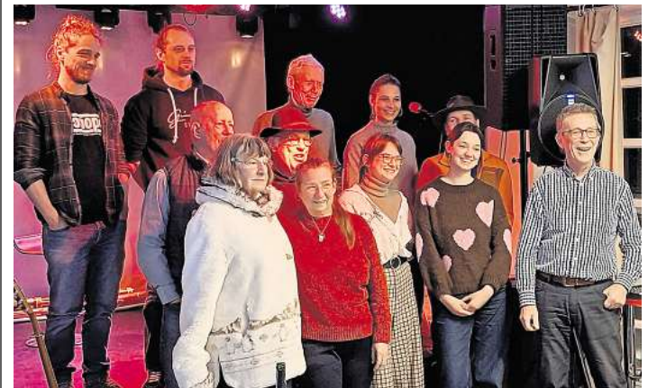
Künstler und Veranstaltungsteam.

Der nächste Abend ist für Montag, 23. Februar, geplant und enthält bereits heute ein volles variationsreiches Programm. Wie immer Eintritt frei. Reservierungen unter andy@kulturring-langenhagen.de