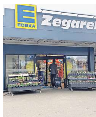
Steht noch nicht fest: Wie es mit dem Edeka-Märkten in Engelbostel und Godshorn weitergeht.