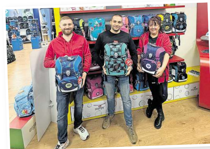
Unsere Favoriten von DerDieDas