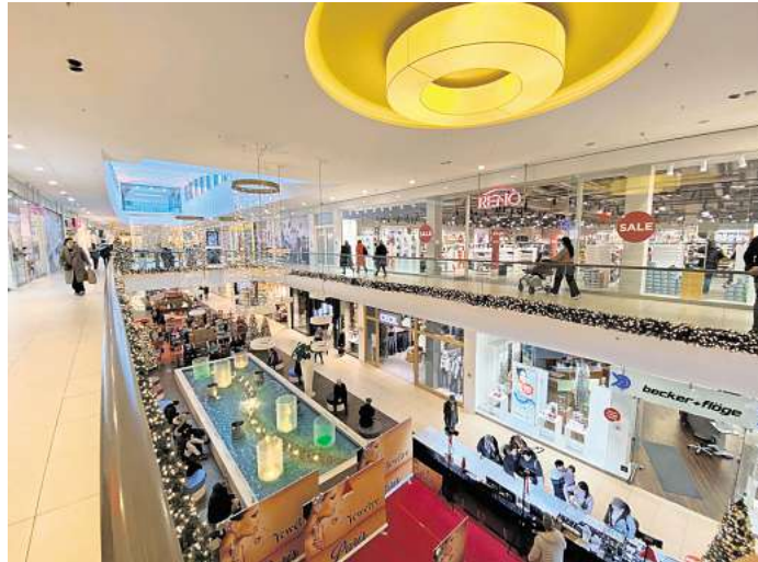
Freie Fläche zwischen Reno und Two by Two: Dort zieht 2026 ein neuer Mieter ein.

Neues Angebot: Für Existenzgründer und zum Test neuer Konzepte bietet das Centermanagement 2026 einen Pop-up-Store zu attraktiven Konditionen im