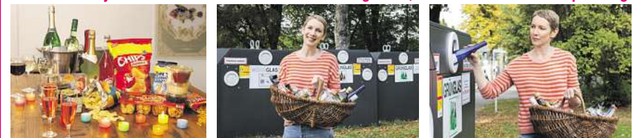
Wohin mit der blauen Flasche? So entsorgen Sie Altglas von der Silvesterparty richtig.

Wer nach der Silvesterparty Sektflaschen, leere Chipstüten oder abgebranntes Tischfeuerwerk richtig entsorgt, schont die Umwelt.