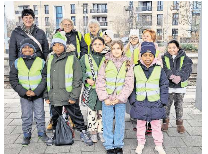
Die Kinder schauten den Film "Zoomania 2".

dem alle Kinder Popcorn und ein Getränk bekommen hatten, wurde der Film Zoomania 2 angeschaut. Es hat allen viel Spaß gemacht. Danach fuhren alle zufrieden mit dem Bus wieder nach Hause.