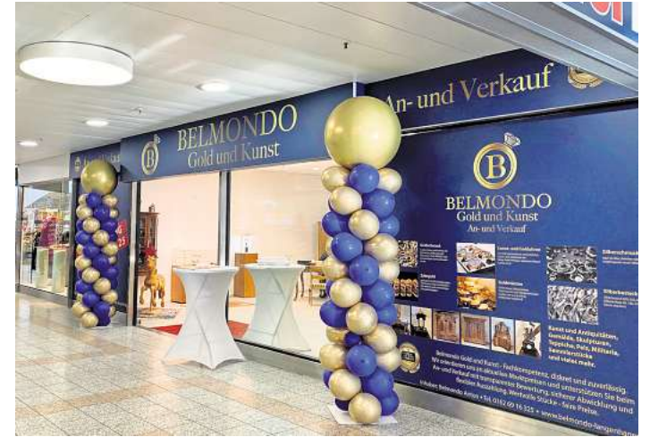
Neueröffnung: Einen Laden mit Antiquitäten und Goldankauf gibt es jetzt im ehemaligen Geschäft Foto Biering.

lich ab März, sollen Kunden auch wieder die Toiletten im zweiten Obergeschoss nutzen können. Nach einem massiven Wasserschaden wird der Sanitärbereich saniert und modernisiert. Bis zur Neueröffnung stehen den Kunden die Toiletten im ersten Obergeschoss zur Verfügung. Noch bis Heiligabend bietet das Einkaufszentrum seinen Kunden