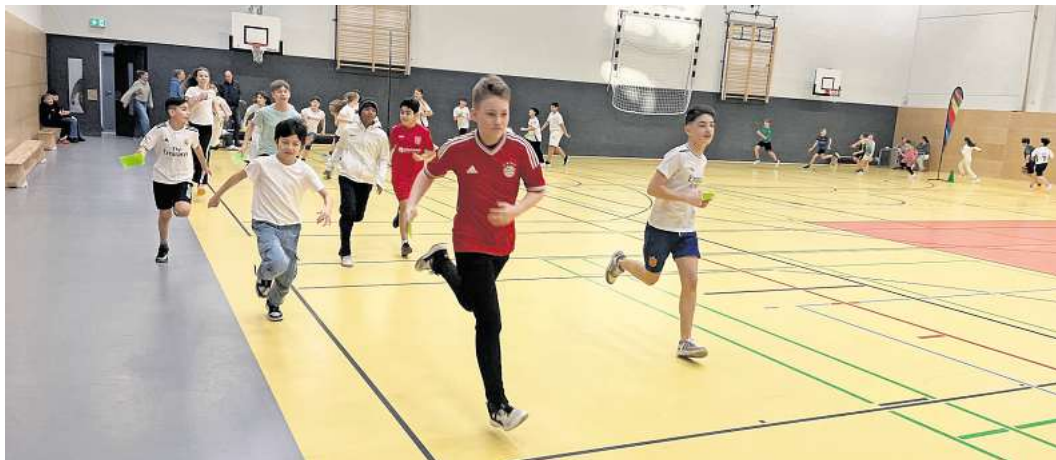
Die Fünft- und Sechstklässler der IGS Langenhagen legten sich in der Veranstaltungssporthalle so richtig ins Zeug und drehten eifrig ihre Runden.

IGS Langenhagen startet Sponsorenlauf für Ambulanten Kinderhospizdienst des ASB