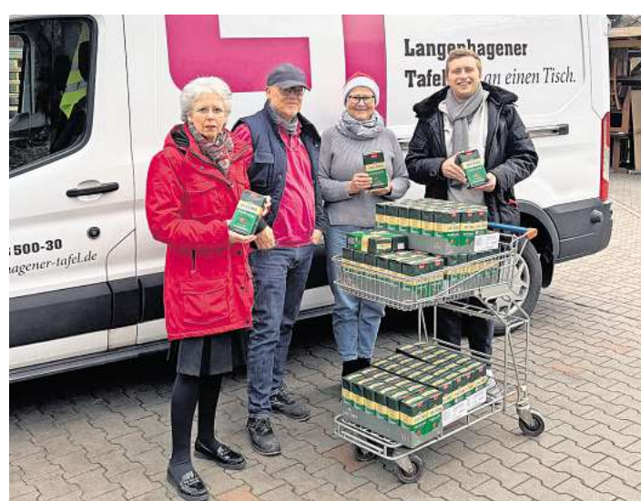
Tafel und SPD freuen sich, Bedürftigen helfen zu können.

LANGENHAGEN. Jetzt hat die SPD Langenhagen der Langenhagener Tafel Kaffee überreicht. Damit setzt der Ortsverein seine inzwischen langjährige Spendenaktion fort.