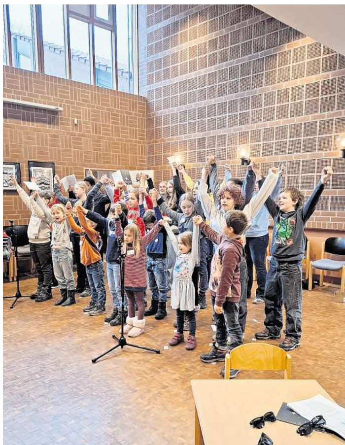
Alle haben bei den Proben zum Weihnachtsmusical viel Spaß.