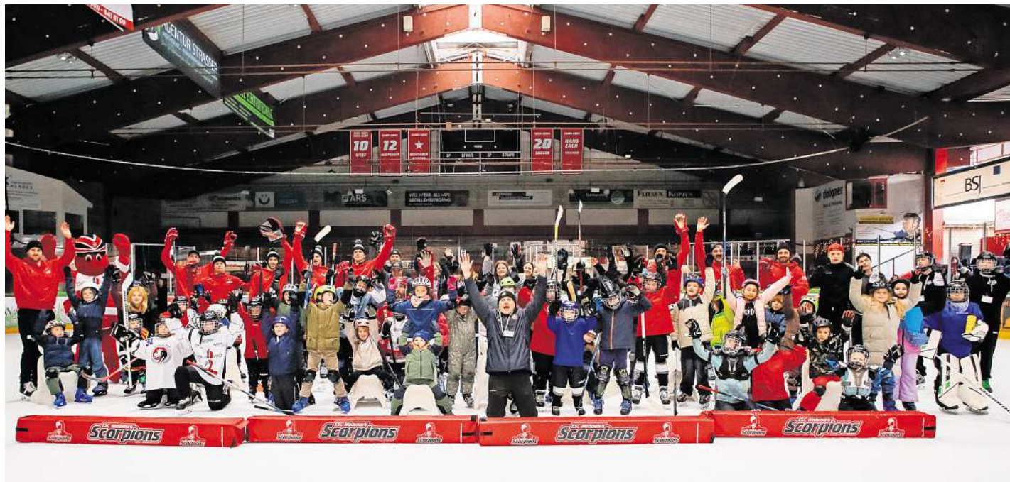
Die Teilnehmerinnen und Teilnehmer hatten alle viel Spaß.

den ereignisreichen Tag gemütlich ausklingen zu lassen. Ein Tag voller Bewegung, Spaß und unvergesslicher Momente. Der nächste Kids-on-Ice-Day in diesem Winter läuft am Sonnabend, 31. Januar, um 12 Uhr.