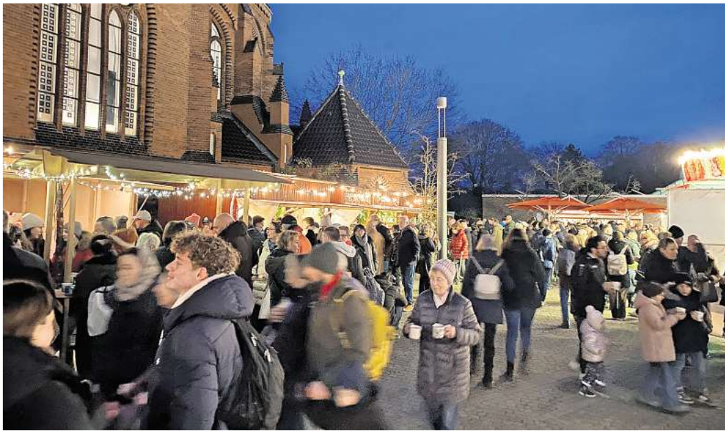
Beliebt und Stimmungsvoll: Viele Langenhagenerinnen und Langenhagener treffen sich auf dem Weihnachtsmarkt an der Elisabethkirche.