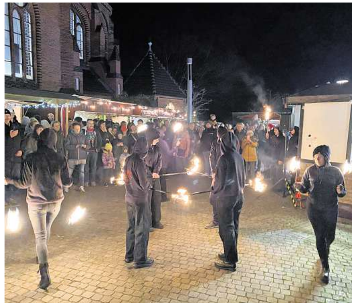
Auftritt: Der Zirkus Hermine präsentiert eine Feuerschau auf dem Kirchplatz.