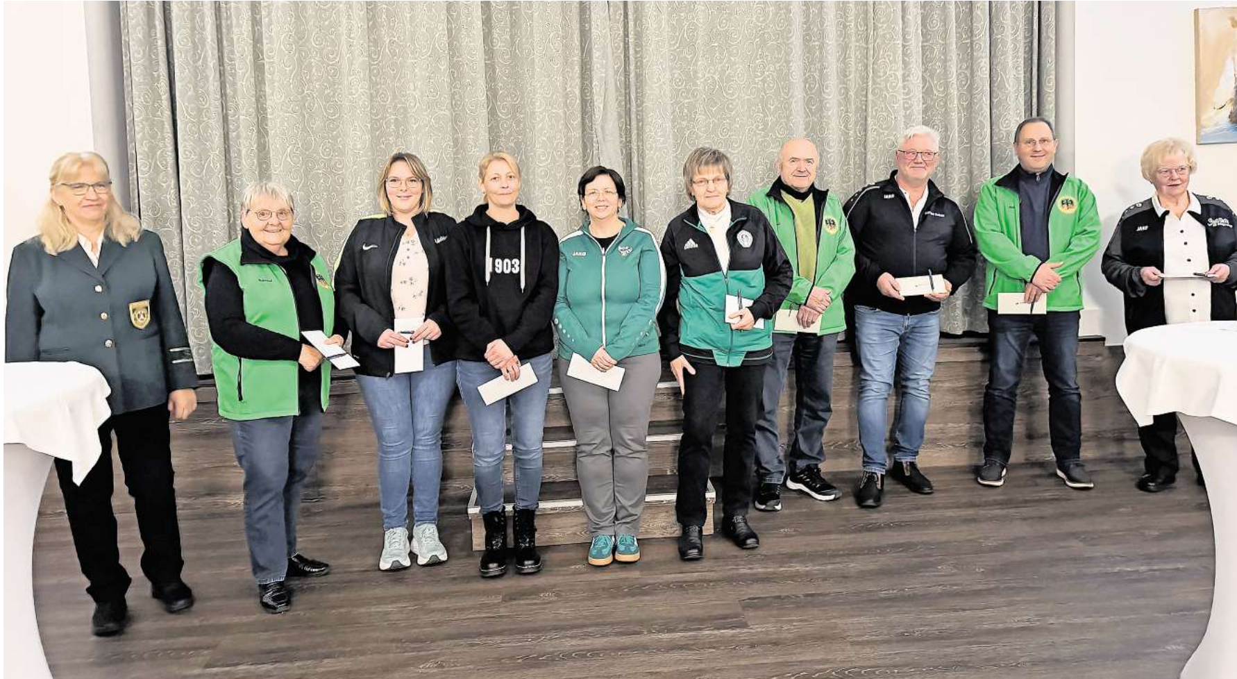
Die Teilnehmer und Helfer bei Kreisverbands-, Landesverbands- und Deutschen Meisterschaften.

Kreisschützenverband Wedemark-Langenhagen zeichnet Ehrenamtliche und Schießsportler des Jahres aus