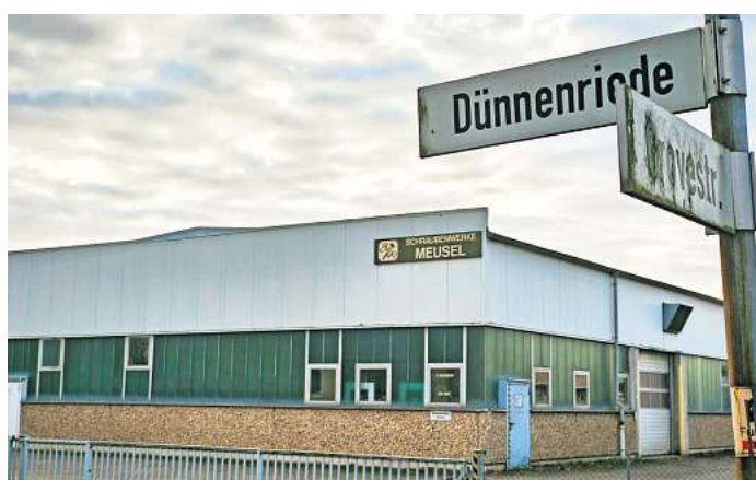
Insolvenz angemeldet: Die Schraubenwerke Meusel GmbH & Co. KG wurden 1957 in Langenhagen gegründet, seit 1984 gibt es ein zweites Werk in Peine.

„Im Laufe der Woche konnte geklärt werden, dass die Mitarbeiter für die Monate November, Dezember und Januar Insolvenzgeld von der Arbeitsagentur