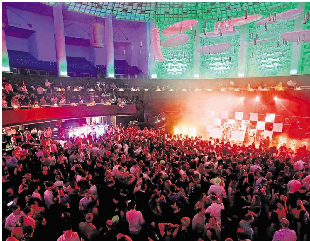
Bereits zum elften Mal steigt die große Silvesterparty im HCC.

Aufgrund der großen Nachfrage empfiehlt sich eine frühzeitige Buchung – in den vergangenen Jahren war die Silvesterparty ausverkauft.