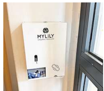
Jetzt kann jederzeit auf Hygieneartikel zurückgegriffen werden.

Während des Planungsprozesses wurden verschiedene Modelle geprüft. Eines davon sah vor, dass für die Entnahme eines Artikels zuvor ein Coin beim Sekretariat, bei Lehrkräften oder der Schülervertretung geholt werden muss.