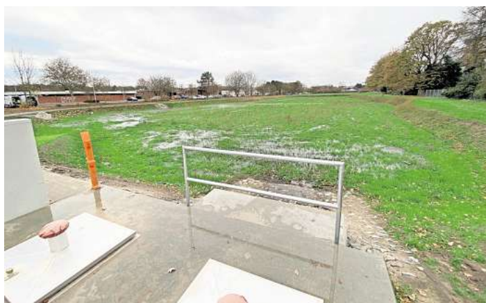
Fertiggestellt: Das Regenrückhaltebecken speichert bei Starkregen das Wasser und entlastet die Kanalisation.

LANGENHAGEN (JAR). Entlang der Leibniz- und Virchowstraße, gleich gegenüber des Sportclub Langenhagen (SCL), ist in den vergangenen Monaten ein neues Regenrückhaltebecken entstanden. Es fasst 8000 Kubikmeter Wasser und soll helfen, die Kanalisation besonders bei Starkregen zu entlasten. Mit einer Fläche von umgerechnet fast vier Fußballfeldern ist die neue, 2,4 Hektar große Anlage nicht zu übersehen. Hundebesitzer nutzen den Weg herum als eine beliebte Auslauffläche. Noch säumen einige Pfützen das tiefer gelegene Bassin. Die Bauarbeiten sind nun beendet: Die geplante Bauzeit von rund sechs Monaten, von Mai bis Oktober, konnte die Verwaltung einhalten – auch aufgrund der beständigen Witterung während der Arbeiten.