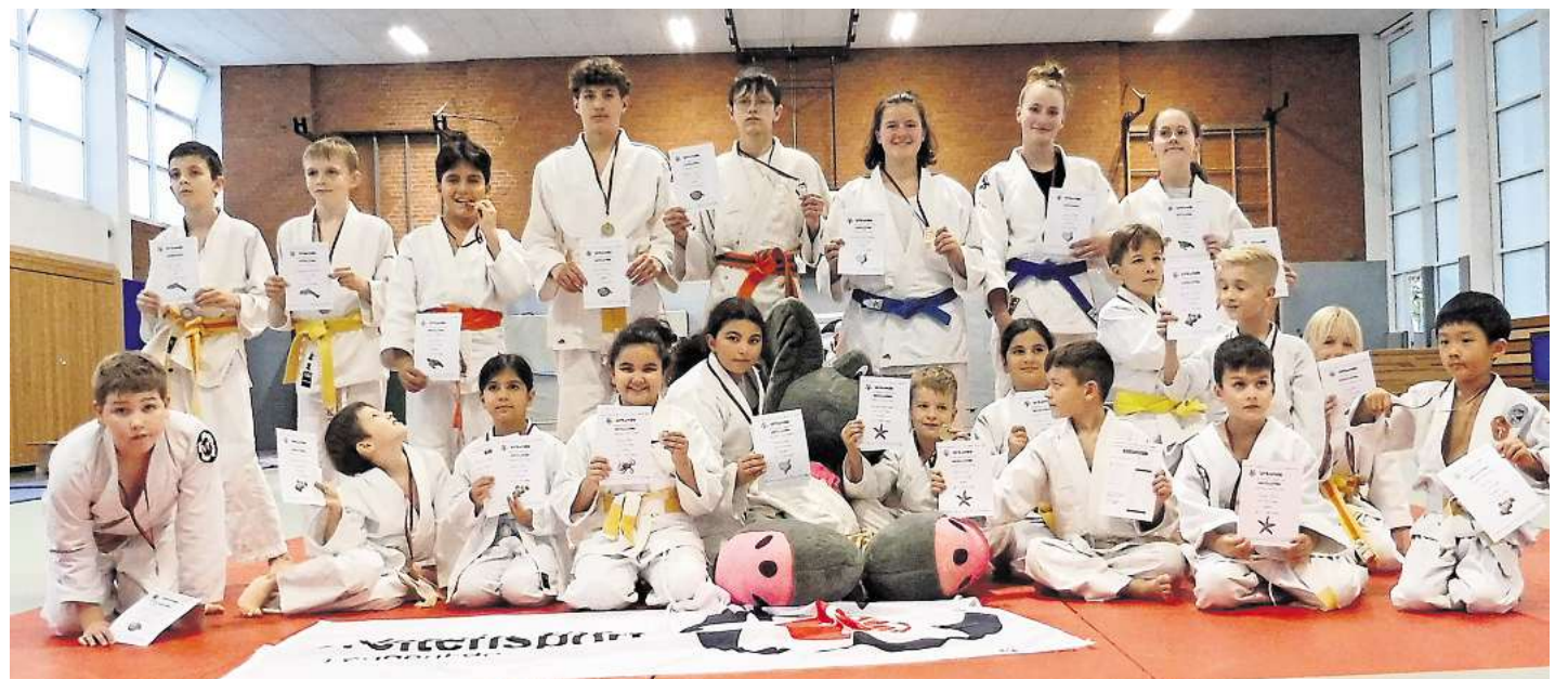
Die neuen Judo-Vereinsmeisterinnen und -meister des VfB Langenhagen.