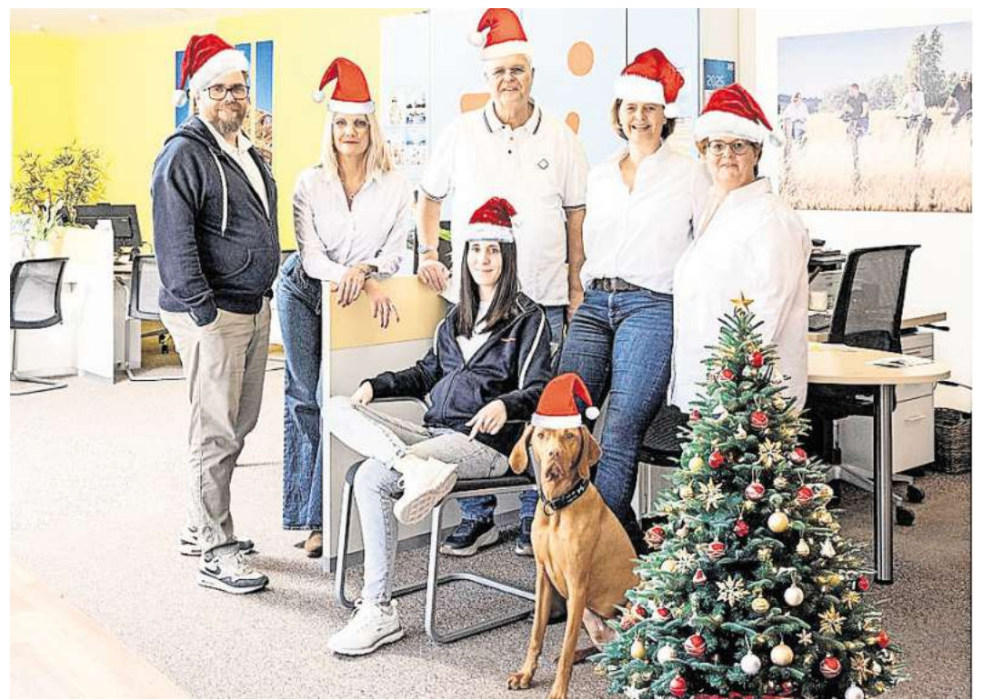
Eine schöne Adventszeit wünscht das Team des TUI ReiseCenter Wedemark