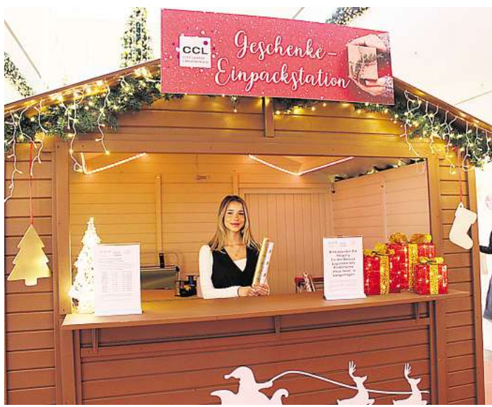
Das CCL bietet auch in diesem Jahr wieder einen Einpackservice an.

Bis zum Mittwoch, 10. Dezember, sind die jeweiligen Geschenk-Wünsche zu kaufen und in der Zeit von Montag bis Freitag 9 bis 18 Uhr beim Centerma-