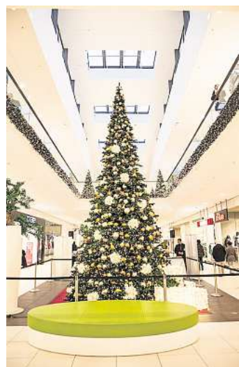
Die Weihnachtsdekoration im CCL steht seit vergangenem Montag.