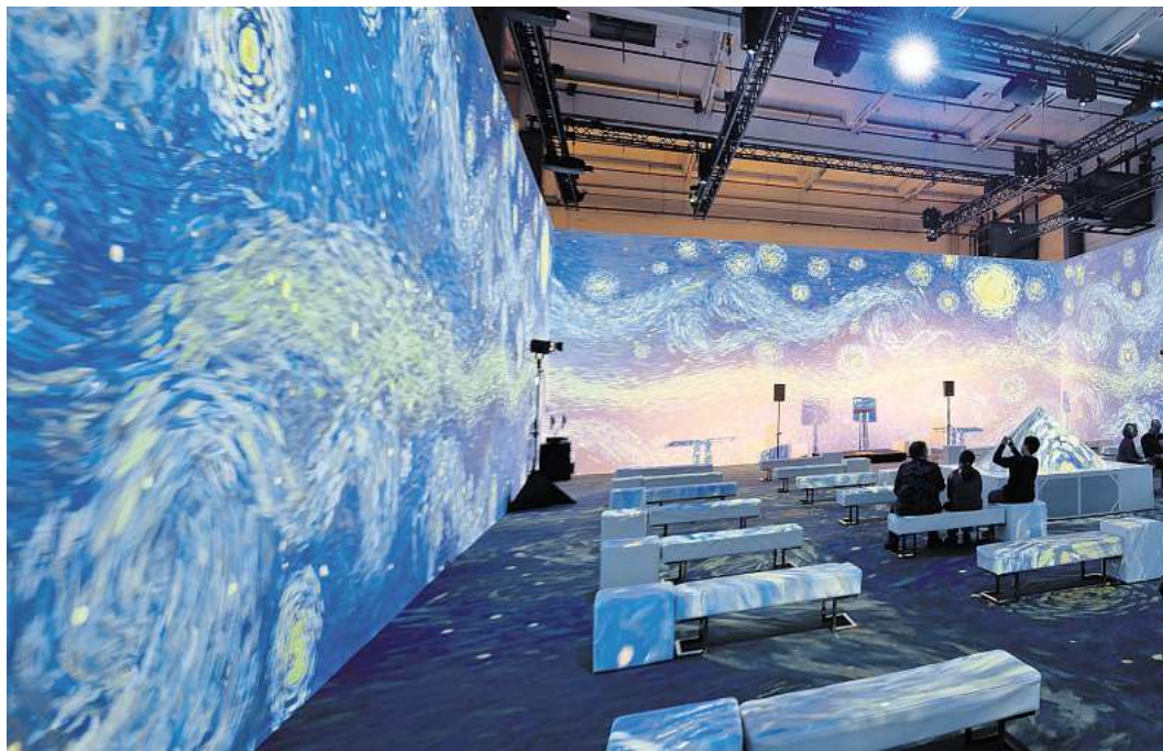
Beindruckend: Die Van Gogh Experience Ausstellung in der Alten Druckerei.

Und dann geht es in den Raum, der im Zentrum der ganzen Angelegenheit steht – ins große Van-Gogh-Kino. Vier Leinwände gibt es, 30 Meter lang sind die beiden Längsseiten, 15 Meter lang die Querseiten, der Raum ist sechs Meter hoch, 18 Beamer, die am Deckengerüst hängen,