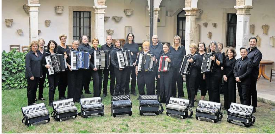
Der ACL spannt einen beeindruckenden Bogen über 75 Jahre Musik- und Filmgeschichte.

Gleich drei Orchester bringen diese Klangwelt auf die Bühne: Das erste Akkordeonorchester Langenhagen, das energiegeladene Orchester LaFunTasticA sowie als besonderes Gastorchester das Akkordeon-Orchester Hannover