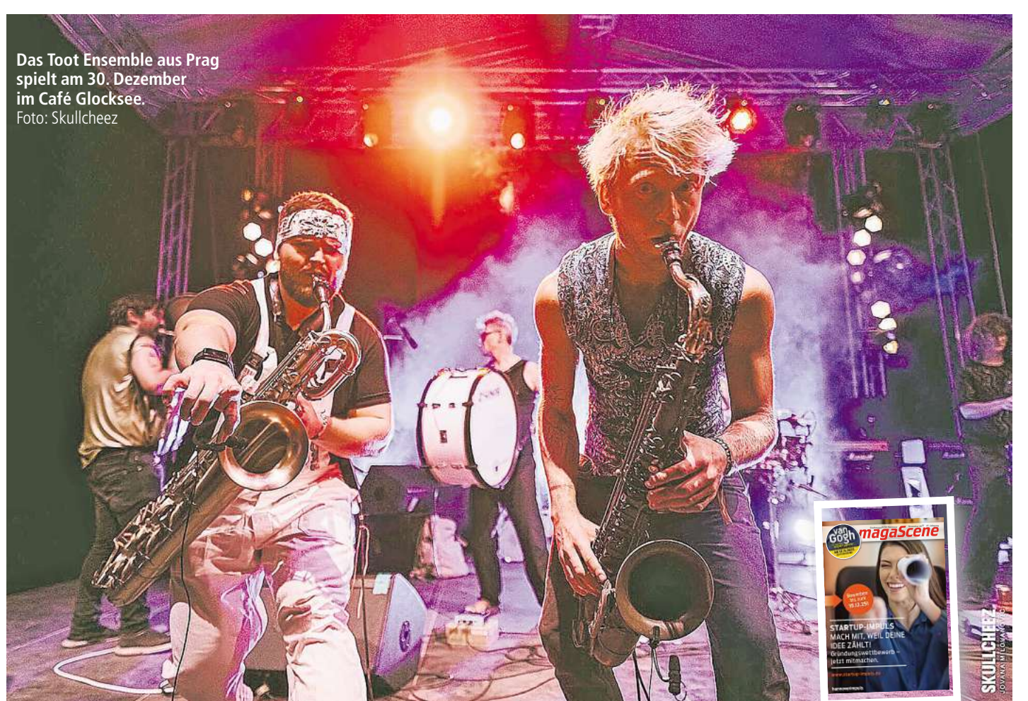
Das Toot Ensemble aus Prag spielt am 30. Dezember im Café Glocksee.

Das Toot Ensemble aus Prag, eine neunköpfige Band, die instrumentale Tanzmusik spielt, wird