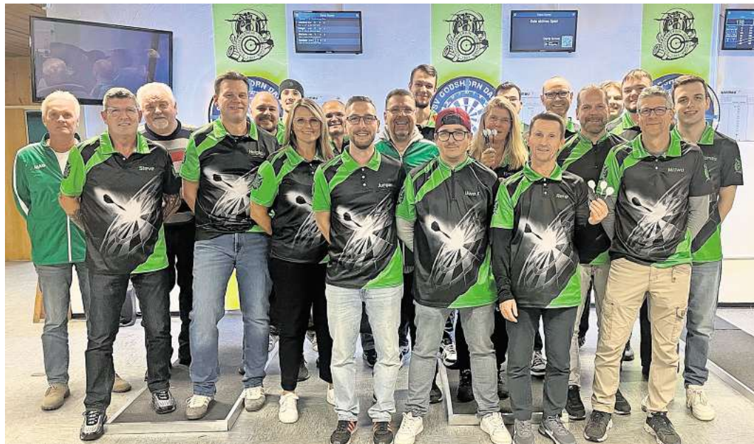
Sind eine eingeschworene Gemeinschaft: die Darts-Spieler im Schützenverein Godshorn.

Wer mitmachen möchte, ist herzlich willkommen. Mitbringen müssen Interessierte, die Pfeile werfen wollen, einfach nur Spaß an Geselligkeit. Die Übungsabende laufen immer montags und Donnerstag ab 19 um Schützenhaus Godshorn am Spielplatzweg.