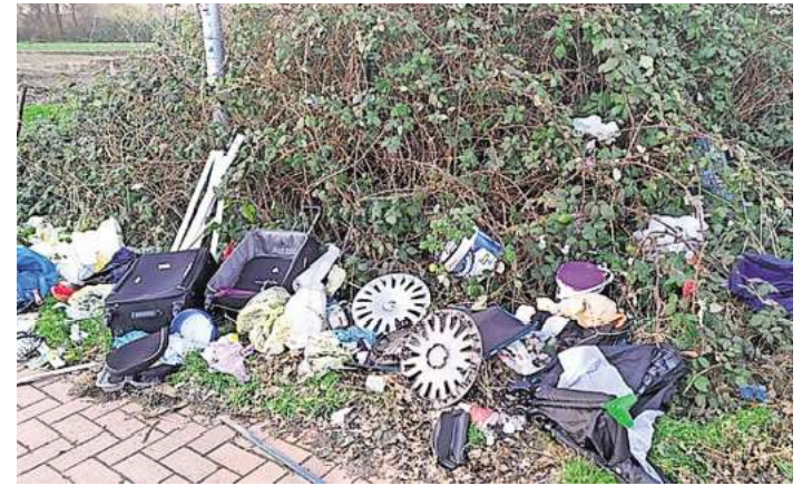
Berge von verschiedensten Abfällen: Die Verschmutzung des Gebietes am Südsee in Schulenburg belastet Anwohner und stört das Ortsbild.

Als weitere Maßnahme verlangt der Ortsrat, zeitweise Betonpoller vor dem Parkplatz aufzustellen. „Wenn der Parkplatz eine Zeit lang gesperrt ist, kommt er vielleicht aus den Augen und aus dem Sinn“, hofft Döpke. Zudem hält das Gremium verstärkte Kontrollen und eine Videoüberwachung für sinnvoll. „Hierfür