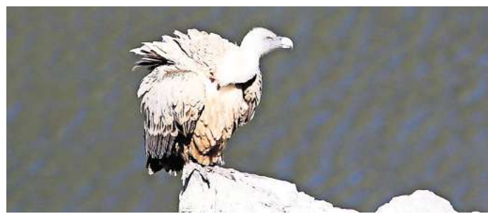
Der Gänsegeier ist auch in der Extremadura zu Hause.

Veranstaltungsort: NIL im Wasserturm, Eichenpark, Stadtparkallee.