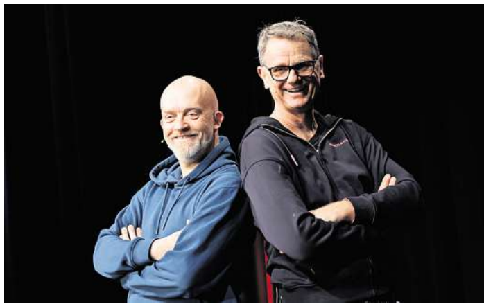
Kommt am Freitag, 5. Dezember, mit ihrem Weihnachts-Comedyprogramm nach Godshorn: das Comedy-Duo Fischer & Jung.

GODSHORN. Der Kulturring Godshorn lädt für Freitag, 5. Dezember, um 20 Uhr ins Dorfgemeinschaftshaus in Godshorn ein: Wenn die Erwartungen höher sind als der Stern auf der Baumspitze, der Glühwein stärker als der Familienzusammenhalt und das Thema „Wer bringt den Kartoffelsalat mit?“, in einen diplomatischen Krisengipfel ausartet – dann ist Weihnachten. Und höchste Zeit für „Es frohlocken die Glocken“, das nagelneue Weihnachts-Comedyprogramm von Fischer & Jung.