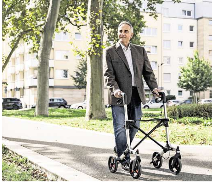
Endlich wieder sicher unterwegs! Ein Rollator ist nichts, wofür man sich schämen muss.