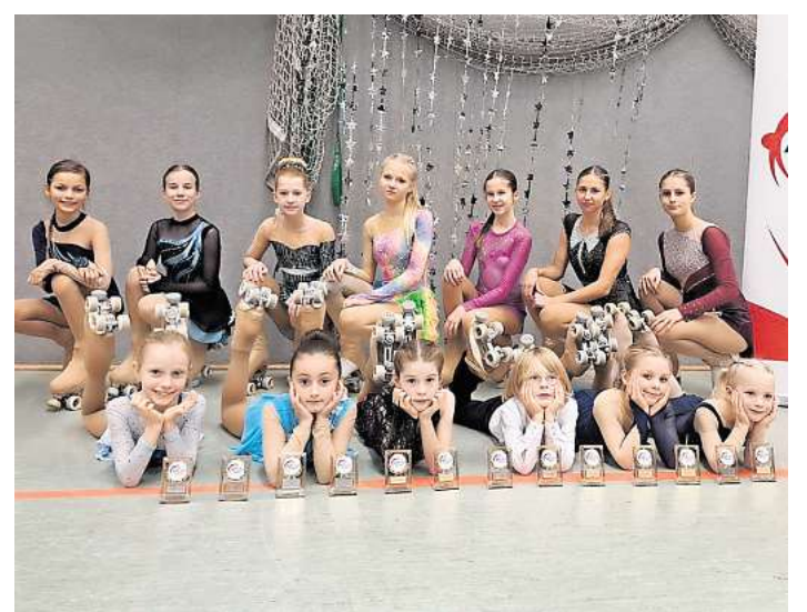
Das Team freut sich über insgesamt 13 Pokale.