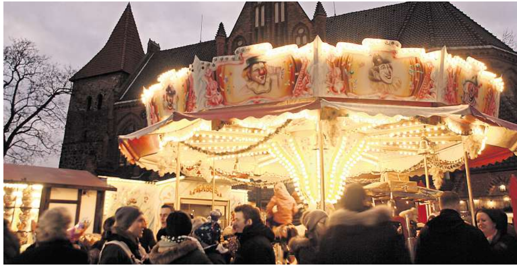
Das Karussell steht auch in diesem Jahr in der Adventszeit auf dem Kirchplatz.