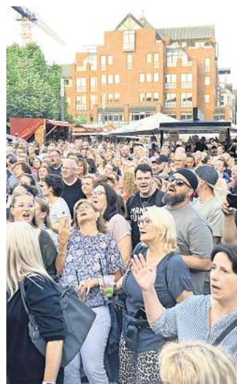
Richtig voll: Vor der Hauptbühne sammelten sich die Menschen und feierten.

Passend dazu leben in Kaltenweide und Schulenburg anteilig betrachtet auch die meisten Familien mit Kindern. In Kaltenweide sind 31,5 Prozent der Haushalte Familien, in Schulenburg 29,4 Prozent. Dementsprechend viele Kinder und Jugendliche gibt es in diesen Ortsteilen. In Schulenburg sind es 22,2 Prozent der Bevölkerung, in Kaltenweide