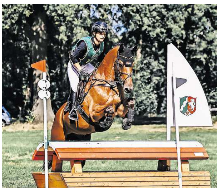
Stars des Spitzensports auf der Geländestrecke in Twenge: Julia Krajewski auf Ero de Cantraie.