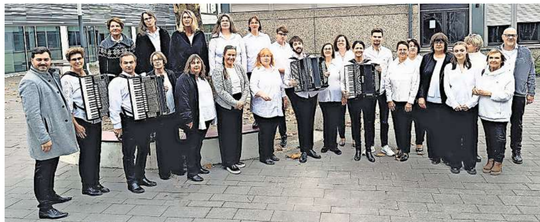
Der ACL lädt für Sonntag, 7. September, zu einem besonderen Sommerkonzert ein.

Sonntag, 7. September: Sommerklänge in der Martinskirche Engelbostel