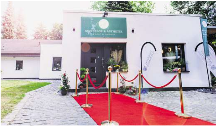
Zum Sommerfest rollte die neue Beauty Lounge den roten Teppich aus.

Makellos & Ästhetik Natelsheideweg 73 30900 Wedemark Telefon (01 52) 52 13 53 47 www.makellos-wedemark.de