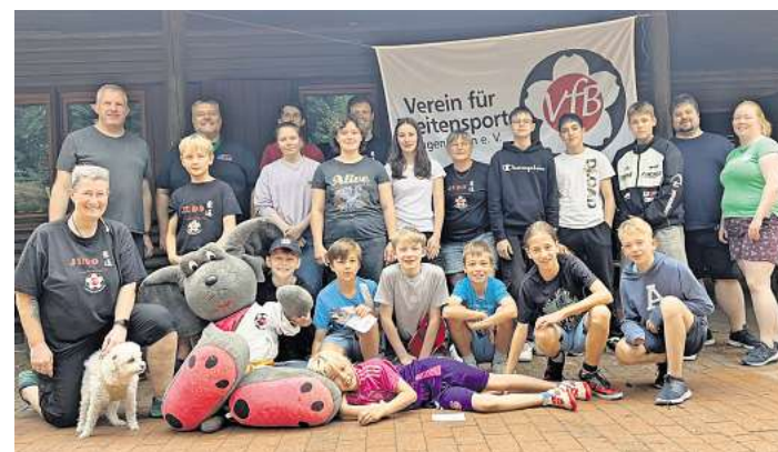
Die Judoka tauschten die Matte mit dem Blockhütten-dorf in Abbensen.

Der Sonnabend versprach dann reinstes Badewetter. Zunächst zog noch eine kühle Brise zwischen den Bäumen hindurch und der eine oder andere ergatterte sich einen Stempel für den Abbensenpass, in dem man sich verschiedens Aktivitäten der Freizeit abstempeln lassen konnte. Dann aber wurde es so warm, dass nur eine Siesta möglich war – oder der Sprung ins kühle Nass.