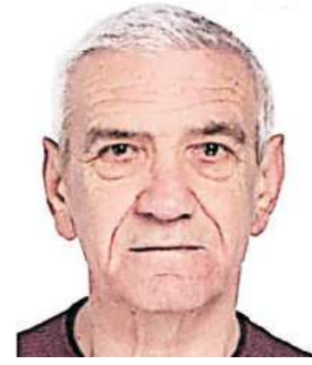
Wer kennt den Mann? Foto: Polizei beim Kriminaldauerdienst Hannover unter der Telefonnummer (0511) 109-55 55 zu melden.

Die Polizei bittet Zeuginnen und Zeugen, die in der Nacht von Sonnabend, 23. August, auf Sonntag, 24. August, oder am frühen Sonntagmorgen Verdächtiges im Bereich des Silbersees beobachtet haben, sich