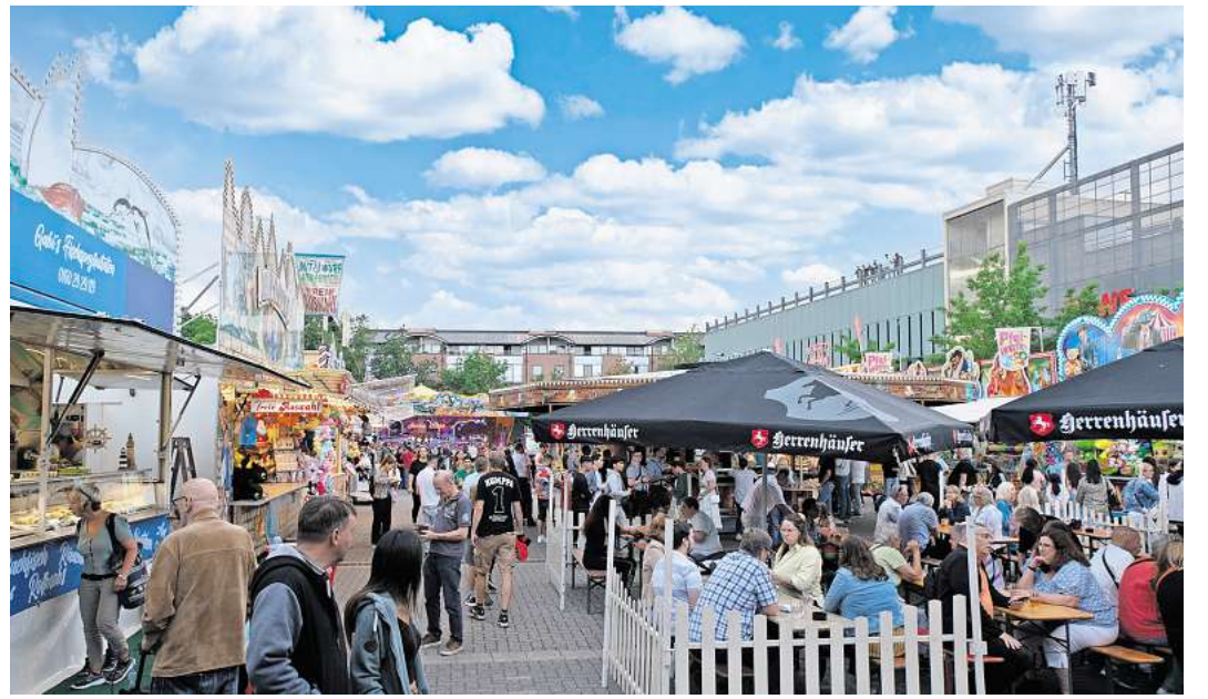
Viel los bei gutem Wetter: Vor allem zum Freitagabend hin füllte sich der Platz.