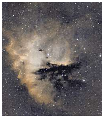
Der Pacman-Nebel, ein Objekt, rund 9500 Lichtjahre von der Erde entfernt.

LANGENHAGEN. Die Naturkundliche Vereinigung Langenhagen (NVL) lädt alle interessierten Langenhagenerinnen und Langenhagener recht herzlich zu einem Streifzug über den herbstlichen Sternenhimmel für Sonnabend, 13. September, am und im Wasserturm (Eichenpark, Stadtparkallee 39, 30853 Langenhagen), ein. Die Veranstaltung des Fachbereichs Astronomie beginnt um 20.30 Uhr mit einigen allgemeinen Informationen zur Astronomie. Anschließend wird, unter der fachkundigen Leitung von Dirk Itzrodt, am Teleskop beobachtet. Abgerundet wird der Abend durch einen Vortrag von Stefan Reimann mit dem Titel „Entstehung schwerer Elemente in Sternexplosionen