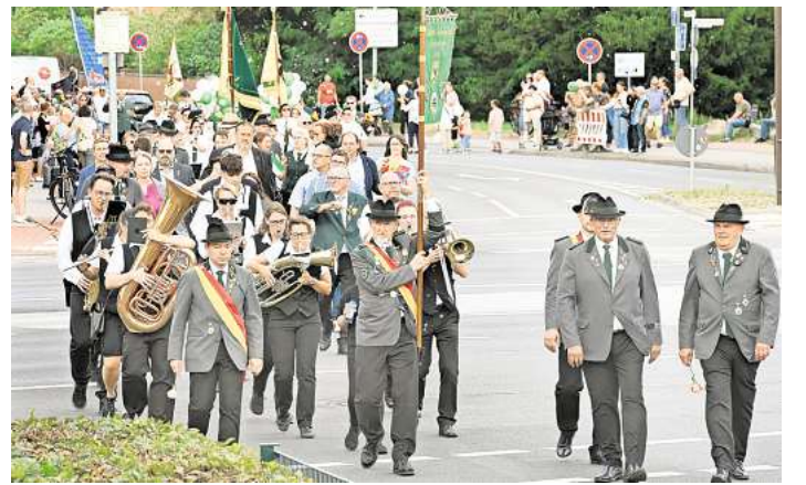
Zum Abschluss des Langenhagener Schützenfestes: der Schützenausmarsch führt durch die Innenstadt.

Während am Nachmittag noch viele Familien mit kleinen Kindern über den Festplatz bummelten, verwandelte sich das Gelände am Abend immer mehr in eine Partymeile. Im großen Festzelt stand der bayerische Abend auf dem Programm – für viele der stimmungsvolle Höhepunkt des