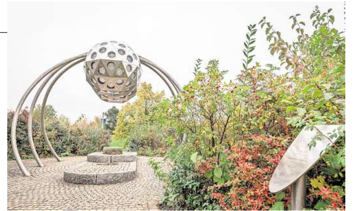
Das wohl bekannteste Kunstobjekt im Park der Sinne ist das Insektenauge. Für die Entwicklung benötigte Rimkus mehr als ein Jahr. Alle Teile sind gelasert, die Oberfläche ist elektropoliert. Die Linsen sind eine Spezialanfertigung.

Eintritt: Die Tickets kosten 24 Euro pro Person. Kinder unter 14 Jahren brauchen eine Begleitperson. Ein Erwachsener darf gemäß den Regeln des Museums auf bis zu drei Kinder aufpassen.