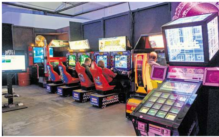
Besucher testen beim Senak Peak die Spielautomaten im Arcade-Museum Hi-Score, das vom Aufhof in die Südstadt umgezogen ist.

Öffnungszeiten: donnerstags ab 15 Uhr, freitags ab 14 Uhr, samstags und sonntags von 10 bis