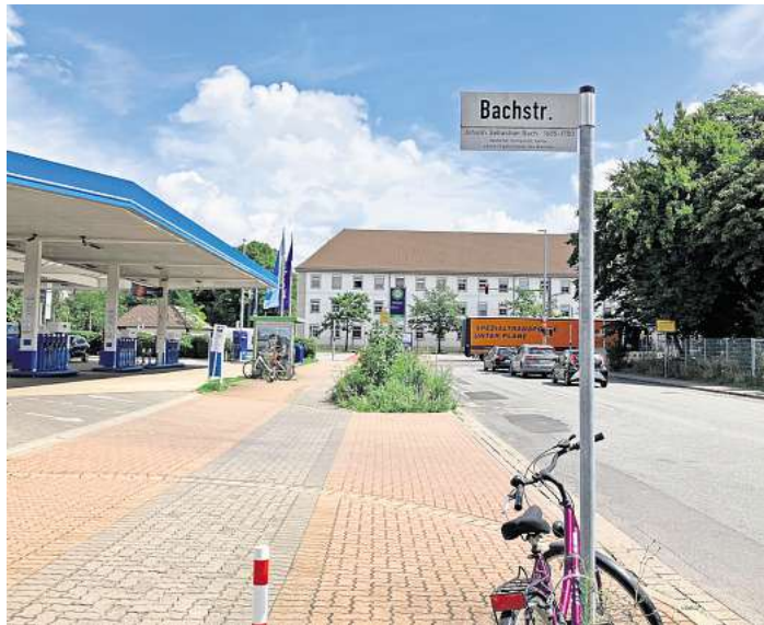
Hier wird bald gebaut: Von Anfang August bis Dezember ist die Heinrich-Heine-Straße teilweise gesperrt.