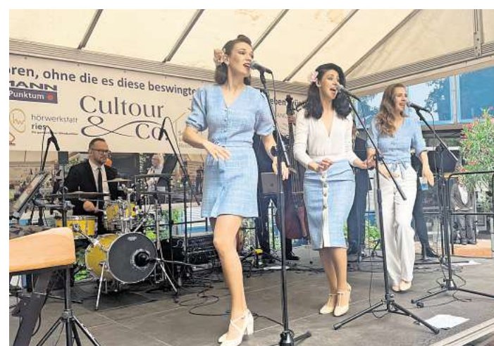
Überzeugten auf der ganzen Linie: die Singin' Birds aus Polen.

LANGENHAGEN (OK). Vier Veranstaltungen laufen noch in diesem Jahr bei den Jazzmatineen im Rathausinnenhof. Stand jetzt die letzten vier Veranstaltungen dieser Reihe, denn laut Organisator Horst-Dieter Soltau geht es nicht mehr weiter. Das letzte Wort ist aber offensichtlich noch nicht gefallen. Vergangenen Sonntag haben die Singin' Birds aus Polen trotz Regenwetters einen grandiosen Auftritt hingelegt und die Zuhörerinnen und Zuhörer begeistert. Am nächsten Sonntag, 3. August, sind ab 11 Uhr Joe Wulf and the Gentlemen of Swing zu Gast. Eine Woche später, am 10. August, heißen die Veranstalter dann das „Hot Jazz Orchestra“ herzlich willkommen. Die Jazz Connection aus den Niederlanden wird am Sonntag, 17. Au-