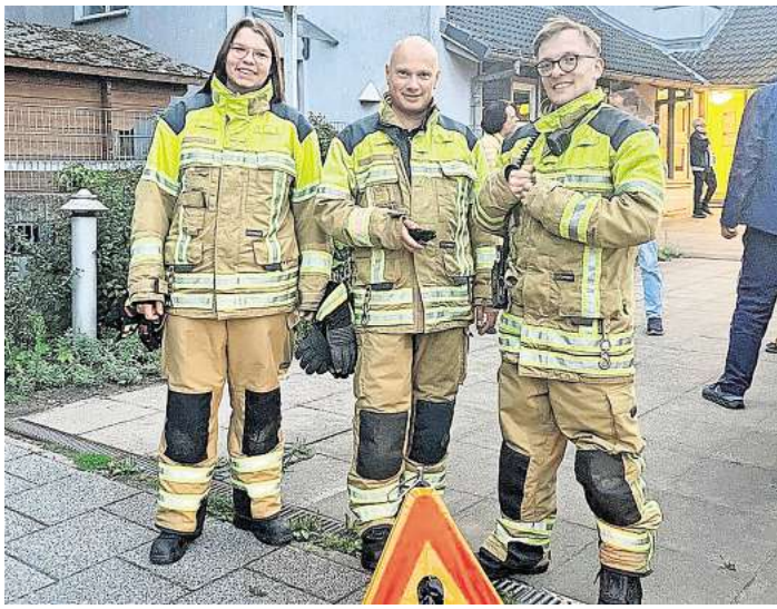
Etwa 20 Einsatzkräfte waren an der Aktion beteiligt.

KRÄHENWINKEL. Am Dienstagabend wurde auf einem Acker am Sportplatzweg in Krähenwinkel eine 8,8-Zentimeter-Sprenggranate aus dem Zweiten Weltkrieg entdeckt. Die Alarmierung der Feuerwehr erfolgte um 20.30 Uhr.