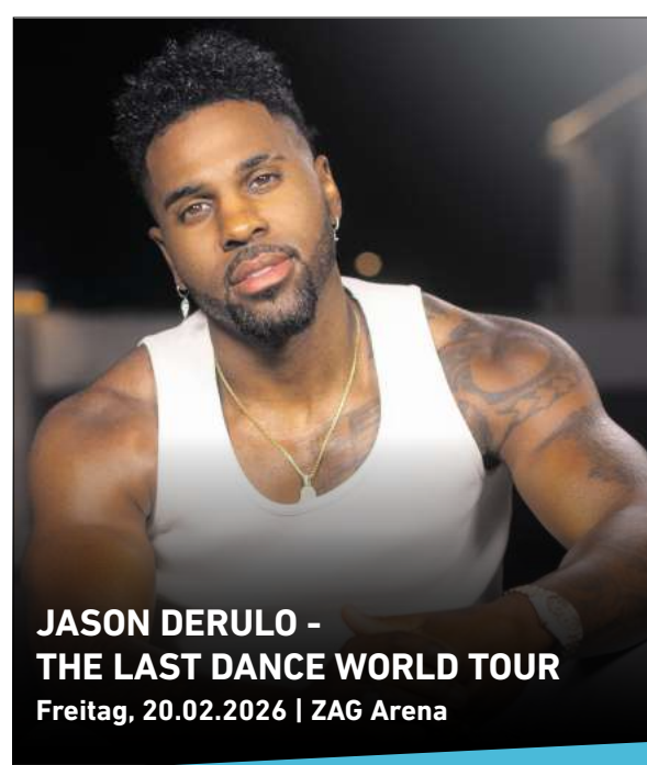
JASON DERULO - THE LAST DANCE WORLD TOUR Freitag, 20.02.2026 | ZAG Arena

Ihr persönlicher Ticketservice der HAZ & NP