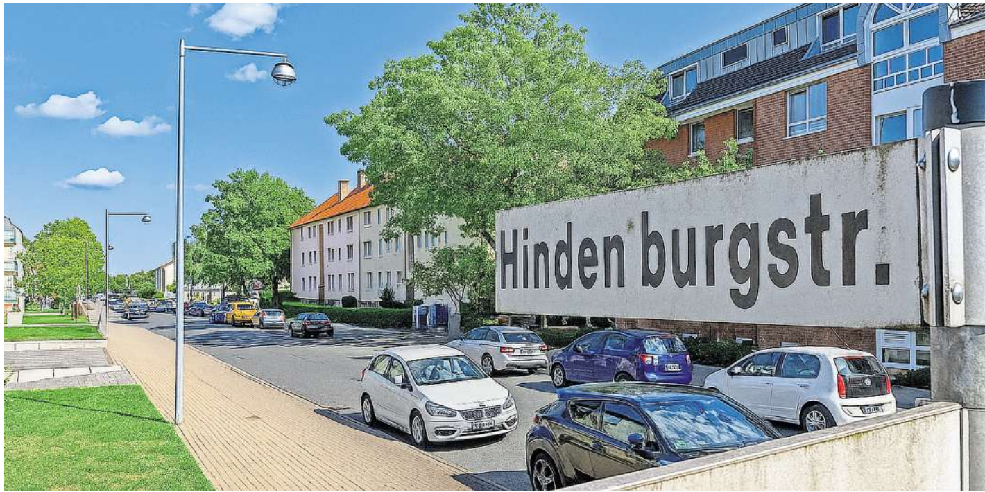
Die Arbeiten an der Hindenburgstraße starten im Jahr 2026.