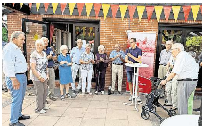
Die Veranstaltung stand ganz im Zeichen der Gemeinschaft. privat

LANGENHAGEN. Bei strahlendem Sommerwetter feierte die Tennismgemeinschaft Rot-Gelb Langenhagen am jetzt ihr 50-jähriges Bestehen. Rund 100 Gäste fanden sich auf der idyllisch gelegenen Vereinsanlage in der Leibnizstraße 62 ein, um gemeinsam auf ein halbes Jahrhundert Vereinsgeschichte zurückzublicken – und vor allem: zu feiern. Die Veranstaltung stand ganz im Zeichen der Gemeinschaft, der Erinnerungen und der Dankbarkeit.