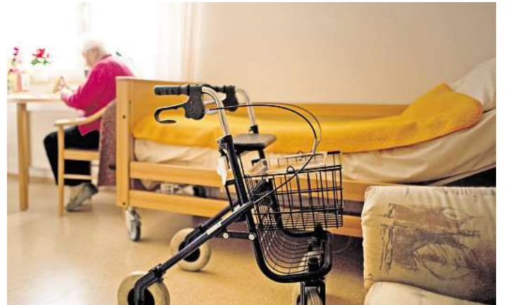
Struktur gibt Sicherheit: Ein geregelter Tagesrhythmus hilft besonders bei Demenz und kann das Einschlafen erleichtern.

Schon kleine Veränderungen können einen Unterschied machen: Etwa Ohrstöpsel, die für mehr Stille sorgen, oder eine Schlafbrille, die störendes Licht aussperrt. Ebenfalls wichtig ist das abendliche Lüften, damit die Luft im Raum nicht zu stickig ist: Die Temperatur im Schlafzimmer sollte