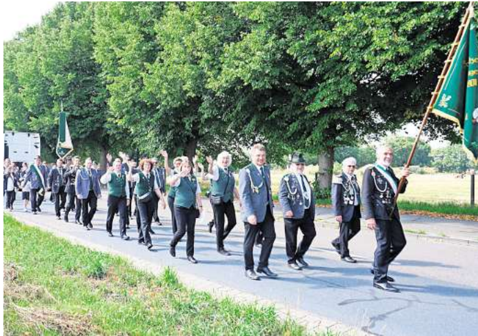
Der große Festumzug durch Schulenburg war eines der Highlights des Schützenfestes.