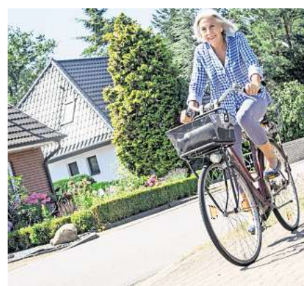
Ein aktiver Lebensstil hilft dabei, sich jünger zu fühlen.