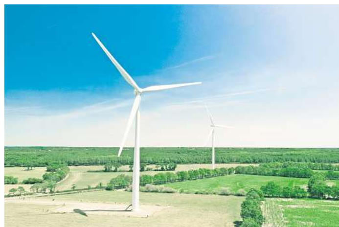
Windenergie-Verbände warnen vor einer politischen Kehrtwende beim Ausbau erneuerbarer Energien, die letztlich aufgrund unrealistischer Bedarfsschätzungen der gesamten Wirtschaft schaden würde.