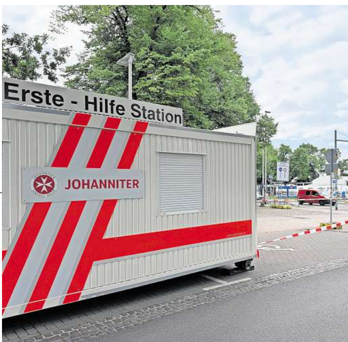
Aufbau für das Maschseefest: Erste-Hilfe-Station am Sprengel Museum.

Hannovers Maschseefest wird schon zum 38. Mal begangen. Live-Acts, Shows und zahlreiche Veranstaltungen im Festprogramm werden wieder viele Gäste aus der Region, ganz Deutschland und aus europäischen Nachbarländern anlocken. Für sie alle sind die Johanniter da. Mit Einsatzfahrzeugen, vom Rettungswagen (RTW) bis hin zum Notarzteinsatzfahrzeug (NEF), aber auch mit Abrollcontainern und Erste-Hilfe-Stationen. Die Standorte sind auch auf den Karten für die Gäste des Maschseefestes verzeichnet. Eine Unfallhilfsstelle liegt am Kurt-Schwitters-Platz, eine andere auf dem Parkplatz Robert-Enke-Straße 1. Ob Notarzt, Rettungsanleiterin, Sanitätshelfer oder Notfallsanitäterin: Die Johanniter vom Ortsverband Hannover-Wasserturm bringen