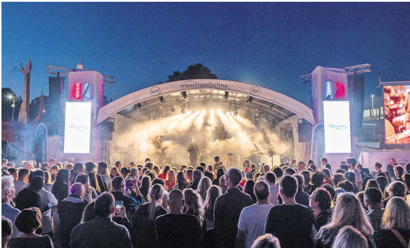
Eindrücke von der Single-Party „Fisch sucht Fahrrad“, mit der Band „Vergeben“ auf dem Maschseefest 2024.

Die HAZ trägt zum Fest mit einem abwechslungsreichen Programm am Nordufer bei. Am Montag, 4. August, stehen statt Live-Musik gesprochene Worte im Mittelpunkt. Beim Poetry-Slam treten gleich mehrere Autorinnen und Autoren mit eigenem Text an und buhlen um die Gunst des Publikums. Der Live-Literatur-Verband „Macht Worte!“ organisiert Slams in der