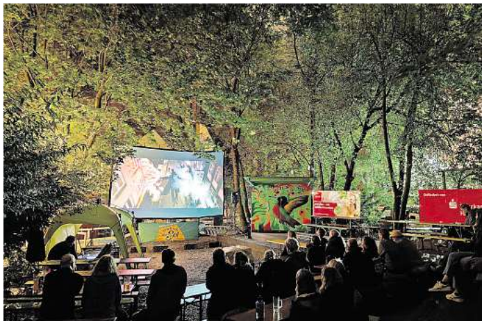
Impression eines Kinoabends im Biergarten Gretchen.