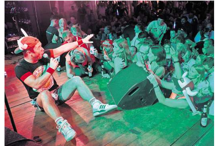
Von Mallorcas Partymeilen ins Schulenburger Festzelt: Schlagerstar Lorenz Büffel brachte die Stimmung zum Kochen.

SCHULENBURG (FA). Auf das große Jubiläum im Vorjahr folgte das nicht weniger große Schützenfest von 101. Geburtstag des SSV Schulenburg von 1924. Vom traditionellen Schießwettbewerb bis zum festlich geschmückten Festzelt: Auch in diesem Jahr bot das Schützenfest viel Spaß für alle Schulenburger und Gäste.