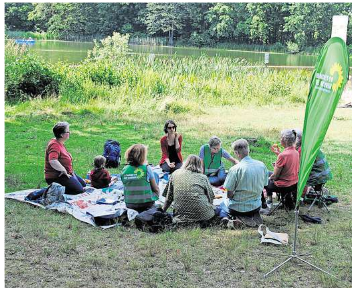
Zahlreiche Interessierte waren der Einladung gefolgt.