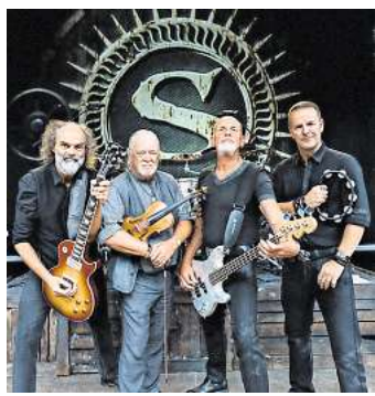
Live: Santiano.

Der Heimstart in die Hauptrunde der Saison 2025/26, für den der Dauerkartenvorverkauf bereits in der vorigen Woche begonnen hat, findet am Sonntag, 21. September, um 19 Uhr im kleinen Nordderby gegen die Herforder ICE Dragons statt.