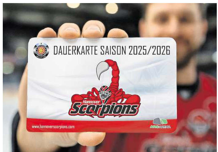
Steht für exklusive Vorteile, Komfort und Ersparnis: die Eishockey-Dauerkarte der Hannover Scorpions für die nächste Saison.