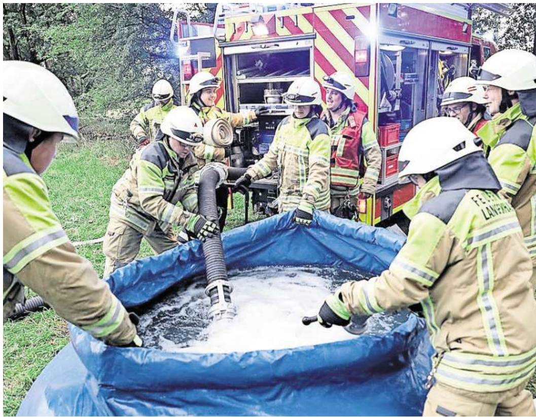
Wasserversorgung war ein zentrales Thema der Übung.

Die Einsatzkräfte sammelten sich am ausgewiesenen Bereitstellungsraum „Maspe – kleines Wegedreieck“. Dort übernahm der Einsatzleitwagen (ELW 2) aus Kaltenweide die Koordination über den Digitalfunkkanal. Die Einheiten arbeiteten strukturiert in mehreren Abschnitten unter realitätsnahen Bedingungen.