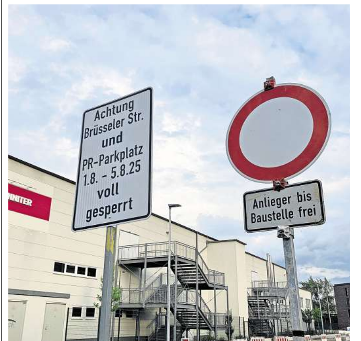
Vollsperrung: Anfang August ist die Brüsseler Straße für mehrere Tage gesperrt.

Bereits zu Beginn der Bauarbeiten hatte die Stadt mitgeteilt, dass die Arbeiten bis zum Herbst dauern würden. Dieser Plan steht weiterhin: Laut Verwaltung sind die finale Bepflanzung und die Inbetriebnahme des Ladeparks für Herbst 2025 geplant.