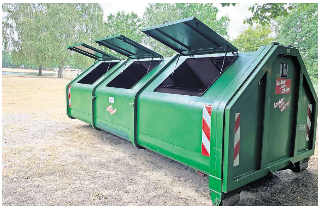
Neu auf der Ostseite des Silbersees: Damit der Müll nach dem Grillen nicht auf der Wiese oder neben dem Abfalleimer liegen bleibt, können Menschen ihren Unrat im Container entsorgen.

LANGENHAGEN (JAR). Der Sommer hat begonnen. Insbesondere an sonnigen, heißen Tagen nutzen viele Menschen die Flächen rund um den Silbersee in Langenhagen zum Verweilen mit der Familie und Freunden. Dann wird auch gern gemeinsam gegrillt. Dafür ist auf der Ostseite des Freizeitgeländes ein Grillplatz ausgewiesen. Doch der Müll, der regelmäßig zurückbleibt, ärgert die Stadt seit Langem. Nach der Plakataktion im vergangenen Jahr sollen nun weitere Müllcontainer Abhilfe schaffen.