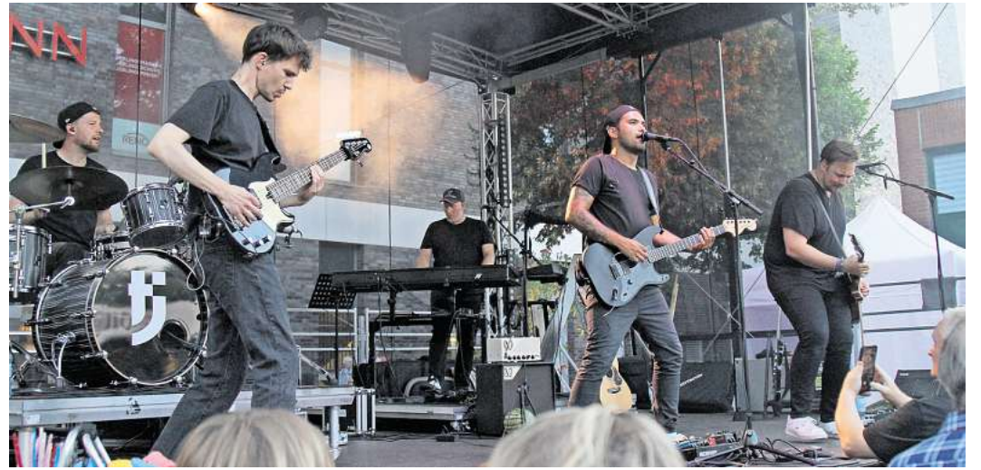
Stargäste: Die Band The Jetlags heizt dem Publikum ordentlich ein.

Doch nicht nur das erfreute den Veranstalter. „Sowohl von den Sponsoren als auch von der Stadt Langenhagen, wurden wir toll unterstützt.“