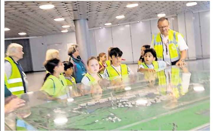
Interessierten sich sehr für das Flughafen-Modell: die Schülerinnen und Schüler der Lernhilfe.