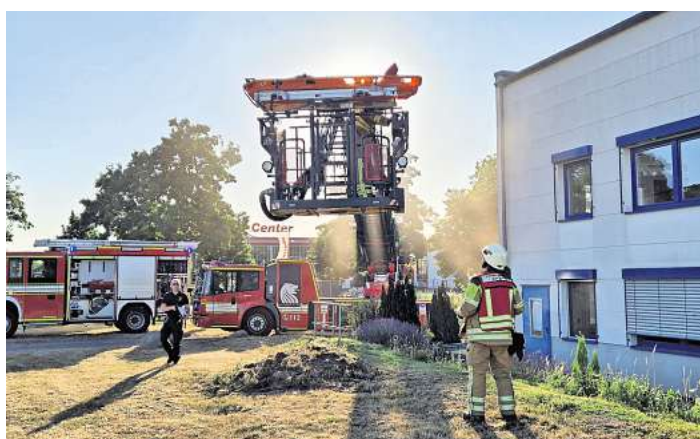
Die Zugübung markierte einen Höhepunkt des laufenden Ausbildungsjahres.

Die Rettung der betroffenen Personen erfolgte über unterschiedliche und situationsangepasste Wege: Über das Treppenhaus, mit Schleifkorbtrage und Bergetuch, sowie mithilfe der Drehleiter. Besonders anspruchsvoll gestaltete sich die Rettung eines nicht gehfähigen Patienten von einer erhöhten Empore, der über einen alternativen Zugang geborgen werden musste. Die Einsatzkräfte bewältigten auch einen simulierten Atemschutznotfall innerhalb des Szenarios souverän. Eine zusätzliche Herausforderung bestand in der unklaren Auslöseursache und der schwer zugänglichen Leckage, diese befand sich hinter mehre-