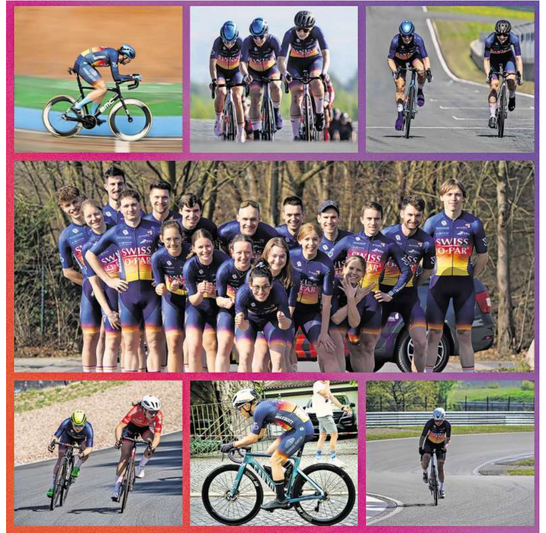
Hat auch einen überregionalen Bekanntheitsgrad erlangt: Team MaxWatt.

„Natürlich sind die Trikots auch richtig schön“ ist unter den Neuzugängen ebenfalls ein gern genanntes Argument. Die bunten Farben (repräsentativ stehend für die Vereinsfarben der drei größten lokalen Hannoverschen Vereine: Blau-Gelb Langenhagen, die Radsportgemeinschaft Hannover und den Hannoverschen Radsportclub) fallen im Peloton besonders leicht ins Auge und