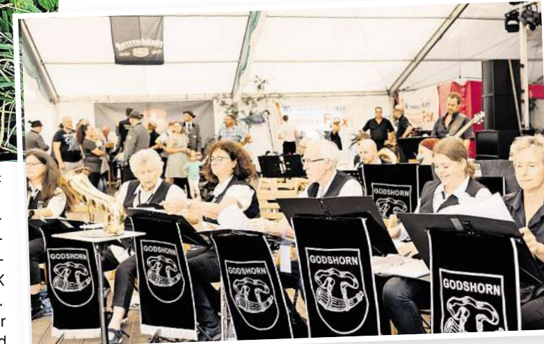
Für musikalische Unterhaltung ist auch beim diesjährigen Schützenfest wieder gesorgt.