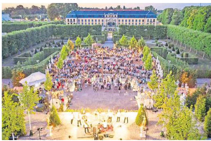
So lauschig können Sommernächte sein.

Eröffnet wird das Festival am 1.8. von der Berliner Folk-Band Mighty Oaks, die sicherlich noch durch ihre Hit-Single „Brother“ aus dem Jahr 2014 bekannt ist. Bei den Sommernächten präsentieren sie ihr 2024 erschienenes Akustik-Album „High Times“. Am 2.8. lädt die Jazzrausch Bigband mit ihren mitreißend-rhythmischen Sounds aus Techno, Jazz und Klassik, Konzerthaus und Club Tanzwütige und Jazzfans ins Gartentheater ein – eine Kooperation mit dem Jazz Club Hannover. Sommerliches Flair und eine Mischung aus Leichtigkeit und Komplexität prägen die Songs des brasilianischen Sängers, Komponisten und Instrumentalisten Leo Middea, der am 3.8. mit seiner vierköpfigen Band auftritt (in Kooperation mit dem Jazz Club Hannover).