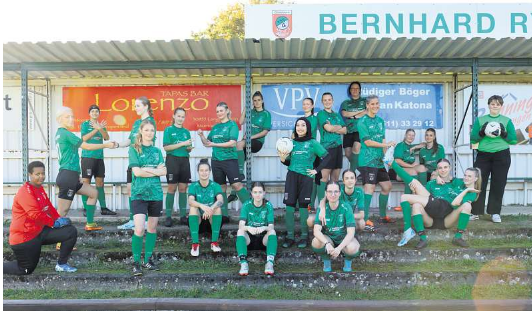
Wollen in der nächsten Saison angreifen: die Fußballerinnen des TSV Godshorn.

Interessierte Frauen ab 16 Jahren können sich gern unter damen@tsv-godshorn.de für ein Probetraining anmelden.