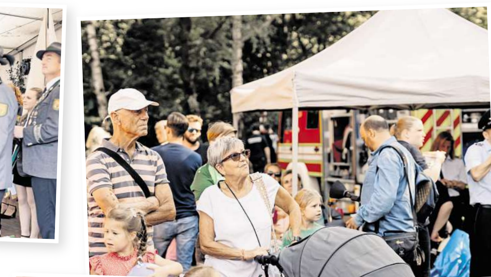
Kind und Kegel werden wieder auf dem Festplatz unterwegs sein.