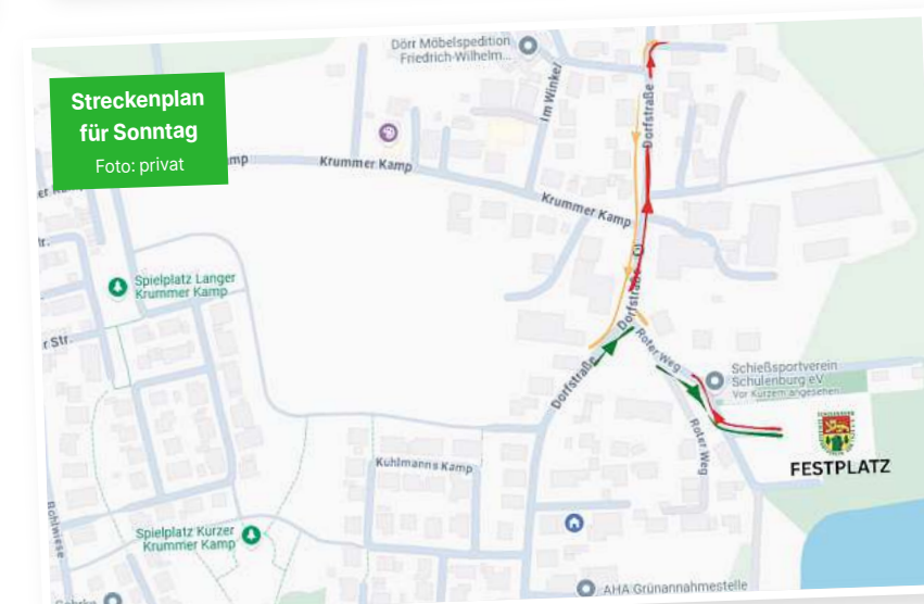
Streckenplan für Sonntag.