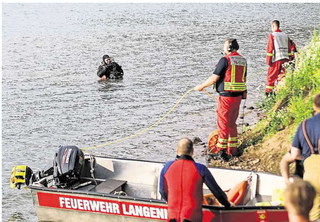
Taucher suchten unter Wasser bis in Tiefen von rund 17 Metern.

Im Einsatz waren rund 80 Einsatzkräfte: Die Ortsfeuerwehren Langenhagen, Krähenwinkel