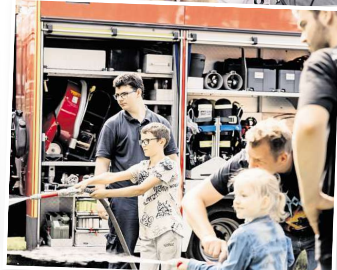
Auch die Kinder kommen beim Fest sicherlich nicht zu kurz.