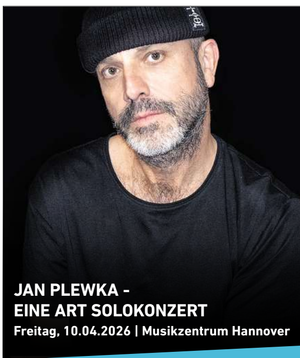
JAN PLEWKA - EINE ART SOLOKONZERT Freitag, 10.04.2026 | Musikzentrum Hannover

tickets.haz.de | Barrierefreier Schwerbehinderten-Service unter: service@haz-ticketshop.de