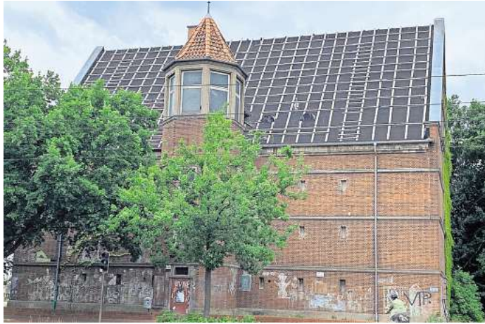
Wegen des Ukraine-Krieges: Die Bundesanstalt für Immobilienaufgaben verkauft aktuell keine Bunker mehr.