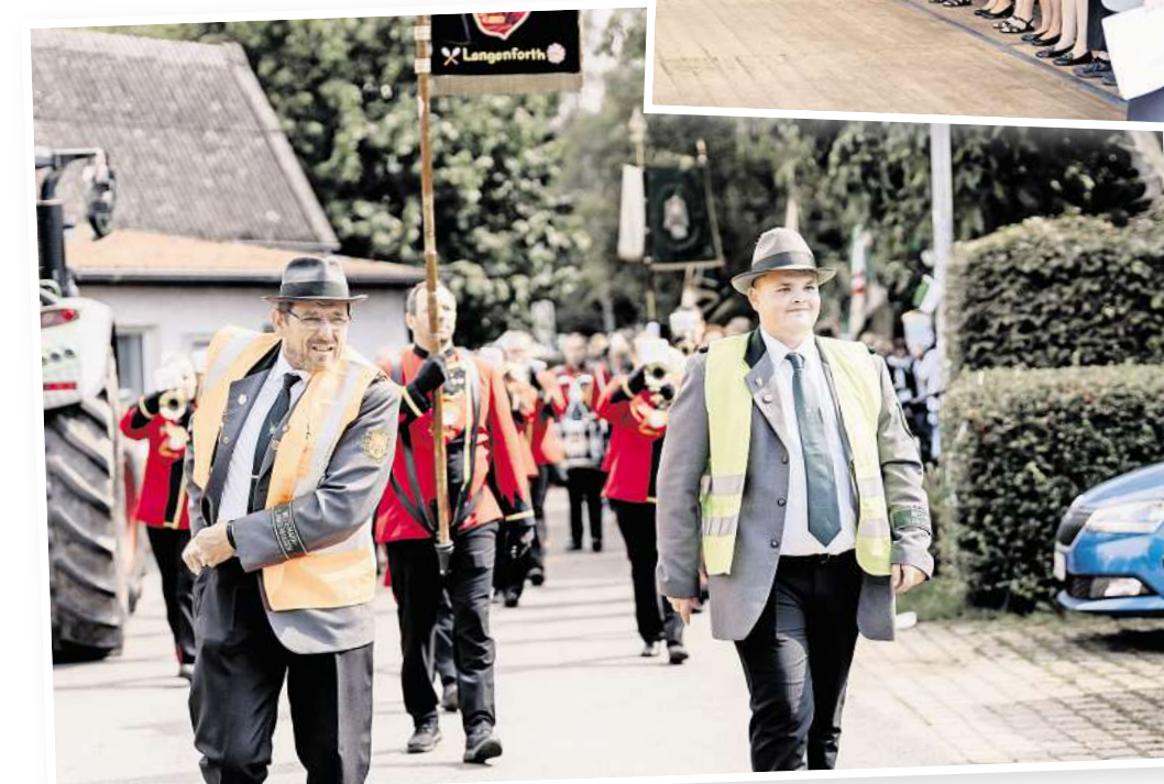
Der Festumzug führt sowohl am Sonnabend als auch am Sonntag durch den Ort.

Mit QR-Code Kombiticket vorab online buchen und Geld sparen.