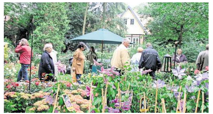
Das Gartenfestival lädt zum Stöbern in historischer Kulisse ein.

Viele weitere, spannende Neuigkeiten aus der lokalen Kulturszene finden Sie in der aktuellen Ausgabe unseres Partnermediums magaScene, monatlich frisch gedruckt und kostenlos an über 500 Auslegestellen in Hannover oder online auf www.magaScene.de inklusive Download-Möglichkeit.