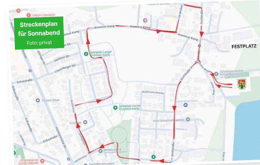
Streckenplan für Sonnabend.