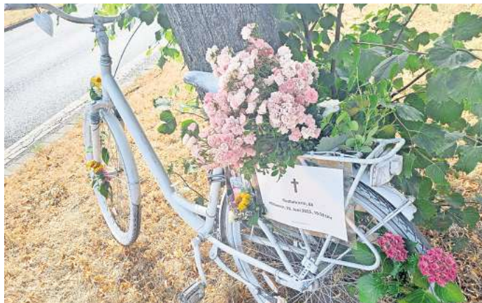
Gedenken, Mahnmal und Abschied: Das weiße Fahrrad steht an der Stelle des tödlichen Unfalls an der Ampel an der Bothfelder Straße / Schöneberger Straße.

Das jetzt vom ADFC Langenhagen aufgestellte weiße Fahrrad wurde in Langenhagen schon einmal aufgestellt, im Jahr 2017 und nur 200 Meter von der jetzigen Unfallstelle am Langen-