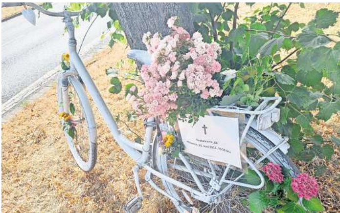
Gedenken, Mahnmal und Abschied: Das weiße Fahrrad steht an der Stelle des tödlichen Unfalls an der Ampel an der Bothfelder Straße / Schöneberger Straße.

den Hinterbliebenen das Beileid des ADFC aus, die an dem weißen Fahrrad Blumen niederlegten und ein Bild der Verstorbenen anbrachten. Tom Finkes, Stellvertretender ADFC-Sprecher sagte zusammen mit Spörer zu, sich der vorbeugenden Überprüfung auch dieser Radfahrer-Unfallstelle in Langenhagen anzunehmen. Spörer sieht dieses weiße Fahrrad auch als „Mahnmal“ an, mit der Mahnung an alle am Verkehr Teilnehmenden, gerade gegenüber den Fußgängern und Radfahrern besonders rücksichtsvoll zu sein, denn sie verfügen nicht über viel Stahl um sich herum wie Personen im Auto und auch über keine Gurte, Airbags und Nackenstützen. Das jetzt vom ADFC Langenhagen aufgestellte weiße Fahrrad wurde in Langenhagen schon einmal aufgestellt, im Jahr 2017 und nur 200 Meter von der jetzigen Unfallstelle am Langen-