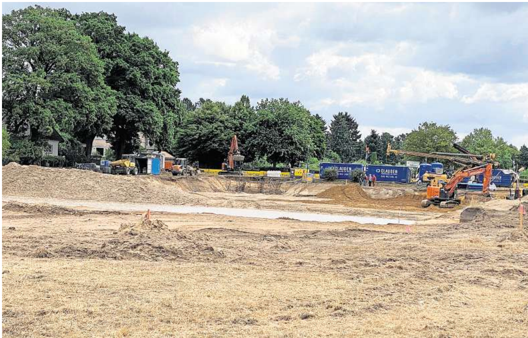
Arbeiten schreiten voran: Die Stadt errichtet an der Leibnizstraße ein Regenrückhaltebecken.

Und warum braucht es an dem Standort in der Kernstadt ein Regenrückhaltebecken? „Ziel ist es, bei starken Niederschlägen das Wasser künftig zwischenspeichern zu können und so Überstauungen im Kanalnetz zu verhindern“, teilt Stadtsprecherin Nina-Sophia Göhlert auf Anfrage dieser Redaktion mit. Die Stadt errichtet ein rund 140 Meter langes und 60 Meter breites Regenbecken mit Lehmabdichtung. Drumherum verläuft ein drei Meter breiter Schotterweg, und