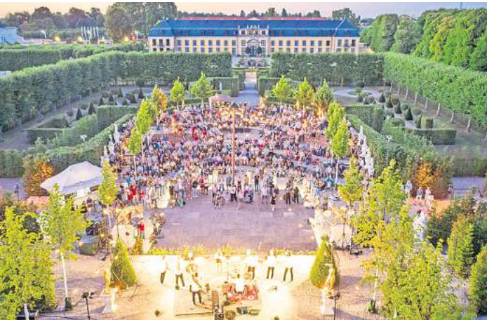
So lauschig können Sommernächte sein.