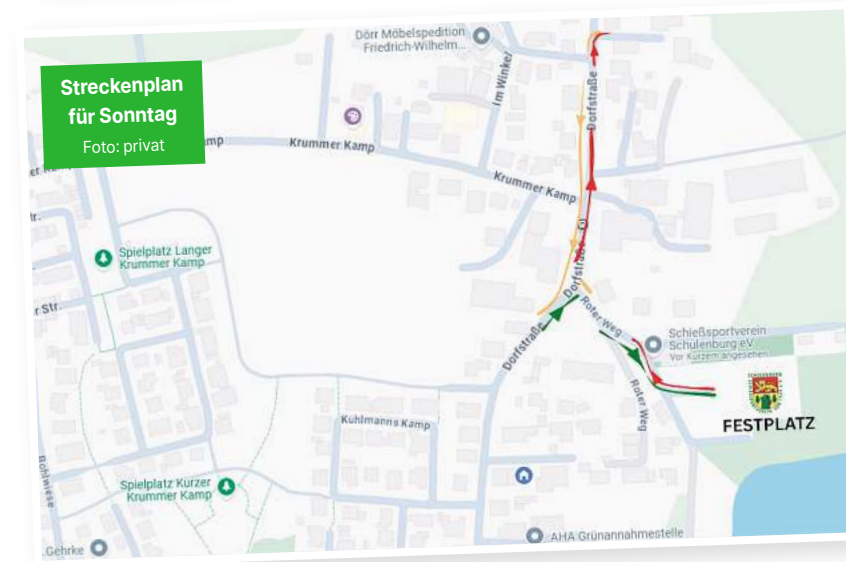
Streckenplan für Sonntag.