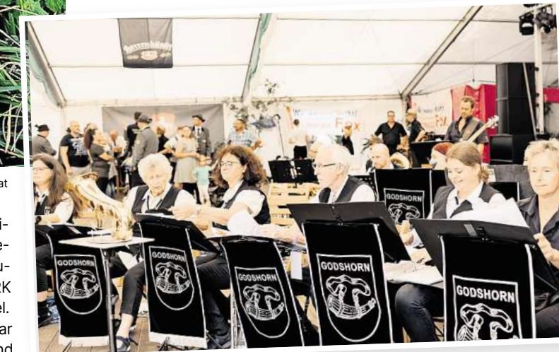
Für musikalische Unterhaltung ist auch beim diesjährigen Schützenfest wieder gesorgt.