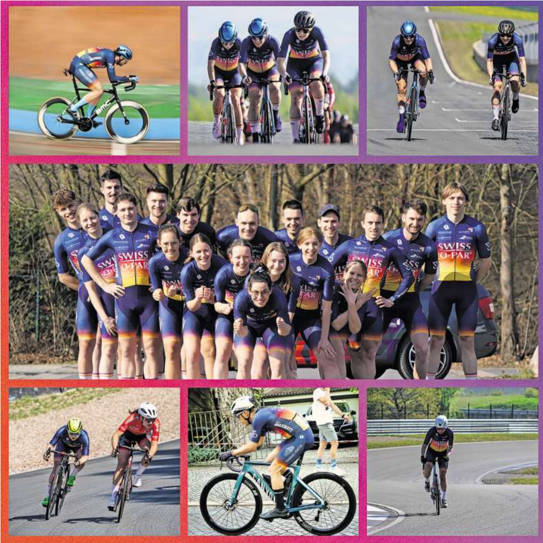
Hat auch einen überregionalen Bekanntheitsgrad erlangt: Team MaxWatt.