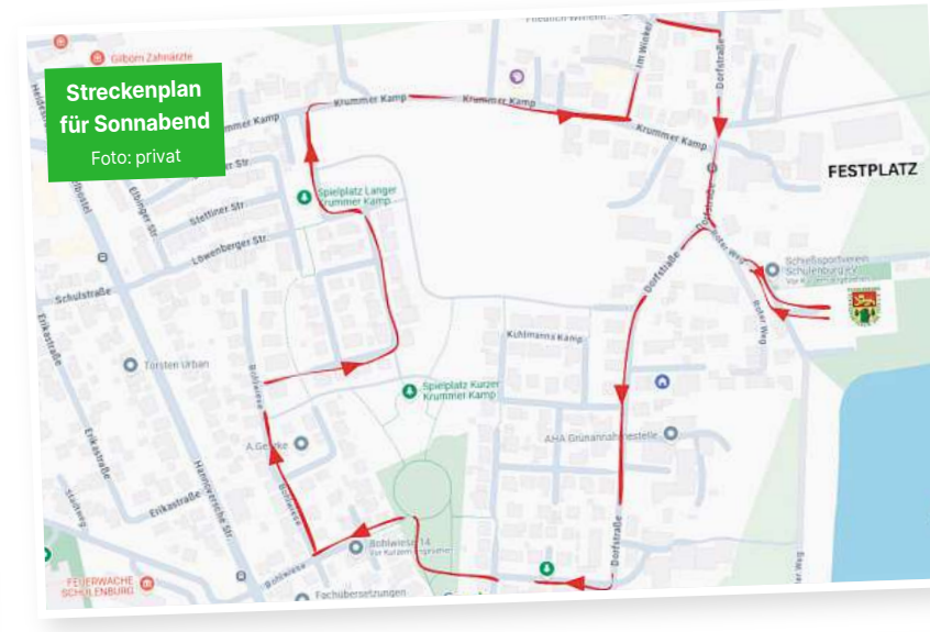
Streckenplan für Sonnabend.