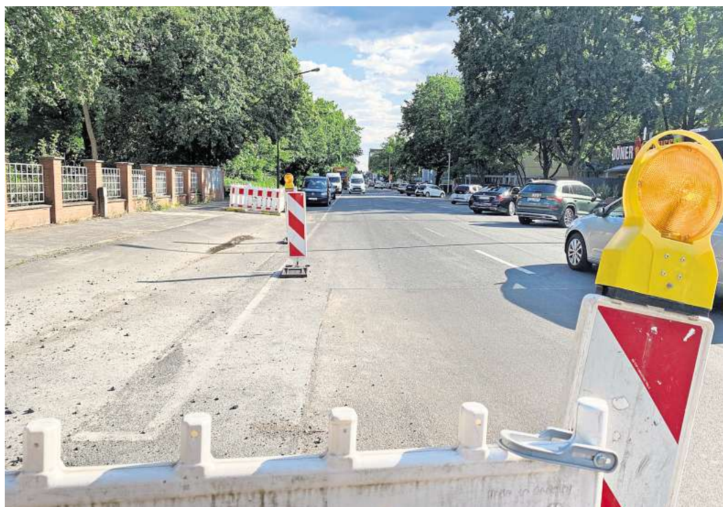
Zwischen Hagenhof und Ehlersstraße: Hier wird in den kommenden Monaten unter anderem die Fahrbahn erneuert.

Zufahrten zu Mehrfamilienhäusern und Garagen bleiben