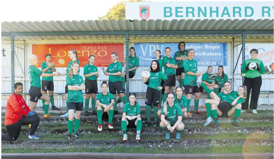
Wollen in der nächsten Saison angreifen: die Fußballerinnen des TSV Godshorn.