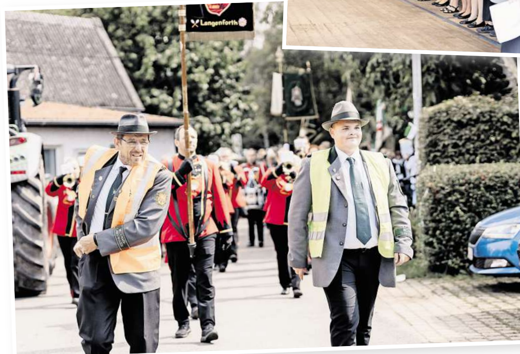
Der Festumzug führt sowohl am Sonnabend als auch am Sonntag durch den Ort.