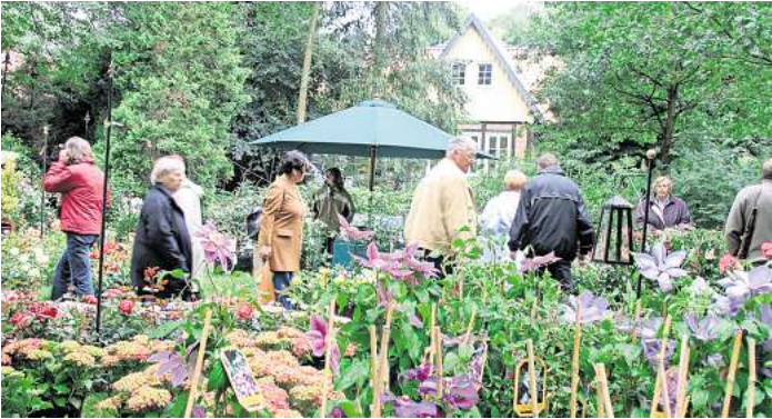
Das Gartenfestival lädt zum Stöbern in historischer Kulisse ein.

Viele weitere, spannende Neuigkeiten aus der lokalen Kulturszene finden Sie in der aktuellen Ausgabe unseres Partnermediums magaScene, monatlich frisch gedruckt und kostenlos an über 500 Ausgestellen in Hannover oder online auf www.magaScene.de inklusive Download-Möglichkeit.