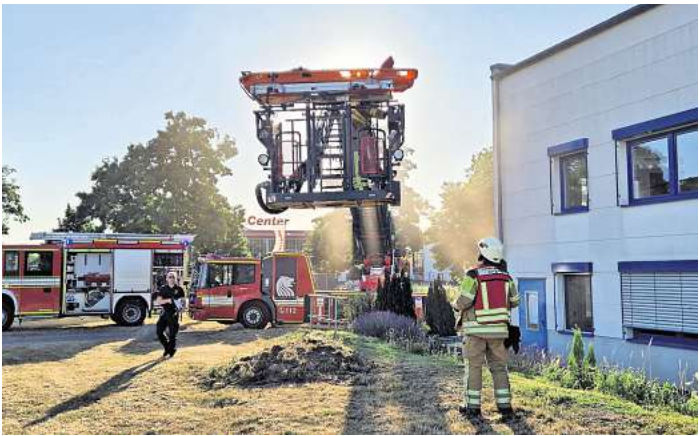
Die Zugübung markierte einen Höhepunkt des laufenden Ausbildungsjahres.

Die Rettung der betroffenen Personen erfolgte über unterschiedliche und situationsangepasste Wege: Über das Treppenhäus, mit Schleifkorbtrage und Bergetuch, sowie mithilfe der Drehleiter. Besonders anspruchsvoll gestaltete sich die Rettung eines nicht gehfähigen Patienten von einer erhöhten Empore, der über einen alternativen Zugang geborgen werden musste. Die Einsatzkräfte bewältigten auch einen simulierten Atemschutznotfall innerhalb des Szenarios souverän. Eine zusätzliche Herausforderung bestand in der unklaren Auslörsache und der schwer zugänglichen Leckage, diese befand sich hinter mehre-