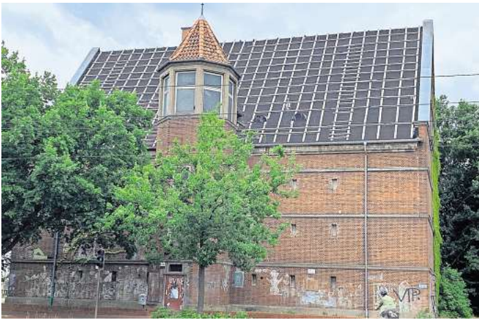
Wegen des Ukraine-Krieges: Die Bundesanstalt für Immobilienaufgaben verkauft aktuell keine Bunker mehr.

Mit Blick auf den russischen Angriffskrieg gegen die Ukraine und die geänderte geopolitische Lage hat die BImA nach eigenen Angaben die aktive Verwertung der bereits entwidmeten und damit grundsätzlich entbehrlichen Bunker seit längerem ausgesetzt. Vor eineinhalb Jahren hatte sich eine BI aus dem linken Spektrum mit dem Namen „Langenhagen mal bürgerlich“ für den Bunker interessiert und wollte dort ein Kulturzentrum etablieren. Gleichzeitig hatte sich auch die Langenhagener Bürgerstiftung das Gebäude als möglichen neuen Veranstaltungsort angeschaut. Für beide Gruppen haben sich die Pläne nun endgültig zerschlagen. Die Bürgerinitiative wird von Oskar aus Hannover organisiert, der seinen Nachnamen nicht nennen will. „Das Projekt ist für uns gestorben“, sagt Oskar auf