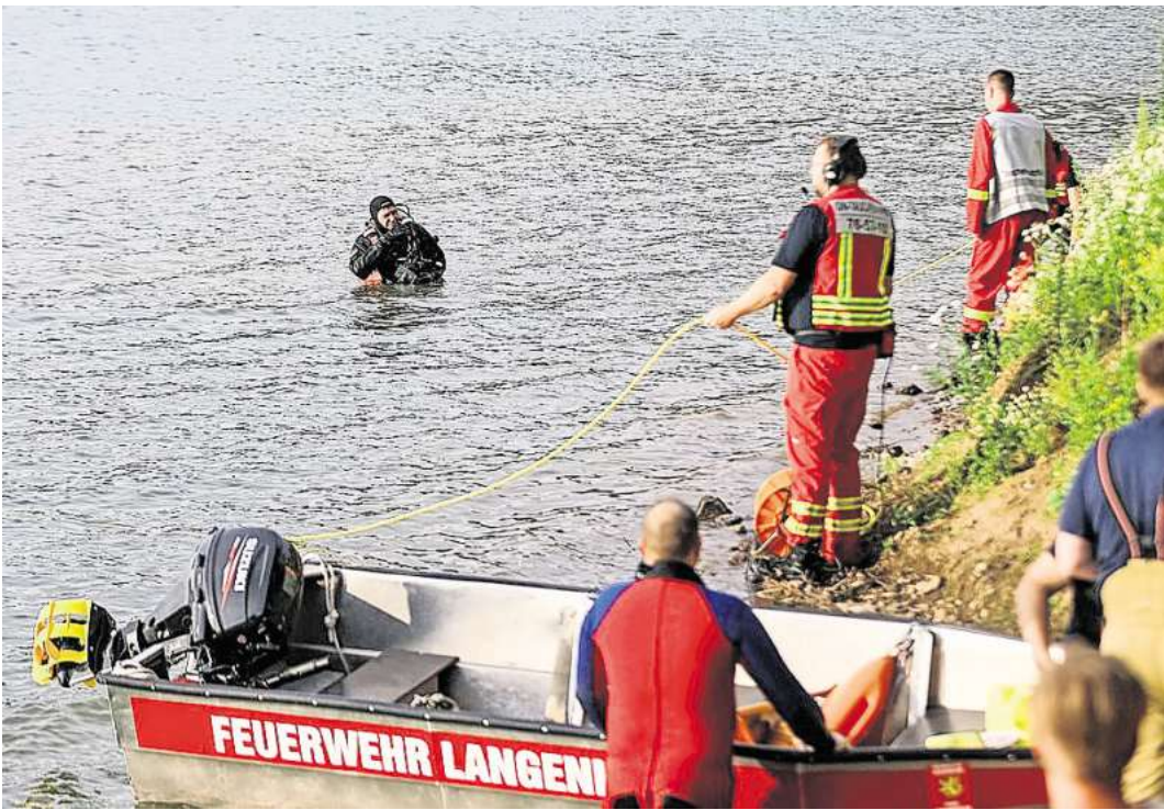
Taucher suchten unter Wasser bis in Tiefen von rund 17 Metern.

Im Einsatz waren rund 80 Einsatzkräfte: Die Ortsfeuerwehren Langenhagen, Krähenwinkel