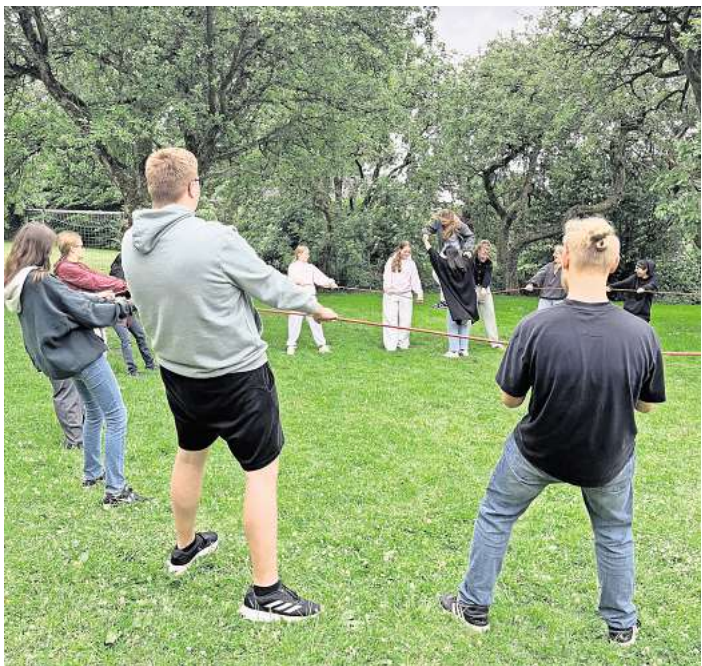
Die Jugendlichen gestalteten ihre Woche aktiv mit.

Die Juleica-Woche 2025 war damit nicht nur eine fundierte Ausbildung, sondern auch ein starker Impuls für junges Engagement in der Stadt Langenhagen.