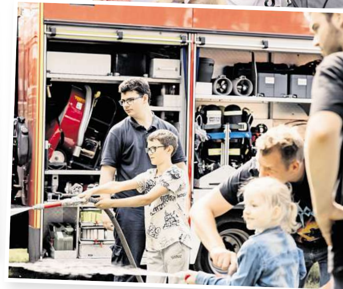
Auch die Kinder kommen beim Fest sicherlich nicht zu kurz.