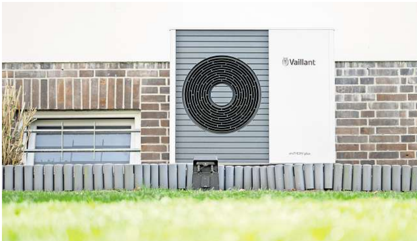
Preise und Details bei Wärmepumpen liegen weit auseinander.

Die Verbraucherschützer prüften die Angebote nach eigenen Angaben, auf Vollständigkeit, Detailgenauigkeit und Kosten. Demnach lagen die Gesamtkosten für eine Wasser-Wärmepumpe in einem Einfamilienhaus zwischen rund 20.000 und etwa 63.000 Euro. Der Mittelwert lag bei rund 36.300 Euro. Natürlich können sich die Kosten je nach Material, Leistung und individuellen Gegebenheiten vor Ort unterscheiden. Doch zum Teil