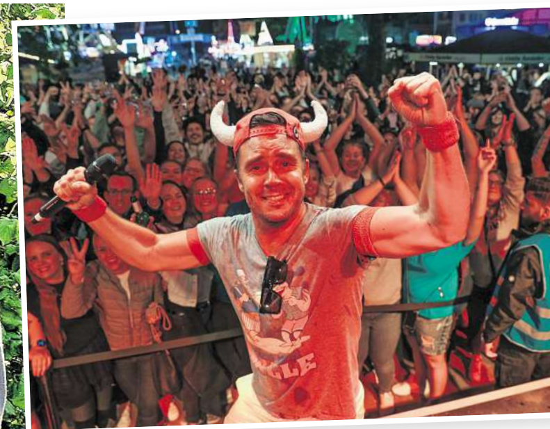
Lorenz Büffel, Stargast von der Baleareninsel Mallorca, tritt am Sonnabend auf.

und Eis von Gelato Original. Darüber hinaus leckere selbstgebackene Kuchen und Torten vom DRK Schulenburg-Engelbostel. Kluwés Café und Weinbar bietet gekühlte Weine und weitere Leckereien an. Und nicht zu vergessen: Wer Lust auf frischen Fisch wie von der Küste hat, kommt auch auf seine Kosten. Das Schützenfest klingt dann um 18 Uhr gemeinsam im Festzelt aus.