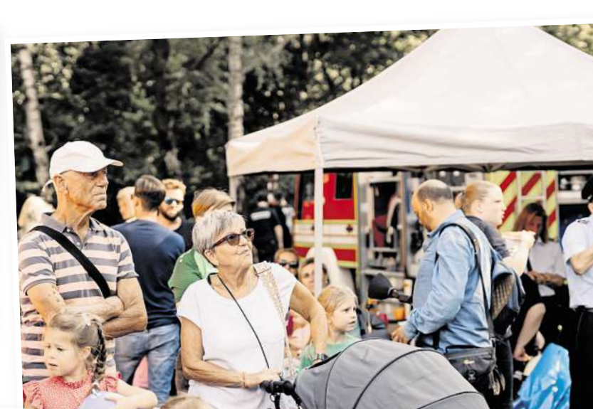
Kind und Kegel werden wieder auf dem Festplatz unterwegs sein.