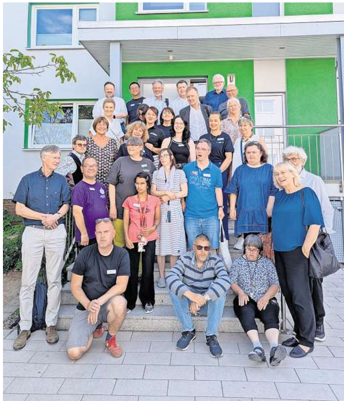
Der Bundesvorstand der Lebenshilfe mit Mitarbeitenden der Lebenshilfe Langenhagen-Wedemark sowie der Selbstvertretung.

MAJA – Jugendarbeit dort, wo sie gebraucht wird. Besonders im Fokus stand die Arbeit von MAJA – die mobile aufsuchende Jugendarbeit der Lebenshilfe. Ihr Ziel: Jugendlichen zwischen zwölf und 24 Jahren im öffentlichen Raum zu begegnen, Konflikte zu entschärfen und ihnen dabei zu helfen, soziale Verant-