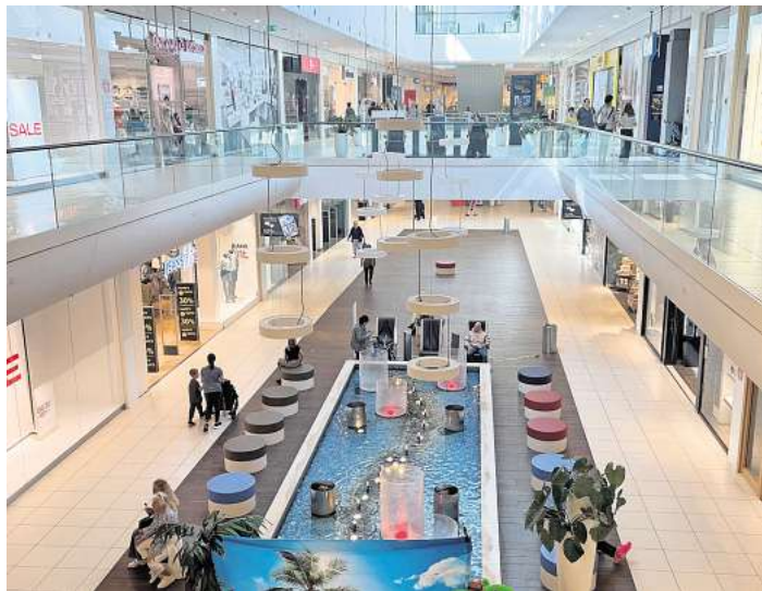
City Center Langenhagen: Ein defekter Melder habe am Sonnabend für „Hektik und Panik“ gesorgt, berichtet die Polizei.