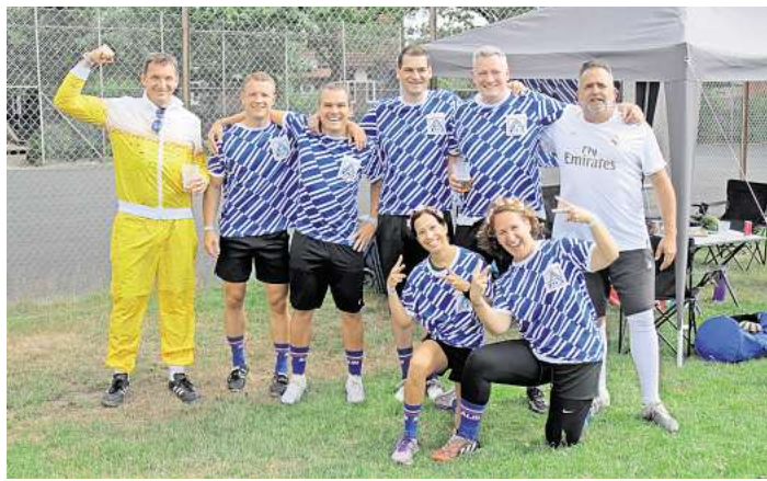
Ein Mixed-Team des MTV Engelbostel-Schulenburg.

ENGELBOSTEL/SCHULENBURG. Am letzten Juni-Wochenende verwandelte sich die Sportanlage des MTV Engelbostel-Schulenburg in eine bunte und ausgelassene Party- und Fußballlandschaft: Der „Malle Cup 2025“ lockte mit seiner einzigartigen Mischung aus Sport, Musik und Festival-Atmosphäre insgesamt 32 Teams an, darunter sowohl Altherrenmannschaften als auch Damen & Mixed-Teams.