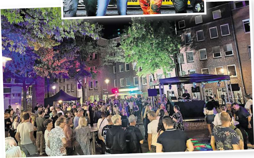
Die Brunnendisco wird auch in diesem Jahr wieder ein Anziehungspunkt sein.