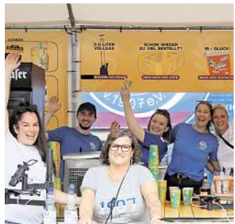
Ganz viele Helfer waren mit Freude dabei.

Das Turnier bot zwei Tage lang Fußball mit jeder Menge Spaßfaktor – weniger im Zeichen des professionellen Wettkampfs, dafür umso mehr im Zeichen von Gemeinschaft, Kreativität und Teamgeist. Spielerinnen und Spieler reisten teils in ausgefallenen Outfits an, und auf dem Platz