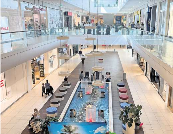
City Center Langenhagen: Ein defekter Melder habe am Sonnabend für "Hektik und Panik" gesorgt, berichtet die Polizei.