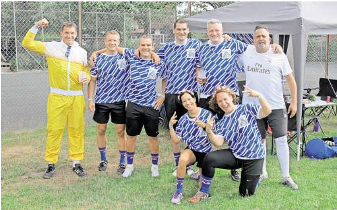
Ein Mixed-Team des MTV Engelbostel-Schulenburg.

Das Turnier bot zwei Tage lang Fußball mit jeder Menge Spaßfaktor – weniger im Zeichen des professionellen Wettkampfs, dafür umso mehr im Zeichen von Gemeinschaft, Kreativität und Teamgeist. Spielerinnen und Spieler reisten teils in ausgefallenen Outfits an, und auf dem Platz