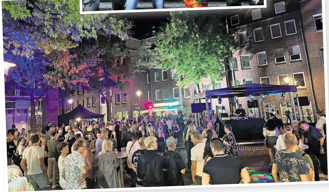
Die Brunnendisco wird auch in diesem Jahr wieder ein Anziehungspunkt sein.