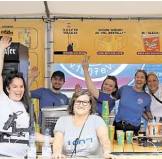
Ganz viele Helfer waren mit Freude dabei.

ENGELBOSTEL/SCHULENBURG. Am letzten Juni-Wochenende verwandelte sich die Sportanlage des MTV Engelbostel-Schulenburg in eine bunte und ausgelassene Party- und Fußballlandschaft: Der „Malle Cup 2025“ lockte mit seiner einzigartigen Mischung aus Sport, Musik und Festival-Atmosphäre insgesamt 32 Teams an, darunter sowohl Altherrenmannschaften als auch Damen & Mixed-Teams.