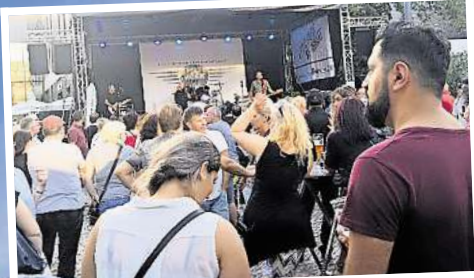
Die Bands geben wieder den passenden musikalischen Rahmen.