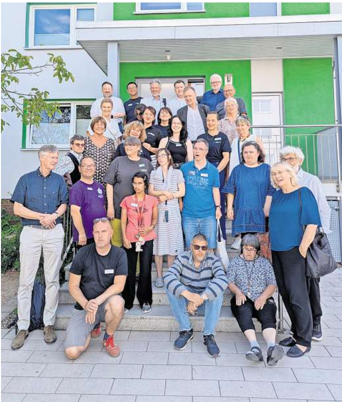
Der Bundesvorstand der Lebenshilfe mit Mitarbeitenden der Lebenshilfe Langenhagen-Wedemark sowie der Selbstvertretung.

MAJA – Jugendarbeit dort, wo sie gebraucht wird. Besonders im Fokus stand die Arbeit von MAJA – die mobile aufsuchende Jugendarbeit der Lebenshilfe. Ihr Ziel: Jugendlichen zwischen zwölf und 24 Jahren im öffentlichen Raum zu begegnen, Konflikte zu entschärfen und ihnen dabei zu helfen, soziale Verant-