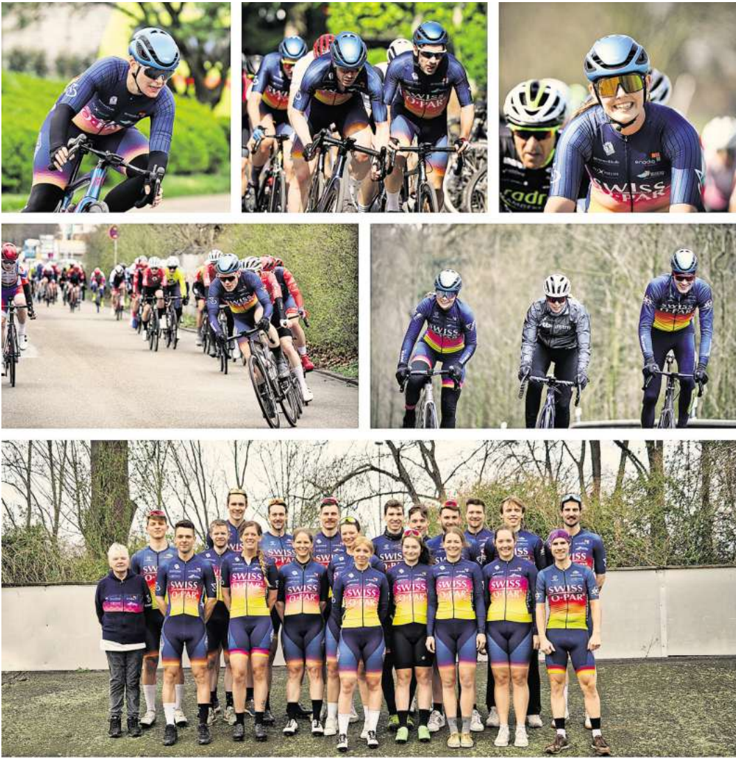
Team MaxWatt bekommt in jüngster Zeit immer mehr Zuwachs an Mitgliedern.