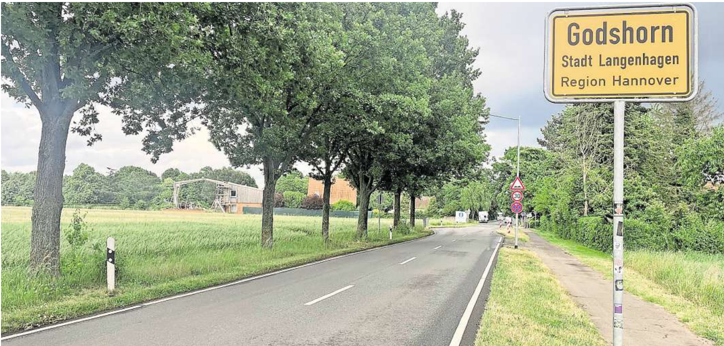
Straße Alt- Godshorn: In einem ersten Schritt soll ab 2027 der Abschnitt zwischen dem westlichen Ortseingang und der Straße Am Lienkamp erneuert werden.

Geht es nach der bevorzugten Variante der Verwaltung, also Tempo-30-Zone, soll der Abschnitt beidseitige Gehwege bekommen, „womit Barrierefreiheit, Aufenthaltsqualität und