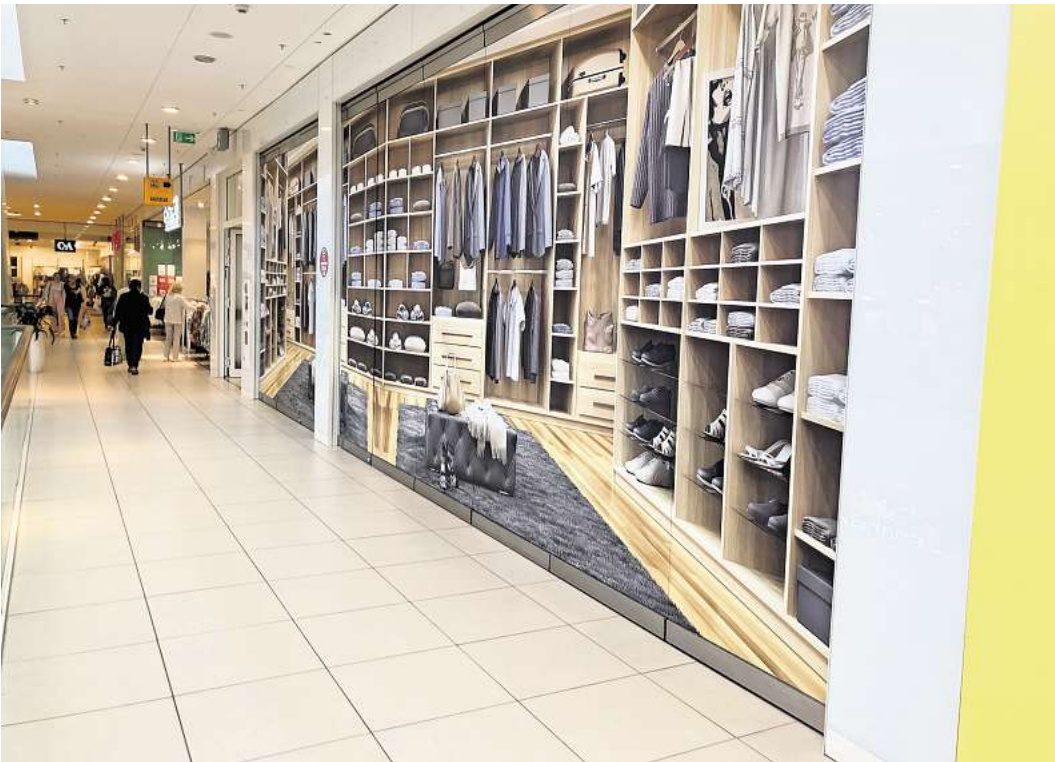
Sieht nach viel Auswahl an Hemden aus - ist aber ein Leerstand: Ein Blick ins Obergeschoss im CCL-Neubau.

„Und das dauert alles etwas länger, als es sonst beim Einzug von neuen Mietern der Fall ist“, sagt Kramm. Im Herbst sollen die Umbau- und Zusammenlegungsmaßnahmen dann aber abgeschlossen sein. „Sobald das passiert ist, wird das Center wieder voll vermietet sein“, sagt Kramm. Sie bittet aber um Verständnis,