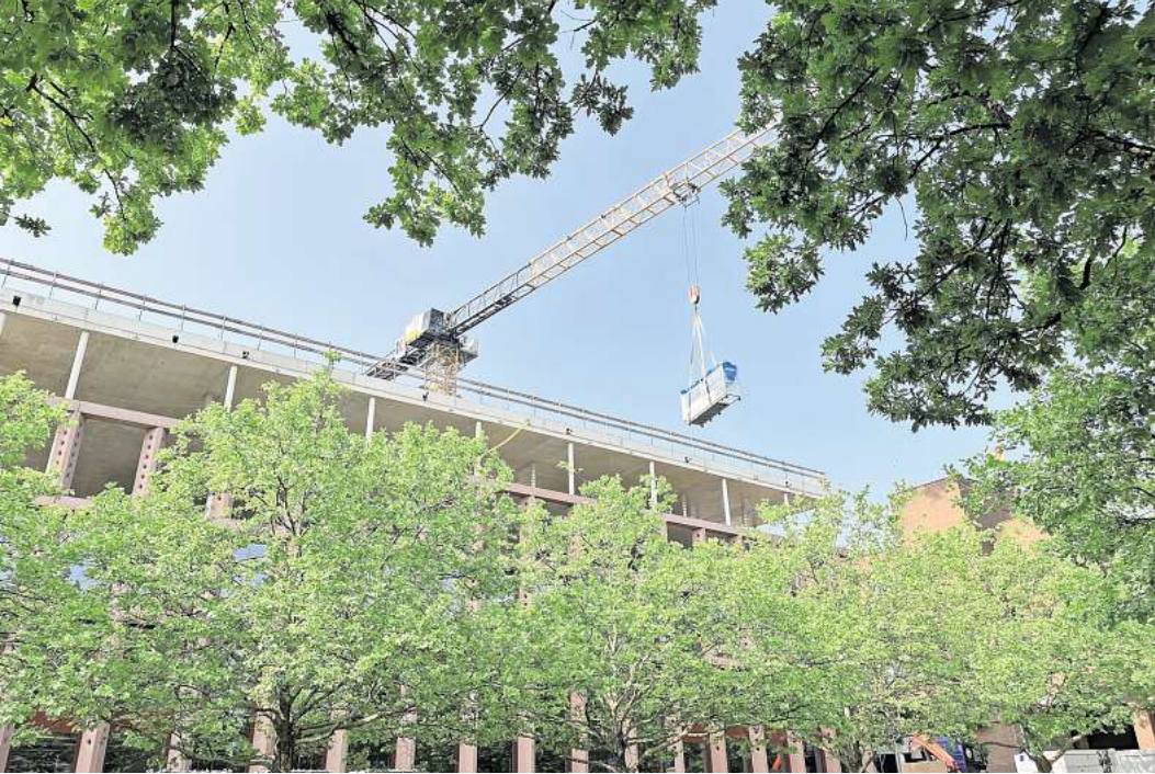
Per Kran aufs Rathausdach: Die Wärmepumpe für das Gebäude schwebt ein.

Eine Wärmepumpe wird per Kran in die Höhe befördert. Das tonnenschwere Gerät soll sowohl den Neubau als auch den Altbau des Rathauses mit Wärme versorgen.