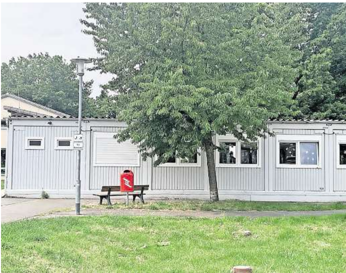
Umbau der Kita Schulenburg verschiebt sich weiter: Die Container sollen bleiben.

Bereits Ende 2021 hatte der Rat der Stadt Langenhagen beschlossen, die Kita in Schulenburg umzubauen und zu erweitern. In der Beschlussdrucksache von damals heißt es, „die im Bestandsbau untergebrachten Räumlichkeiten entsprechen nicht mehr den Anforderungen des Kindertagesstättengeset-