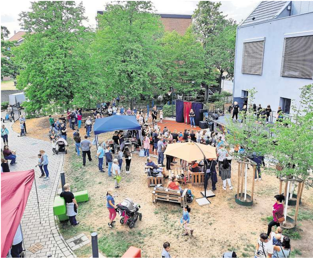
Verschiedene Jugendorganisationen sind für das Sommerfest im Haus der Jugend verantwortlich.

LANGENHAGEN. Das alljährliche Sommerfest im Haus der Jugend Langenhagen steht vor der Tür. Für Sonnabend, 5. Juli, von 15 bis 18 Uhr lädt die Abteilung Kinder, Jugend und Kultur der Stadt Langenhagen am Langenforther Platz 1 zu einem bunten Sommernachmittag ein. Besucherinnen und Besucher erwartet ein abwechslungsreiches Programm mit spannenden Mitmachaktionen, kreativen Angeboten, einer Hüpfburg sowie unterhaltsamen Darbietungen der Clownin Barbalotta und des Zauberers Tobini. Selbstverständlich ist auch für das leibliche Wohl gesorgt. Das Sommerfest wird von verschiedenen Jugendorganisationen aus Langenhagen mitgestaltet, darunter der Kunstverein Langenhagen, das Johanniter Jugendzentrum, der Johanniter Sanitätsdienst, das Kreisjugendwerk der AWO sowie die Mobile aufsuchende Jugendarbeit der Lebenshilfe (Maja). Gemeinsam bieten sie einen abwechslungsreichen Nachmittag für die ganze Familie. Der Eintritt ist kostenfrei.