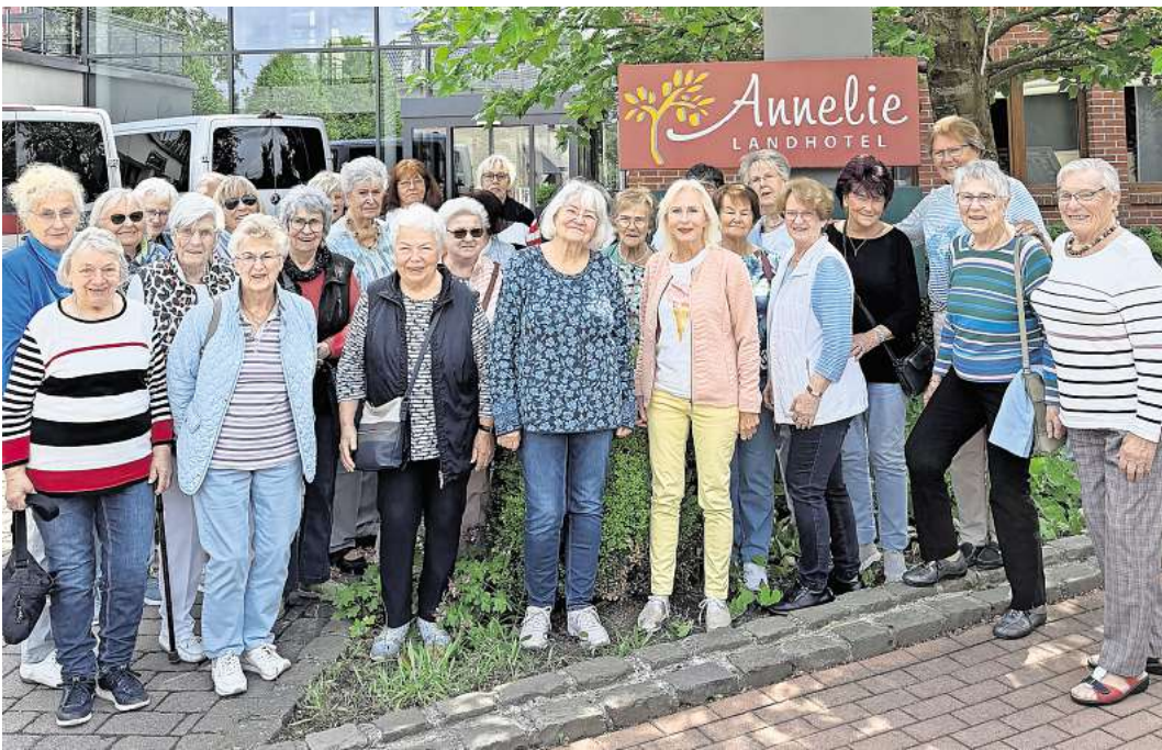
Auf die AWO Engelbostel wartet ein interessanter Ausflug.

ENGELBOSTEL/SCHULENBURG. Pünktlich wie immer fanden sich die Teilnehmenden der AWO Engelbostel/Schulenburg an den verschiedenen Abfahrtsstellen in Engelbostel und Schulenburg ein, sodass die Fahrt mit dem voll besetzten Bus nach Preußisch Oldendorf in Nordrhein-Westfalen ging. Dort wurde die Reisegruppe schon im Landhotel Annelie zum gemeinsamen Essen erwartet. Nach dem Essen wurden in einer Modenschau die neuesten Modetrends vorgeführt, die im Anschluss im Geschäft Mon Amie anprobiert und gekauft werden konnten. Es war wieder für alle etwas dabei. Nachdem alle mit ihren Einkäufen wieder im Bus waren, ging es noch in das Bauern-Cafe Landhaus Dröschler. Hier wartete bereits ein leckerer Kuchen und Kaffee oder Tee auf uns. Gut gestärkt und guter Laune ging es dann wieder zurück nach Schulenburg und Engelbostel.