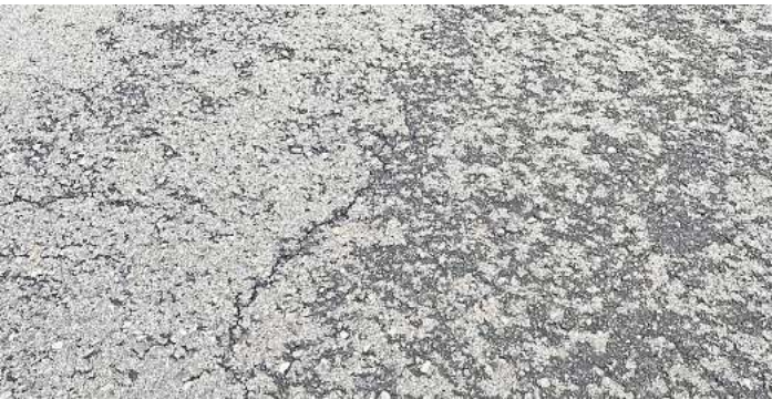
Die Fahrbahn hat Schäden: Die Straße Alt-Godshorn muss saniert werden.

Verkehrssicherheit insbesondere im Schulverkehr gesichert werden können“, heißt es in der Drucksache. „Gerade im Falle einer zusätzlichen Erschließung neuer Wohngebiete westlich des Friedhofs wäre ein durchgehender Gehweg auch auf der Nordseite der Straße Alt-Godshorn eine zwingende Voraussetzung.“