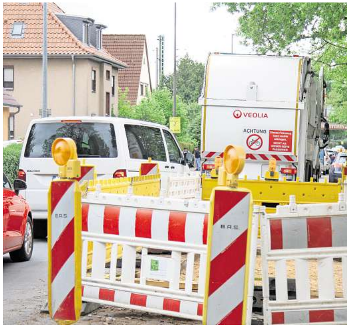
Hier stockt es: Auf der Walsroder Straße in Krähenwinkel sorgen Staus für Probleme.

„Die Busse 610 und 611 sind ohnehin oft überfüllt. Aber durch den Stau und die lange Wartezeit an den Ampeln schaffen es die Busse oft nicht, pünktlich an den weiterführenden Schulen in Langenhagen zu sein“, sagt Schnehage. Dabei seien die Ankunftszeiten der für den Schülertransport ausgelegten Extrabusse so getaktet, dass die Schulen bis 8 Uhr erreicht werden – eigentlich kein Problem für den Beginn um