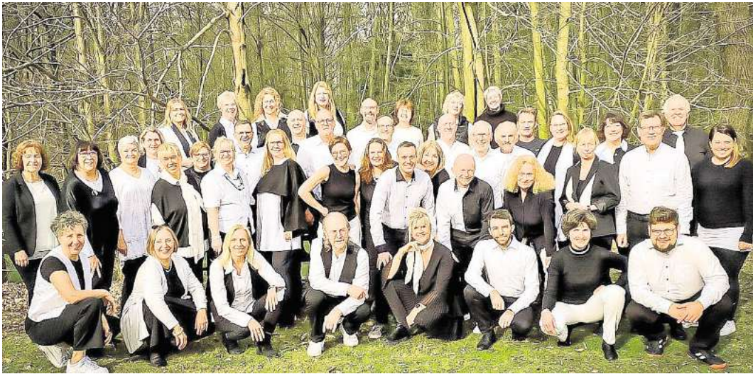
Das Ensemble Choir under Fire verfügt über ein breites Repertoire.

21. Juni: Konzert des Choir under Fire in der Aula des Geschwister-Scholl-Gymnasiums