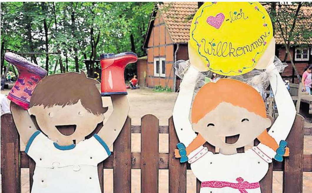
Die MartinsKita in Engelbostel lädt für Sonntag, 15. Juni, zum großen Geburtstagsfest ein.

ENGELBOSTEL. 60 Jahre: Für Sonntag, 15. Juni, lädt die Evangelisch-lutherische MartinsKiTa in Engelbostel herzlich zum großen Jubiläumsfest ein. Gefeierte wird von 12 bis 16 Uhr auf dem Gelände in der Kirchstraße 58 – und es ist für jede Menge Spaß und Unterhaltung gesorgt! Den Auftakt macht ein Gottesdienst, bevor ein buntes Programm für Jung und Alt beginnt. Die kleinen Gäste dürfen sich auf Kinderschminken, Kindertattoos, eine große Hüpfburg und natürlich auf den Besuch des bekannten Zauberers Tobini freuen, der mit seiner Show garantiert für staunende Gesichter sorgt. Auch für das leibliche Wohl ist bestens gesorgt: Es wird gegrillt, es gibt eine Auswahl an Kuchen, Eis und kalten Getränken für jeden Geschmack. Ein besonderes Highlight ist der Auftritt der Tanzgruppe „Foxys“ des MTV Engelbostel/