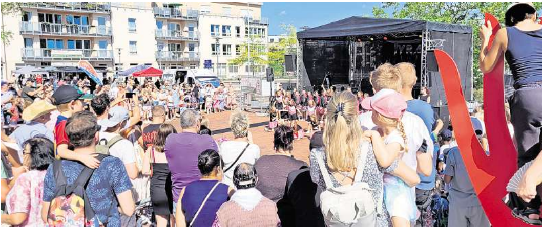
Die Besucherinnen und Besucher erwartet wieder ein umfangreiches Programm.