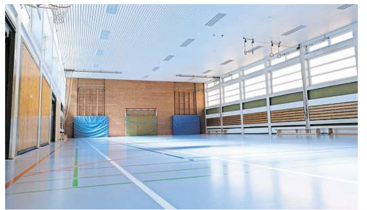
Hier trainiert die Tischtennisabteilung des MTV Engelbostel-Schulenburg, die in der kommenden Saison zweite Bundesliga spielen wird: In der Sporthalle der Grundschule Engelbostel.

Der Frust über die Situation sitzt beim Vorstand tief. Bei offiziellen Anlässen werde der Verein gelobt, Bürgermeister und Sportring attestieren „wunderbare Arbeit“. Doch konkrete Hilfe bleibe aus. „Wir finden Gehör beim Sportring. Aber der Kommunalpolitik, Ratspolitik und Verwaltung fehlt einfach der Blickwinkel dafür“, sagt Kreitlow. „Dabei geht es hier nicht um uns, sondern um die nach-