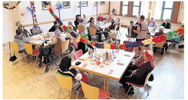
Die AWO Kaltenweide sorgt für ein lebendiges Miteinander.

Besondere Highlights sind die beliebten kulinarischen Veranstaltungen: das Spargelessen im Frühling, das Gänseessen im Herbst, das deftige Grünkohles-