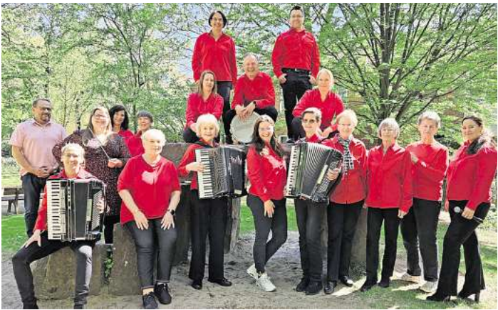
Die Akkordeonfreunde versprechen für ihr Jahreskonzert ein vielfältiges Programm.

Das renommierte Orchester con brio wird das Publikum mit modernen Stücken wie Mission Impossible, den traditionellen Ungarischen Tänzen und dem Bossa Nova Hit: The Girl from Ipanema in seinen Bann ziehen. Auch das Orchester Vive l'Akkor-