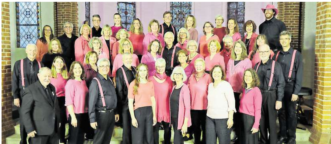
Tritt am Sonntag, 17. Mai, in der Emmauskirche in Wiesenau auf: der Chor AnySingElse.

Sonnabend, 17. Mai: Chor AnySingElse gibt Konzert