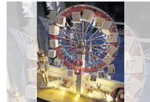
1. Platz: Janina Gundelach (Hannover)