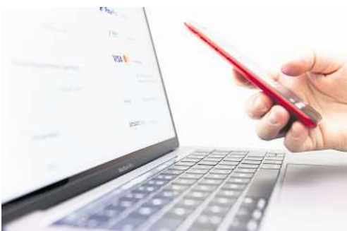
Nicht in allen Fällen greift der Käuferschutz im Onlinehandel, wie etwa bei Dienstleistungen, Apps, Onlinespielen oder Gutscheinen.

Mit dem Käuferschutz von PayPal, Klarna, Amazon Pay und Co. bei Onlinekäufen auf der sicheren Seite? Mitnichten. Denn die Versprechungen der Anbieter sind mitunter trügerisch, stellt die Verbraucherzentrale NRW fest. Immer wieder gebe es Fälle, in denen sich Verbraucherinnen und Verbraucher nach Problemen mit dem Käuferschutz an die Verbraucherschützer wenden. Blind darauf verlassen sollte man sich darum nicht. Prinzipiell soll der Käuferschutz Kundinnen und Kunden absichern, wenn die im Internet bestellte Ware mangelbehaftet oder gar nicht ankommt. Die Bezahldienste versprechen in solchen Fällen, den Kaufpreis zu erstatten. Doch nicht immer