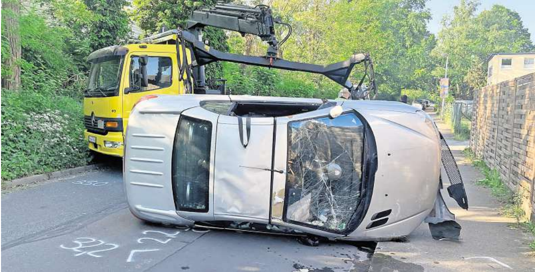
Am Freitag, 10. Mai, ereignete sich ein schwerer Unfall am Bahndamm.

2. Die größten Probleme machen Parken und Wildwechsel Die meisten Unfälle entstehen laut der Statistik beim Parken, aufgrund von Wildwechsel oder haben sonstige Ursachen. Diese Unfälle machen den Großteil mit knapp 87 Prozent aus. 4,4 Prozent der Unfälle entstehen, weil der Abstand nicht eingehalten wird und 3,8 Prozent, weil Verkehrsteilnehmer die Vorfahrt missachten. Weitere Gründe sind Fehler beim Abbiegen, überhöhte Geschwindigkeit sowie die Auswirkungen von Alkohol- und Drogenkonsum.