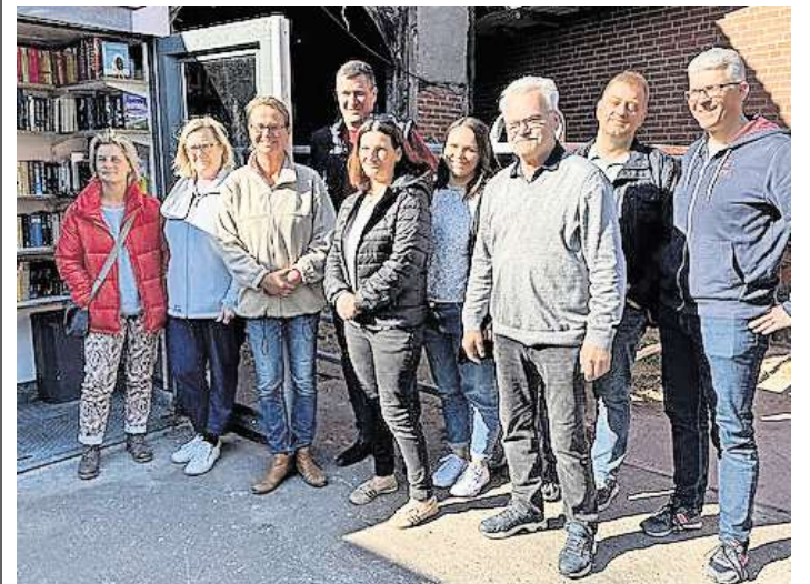
Verschiedene lokale Akteure waren an der Umsetzung des Projektes beteiligt.

Über den Bücherschrank: Der öffentliche Bücherschrank in einer ehemaligen Telefonzelle auf dem Hof Rotermund in Kaltenweide ist frei zugänglich und tagsüber geöffnet. Bürgerinnen und Bürger können Bücher kostenlos entnehmen und eigene, gut erhaltene Bücher einstellen.