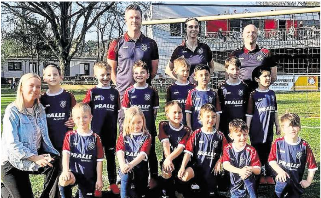
Die Kicker des TSV KK freuen sich über das neue Outfit.

Jungs – und viel Spaß beim Kicken“ Wir sind stolz, euch auf diesem Weg begleiten zu dürfen“, heißt es auf der Instagram-Seite des familiengeführten Unternehmens.