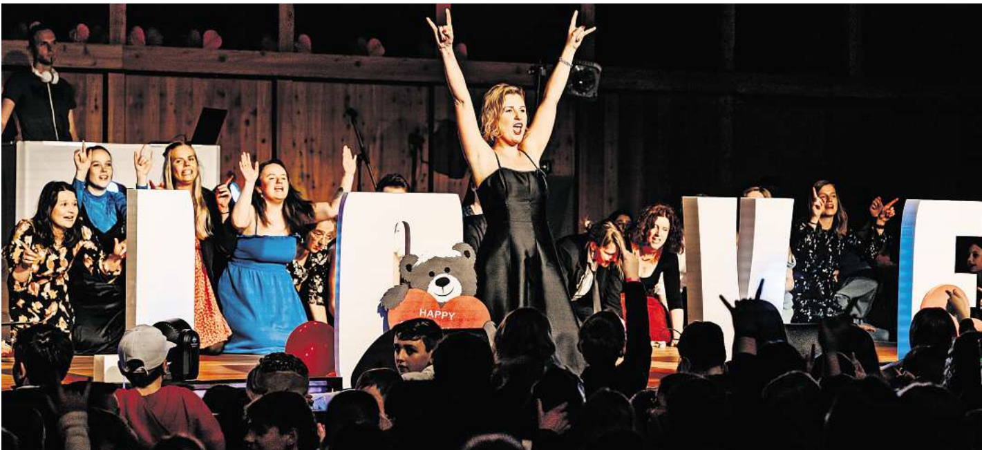
Der Schulball war weit mehr als eine Tanzveranstaltung.

Als schließlich „We Will Rock You“ durch die Boxen schallte und niemand mehr auf den Stühlen blieb, stand fest: Dieser Schulball war ein großer Erfolg! Gelebte Schule in bester Atmosphäre – ein unvergesslicher Abend für die gesamte Schulgemeinschaft.