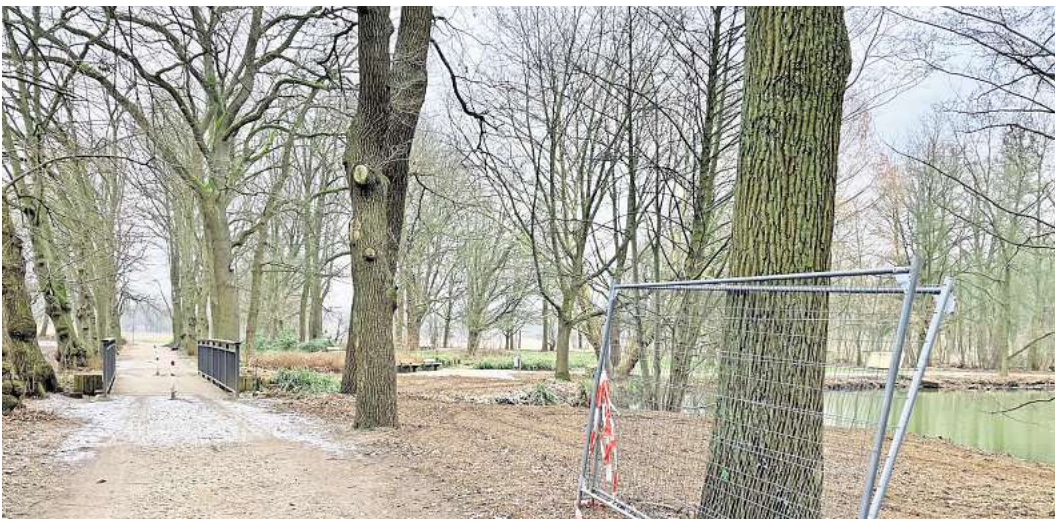
Sanierungsprogramm „Lebendige Zentren“: Stadtpark Langenhagen nach Rodung.

Der Grund für den Rückschnitt: Die Wasserqualität der Teiche habe sich über die vergangenen Jahrzehnte immer weiter verschlechtert. Schuld daran sei