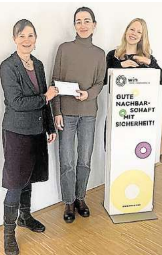
Große Freude bei allen Beteiligten bei der Spendenübergabe.

tion über die Arbeit des Beratungszentrums oder fachliche Unterstützung - der Vielfalt der Angebote, die der Verein win im Quartierstreff Wiesenau anbietet wird ein weiterer Aspekt für Respekt und Gewaltfreiheit hinzugefügt.