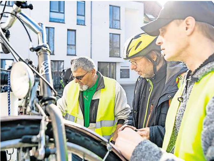
Die Idee liegt darin, sich gegenseitig mit Tipps und Tricks zu unterstützen.

Ein erstes Planungstreffen zum Start der Fahrrad – Saison findet am Mittwoch, 26. Februar, um 17 Uhr im Bonusraum des Quartiertreff Wiesenau an der Freiligrathstraße 10 statt. Die mobile Fahrradwerkstatt „Quartiersschrauber Wiesenau“ wird gefördert vom Bundesministerium für Umwelt, Naturschutz, nukleare Sicherheit und Verbraucherschutz. Eine Anmeldung ist nicht erforderlich.