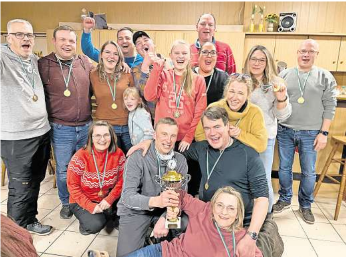
Der Spaß stand beim Boßel-Turnier im Vordergrund.

Im Vordergrund stand das gemeinschaftliche Erlebnis in freier Natur und der Spaß in den verschiedenen Teams. Das abschließende Abendessen rundete den Tag ab, es gab genügend Gelegenheit zum Austausch – und natürlich die Siegerehrung. Man freue sich schon wieder auf das Boßel-Event im nächsten Jahr, war allenthalben zu hören.