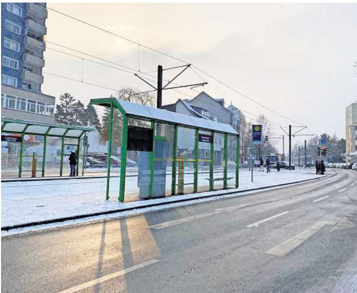
Barrierefrei: Südlich der Haltestelle Angerstraße in Langenhagen soll 2027 ein Hochbahnsteig errichtet werden.

Bis zur Umsetzung der Barrierefreiheit am Haltepunkt Angerstraße dauert es noch zwei Jahre. 2027 soll planmäßig mit dem Bau begonnen werden. Weil für den