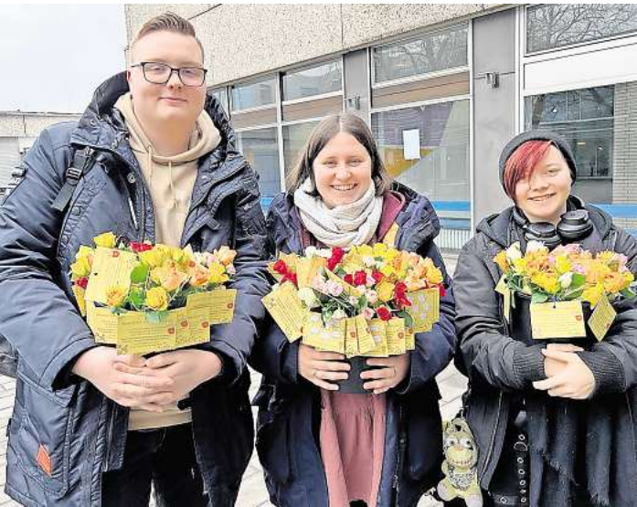
Die Schülerinnen und Schüler weisen auf die Wichtigkeit der Bundestagswahlen hin.