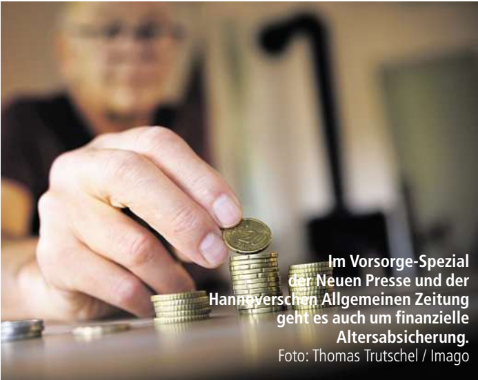
Im Vorsorge-Spezial der Neuen Presse und der Hannoverschen Allgemeinen Zeitung geht es auch um finanzielle Altersabsicherung.