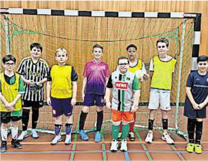
Die Fußball-AG hat den Anfang gemacht.