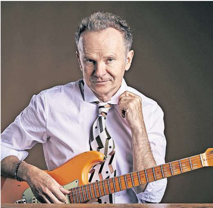
Steht für Wortwitz: Willy Astor.

LANGENHAGEN (OK). Der bekannte Willy Astor kommt am Freitag, 21. Februar, um 20 Uhr in den Theatersaal und präsentiert sein Programm „Reimart und Lachkunde“. Er garantiert seinem Publikum, dass „der Humor direkt vom Erzeuger kommt“. Erscheinen wird der Künstler an diesem Abend wieder persönlich, alleinstehend und selbst redend. Tickets an der Abendkasse liegen zwischen 33 und 37 Euro. Der Vorverkauf ist nur über Reservix möglich. Geballte Kraft und Dynamik, Musik und eine ordentliche Portion Humor – das ist Tridiculous. Ein Zusatztermin dieser rasanten Veranstaltung mit dem Titel „Die Show“ läuft am Sonntag, 23. Februar, im Theatersaal. Die Ticketpreise für diesen Mix aus Artistik, Beatbox und Comedy liegen zwischen 23 und 27 Euro an der Abendkasse.