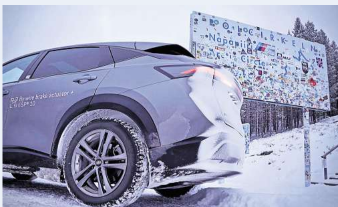
Erfolgreicher Langstreckentest für ein neues Bremssystem.

Für diesen grundlegend neuen Ansatz bietet Bosch eine robuste und effiziente Lösung mit zwei unabhängigen hydraulischen Bremsaktuatoren – einem By-Wire-