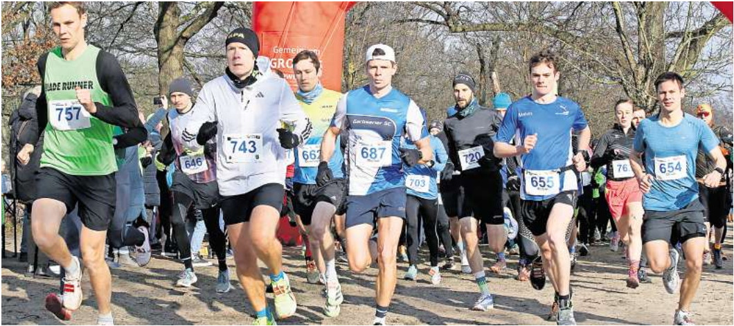
312 Finisher gingen insgesamt an den Start.

den, wenn ich nicht nach drei Runden langsamer geworden wäre“, sagte der Garbsener und gab sich mit Platz drei in 27:59 Minuten zufrieden. Das Duell an der Spitze ging bis zum Ende der vorletzten Runde. „Ich wollte mich nicht nur auf den Spurt verlassen und es schon da probieren“, sagte Kuhlmann. Der Bothfelder hatte nach dem Start beim Erfurt-Indoor-Meeting als Tempomacher auf dem Weg in seine neue Heimat Düsseldorf Zwischenstopp in der alten Heimat gemacht. Mit Erfolg. In 27:10 Minuten siegte er vor Rinke (27:35). Bei den Frauen wiederholte Pauline Berg in 34:04 Minuten ihren Vorjahressieg vor Mandy Krause (Lehrte/34:44).