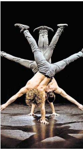
Akrobatik, Beatbox und Comedy: Das alles zusammen zeichnet Tridiculous aus.