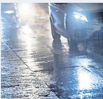
Gefährlich: Durch überfrierende Nässe oder gefrierenden Regen kann Glatteis entstehen.

Wird schon vor Antritt der Fahrt in Verkehrshinweisen vor