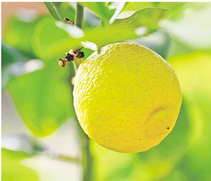
Das „Citrus-Fest“ in der Orangerie stellt die kostbaren Früchte, einst als „goldene Äpfel der Hesperiden“ gefeiert, in den Fokus: mit kulinarischen Genüssen

ein Herrschaftsinstrument der absoluten Monarchie. Sie symbolisierten die ordnende Kraft des Monarchen, boten eine Bühne für die komplexen Rituale des höfischen Lebens, dienten der Repräsentation und Legitimierung des Herrschers und waren einer der Orte, auf denen Diplomatie auf Augenhöhe mit anderen Mächten stattfand. Der Große Garten war damit auch ein wichtiges Element beim Aufstieg der Herzöge von Braunschweig-Lüneburg, die ab 1714 mit Georg I. auch den König von England stellten. Die Ausstellung „Gärten aus Meisterhand“ feiert den Geburtstag des Großen Gartens seit dem 14. Februar in der Orangerie und läutet das für das ganze Jahr geplante Jubiläumsprogramm ein. Die Ausstellung beleuchtet die Entstehung aus der Perspektive der Gärtner und wurde von Gartenhistorikerin Heike Palm konzipiert, die erstaunliche Bilder, Geschichten und Exponate zusammengestellt hat. Bis zum 6. April zeigt sich die Orangerie außerdem in ihrer ursprünglichen Funktion als Überwinterungshaus, in dem während der kalten Monate Palmen und Zitrus-Pflanzen untergestellt werden. Ein besonderes Konzerterlebnis steht am 25. Februar mit „Blütezeiten: Natur und Poesie“ im Rahmen der Reihe „Herrenhausen Barock“ auf dem Programm. Es ist ein Konzert im Rahmen der 8. Steffani-Festwoche in Hannover. Inmitten der Ausstellung in