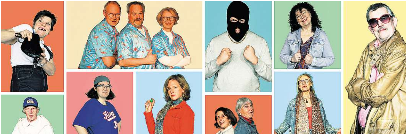
Die Bowlingbahn ist dieses Mal der Ort des Geschehens.

Euro Kinder bis einschließlich zwölf Jahren; Abendkasse: plus zwei Euro Aufschlag. Der Vorverkauf ist bereit im vollen Gange, und wer sicher einen Platz in den drei Vorstellungen sichern will, sollte sich frühzeitig um ein Ticket bemühen. An der Abendkasse sind erfahrungsgemäß nur noch Restkarten erhältlich. Vorverkaufsstellen sind: Spielwaren Bertram in Mellendorf, Wedemarkstraße 33 in Mellendorf, und bei der Buchhandlung Bücher am Markt, Am Markt 8 in Bissendorf. Wer von außerhalb der Wedemark zum Stück anreist und auf die Abendkasse hofft, kann sich unter der Rufnummer (0152) 07 55 26 25 über weitere Vorverkaufsmöglichkeiten informieren.