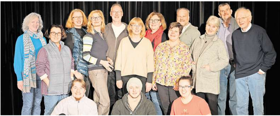
Die Theatergruppe Wedemark freut sich auf viele Besucherinnen und Besucher bei den drei Aufführungen.

MELLENDORF. Zugegeben, die Bowlingbahn von Henrie F. Winkler ist im Charme der 80er Jahre ein bisschen hängen geblieben. Aber er und seine Angestellten führen die „Strike Zone“ mit Leidenschaft und Herz. Hier ist jeder Willkommen zu einer Runde Dart, Billard und eben auch Bowling oder oder einfach nur dem grauen Alltag mit einer Flasche eiskalten „El Paso“, dem Kultgetränk in der Strike Zone, ein paar Stunden zu entfliehen. Henrie, seine langjährige Angestellte Sabine und Simon, der noch nicht so lange dabei ist, sorgen dafür, dass die Gäste sich wohlfühlen, vor allem Rüdiger, der Stammgast der jeden Tag da ist. Heute ist Montag und mit einer Aktion sollen die Gäste in Scharen angelockt werden. Das scheint zu funktionieren, den César, ein wirklich ungewöhnlicher Gast betritt den Laden zum ersten Mal und hinterlässt einen bleibenden Eindruck. Sarah und Loh, ein Mutter-Tochter-Gespann, waren schon öfter dort, während mit Maren und Michelle, zwei forschen Damen die zum ersten Mal in die Strike Zone gestolpert sind und ganz offensichtlich sehr unterschiedliche Antriebe dafür haben. Abwechslung suchen Anne und Jennifer, die wohl etwas besonderes feiern wollen. Und dann sind da noch Liane und ein Unbekannter, die dafür sorgen werden, dass dieser Abend allen noch lange im