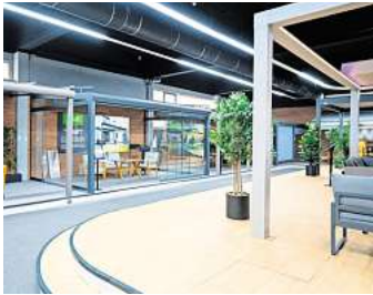
Der Ausstellungsraum bietet auf 750 Quadratmeter eine große Produktvielfalt.