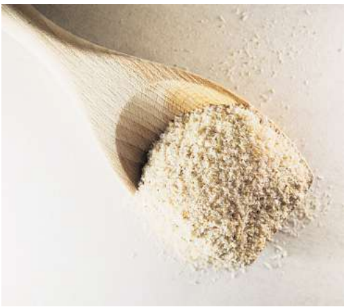
Flohsamenschalen können bei Verstopfung helfen, besonders bei älteren Menschen mit schwächerer Darmmuskulatur.