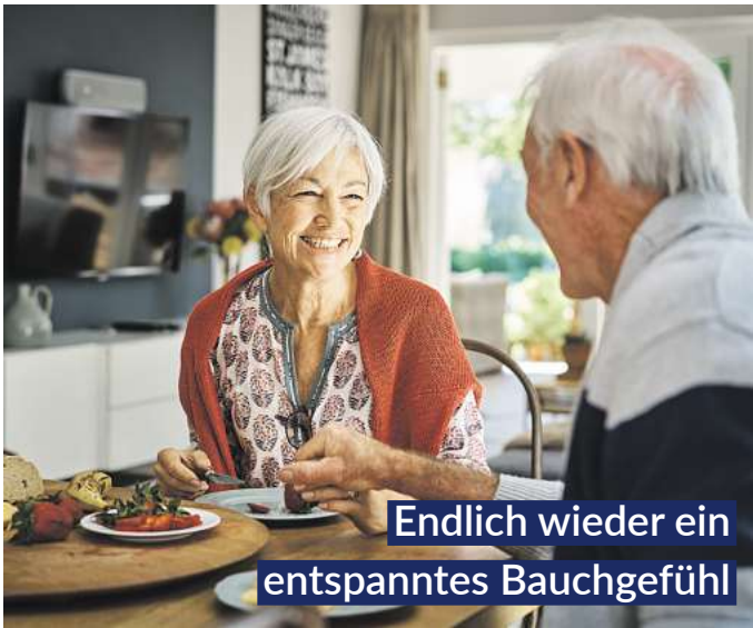
Endlich wieder ein entspanntes Bauchgefühl

Magen-Tropfen, sorgen sechs clever kombinierte natürliche Wirkstoffe für eine deutlich spürbare, schnelle „Erste Magen- und Verdauungshilfe“. Bitterstoffe aus Wermut-, Benediktenkraut und Angelikawurzel steigern rasch die Speichelproduktion und stoßen im Magen-Darm-Trakt die Produktion von Gallensaft und Magensäure an. 1,2 Dank Gänsefingerkraut, Süßholzwurzel sowie Kamillenblüten entspannen Magen und Darm.