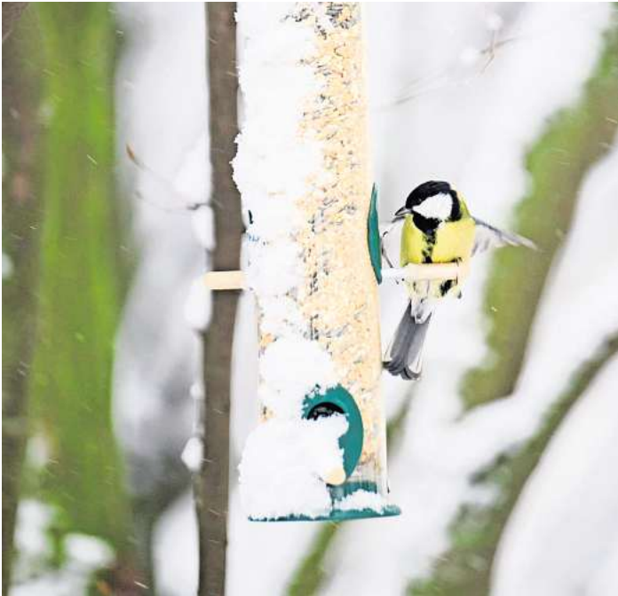
Wer die Futterstelle an einem Ast aufhängt, sollte darauf achten, dass Nager sie nicht von einem Baumstamm aus erreichen können.

1. Tipp: Futter und Füttern Am besten verwendet man nur eine Sorte Vogelfutter. So können die Tiere nichts aussortieren. Es ist wichtig, dass man immer nur so viel Futter bereitstellt, wie die Vögel in kurzer Zeit wegpicken können.