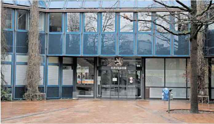
Geduld gefragt: Im Rathaus gibt es derzeit eine fünfwöchige Wartezeit für einen Termin im Bürgerbüro.

„Leider hat sich die Wartezeit nicht wesentlich verändert“, sagt Ralph Gureck, Sprecher der Stadt Langenhagen, und verweist darauf, dass man zur Vermeidung von Missverständnissen die Formulierung auf der Webseite angepasst habe, wonach Personalengpässe zu Wartezeiten von drei bis fünf Wochen führen könnten. „Anders formuliert: Es gibt auch kürzere oder gar keine Wartezeiten.“ Es könne sich lohnen, mehrmals am Tag auch außerhalb der Dienst- und Öffnungszeiten nach freien Terminen zu schauen, ob spontan abgesagte Termine wieder im System auftauchten und so kurzfristig gebucht werden können. Termine lassen sich auf www.langenhagen.de reservieren. In ganz dringenden Fällen würden auch Notfalltermine vergeben. In diesen Fällen bittet die Stadt darum, eine E-Mail an notfalltermin@langenhagen.de zu schreiben, eine Telefonnummer anzugeben und die Dringlichkeit zu begründen sowie zu belegen. Die Stadt rät jedoch davon ab, spontan im Rathaus zu erscheinen, weil an der dortigen Information keine Termine vergeben