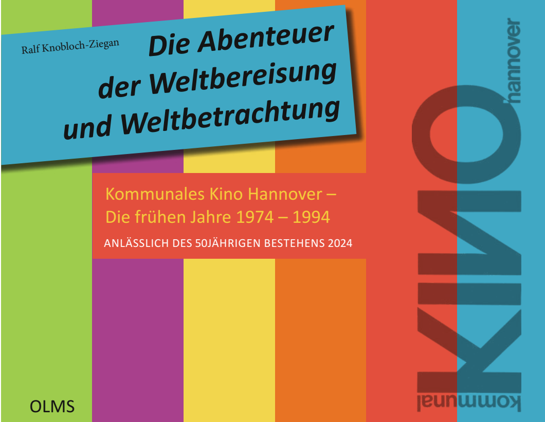
Das Buch ist im Kino im Künstlerhaus und im Buchhandel erhältlich.