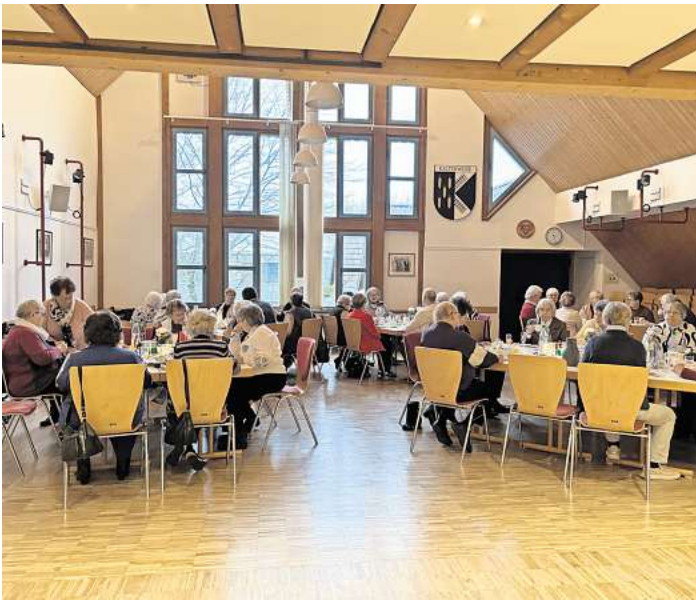
Der Neujahrsempfang der Kaltenweider Arbeiterwohlfahrt war gut besucht.

KALTENWEIDE. Jetzt fand im Zelleriehaus der jährliche Neujahrsempfang der AWO Kaltenweide statt. Die Veranstaltung war gut besucht, und die Gäste genossen leckeren Kuchen und Schnittchen. Gemeinsam genossen die Anwesenden den Nachmittag und freuen sich auf weitere Veranstaltungen der AWO in 2025.