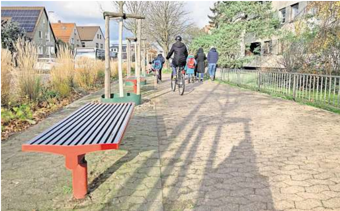
Hat weiterhin Bestand: Auf dem Radweg an der Hackethalstraße befinden sich weiterhin drei Bänke und fünf Bäume. Die Radfahrer auf dem Foto verhalten sich aber prinzipiell falsch.

Anwohnerinnen und Anwohner kamen zusammen, ebenso Vertreter der Kommunalpolitik sowie Mitglieder der ADFC-Ortsgruppe. Sie alle konnten nicht fassen, was sie da sahen: An der Hackethalstraße in Langenhagen-Wiesenau hatte die Stadtverwaltung gegenüber der Adolf-Reichwein-Schule drei Bänke aufgestellt und fünf Bäume gepflanzt – mitten auf einem als Radweg genutzten Teil des Bürgersteigs. Wer von Norden kommend mit dem Fahrrad unterwegs war, fuhr direkt auf eine der Bänke zu und musste auf den Fußweg ausweichen, der vor allem zu Zeiten des An- und Abreiseverkehrs vom Schulbetrieb stark frequentiert ist. Von einem Schildbürgerstreich war die Rede, sogar ein Satire-Fernsehkanal berichtete. Und es folgte die Forderung, dass die Stadt nachbessern solle. Das war im März 2022, also vor inzwischen fast drei Jahren. Was ist seitdem passiert?