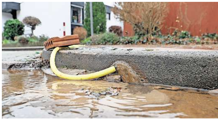
Einsatz einer Pumpe im Hoppegarten.

Aufschluss darüber gibt die Starkregenkarte, die jetzt ins Regionsportal integriert ist