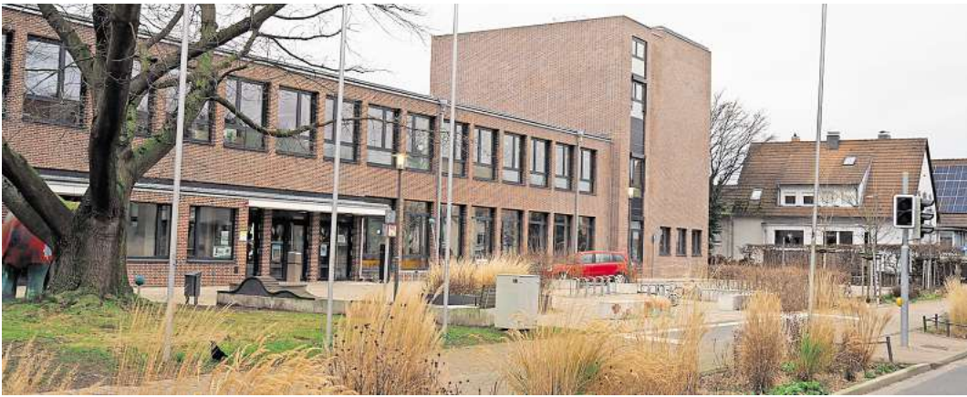
Fast fertig: An der Adolf-Reichwein-Schule in Wiesenau stehen nur noch wenige Restarbeiten an.

aufzunehmen. Die Schule kam aber zu einem anderen Ergebnis. Ein Sicherheitsbeauftragter des Regionalen Landesamtes für Schule und Bildung (RLSB) begutachtete das Gebäude und stellte eine lange Mängelliste auf. Daraufhin entschied die Schulleitung kurzfristig, den Unterricht ausfallen zu lassen. Nach einer Woche Notbetreuung startete die Schule schließlich verspätet ins Schuljahr. Die Bauarbeiten laufen seither weiter. Nach Angaben der Stadt wurde inzwischen die Ausgabeküche fertiggestellt und in Betrieb genommen. Der Turm, der im Sommer noch eingerüstet war, wurde inzwischen ausgebaut. Das Gerüst ist verschwunden, laut Stadt stehen lediglich noch abschließende Prüfungen aus. Auch der Schulhof ist fertiggestellt, zeitnah soll der Ballgazaun für den Fußballplatz geliefert werden. Im PC-Raum waren die Arbeiten bis zu den Weihnachtsferien noch nicht abgeschlossen. Auch die Brandmeldeanlage ist noch nicht in Betrieb. Das ist einer der Mängel, die das RLSB bereits im Sommer feststellte. Die automatische Aufschaltung zur Feuerwehr erfolge gemeinsam mit den letzten Überprüfungen des inzwischen fertiggestellten