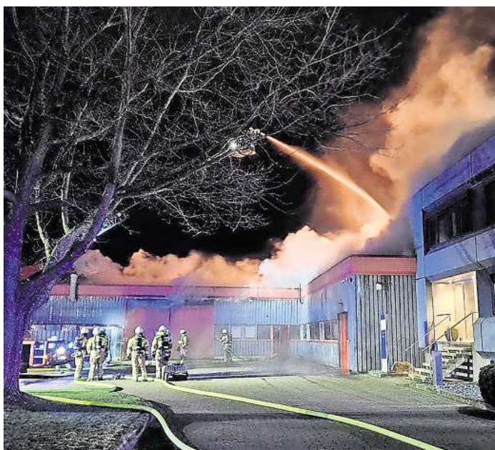
Löschangriff über die Drehleiter: Die Feuerwehr im Einsatz bei der Firma VTT in Langenhagen.

Etwa fünfeneinhalb Stunden waren Langenhagener Feuerwehrleute am Neujahrstag im Einsatz gewesen, um den Brand zu löschen. Die Alarmierung erfolgte gegen 5 Uhr morgens. Laut dem