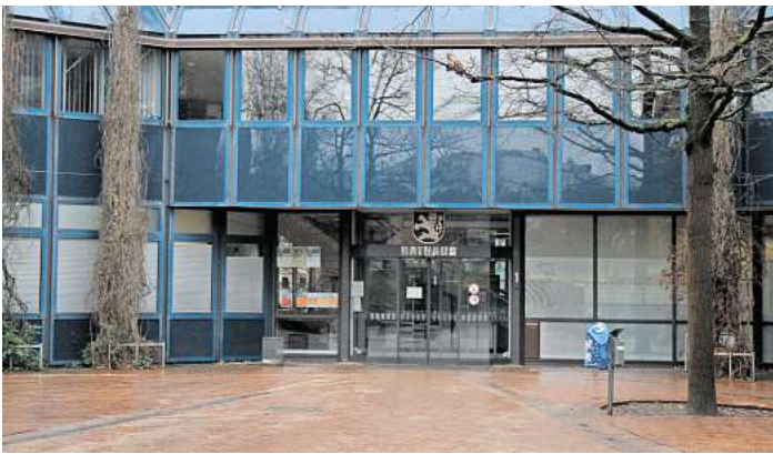
Geduld gefragt: Im Rathaus gibt es derzeit eine fünfwöchige Wartezeit für einen Termin im Bürgerbüro.