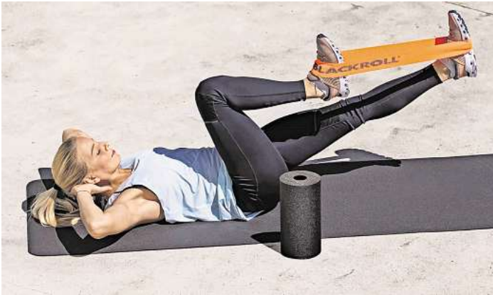
Aktiv sein: Blackroll gibt Unterstützung.

Die familia- und Markant-Treueaktion läuft bis zum 12. April 2025. Volle Treuehefte können bis zum 26. April 2025 eingelöst werden. Weitere Informationen gibt es in den familia-Warenhäusern und Markant-Märkten.