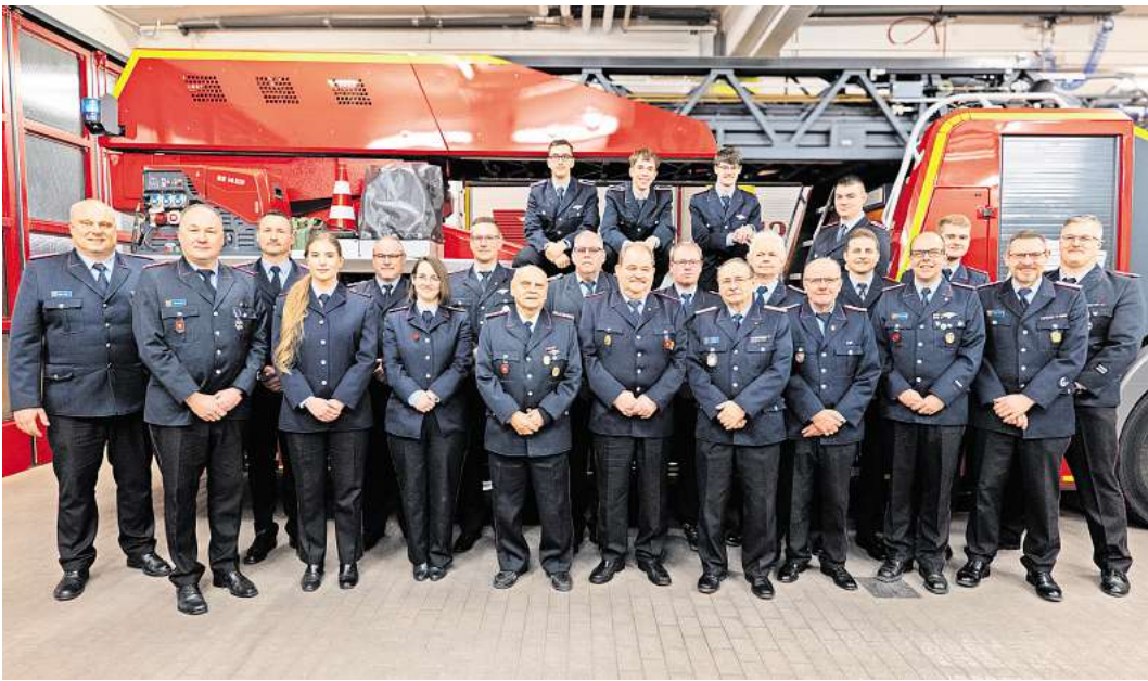
Ehrungen und Beförderungen: Ortsfeuerwehr Langenhagen.

Die Jugendfeuerwehr feierte mit ihren 24 Mitgliedern ihr 65-jähriges Jubiläum und gewann mit ihren 26 Mitgliedern zum dritten Mal in Folge den Wan-