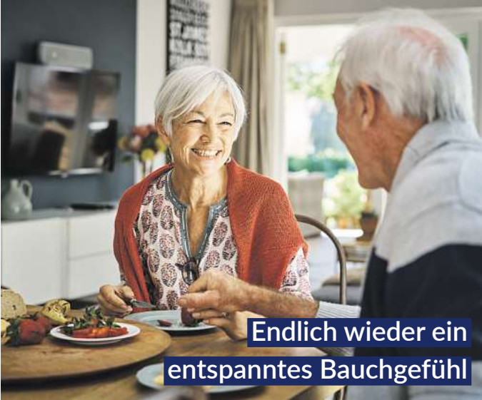
Endlich wieder ein entspanntes Bauchgefühl

Magen-Tropfen, sorgen sechs clever kombinierte natürliche Wirkstoffe für eine deutlich spürbare, schnelle „Erste Magen- und Verdauungshilfe“. Bitterstoffe aus Wermut-, Benediktenkraut und Angelikawurzel steigern rasch die Speichelproduktion und stoßen im Magen-Darm-Trakt die Produktion von Gallensaft und Magensäure an. 1,2 Dank Gänsefingerkraut, Süßholzwurzel sowie Kamillenblüten entspannen Magen und Darm.