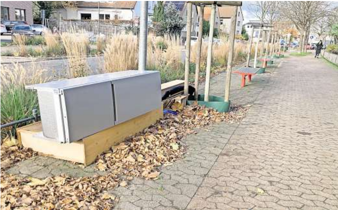
Anderes Hindernis: Nun bewegt man sich als Radfahrer nicht mehr zuerst auf eine Bank, sondern auf einen Baum zu - der Sperrmüll befindet sich an dieser Stelle natürlich nur temporär.

In der Praxis, so die Beobachtung der Redaktion, nutzen die Radfahrerinnen und Radfahrer aber weiterhin den Streifen auf dem Bürgersteig. Auf Höhe der Bänke und Bäume weichen sie auf den Fußweg aus. Gureck erwidert, dass der Bürgersteig an der Hackethalstraße entsprechend den Regeln der Straßenver-