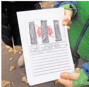
Strafzettel: Eltern, die sich nicht an die Regeln halten, bekommen von den Grundschulern den Hinweis „An der Bringzone haltet ihr, den Rest schaffen wir“, überreicht.

Dass Kinder direkt bis vor das Schulgebäude gebracht werden, ist nicht nur in Engelbostel ein Problem. Eine Umfrage der ADAC-Stiftung hat ergeben, dass bundesweit jedes vierte Grundschulkind den Schulweg an den meisten Tagen im Elterntaxi zurücklegt. Gleichzeitig sehen 62 Prozent der Befragten das damit verbundene Verkehrsaufkommen vor der Schule kritisch. Wenn dann noch Kinder auf der Fahrerseite aussteigen oder die Straße überqueren, kann das schnell gefährlich werden – da sind sich auch die Verantwortlichen in Engelbostel einig. Vor der Grundschule geht es an diesem Oktobernachmittag vergleichsweise ruhig zu. „Sobald ich mich hier hinstelle, halten sich alle dran. Die wissen eigentlich alle,