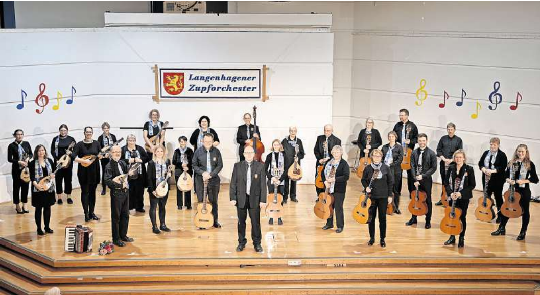
Das Langenhagener Zupforchester lädt für Sonntag, 10. November, in die Aula der IGS Langenhagen ein.