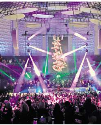
Ausgelassene Stimmung bei der Glitterbox.

Neben Mousse T. legt am 16. November auch erstmals Produzentlegenden Dimitri from Paris in Hannover auf. Aline Rocha, Julie McKnight und Young Pulse sind ebenso Teil des Line-ups. Sie spielen einen Mix aus klassischem House, Nu-Disco und fri-