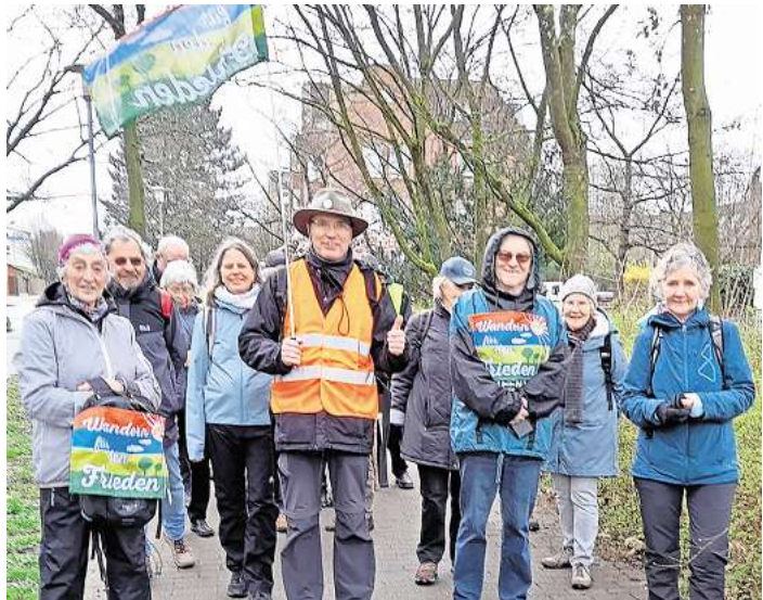
Wandern für den Frieden in Langenhagen.

Um ein kleines Zeichen für Frieden und Gerechtigkeit zu setzen, werden wir für ein Projekt in Brasilien sammeln: „Hilferuf der indigenen Völker“.