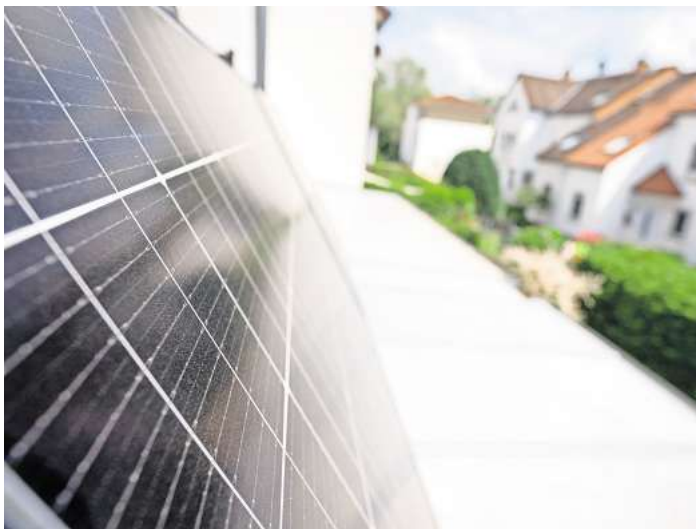
Ob sich ein Batteriespeicher für das Balkonkraftwerk lohnt, hängt auch von der Größe der Anlage ab.

Praktisch erscheint da, dass inzwischen auch einige Batteriespeicher als Ergänzung zu Steckersolar-Geräten zu haben sind. Diese Batterien speichern dann den überschüssigen Solarstrom. Der kann wiederum zu einem späteren Zeitpunkt für den Eigenbedarf ge-