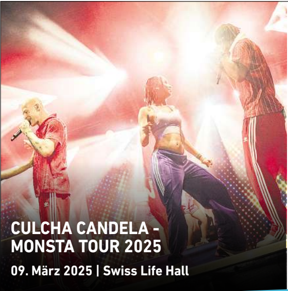
CULCHA CANDELA - MONSTA TOUR 2025 09. März 2025 | Swiss Life Hall

In der D-Jugend kann Sieben-gegen-sieben auf zwei Feldern gespielt werden, dann würden 14 Kinder pro Team immer eingesetzt. Das ist dann in etwa der spätere C-Jugend-Kader für Elf-gegen-elf. So bilden wir mehr Kinder im besseren Format aus – beide Torhüter spielen, beide Stürmer haben mehr Aktionen. Das bekommen wir allein mit Trainingsphilosophie nicht hin. Das ist übrigens sehr leistungsorientiert, um den Kritikern da wieder vorzugreifen.