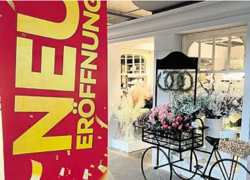
Die neue Boutique-Abteilung im Erdgeschoss glänzt mit viel Detailliebe.

Sonntag, 6. Oktober 2024, 13-18 Uhr. Das Möbelhaus und das XXXL-Restaurant haben bereits ab 12 Uhr geöffnet (Möbelverkauf ab 13 Uhr).