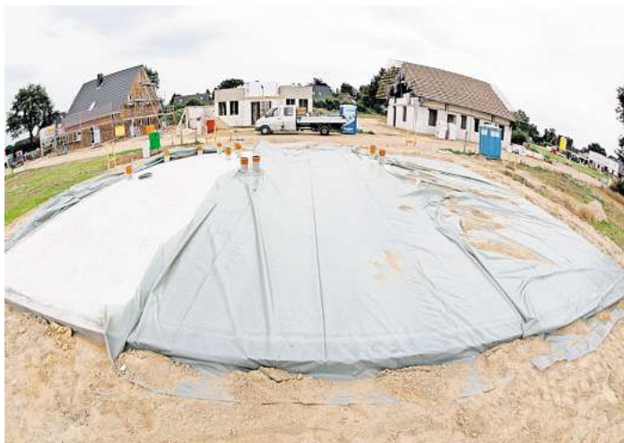
Bauherren sollten bei Vertragsregelungen zu Baustrom und -wasser sowie bei der Organisation und Kostenübernahme von Bautoilette, Bauwagen oder der Entsorgung von Bauabfällen genau hinschauen.

Denn bevor die Bauarbeiten beginnen können, müssten dann zunächst provisorische Verbindungen zu nahe gelegenen Hydranten oder Stromkästen hergestellt wer-