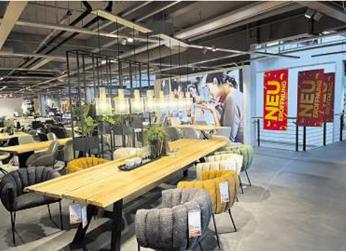
Es ist angerichtet: Nur noch ein paar Tage bis zur großen Neueröffnung - und auch danach warten Highlights.