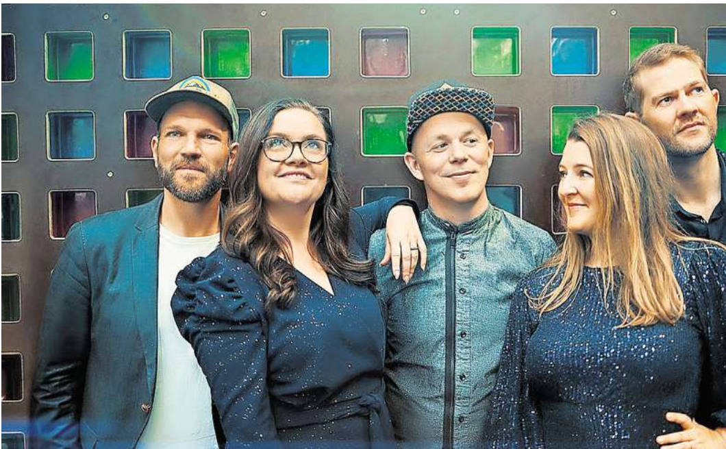
Postyr aus Dänemark – am 26. September im Pavillon

neuer Trends. Das Herzstück der chor.com und für die meisten von Euch sicherlich am interessantesten, sind die 22 Konzerte. Hier zeigen nationale und internationale Ensembles die Vielseitigkeit und neue Trends der Vokalmusikszene. Da lohnt sich auf jeden Fall ein Blick auf das komplette Programm auf der untenstehenden Webseite der Veranstaltung, denn Vokalmusik 2024 ist viel mehr, als man vielleicht erwarten würde. Die Konzerte finden an verschiedenen Orten statt. Mit dabei sind die Christuskirche, das Kulturzentrum Pavillon, die Neustädter Hof- und Stadtkirche und die Galerie Herrenhausen. Hier nur einige Highlights aus dem Programm: Die preisgekrönte