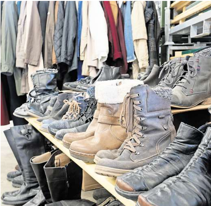
Gut erhaltene Schuhe sind auch im Angebot.

Für die Kleidung gibt es keine festen Spendenbeträge. Das Team der Kleiderkammer empfiehlt jedoch einen Obolus von einem Euro pro Kleidungsstück für Erwachsene, fünf Euro für Jacken und zwischen fünfzig Cent und zwei Euro für Kinderkleidung. Der Flohmarkt trägt zur Entlastung des Lagers für den Saisonwechsel bei und unterstützt einen weiteren guten Zweck. Sämtliche Einnahmen des Einkaufsnachmittags kommen der Arbeit der ehrenamtlichen Helferinnen und Helfer zugute, die auf finanzielle Spenden