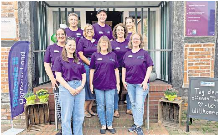
Ein engagiertes Team hält am Diakonie-Standort Burgwedel viele Angebote bereit.