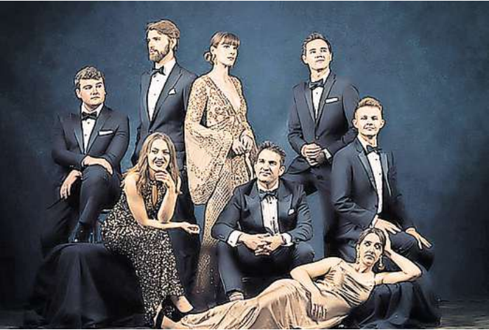
Das für den Grammy nominierte Ensemble Voces8 aus Großbritannien – am 27. September, Christuskirche

Außergewöhnlich wird es am 28. September in der Galerie Herrenhausen. Der Bundesjugendchor präsentiert dort „PAX – Chor in Bewegung“. Pax – Frieden ... Unsere Verantwortung für eine friedliche Welt und die Gefährdung derselben bilden die thematische Klammer im Programm des Bundesjugendchores. Während des Konzertes trifft hier Chorgesang auf Choreografie. Der Begriff „Chorós“ bezeichnete in der Antike eine Gruppe von Spielenden, die zugleich singen und sich