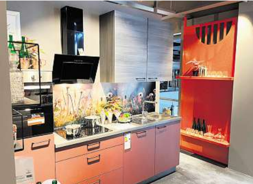
XXXL-Auswahl mit Riesenqualität: Eine von 130 Ausstellungsküchen in der frisch renovierten Küchenabteilung.