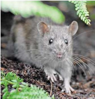
Im Berggarten Hannover traute sich die kleine junge Ratte vor die Kamera.

Eine nachhaltige Bekämpfung der Ratten gelinge allerdings nur, wenn Bürger und Stadt gemeinsam und vor allem zeitgleich