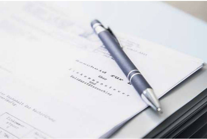
Verlustverrechnung nicht anerkannt? Der Bund der Steuerzahler rät Betroffenen, grundsätzlich Einspruch gegen solche Steuerbescheide einzulegen.

Ein wenig spezieller – und darum wohl nur für wenige Anlegerinnen und Anleger relevant: Auch Verluste aus sogenannten Terminge-