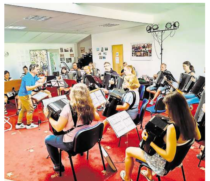
Spieler des ersten Orchesters und des Orchesters LaFunTastika trafen sich mit ehemaligen Musikerinnen und Musikern beim Ehemaligentreffen.

Nach dem musikalischen Teil wurde bei Kaffee, Kuchen und herzhaften Snacks weitergefeiert. Erinnerungen wurden ausgetauscht, interessante Gespräche geführt und viel gelacht. Die Freude über das Wiedersehen und das gemeinsame Musizieren war groß, und bei einigen der Ehemaligen kribbelte es so sehr in den Fingern, dass sie ernsthaft