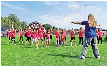
Beim Sommerfest waren verschiedene Spiel- und Sportstationen aufgebaut.