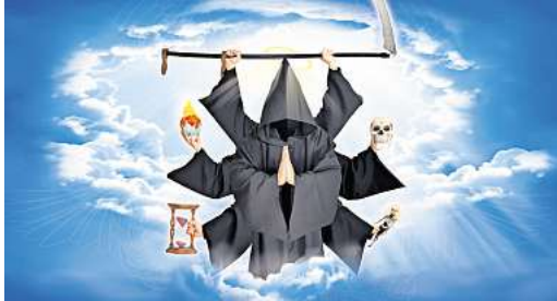
Widmet sich den aktuellen Problemen des Dies- und Jen-seits: Mister Death Comedy.

Aus diesen Zutaten schafft die Mimuse wieder besondere Abende im Langenhagener Kulturkalender. Karten gibt es an allen bekannten Vorverkaufsstellen und unter www.eventim.de