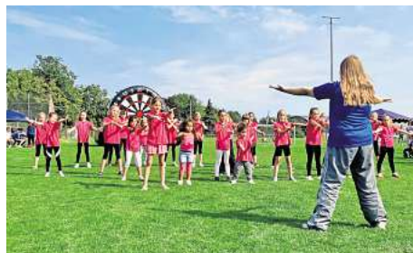
Beim Sommerfest waren verschiedene Spiel- und Sportstationen aufgebaut.