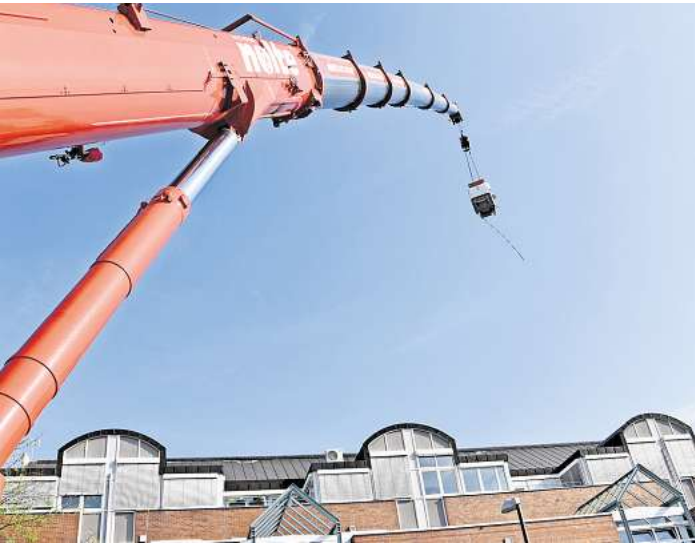
Teure Last: Das MRT schwebt über der Häuserzeile an der Ostpassage.