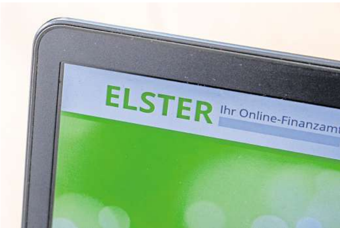
Ab sofort ist es Eltern wieder möglich, die Steuererklärung elektronisch zu versenden, ohne dass dafür die Steuer-ID des Kindes nötig ist.

Für viele Eltern ein Problem, wenn die Steuer-ID nicht zur Hand war. Einige sind daher auf die Steuererklärung aus Papier ausgewichen. Die Finanzverwaltung hat sich daher dazu entschlossen, die fehlende Steuer-ID des Kindes vorerst nicht zu beanstanden und auch die elektronische Übermittlung wieder zu ermöglichen. Das gilt ab sofort. Einem Sprecher des Bundesfinanzministeriums zufolge werden Steuerpflichtige zwar weiterhin auf die Angabe der an das Kind vergebenen Steuer-ID hingewiesen. Der Absendung der Erklärung stünden Hinweis und fehlende Identifikationsnummer aber nicht mehr entgegen. (DPA)