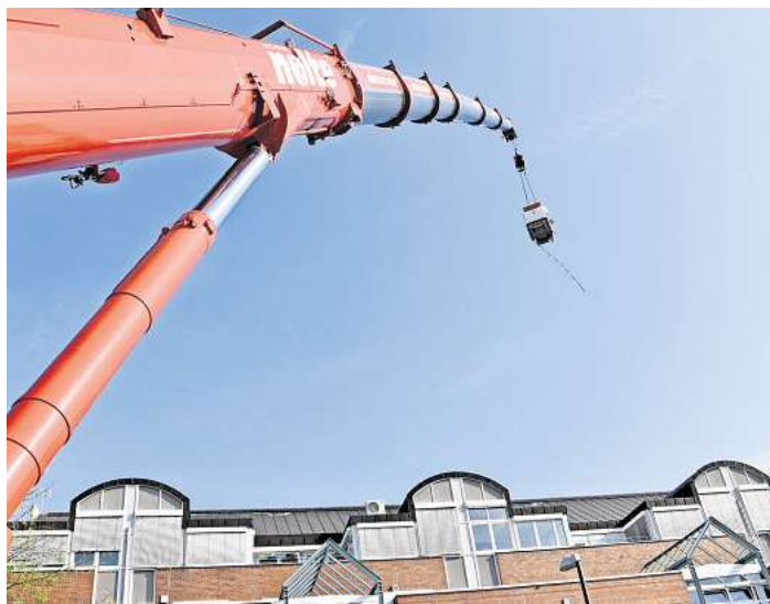
Teure Last: Das MRT schwebt über der Häuserzeile an der Ostpassage.

Mehr als 50 Meter Luftlinie vom Kranführer entfernt stehen Helfer mitten in der Radiologiepraxis an der Ostpassage und stellen sicher, dass der Kernspintomograf genau dort landet, wo er es soll: in einer Öffnung, die