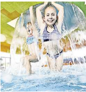
In die Wasserwelt kommen die Kinder und Jugendlichen zum vergünstigten Eintritt.

eines gültigen Schülerausweises. Kinder unter zehn Jahren müssen in Begleitung eines erziehungsberechtigten Erwachsenen kommen, der den regulären Eintritt zahlt. Kinder ab zehn Jahren können bei Vorlage des Bronze-Schwimmausweises das Schwimmbad alleine besuchen. Das Figurentheater „Die roten Finger“ präsentiert am Donnerstag, 19. September, um 15.30 Uhr im Haus der Jugend das Stück „Super-Willi setzt sich ein“. Die Vorstellung richtet sich an Kinder ab vier Jahren und ist an diesem Tag kostenlos. Auf die jungen Besucherinnen und Besucher wartet eine spannende und zugleich lehrreiche Geschichte über den mutigen Umgang mit Mobbing. Denn die Hauptfigur Willi wird wegen seiner Andersartigkeit von der Monsterbande