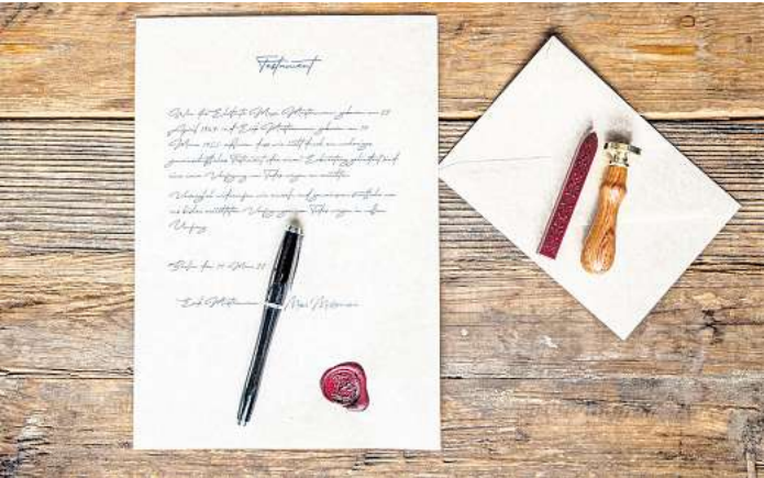
Wenn ein Depot vererbt werden soll, stellt sich aus steuerlicher Sicht die Frage: verkaufen oder übertragen?

Vorteile für Erben mit geringen Einkünften