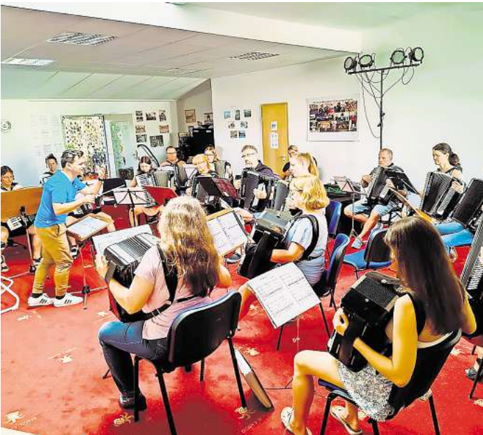
Spieler des ersten Orchesters und des Orchesters LaFunTastika trafen sich mit ehemaligen Musikerinnen und Musikern beim Ehemaligentreffen.

Nach dem musikalischen Teil wurde bei Kaffee, Kuchen und herzhaften Snacks weitergefeiert. Erinnerungen wurden ausgetauscht, interessante Gespräche geführt und viel gelacht. Die Freude über das Wiedersehen und das gemeinsame Musizieren war groß, und bei einigen der Ehemaligen kribbelte es so sehr in den Fingern, dass sie ernsthaft