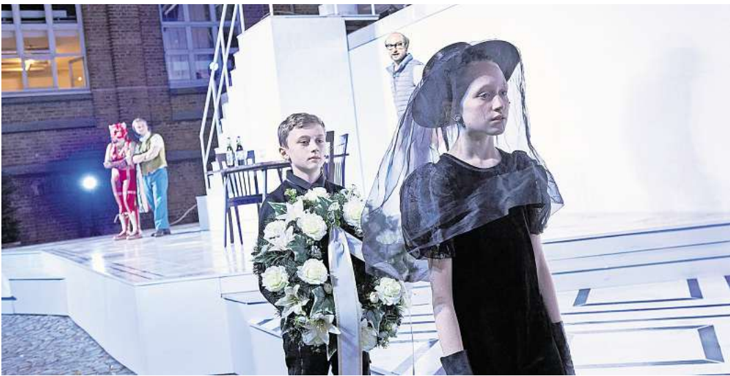
Biedermann und die Brandstifter im August im Freien erleben.