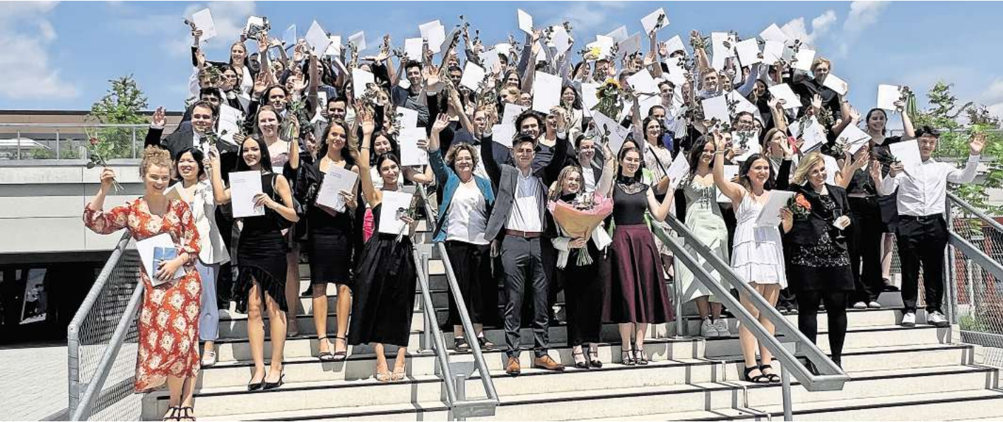
Bestanden: Gruppenfoto auf der „Spanischen Treppe“.

Gymnasium Langenhagen: Viermal gab es die Traumnote 1,0