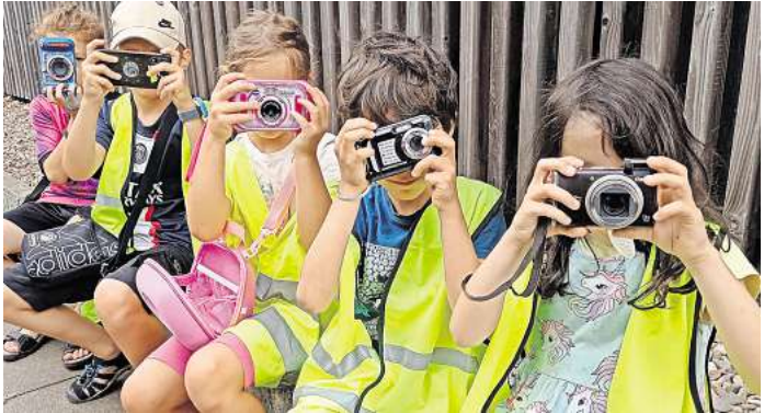
Die Jugendlichen sollen die Welt mit ihren eigenen Augen entdecken.