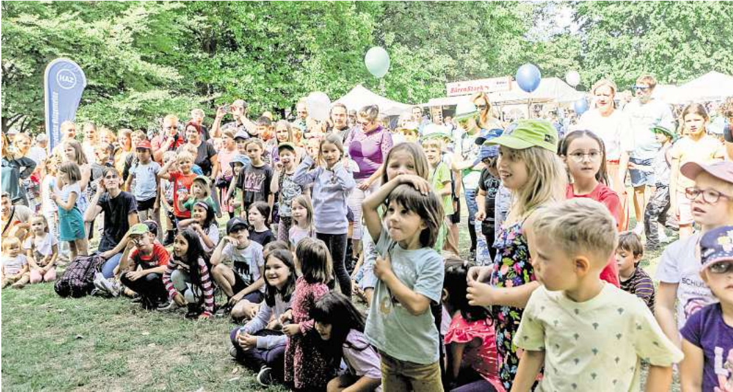
Das Einschulungsfest mit einem Programm rund um Verkehrssicherheit hat Tradition.

Bei der diesjährigen Auftaktaktion erklärt das ADAC-Team mit dem Adacus-Programm Ampeln und Zebrastreifen, die Üstra baut einen Rutschautoparcours auf, die Dekra kommt mit Fahrsimulatoren, die Verkehrswacht testet Rückhaltesysteme und sorgt für einen Fahrradparcours. Außer-