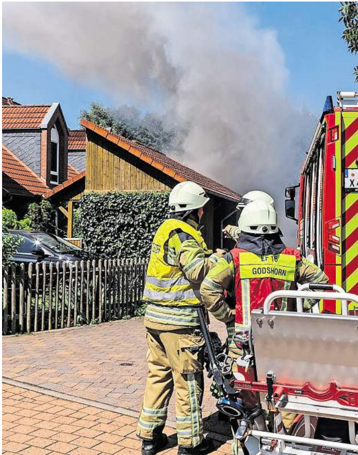
Das Feuer griff auf das Dach eines benachbarten Carports über.

Godshorn: 70 Feuerwehrleute waren im Einsatz