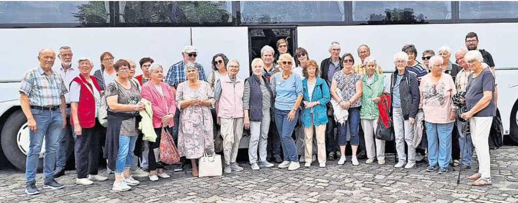
Der Ausflug führte die Reisenden Richtung Celle.

Ein Spaziergang in der schönen Natur rundete den Nachmittag ab. Gestärkt und mit vielen neuen Eindrücken ging es dann auf anderen Landstraßen wieder nach Godshorn zurück. Die gute Laune aller Mitreisenden, das schöne Wetter und die gelungene Durchführung machten diesen Ausflug zu einem vollem Erfolg. Eine Wiederholung mit anderem Ziel wird nicht ausgeschlossen.