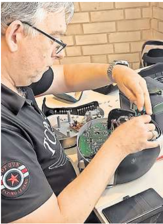
Praktische Hilfe: der Repairtreff an der Zwölf-Apostel-Kirche.