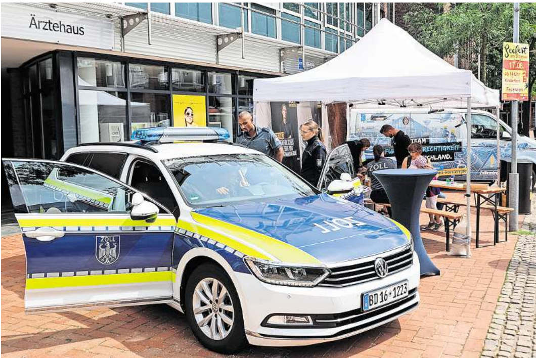
Und auch die Polizei war auf der Blaulichtmeile vertreten.

Den krönenden Abschluss bil- dete die Einsatzübung „Brand- bekämpfung“ auf der Aktions-