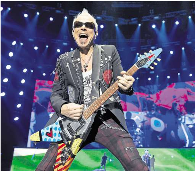
Scorpions-Gitarrist Rudolf Schenker ist mal nicht auf Welttournee, sondern besucht die NP am Maschsee.