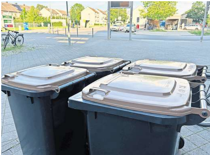
Standen manchmal noch rum: Die Biotonnen wurde in Langenhagen ausgeliefert.

So standen beispielsweise am Straßburger Platz gleich vier Tonnen herum, von denen niemand so recht wusste, wo diese eigentlich hingehörten. Doch wer ist zuständig, wenn Tonnen im Weg stehen? Müssen sich die Hauseigentümer ihre Tonnen selbst aufs Grundstück ziehen? „Die Biotonnen werden von einem Dienstleister verteilt, der auf diese Aufgabe spezialisiert ist und