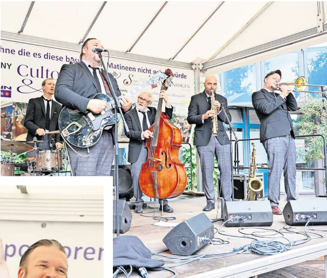
The Sazerac Swingers sind Stammgäste in Langenhagen.

Sie haben einen eigenen Sound, eine beeindruckende Energie und Präsenz, elektrisie- ren die Massen auf Festivals und Clubkonzerten, und liefern eine Show, die ihresgleichen sucht. The Sazerac Swingers, benannt nach dem offiziellen Getränk der Stadt New Orleans, dem seit 1804 bekannten „Sazerac Cock- tail“, machen jedes Konzert zur unvergesslichen Party auf musi- kalisch allerhöchstem Niveau.