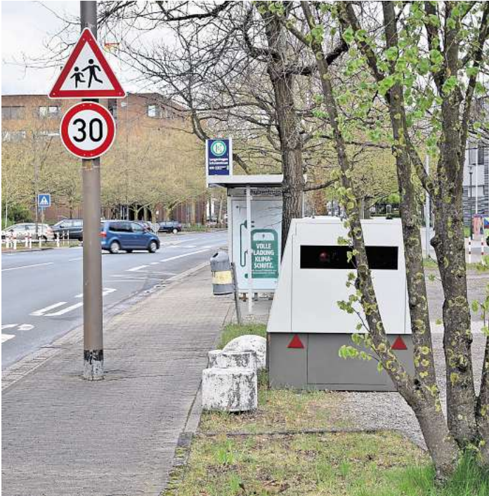
An der Konrad-Adenauer-Straße blitzte es 1622-mal. Im Einsatz: An der Konrad-Adenauer-Straße in Höhe Schulzentrum verrichtete der Blitzeranhänger oft seinen Dienst.

Die bisher höchsten Einnahmen erzielten die drei Langenhagener Blitzer im Jahr 2023. Die