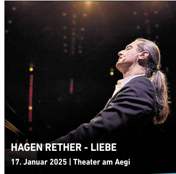
HAGEN RETHER - LIEBE 17. Januar 2025 | Theater am Aegi