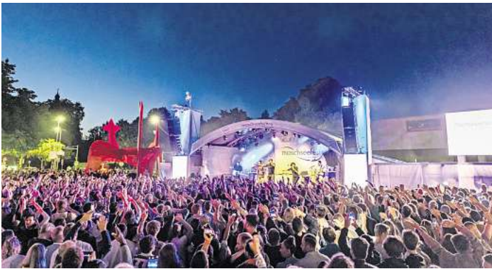
Volle Hütte: Die Veranstalter rechnen mit Hunderttausenden Besuchern zum Maschseefest.