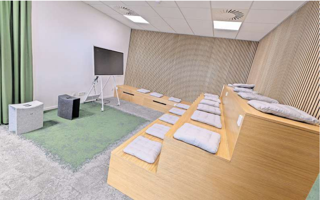
Für kreative Ideenfindung: Die „Arena“ im modernen Büroriegel der Expert-Zentrale.