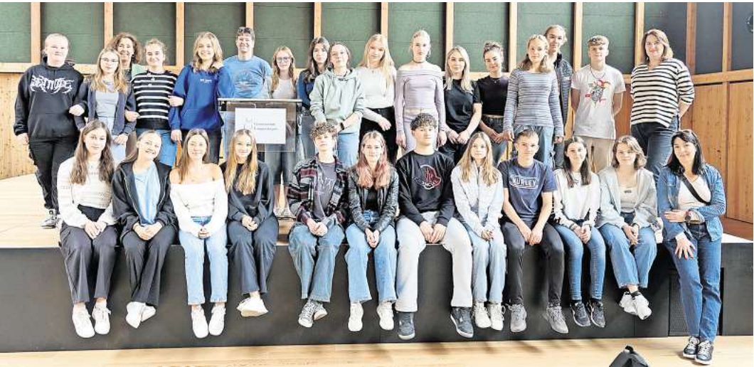
Die Schülergruppe hat eine erlebnisreiche Zeit hinter sich.

Zum 21. Mal besuchte die Partnerschule aus Glogau das Gymnasium