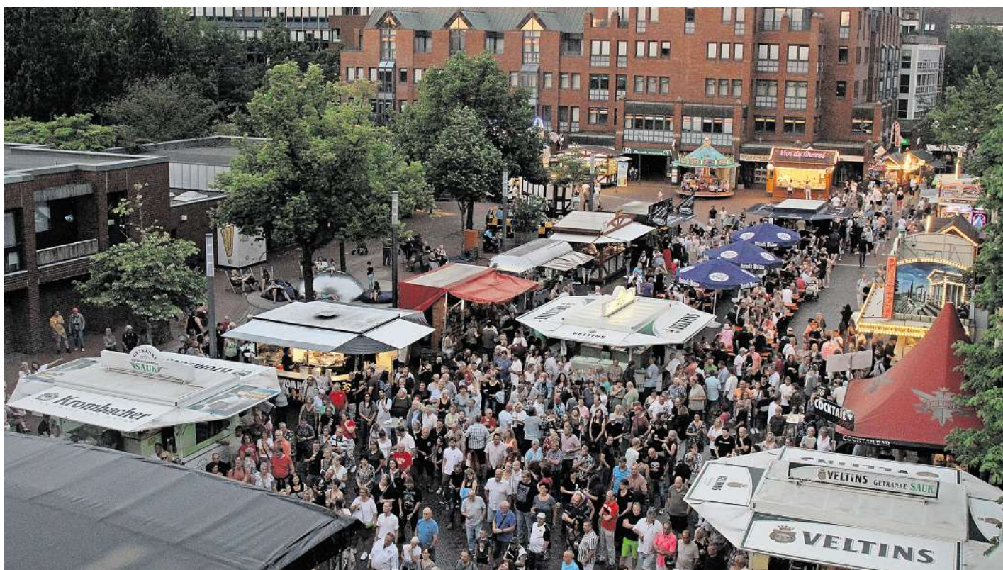
Es läuft: Am Freitagabend startete das Stadtfest Langenhagen mit gutem Besuch.

Tausende Menschen besuchen das dreitägige Fest