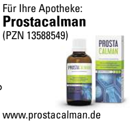
Abbildung Betroffenen nachempfunden PROSTACALMAN. Wirkstoffe: Serenoa repens, Pareira brava, Populus tremuloides. D3. Prostacalman wird angewendet entsprechend den homöopathischen Arzneimittelbildern. Dazu gehören: Blasenentzündungen und Beschwerden beim Wasserlassen, bei vergrößerter Prostata. www.prostacalman.de • Zu Risiken und Nebenwirkungen lesen Sie die Packungsbeilage und fragen Sie Ihre Ärztin, Ihren Arzt oder in Ihrer Apotheke. • PharmaSGP GmbH, 82166 Gräfelfing

Häufiger Harndrang, der Urin kommt nur noch tröpfchenweise oder die Blase fühlt sich nicht entleert an? Schuld daran ist oft die Prostata. Dieses sogenannte „Männerorgan“ kann mit zunehmendem Alter wachsen und dadurch die Harnröhre blockieren. Experten haben ein Arzneimittel namens Prostacalman entwickelt, das gleich drei Wirkstoffe in sich vereint: Serenoa repens, Pareira brava und Populus tremuloides. Diese Arzneistoffe sind dafür bekannt, u.a. den nächtlichen Harndrang zu reduzieren, den Urinfluss zu verstärken und den Restharn in der Blase zu verringern. Genial: Prostacalman beeinträchtigt nicht die Sexualfunktion. Das Arzneimittel ist rezeptfrei in jeder Apotheke erhältlich.