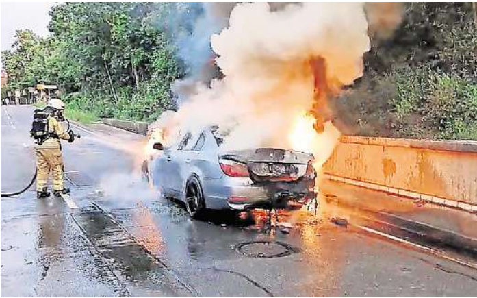
Mit Atemschutz: Die Feuerwehr Langenhagen hat einen Brand in einem Auto gelöscht.

Ein Trupp löschte das Auto durch einen sogenannten Schnellangriff. Insgesamt zwölf Einsatzkräfte der Freiwilligen Feuerwehr, ein Streifenwagen der Polizei, sowie Mitarbeitende der Firma Vieker und der Stadt-entwässerung waren vor Ort. Das Löschen des Brandes und die an-schließenden Aufräumarbeiten dauerten etwa drei Stunden lang, für diesen Zeitraum musste die Godshorner Straße gesperrt werden. Wie es zu dem Brand am Auto gekommen war, ist noch nicht klar.