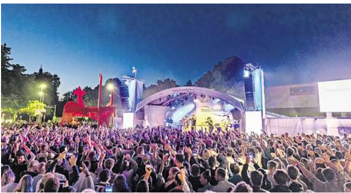
Volle Hütte: Die Veranstalter rechnen mit Hunderttausenden Besuchern zum Maschseefest.