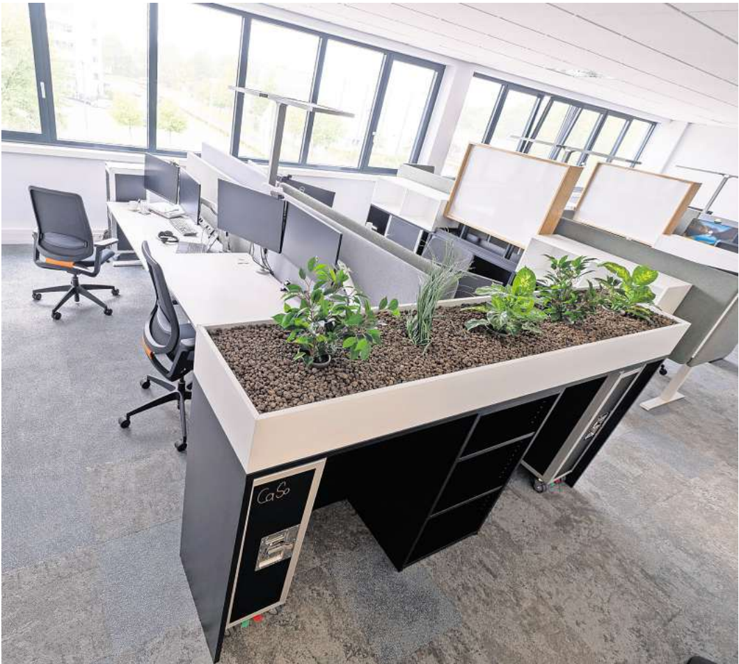
Neu gestaltet: Großraumbüro in der Expert-Zentrale.