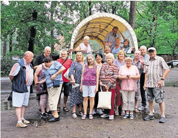
Mit einem vollbesetzten Trecker ging es auf Tour.

KRÄHENWINKEL . Jetzt fuhr der SoVD Krähenwinkel/Kalten-weide/Engelbostel/Schulenburg mit einem vollbesetzten Anhän-