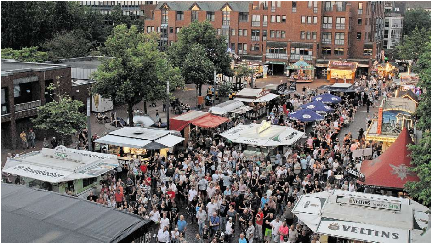
Es läuft: Am Freitagabend startete das Stadtfest Langenhagen mit gutem Besuch.

Tausende Menschen besuchen das dreitägige Fest