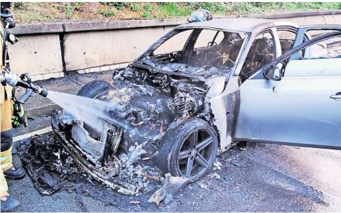
Ausgebrannt: Die Einsatzkräfte konnten die Flammen komplett lö-schen.