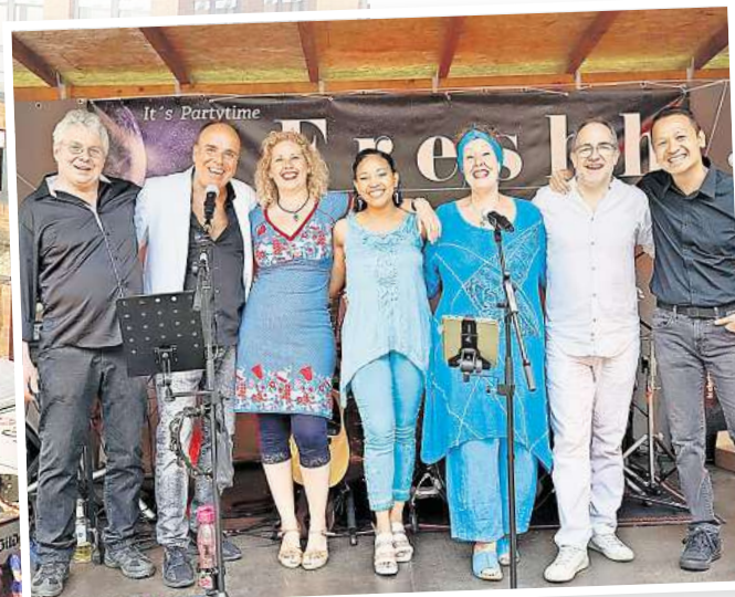
Partytime wird mit Freshh gemacht.

Antik Markt Sonntag, 21.07.2024 ab 11.00 Uhr im CCL Langenhagen Tel. 0176-23 12 28 55