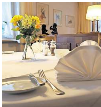
Fein eingedeckt: Der Jägerhof legt Wert auf Qualität.