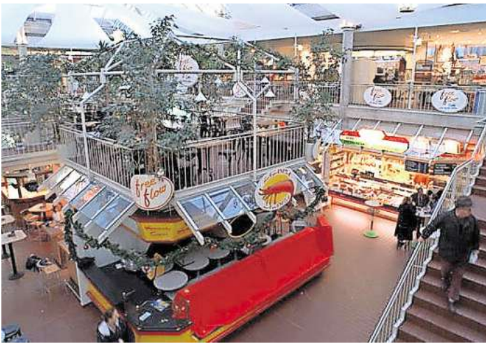
Vor dem Umbau: Die Langenhagener Markthalle dehnt sich 1995 über das Unter- und Obergeschoss aus.