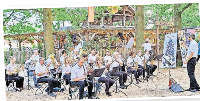
Immer gern unter freiem Himmel: Das Blasorchester spielt auf.

Doch das Hauptziel für dieses Jahr sei es, das Stadtfest Langenhagen zu seiner alten Größe zurückzubringen. Der Eintritt ist frei!