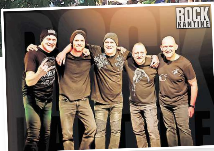
Live Musik auf der Stadtfest-Bühne liefert die Band Rockkantine.