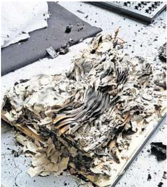
Das vom Brand zerstörte Sakristei-Buch.

„Sobald sich abzeichnet, wann die Restaurationsfirma nach En-