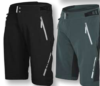
Bike-Shorts Zermatt Cordura