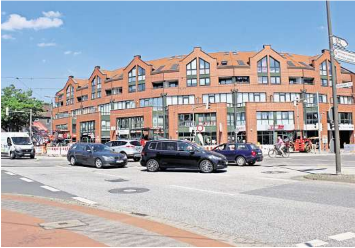
Die Godshorner Straße ist gesperrt und die Verkehrsführung geändert: Am Langenforther Platz gewöhnen sich die Verkehrsteilnehmer derzeit an die neue Situation.