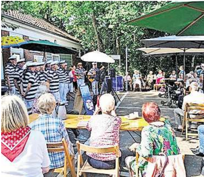
Der Kulturring Langenhagen feiert sein Sommerfest am 6. Juli gemeinsam mit dem Bürger- und Heimatverein.