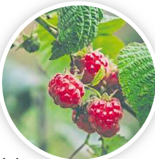
Nach der Himbeer-Ernte sollte man sich ans Zurückschneiden machen.

Die einzelnen Triebe, die auch Ruten genannt werden, brauchen nämlich genug Licht und Luft für eine gute Ernte.