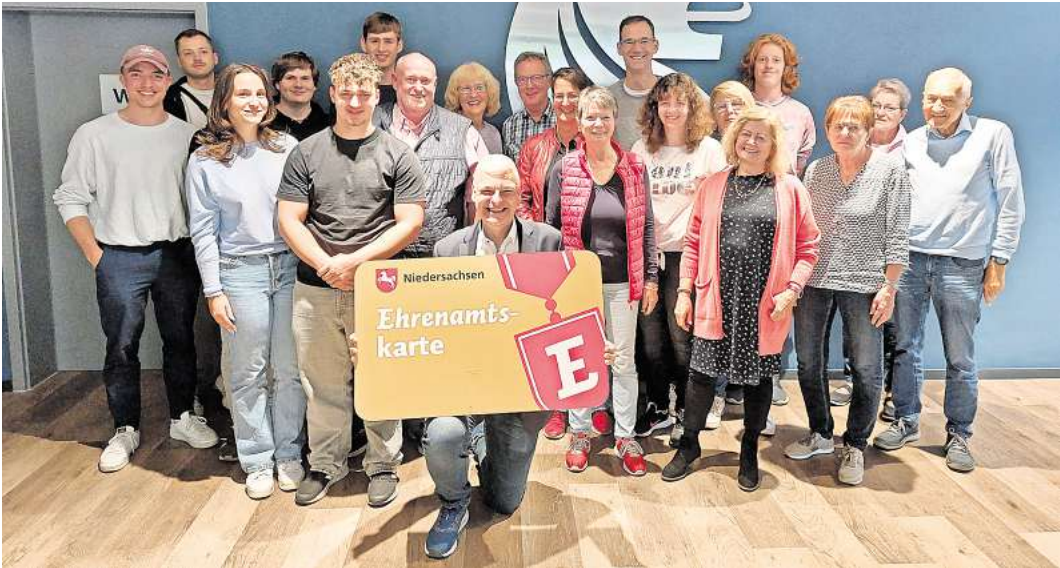
Die Stadt Langenhagen zeichnete die Ehrenamtlichen für ihr Engagement aus.

Neben der goldenen Ehrenamtskarte erhielten die Ehrenamtlichen auch wieder ein Glas des berühmten Rathausbiers, das nur vom Bürgermeister verschänkt wird und nicht zu kaufen ist. Die goldene Ehrenamtskarte (E-Karte) ist eine Auszeichnung, um dieses freiwillige und unentgeltliche Engagement zu würdigen. In ganz Niedersachsen und Bremen erhalten die InhaberInnen der E-Karte Vergünstigungen wie etwa Eintritt in viele öffentliche und private Einrichtungen und zu Veranstaltungen unterschiedlicher Art. Neu als Partner der E-Karte ist das Reformhaus Bacher im City Center