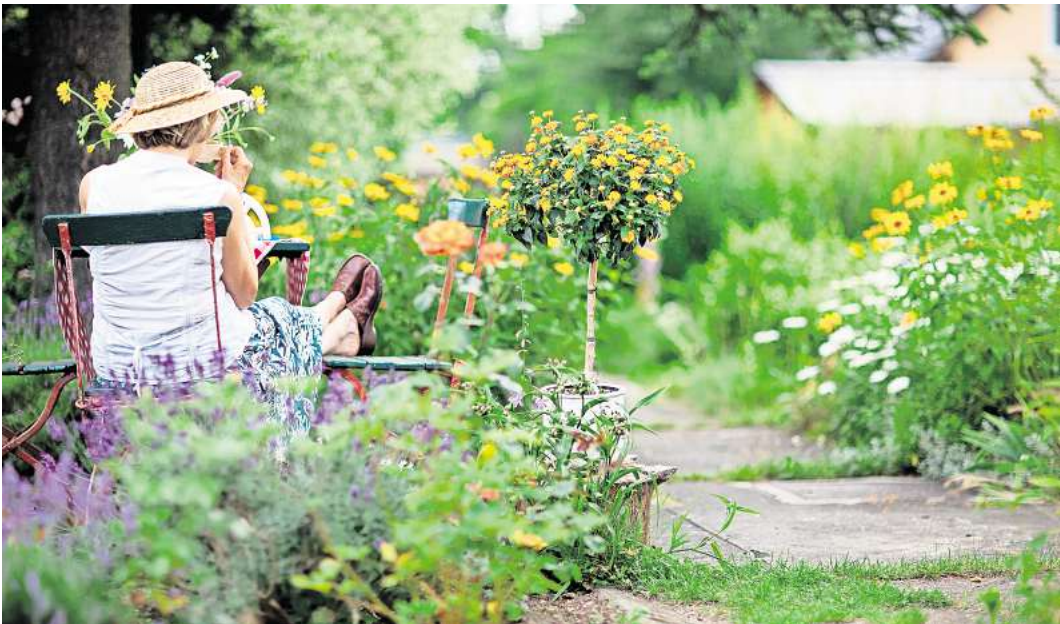
Schattenplätzchen gesucht: An warmen Juli-Tagen sollte man tagsüber lieber den Platz unter Bäumen genießen.

Falls Sie die Sommerfrische woanders suchen und verreisen, könnten Sie durstige Topfpflanzen an einen schattigeren Ort und etwas kühleren Platz im Garten stellen. Dann müssen die Nachbarn und Nachbarinnen nicht so oft gießen. Sie haben ein Bewässerungssystem? Umso besser. Benutzen Sie es schon in den Wochen vor dem Urlaub und testen Sie, ob alles funktioniert. Das beruhigt die Nerven und spart Ihnen auch im Alltag Arbeit.