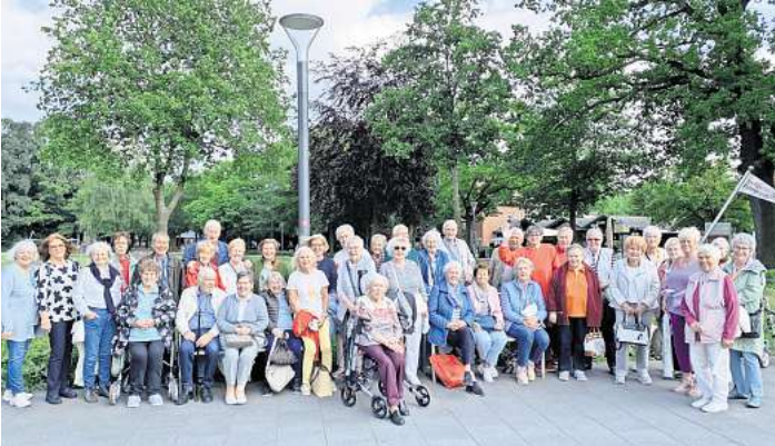
Die AWO Engelbostel-Schulenburg erlebte einen ereignisreichen Tag.

perfekt zum Spargelessen vorbereitet. Gestärkt ging es mit dem Bus weiter nach Steinhude. Bei strahlendem Sonnenschein konnten alle spazieren gehen, den Blick auf das Steinhuder Meer genießen oder bei Kaffee und Eis eine Pause einlegen. Satt und zufrieden ging es dann zurück nach Engelbostel und Schulenburg.