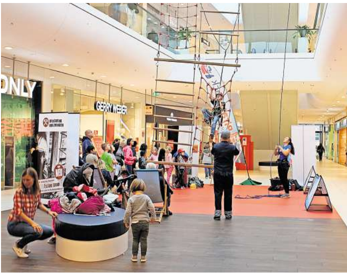
Im CCL wird für Schüler ein kleiner Parcours aufgebaut.

spannenden Erlebnissen im Kletterpark am Hufeisensee und geben Einblicke in unvergessliche Familienabenteuer und Kindergeburtstage. Kinder können in diesem Zeitraum ihre Kletterkünste sicher und mit viel Spaß sowie Freude ausprobieren. Diese Aktion ist für unsere Besucher kostenlos. Zum Pirate Rock, Hochseilgarten Hannover: In drei Parcours mit unterschiedlichen Schwierigkeitsgraden kann geklettert werden. Masten erklimmen, wilde Floßfahrten oder der Gang über die Planke gehören für ein Piratenfeeling dazu. Weitere Informationen und Reservierungsmöglichkeit: www.pirate-rock.de .