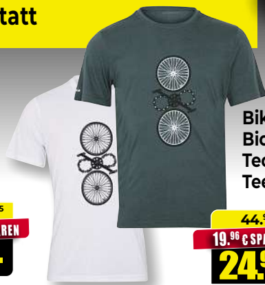
Bike-Shirt Bici Technical Tee