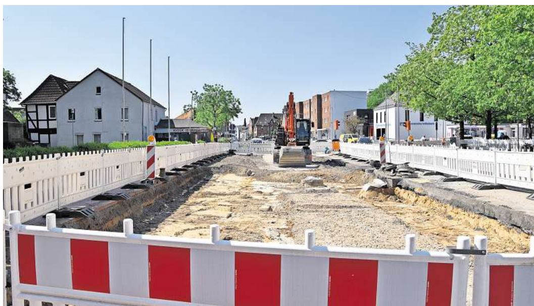
Deutliche Verzögerungen: Die Bauarbeiten auf der Walsroder Straße sind einige Monate im Verzug.

Die Baustelle mit den größten Auswirkungen liegt jedoch an der Walsroder Straße. Rechnet man die Vorarbeiten im Auftrag des hannoverschen Versorgers Energy hinzu, dann ist der einige Hundert Meter lange Abschnitt nahe der Elisabeth-Arkaden bereits seit Mitte Oktober 2022 Baustelle, also seit 19 Monaten. Nach kräftigen Verzögerungen bei den Energy-Leitungsarbeiten hatte die von der Stadt beauftragte Baufirma im August 2023 losgelegt. Der Verkehr rollt seitdem wieder nur in eine Richtung – nach Norden, die Einbahnstraßenregelung lässt Gegenverkehr nicht zu. Die Stadt hatte die Fertigstellung vorab nach rund 15 Monaten für Herbst/Winter 2024 erwartet. Es steht jedoch