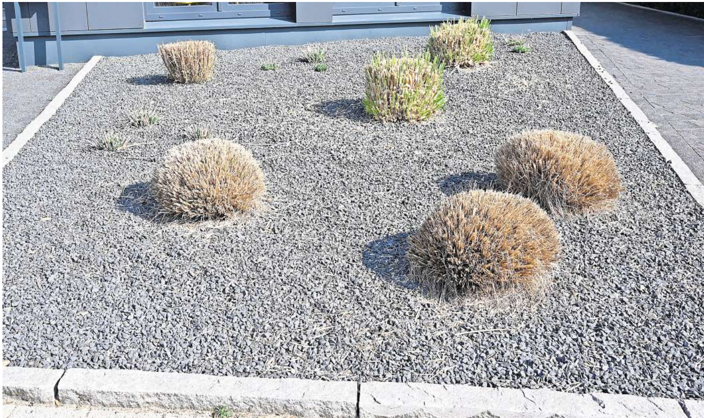
So soll es nicht aussehen: Pflanzen ragen aus einem Vorgarten mit grauen und schwarzen Kieselsteinen.

Stadt will gegen Schottergärten mit Informationen und Beratung vorgehen