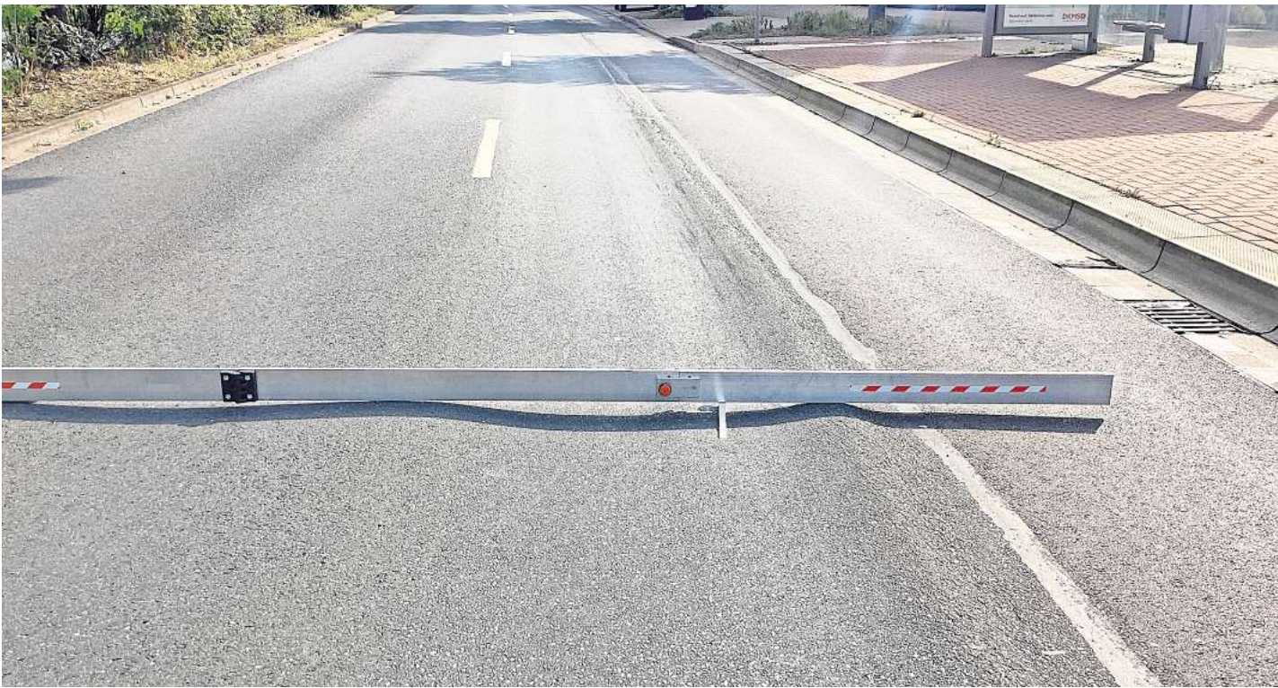
Der Richtsicht verdeutlicht die Schäden: tiefe Spurrillen auf der Godshorner Straße.

Der Bereich, der für rund 1,4 Millionen Euro saniert wird, erstreckt sich über 800 Meter von der Westfalenstraße bis direkt an die Stadtbahnleise am Langenforther Platz. Hinzu kommt der Abzweig bis zum Straßburger Platz am S-Bahnhof Langenhagen-Mitte. Die konkrete Planung hat rund eineinhalb Jahre in Anspruch genommen. Am Anfang werden Bautrupps die Rinnen, also die Randbereiche, sanieren. Danach werden die alte Fahrbahndecke abgefräst und der neue Asphalt eingebaut. Der letzte Arbeitsschritt umfasst dann nur noch Restarbeiten.