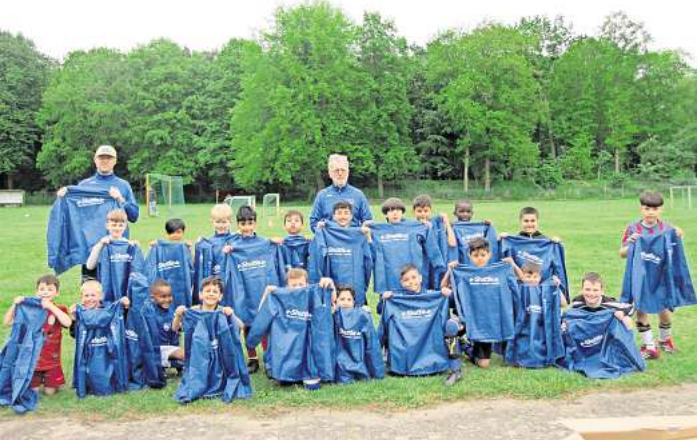
Das Team des SC Langenhagen ist jetzt gut ausgestattet.

Fußball: F-Junioren des SC Langenhagen freuen sich über neue Jacken