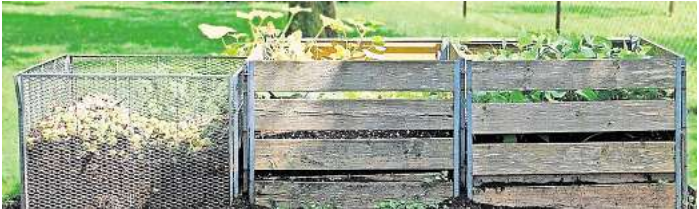
Ein Kompost verwandelt Abfälle in nährstoffreichen Humus.

fach und umweltschonend gelöst wird. Auch Erde und Mineräldünger werden überflüssig und müssen nicht mehr hinzugekauft werden. Wer beim Kompostieren ein paar simple Regeln beachtet, hat auch keine schlechten Gerüche zu befürchten. Wichtig ist die Wahl des Behälters und des Standortes. Der Untergrund muss aus Erde bestehen, damit „Kompostierer“ wie Regenwürmer und Kleinstlebewesen eindringen können, die die Abfälle in wertvollen Humus verwandeln. Doch nicht alle Abfälle eignen sich zum Kompostieren, deshalb muss man sich im Vorfeld schlau machen, was auf den Kompost darf und was nicht.