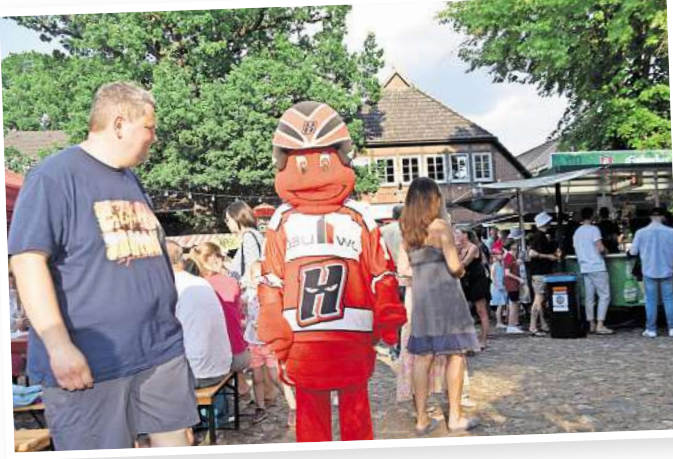
In den letzten Jahren war Maskottchen Scorpi immer ein regelmäßiger Gast beim Weinfest auf dem Amtshof. Das erfreut vor allem die Kinder.