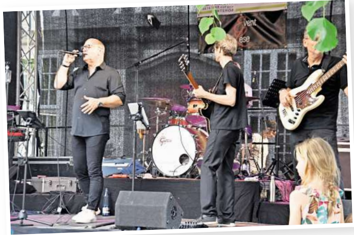
Life-Musik sorgt für die richtige Stimmung beim Wein- und Dorffest. Im vergangenen Jahr mischte die Band Searchin g für Hildegard das Publikum auf.