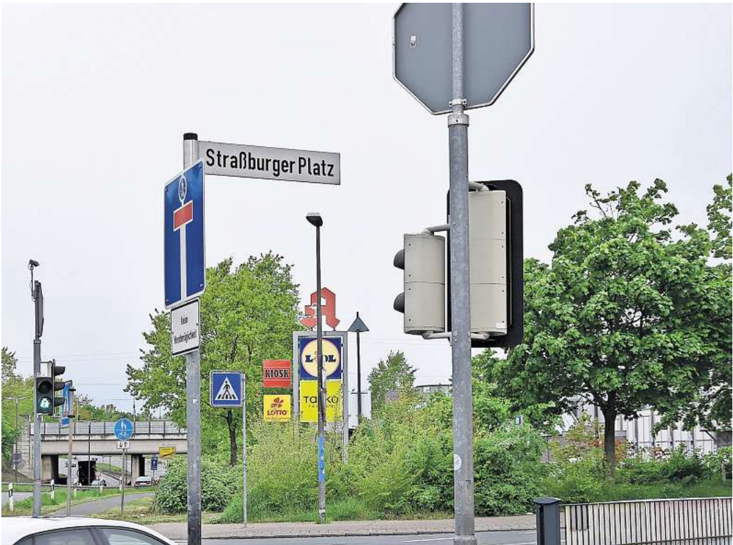
Wird auch gesperrt: der Abzweig zu den Geschäften am Straßburger Platz.