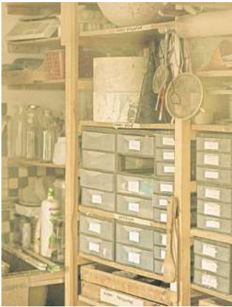
Regalsysteme und Aufbewahrungsboxen im Keller schaffen mehr Stauraum und schützen vor Staub.

wird entsorgt, anderes verkauft oder verschenkt. Alles andere soll im nächsten Schritt aufgeräumt und sortiert werden. Unterteilt man sein Keller-Gut zunächst in diese drei Bereiche, so gewinnt man einen ersten Überblick. Die zu entsorgenden Dinge können direkt in den Müll oder werden zum Recyclinghof gefahren. Dinge, die verkauft oder verschenkt werden sollen, können separiert und fotografiert werden. Sobald der Keller entrümpelt ist, sollte man sich genau umsehen. Alte Regale können neu angeordnet werden, um für Übersichtlichkeit und ideal genutzten Stauraum zu sorgen. Sofern man keine Regale hat und bisher alles