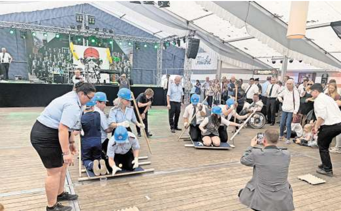
Die Feuerwehr setzte sich beim Battle im Festzelt gegen die Schützen durch.