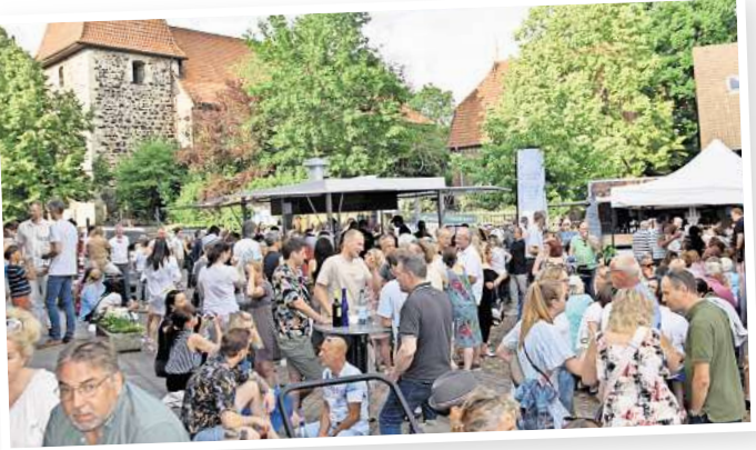
Das Ambiente auf dem Amtshof passt perfekt für ein Wein- und Dorffest mit der Kirche als Kulisse.