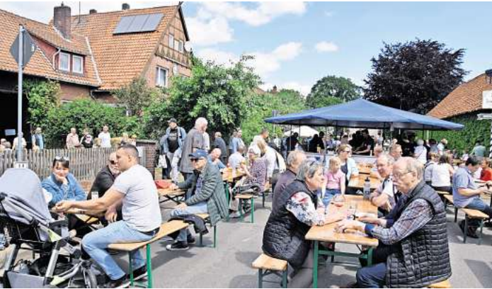
Die Wasserwerkstraße wird während des Spargelfestes zur Schlemmermeile im Ort.