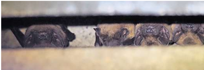
Auf dem Bild: Abendsegler in einem der vom NABU betreuten Fledermauskästen im Stadtwald.

LANGENHAGEN. Alljährlich bietet der NABU Langenhagen am letzten Sonnabend im Mai die beliebte Wanderung zu den heimischen Fledermäusen an. Im Zentrum Langenhagens liegt mit dem Stadtwald ein Naturjuwel, dessen sich nur wenige bewusst sind. Ein großer Bestand an alten Bäumen, insbesondere Buchen und der Übergang in die Wietzeau, führen zu einer großen Artenvielfalt. Die schonende Pflege und reichlich vorhandenes Totholz fördern Spechte, die mit den von ihnen gezimmerten Höhlen unter anderem auch Fledermäusen ein Quartier zur Verfügung stellen. Im schwindenden Licht werden die Teilnehmer zu Quartieren im Stadtwald