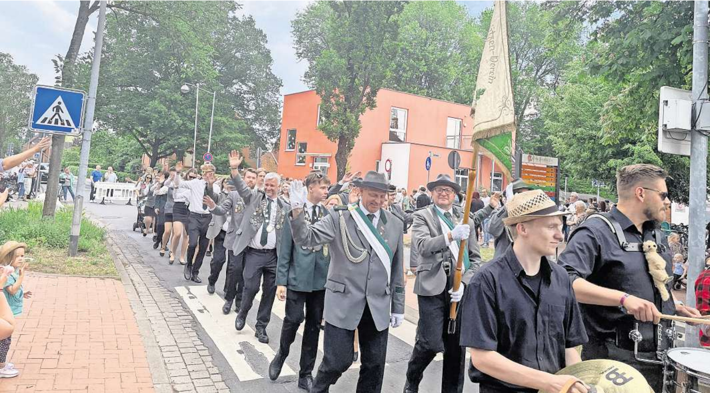
Ein langer Schützenausmarsch zog durch Kaltenweide.

Schützenverein Kaltenweide steht für Verlässlichkeit und gute Stimmung