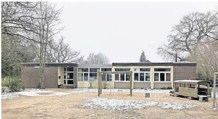
Bis auf Weiteres nicht nutzbar: die Kita Zum Guten Hirten.

In drastischen Worten schilderte eine Elternvertreterin in der jüngsten Ratssitzung, was die sofortige Schließung der Kita damals in den Familien ausgelöst hatte. Bis die Kinder zur Betreuung auf unterschiedliche Standorte aufgeteilt wurden, hätten die meisten Eltern den Betreuungsausfall wochenlang selbst kompensieren müssen, so die Mutter. Viele hätten ungeplant Urlaub nehmen müssen, andere hätten durch die berufliche und private Doppelbelastung „am Burnout gekratzt“. Eindringlich bat die Mutter die Stadtverwaltung, im weiteren Verlauf für „reibungslose Übergänge“ zu sorgen. Doch wie groß ist der Schaden an der Kita genau? Fest steht bislang nur, dass das Dach in jedem Fall saniert werden muss-