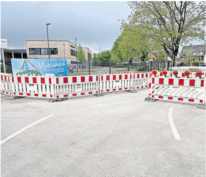
Die Bauarbeiten am Stadtweg dauern noch etwa bis Mitte Mai.

Aus Sicht der Stadtverwaltung gibt es allerdings keine sinnvolle Alternative zur Schulstraße. Ralph Gureck, Leiter für Marketing und Kommunikation: „Im Süden verläuft nur die Langenhagener Straße (L382), die einen erheblichen Umweg nach sich ziehen würde.“ Und die Kirchstraße nördlich der Schulstraße komme auch nicht infrage, denn auch dort stehen aktuell Arbeiten an, weil ein Schmutzwasserkanal abgesackt ist.