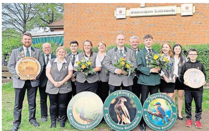
Die Kaltenweider Würdenträger des Jahres 2024.

Die diesjährige Route führt über folgende Straßen: Zellerie, Kananhoher Straße, Am Osterberg, Wohldamm, Am Brambusch, Kananhoher Straße, Am Weiherfeld, Am Haselbusch, Mühlenweg, Zellerie