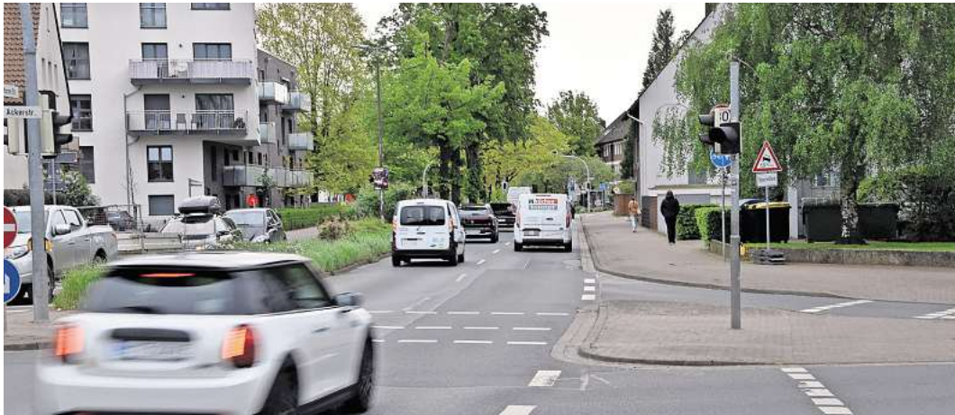
Wird wegen Sanierungsarbeiten zum Nadelöhr: Godshorner Straße in Langenhagen.