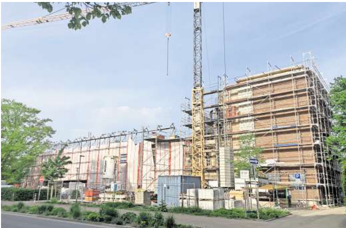
Seit Jahren eine Großbaustelle: die Adolf-Reichwein-Grundschule in Langenhagen-Wiesenau.

Mit seinen Worten reagierte der Bürgermeister auf ebenfalls klar formulierte Kritik an den Bauverzögerungen an der Grundschule. Elternvertreterinnen forderten transparente Aussagen dazu, wo ihre Kinder im nächsten Schuljahr unterrichtet werden: „Sprechen Sie Klartext mit uns!“ Klartext hatte im Vorfeld