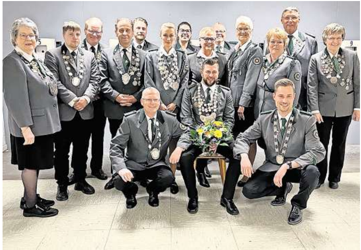
Die Würdenträger 2024 des Schützenvereins Brink und der Schützengesellschaft Langenhagen 08.