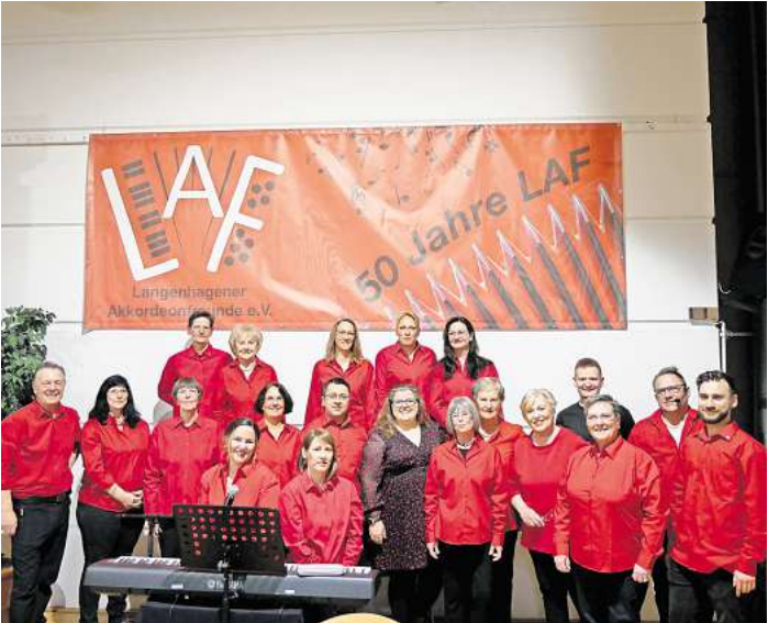
Der Verein wurde beim Jubiläumskonzert mit Urkunde und Medaille geehrt.

Die Langenhagener Akkordeonfreunde bieten Musik und Spaß für Jung und Alt, von der ältesten Spielerin im Orchester „Vive l’Accordéon“ mit 85 Jahren bis hin zu den ganz Kleinen in der Musikalischen Früherziehung, die sich an großer Beliebtheit erfreut. Wer mitmachen möchte ist herzlich eingeladen. Zu sehen und hören sind die Langenhagener Akkordeonfreunde am 8. Juni zum Internationalen Kinderfest der Elisabethkirche und am 8. September am Musikfest im Rathaus Innenhof.