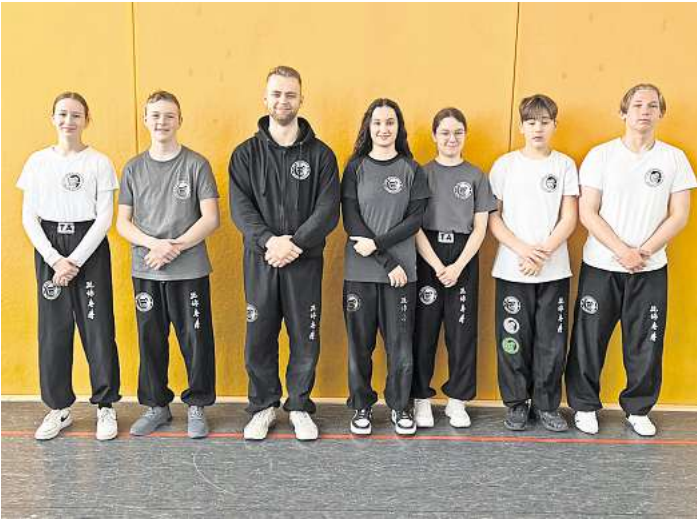
Gewaltprävention stand im Mittelpunkt der Projektwoche.

„Ich habe gelernt, wie ich mich verteidigen kann und fühle mich jetzt viel sicherer.“ Ein besonderes Highlight war der „Zukunftstag“, an dem fünf Schüler vom TA WingTsun ihre Zeit investierten, um den jungen Teilnehmern zur Seite zu stehen. Dies unterstreicht nicht nur das Engagement der Schüler, sondern auch den gemeinschaftlichen Ansatz der Kampfkunstschule.