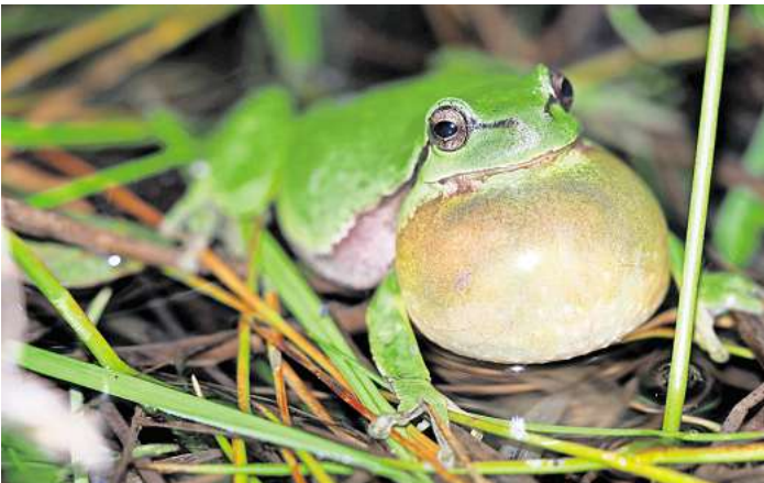
Ruft beeindruckend laut: der Laubfrosch.

Termin: Sonnabend, 4. Mai, 21 bis 23 Uhr; Treffpunkt: Parkplatz Kananhofer Forst, gegenüber Ein- mündung Hasenheide.