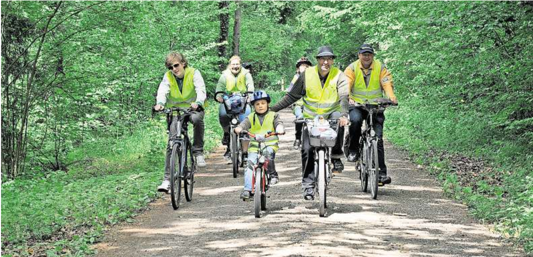
Am 5. Mai wird in Langenhagen wieder fleißig geradelt.

Zu den Stationen im Einzelnen: Beim DJK Sparta Langenhagen an der Emil-Berliner-Straße 40 haben die Radfahrer unter anderem die Gelegenheit, eine Runde