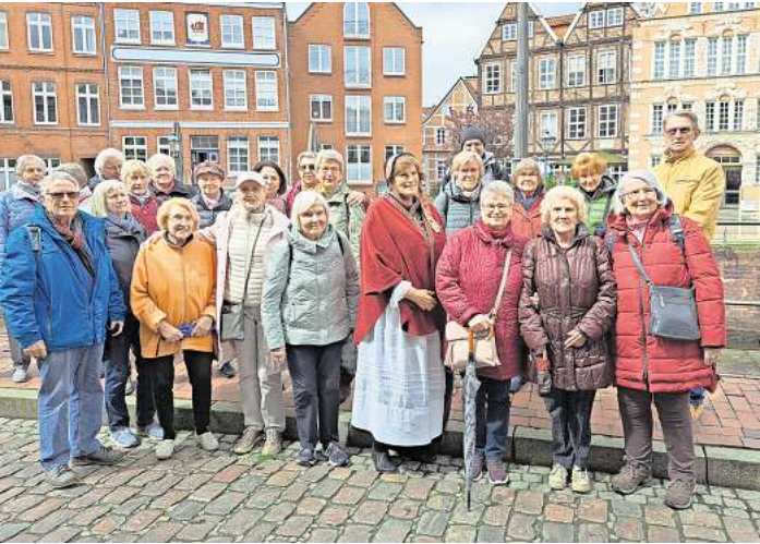
Für die Lanhagener Gäste stand eine Führung durch die wunderschöne Altstadt.

den tollen Giebelzieren bewundert werden. Selbstverständlich gab es einen Abstecher an die Elbe, einen kurzen Spaziergang durch Jork sowie den Besuch eines Obsthofes, bevor es wieder nach Hause ging. Trotz der kühlen Temperaturen war es ein schöner und erlebnisreicher Tag. Die nächste Fahrt geht am 5. Juni nach Münster. Hierfür werden bereits Anmeldungen von Monika Weidling (Telefon 0511/7 69 16 01) entgegen genommen.