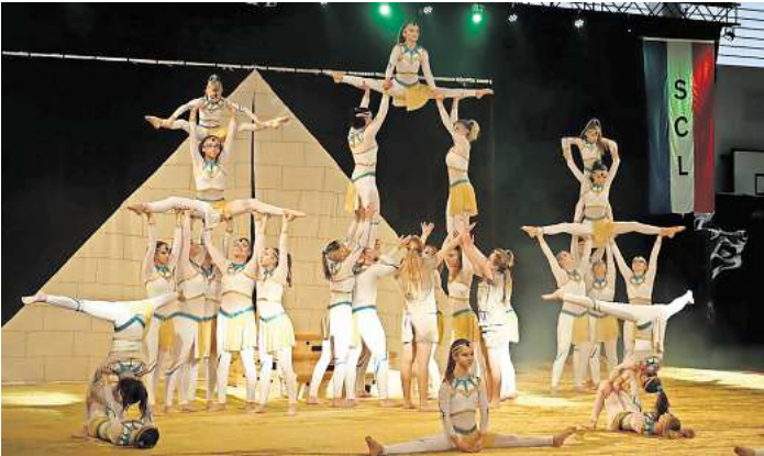
Präsentieren Choreographien des vorigen Jahrzehnts: die Flying Sparcles.

Ihr habt noch nichts vor an dem Tag? Karten für das Event gibt es unter www.flying-sparkles.de . Showbeginn ist um 17 Uhr im Theatersaal Langenhagen.