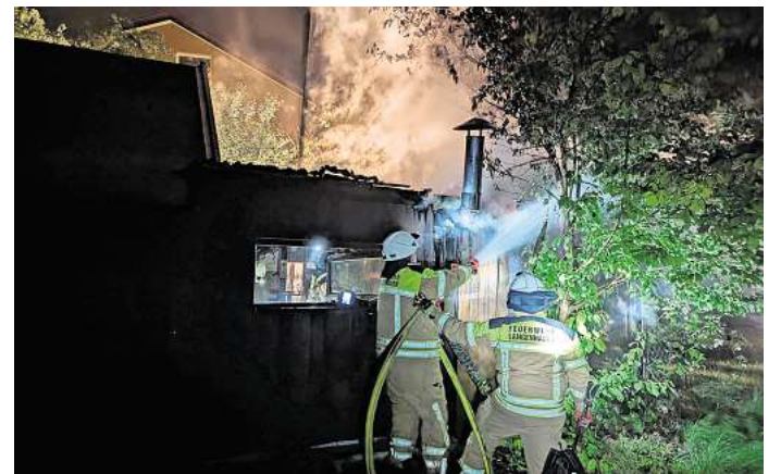
800 Liter waren zum Löschen notwendig.

KALTENWEIDE. Die Feuerwehr Kaltenweide wurde am Sonnabendmorgen um 0.14 Uhr zu einem gemeldeten Laubenbrand in den Ernst-Hugo-Weg alarmiert. Der Besitzer bemerkte eine Rauchentwicklung und Flammenschein in seiner Laube. Vor Ort informierte er die eintreffenden Einsatzkräfte, das er bereits erste Lösversuche unternommen hat. Durch die Feuerwehr wurde ein Trupp unter Atemschutz mit einem C-Rohr und 800 Liter Wasser eingesetzt. Im Einsatzverlauf musste Wandverkleidung geöffnet werden, um dahinterliegende Glutnester ablöschen zu können. Abschließend wurde die Brandstelle mittels Wärmebildkamera kontrolliert. Unter der Einsatzleitung des stellvertretenden Ortsbrandmeister Florian Köpke waren 15