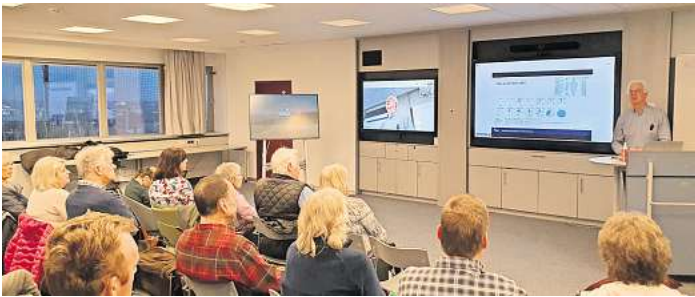
Die NVL war zu Besuch an der Leibniz Universität Hannover.

Die Führung durch den Brockengarten übernimmt eine Diplom-Ingenieurin für Naturschutz und Landschaftsplanung im Nationalpark Oberharz. Der Brockengarten schützt und bewahrt vom Aussterben bedrohte und sehr seltene Pflanzen. Die Kosten für die Brockenbahn-