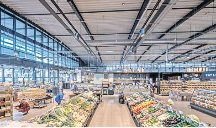
Der moderne Neubau überzeugte die Jury.