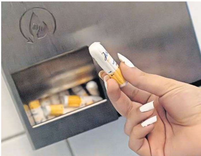
Bald gibt es Tampons kostenlos aus dem Automaten.