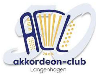
Der ACL wird 50: das Jubiläumslogo.

Ein weiterer Grund zur Freude war die Präsentation des neuen Vereinslogos, das speziell für das Jubiläumsjahr mit einer markanten „50“ im Hintergrund erweitert wurde. Dieses Symbol steht nicht nur für die lange Geschichte des Vereins, sondern auch für seine kontinuierliche Weiterent-