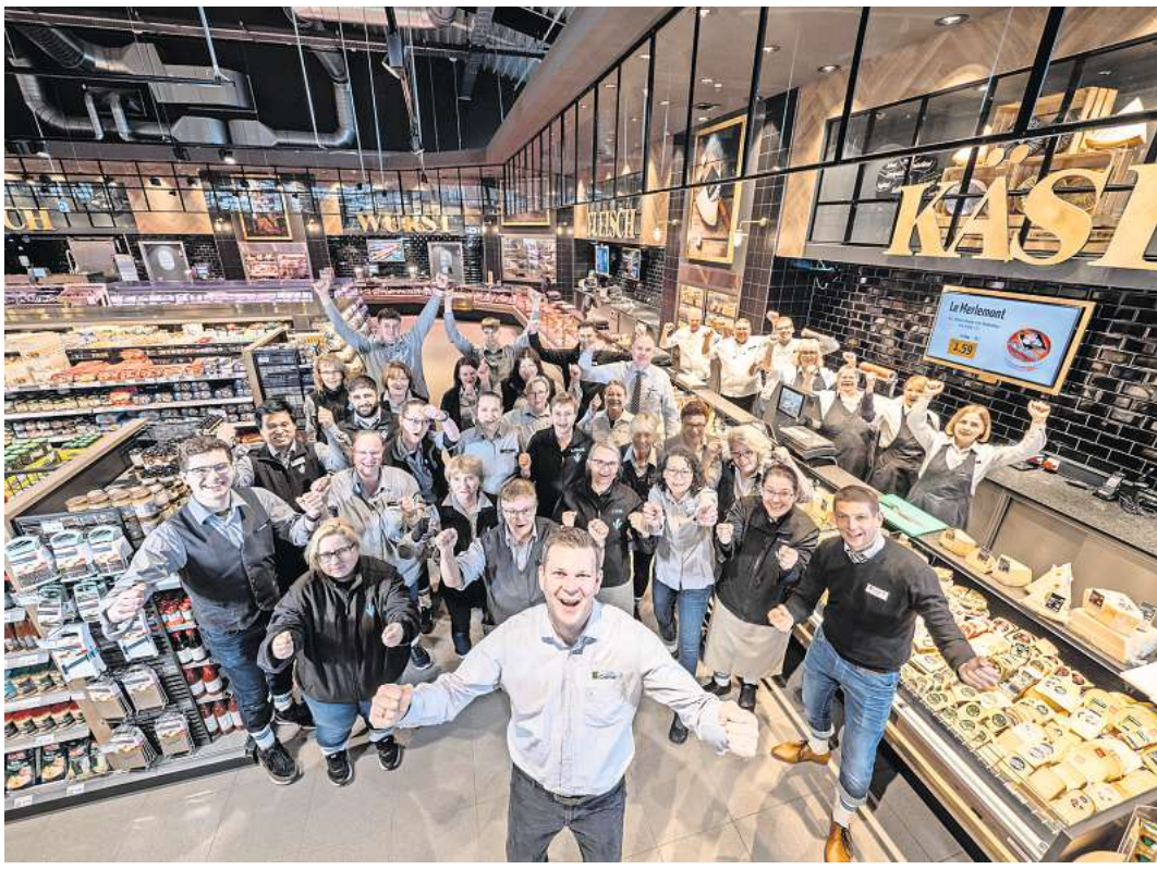
Ein Team der Möglichmacher: die Mitarbeiterinnen und Mitarbeiter des EDEKA Centers Cramer an der Walsroder Straße.

Im EDEKA Center Cramer in Langenhagen zeigte sich die Jury beeindruckt von dem modernen Neubau, der auf 2.800 Quadratmetern Verkaufsfläche dank hoher Decke und Fenstern an Front und Seiten ein angenehmes Ambiente schafft. Dazu tragen auch die großzügigen Gänge bei. Die Sortimentsbreite und -tiefe mit rund 45.000 Artikeln lassen kaum Wünsche offen. Regionale Produkte, wie Eier, Honig oder Spargel, sind ebenso fester Bestandteil des Angebotes wie Spezialitäten für Feinschmecker, wie Kaviar und Trüffel. An den Bedientheken ist Hausgemachtes