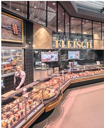
Die hausgemachten Spezialitäten begeistern bei Cramer.

EDEKA Center kaum ein Wunsch offen. Den exklusiven Kaviar organisiert das Team dabei genauso schnell wie mehrere Kilogramm Tomatensalat oder die Wurstplatte für die nächste Feier. „Als bester Supermarkt Deutschlands ausgezeichnet zu sein, ist für unser Team eine echte Anerkennung und zeigt, dass sich der Einsatz unserer Mitarbei-