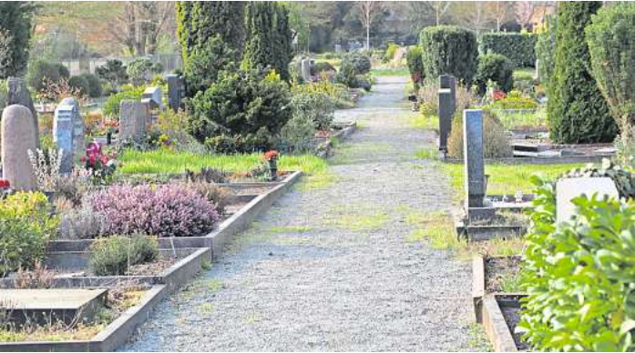
Treffpunkt ist am 5. Mai, um 14 Uhr am Eingang des Friedhofs an der Straße „Alt-Engelbostel“.