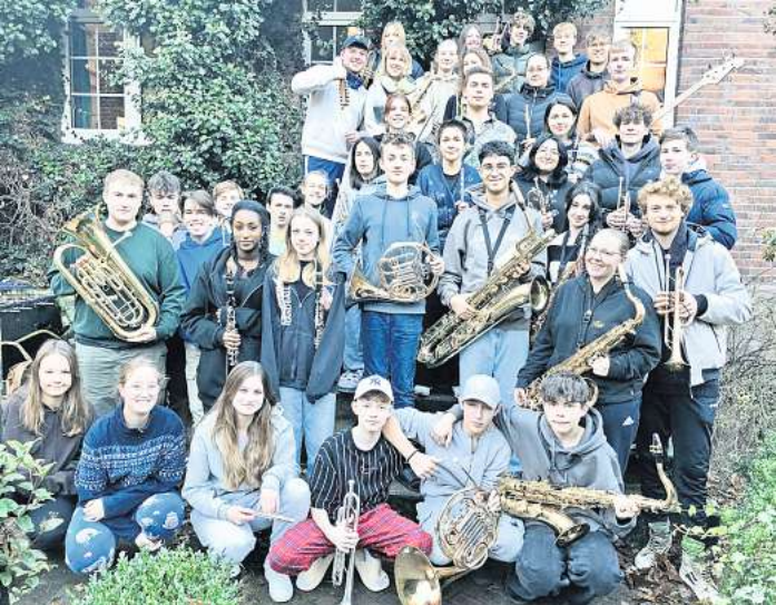
Das Jugendblasorchester ist bei dem Konzert auch mit von der Partie.

genug: Der 42-Jährige stieg aus dem Auto aus und näherte sich dem Fußgänger. Kurz darauf, so die Polizei weiter, schlugen beide Männer aufeinander ein und stürzten kämpfend zu Boden. „Erst die Beifahrer konnten die beiden streitsüchtigen Personen trennen“, so der Polizeisprecher. Bei den Streitschlichtern handelte es sich um zwei 28 und 49 Jahre alte Männer. Für den 51 Jahre alten Fußgänger war die Schlägerei folgenreich: Er erlitt eine Platzwunde am Kopf, etliche Prellungen und verlor zudem eine Zahnprothese. Die Polizei leitete gegen beide Männer Strafverfahren ein.