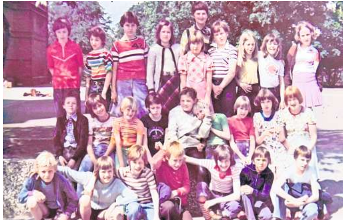
Vor 47 Jahren: das Klassenfoto der damaligen 4g.