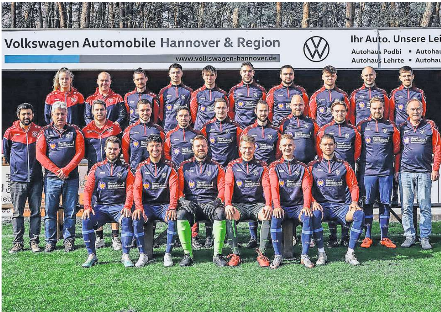
Die erfolgreiche dritte Herren des TSV Krähenwinkel/Kaltenweide.