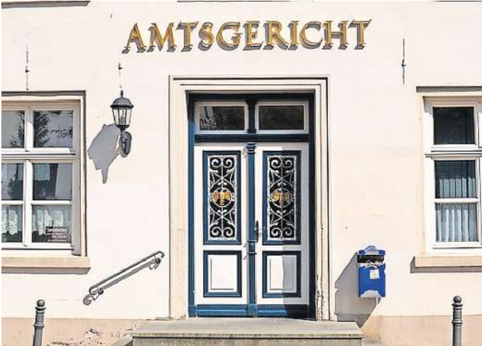
Nachlassgerichte sind grundsätzlich in Amtsgerichten zu finden.

überlegen, ob das Erbe wirklich ausgeschlagen werden will. Weiß man hingegen um Schulden des oder der Verstorbenen, kann die Erbausschlagung sehr sinnvoll sein. Eine Alternative stellt eine Nachlassinsolvenz dar. Durch eine Nachlassinsolvenz können sich Erben davor schützen, mit ihrem eigenen Vermögen für Kredite oder andere finanzielle Verbindlichkeiten des Verstorbenen zu haften. Im Zweifel sollte man in solchen Nachlassangelegenheiten immer einen Fachanwalt konsultieren. Dieser gibt hilfreiche Tipps und professionelle Unterstützung. LPS/AM.