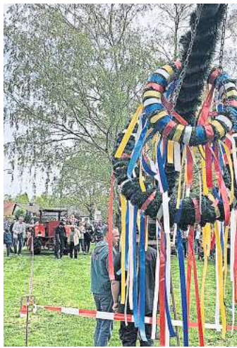
Auch in Kaltenweide wird ein Maibaum errichtet.

In Verbindung mit zwei historischen Treckern als Gegenlager wird der Maibaum mit zwei Greifzügen unter musikalischer Begleitung des Young Spirit Orchestra des Schützenvereins Kaltenweide ganz langsam von der Waagerechten in die Senkrechte gezogen. Die Veranstaltung startet ab 11 Uhr. Für das leibliche Wohl in Form von kalten Getränken, Kaffee, Kuchen und Wein sowie einer Grillbude ist gesorgt. Der Trecker-Club hofft auf gutes Wetter und freut sich über zahlreiche Gäste aus Nah und Fern. Das Maibaumfest in Engel-