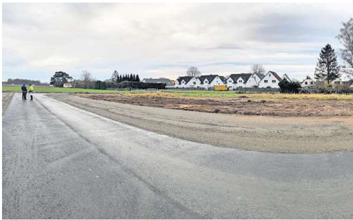
Ist etwa 85 Meter lang: die neue Dieter-Liedtke Straße in Godshorn.

Lars Hecht: „Wir planen hier auf 1900 Quadratmetern ein Mehrfamilienhaus mit 17 bis 18 Wohnungen, vergleichbar mit unserem Bau am Elbeweg.“ Vermietet wird ausschließlich an Bezieher eines sogenannten Berechtigungsscheines (B-Schein). Der Mix der Wohnungen reicht von Ein- bis Fünfstückwohnungen. „50 Prozent werden aber Ein- bis Zweifamilienwohnungen sein“, sagt Hecht. Die Mischung spiegelt in etwa die Nachfrage an Sozialwohnungen bei der Stadt Langenhagen wider. Vorgesehen seien drei Vollgeschosse. „Die Höhe wird die Nachbarn auch vor Lärm aus Richtung der Langenhagener Straße schützen.“