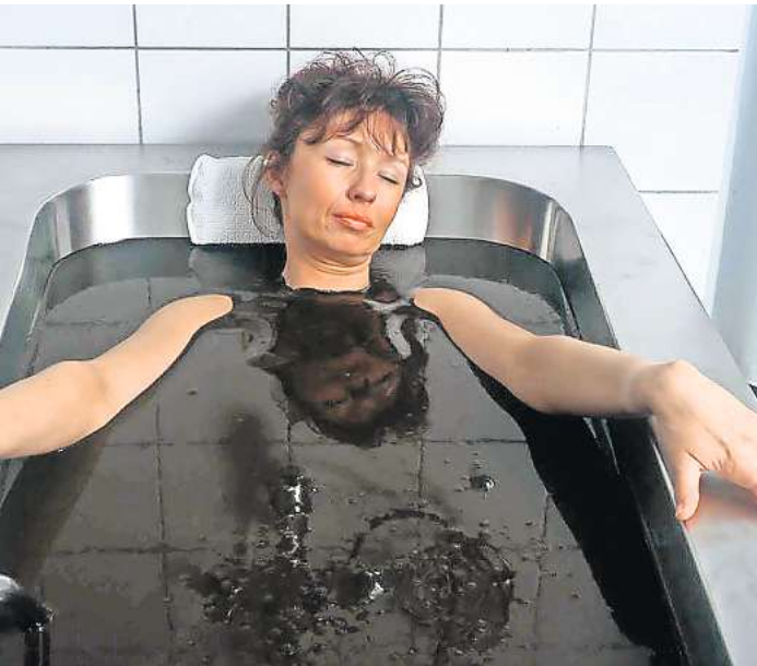
Moorbäder: Sie werden als Überwärmungsbäder eingesetzt und bedingen daher eine belastbare Herz-Kreislauf-Funktion.

mengt und mit Wärme kombiniert. Ähnlich wie bei einem Fieber steigt die Körpertemperatur je nach Anwendung auf achtunddreißig bis vierzig Grad Celsius. Mediziner raten dazu, vor der Anwendung die Rücksprache mit dem Hausarzt zu suchen. So sind die Behandlungen beispielsweise nur für Rheumapatienten ohne akute Entzündungen im Körper empfehlenswert. Patienten mit einem Rheuma-Schub, Tumor, mit aktivierter Arthrose oder Herz-Kreislauf-Erkrankungen sollten gemäß dem Berufsverband Deutscher Internistinnen und Internisten die Wärmebehandlung nicht in Anspruch nehmen. Im Rahmen eines Reha-Aufenthaltes oder einer Wellness-Kur in einem Moorheilbad können Moorbäder nach medizinischer Abklärung vollumfänglich genossen werden