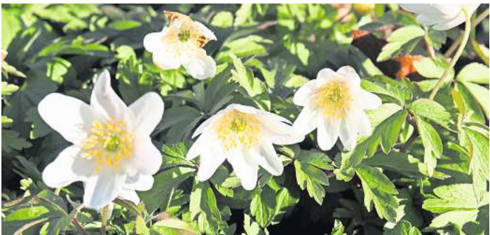
Der Nabu macht sich auf die Suche nach Frühblühern.

ten berichten. Außerdem sehen wir, wie sich der Wald, vom Menschen weitgehend ungestört und nicht mehr genutzt, in einer Naturwaldparzelle entwickeln kann und langsam wieder zum „Urwald“ wird. Bitte an wetterfeste Kleidung und Regenschutz denken. Die Länge der Exkursionsstrecke wird etwa zwei bis drei Kilometer betragen. Termin: Sonntag, 21. April, zwischen 14 und 17 Uhr. Veranstaltungsort: Haltestelle „Hannover Stadtfriedhof Ricklingen“, Buslinien 300 / 363 / 360. Der Vortrag wird kostenlos angeboten, über eine Spende für den Naturschutz würde sich der Nabu sehr freuen.