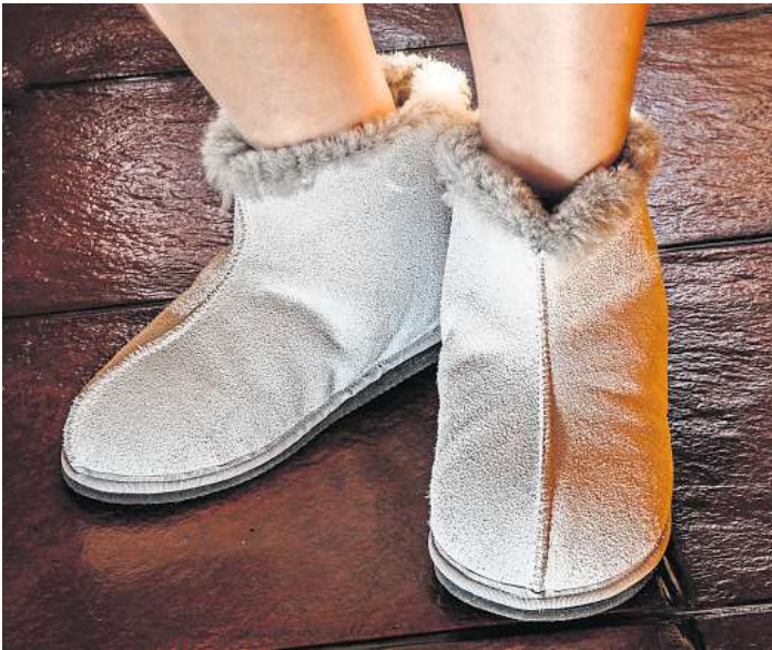
Wärmende Hausschuhe sind für kälteempfindliche Füße optimal.

Kalte Füße sind nicht nur unangenehm, sie können zudem das Erkältungsrisiko erhöhen. Bei niedrigen Temperaturen bemüht sich der Organismus die Kerntemperatur im Gehirn, Brust- und Bauchbereich konstant zu halten, um die lebenswichtige Versorgung der Organe zu gewährleisten. Eine mögliche Folge davon können kalte Füße und Hände sein, weil die Durchblutung zu den Extremitäten verringert wird. Menschen, die im Winter aufgrund der aktuellen Energiekrise und der höheren Verbrauchspreise an den Heizkosten sparen wollen, sollten auf warme Füße achten. Dicke Wollsocken und kuschelige Hausschuhe schenken kälteempfindlichen Füßen Geborgenheit. Allerdings dürfen sie nicht zu eng am Fuß sitzen, da sonst der Wärmeaus-