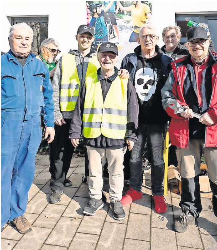
Von den „Quartiersschraubern“ gibt es tatkräftige Unterstützung.

Die Fahrradwerkstatt „Quartiersschrauber Wiesenau“ wird gefördert aus dem Sparkassenbrief N+.“ Eine Anmeldung ist nicht erforderlich. Die Veranstaltung findet auf dem Quartiersplatz Wiesenau, Freiligrathstraße 11, in Langenhagen statt.