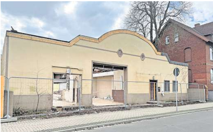
Die ehemalige Moschee an der Bahnhofstraße: Die DITIB-Gemeinde ist 2019 an die Karl-Kellner-Straße in ein neues Gebäude umgezogen.