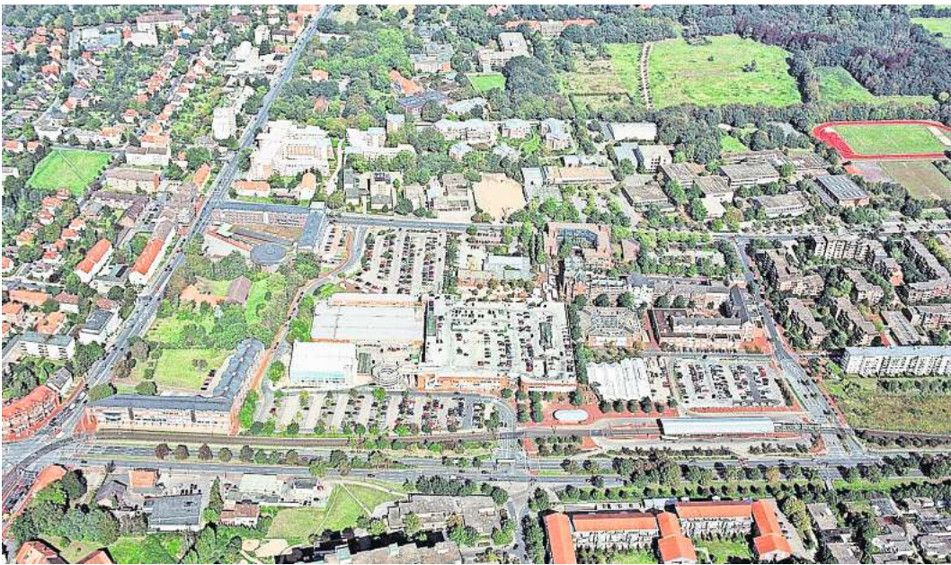
Ideen gesucht: Wie soll das Langenhagener Stadtzentrum sich in den nächsten Jahren entwickeln?, fragt die Verwaltung und startet dazu ein großes Beteiligungsverfahren.

An insgesamt 27 Themenstationen wird die Entwicklung Langenhagens in den vergangenen 65 Jahren in Text und Bild dokumentiert. Dazu gehören ein Rückblick auf die Verleihung des Stadttitels, aber auch auf andere wichtige Ereignisse wie die Gemeindegebietsreform 1974 und die Entwicklung des Stadtzentrums. Auch kreative Protestaktionen wie die Grenzbegehung