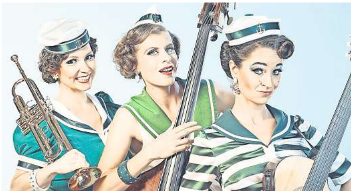
Begeistern dreistimmig singend: die Zucchini Sistaz.